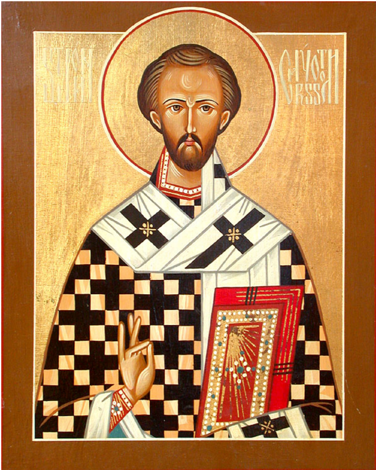
Άγιος Ιωάννης ο Χρυσόστομος