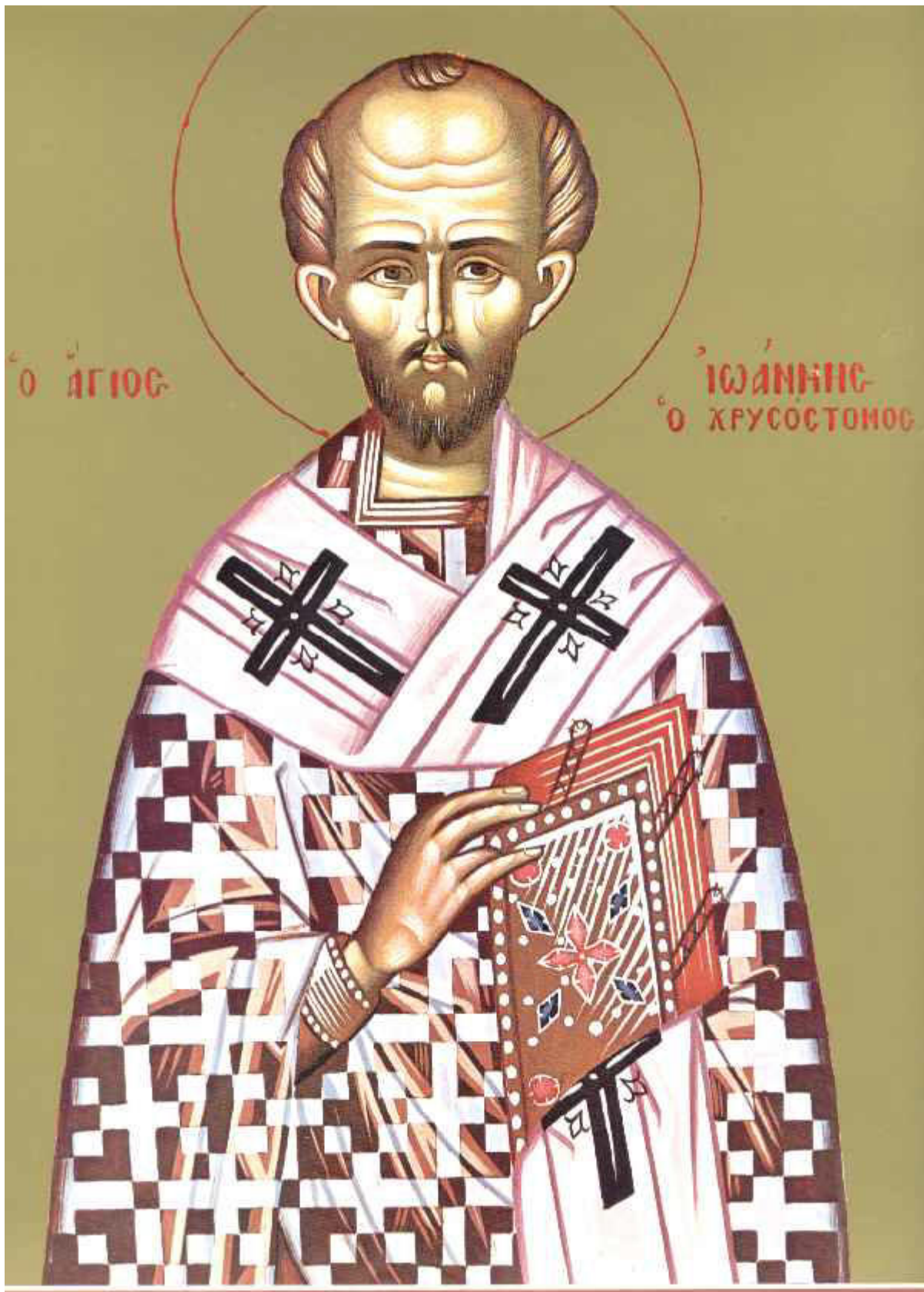
Άγιος Ιωάννης ο Χρυσόστομος