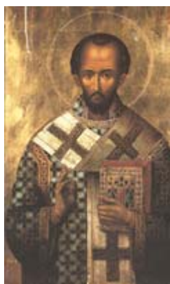
Άγιος Ιωάννης ο Χρυσόστομος