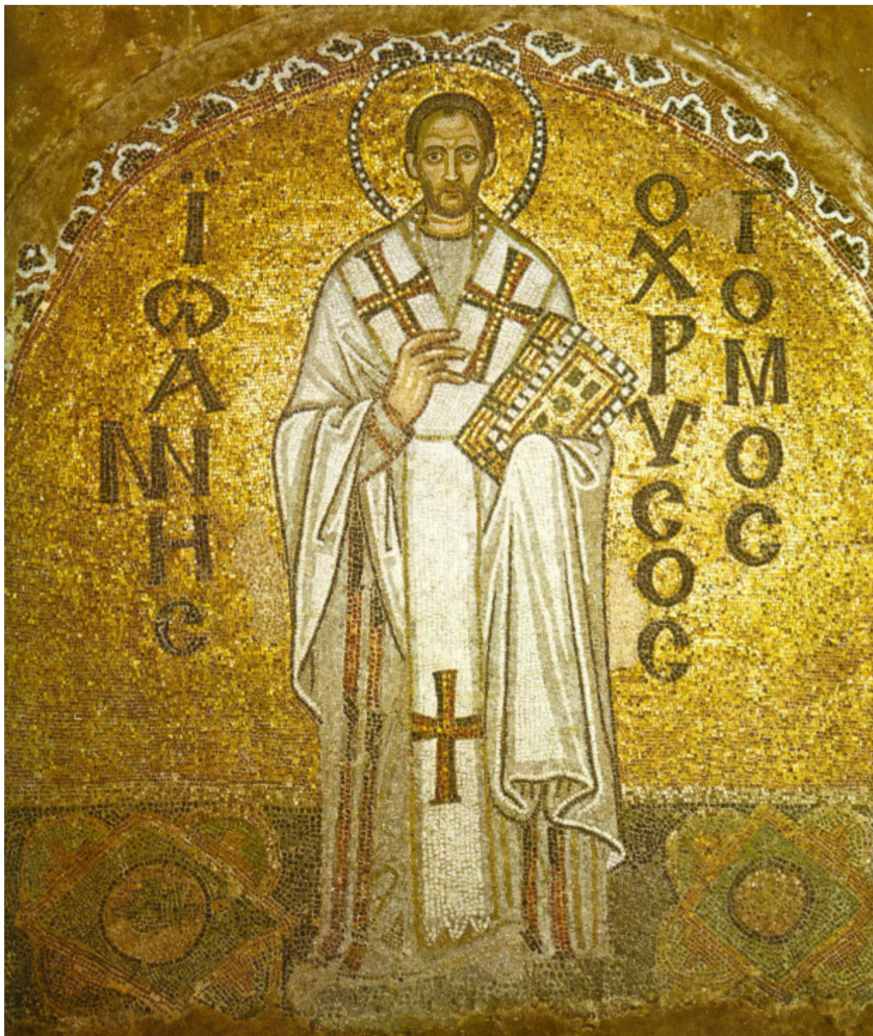
Άγιος Ιωάννης ο Χρυσόστομος