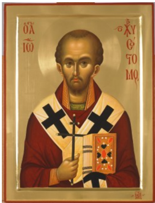
Άγιος Ιωάννης ο Χρυσόστομος - Εικόνα από το Αγιογραφείο της Μονής Βατοπαιδίου