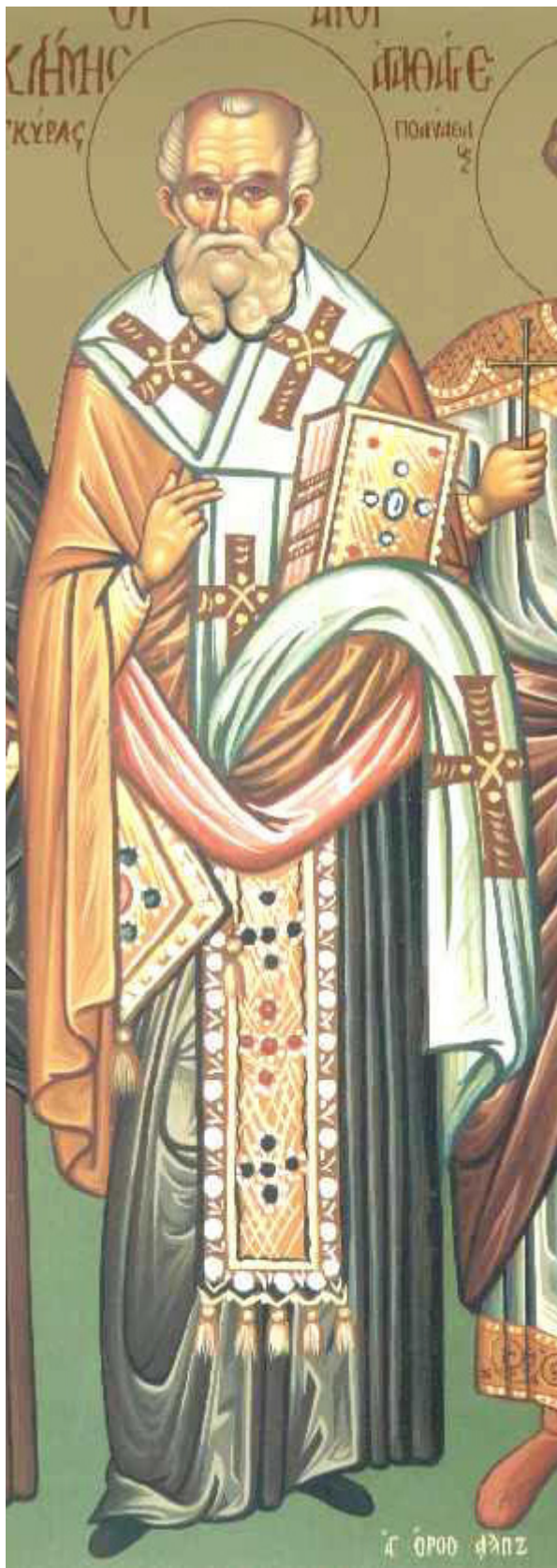
Άγιος Κλήμης Επίσκοπος Αγκύρας