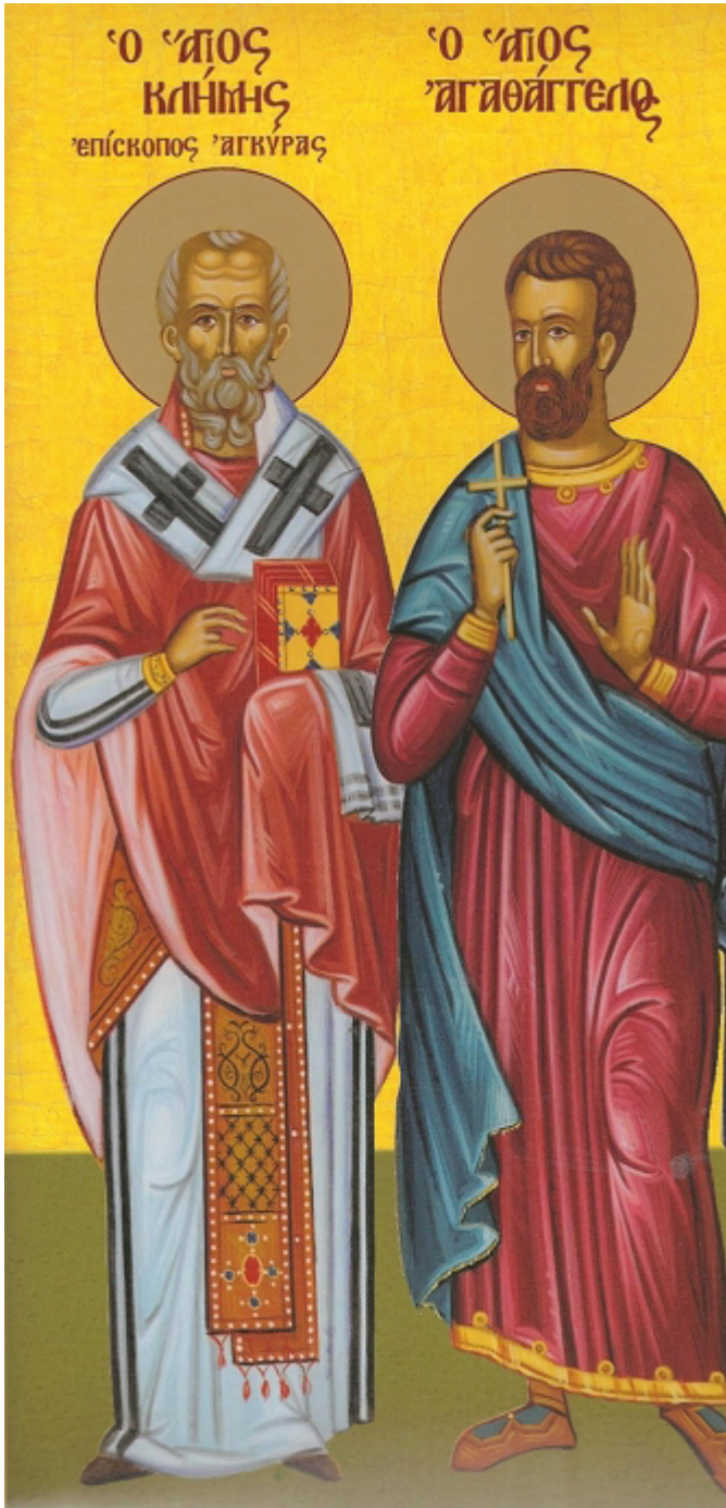
Άγιοι Κλήμης Επίσκοπος Αγκύρας και Αγαθάγγελος

Ορθοδοξία και Ορθοπραξία / Συναξαριακές Μορφές