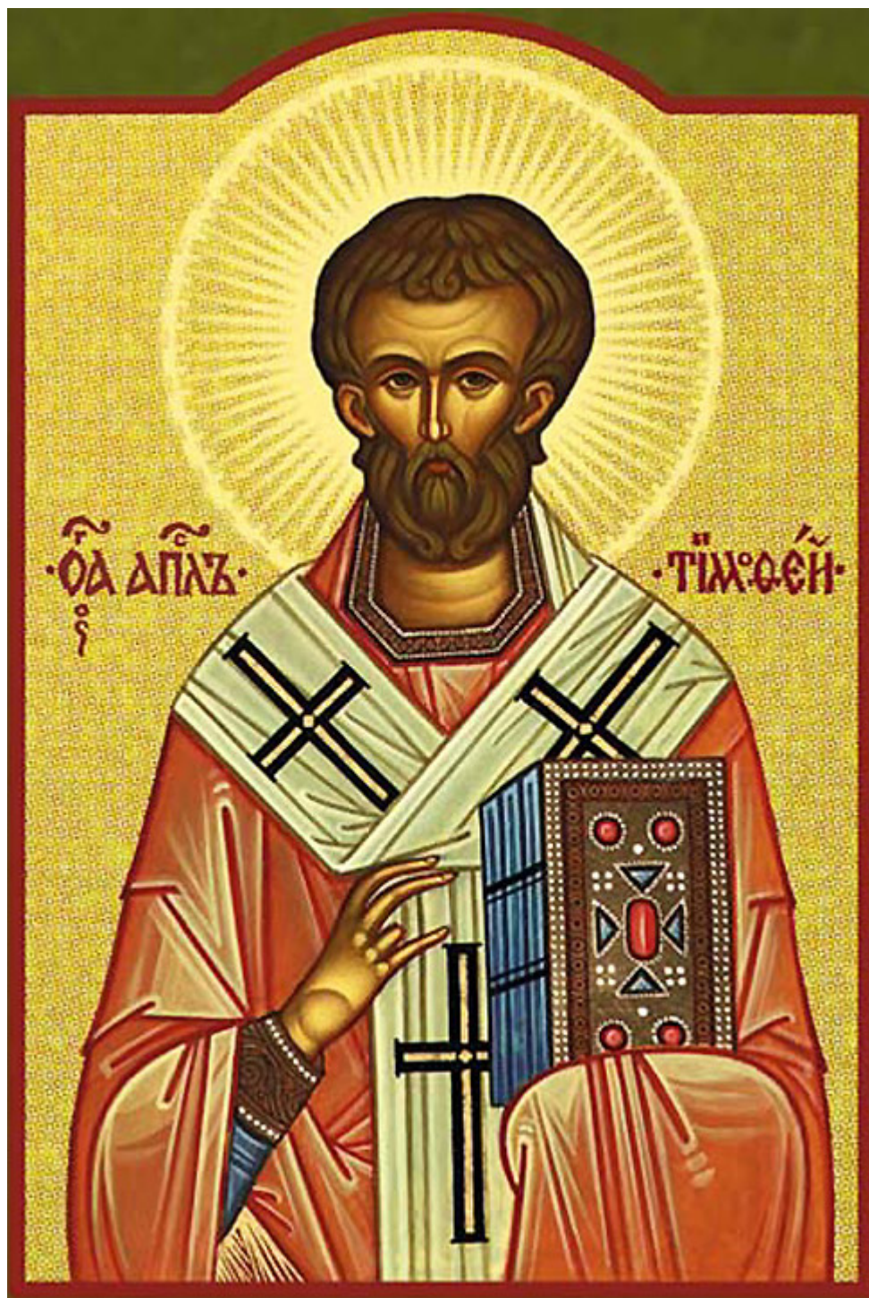
Άγιος Τιμόθεος ο Απόστολος

Ορθοδοξία και Ορθοπραξία / Συναξαριακές Μορφές