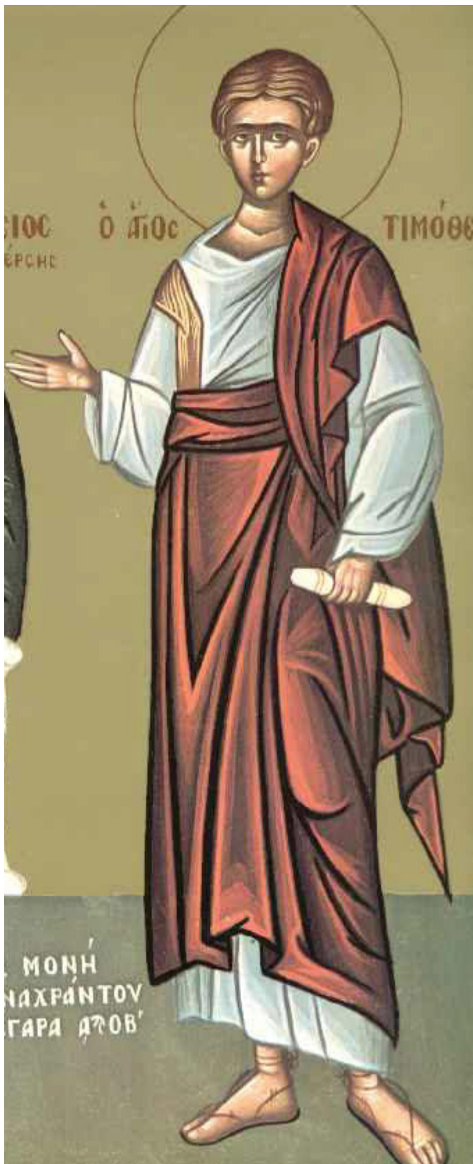
Άγιος Τιμόθεος ο Απόστολος