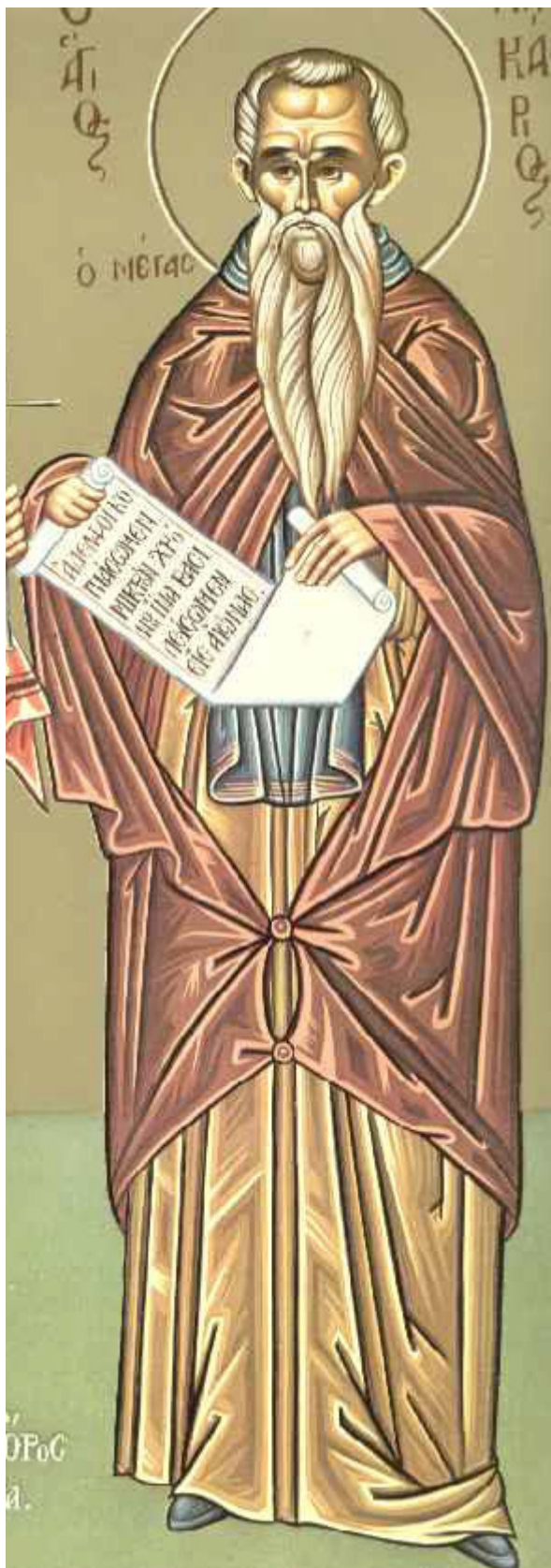
Όσιος Μακάριος ο Αιγύπτιος