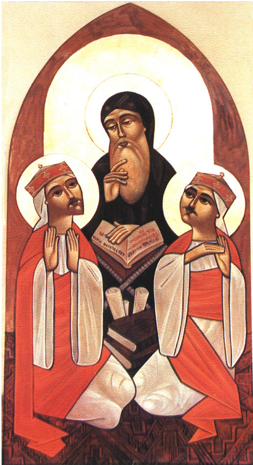
Όσιος Μακάριος ο Αιγύπτιος