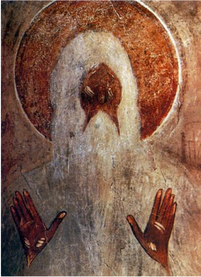
Όσιος Μακάριος ο Αιγύπτιος