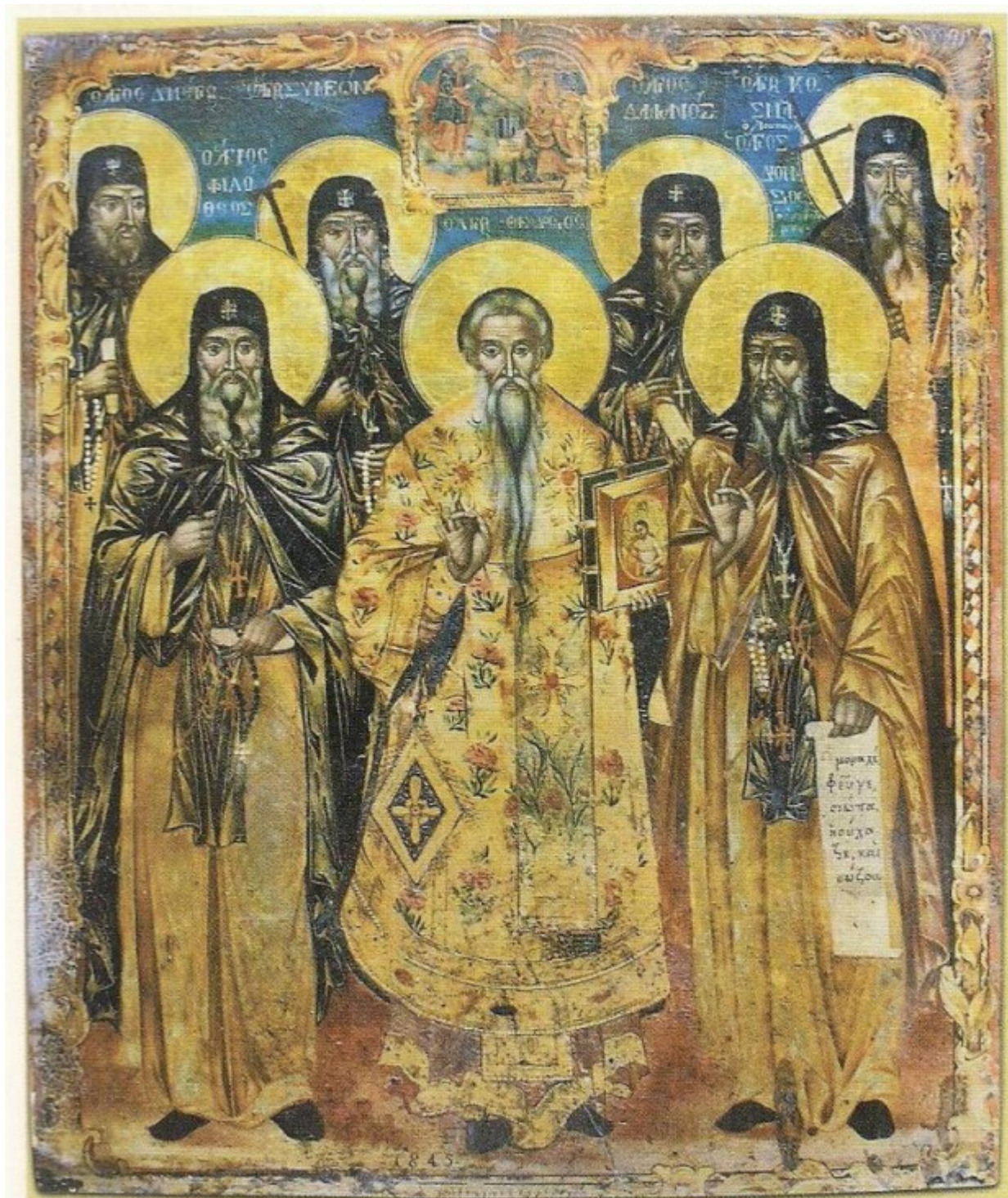
Οί ὄσιοι τῆς Ἱ. Μ. Φιλοθέου. Φορητὴ εἰκόνα Ἱ. Μ. Φιλοθέου (1845).

Ορθοδοξία και Ορθοπραξία / Συναξαριακές Μορφές