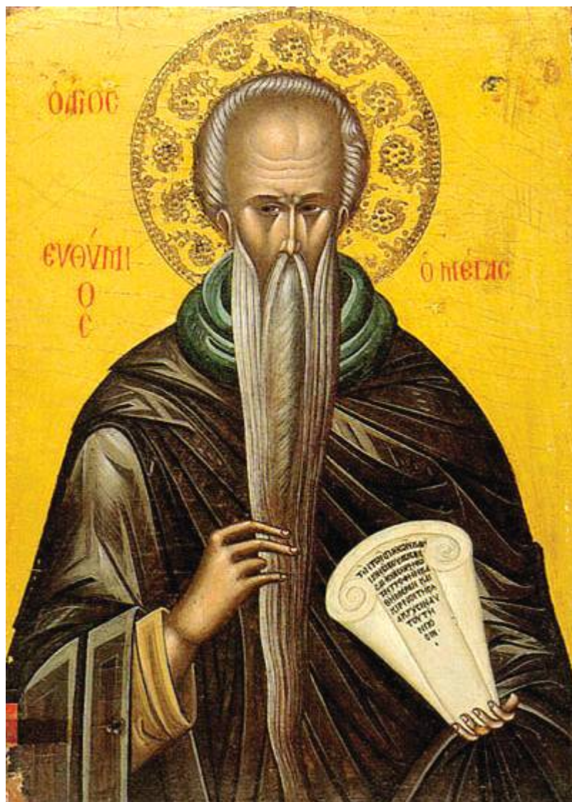
Όσιος Ευθύμιος ο Μέγας

Ορθοδοξία και Ορθοπραξία / Συναξαριακές Μορφές