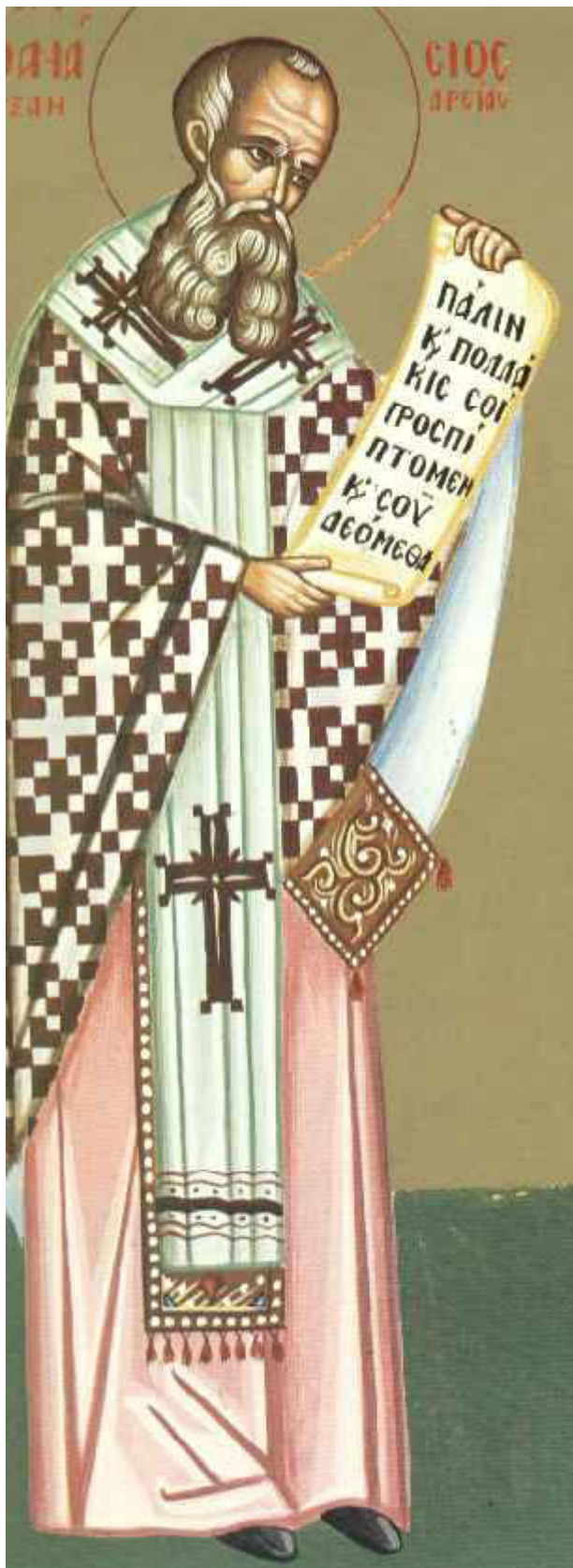
Άγιος Αθανάσιος ο Μέγας