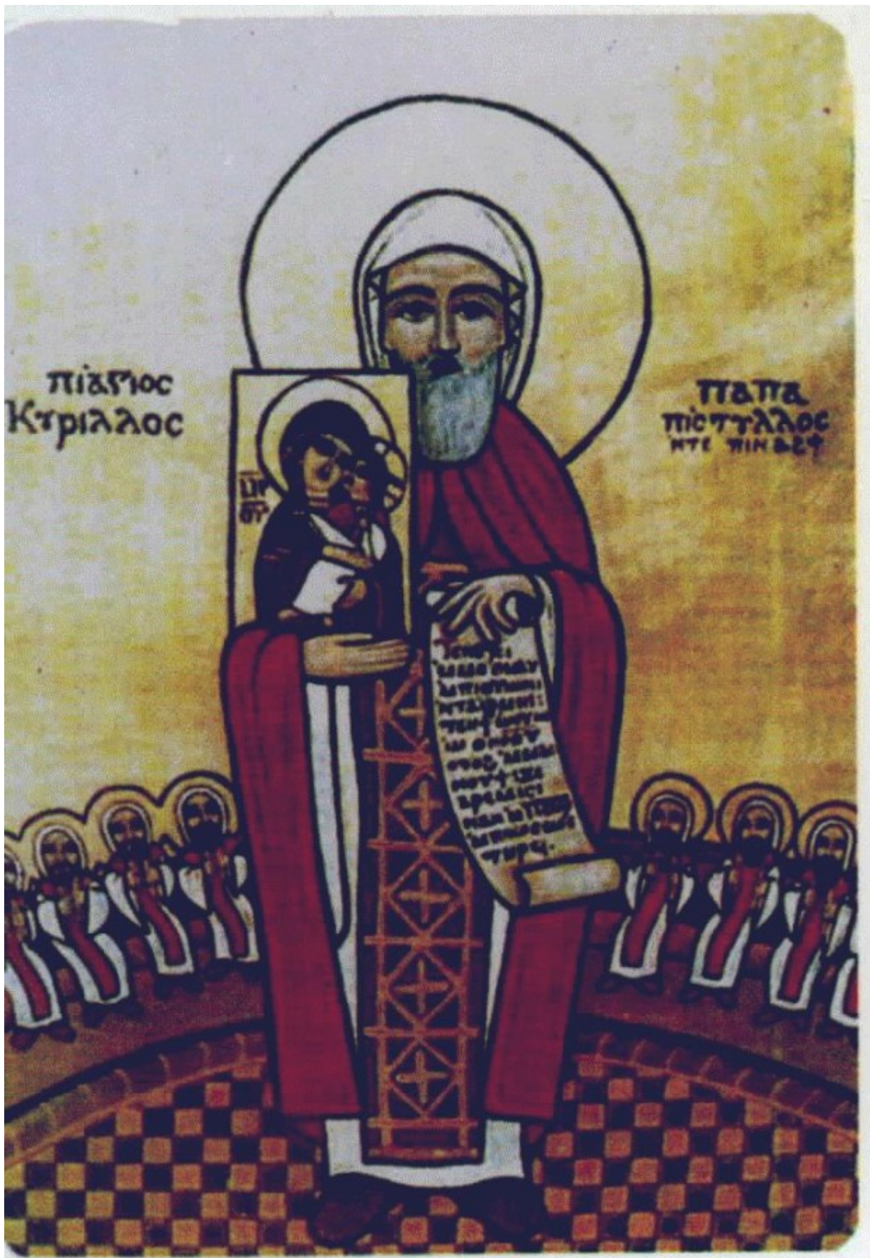
Άγιος Κύριλλος Πατριάρχης Αλεξανδρείας