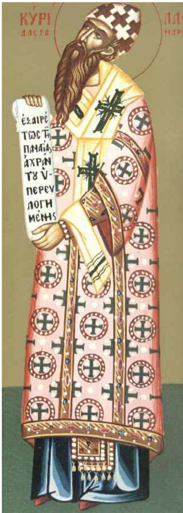
Άγιος Κύριλλος Πατριάρχης Αλεξανδρείας