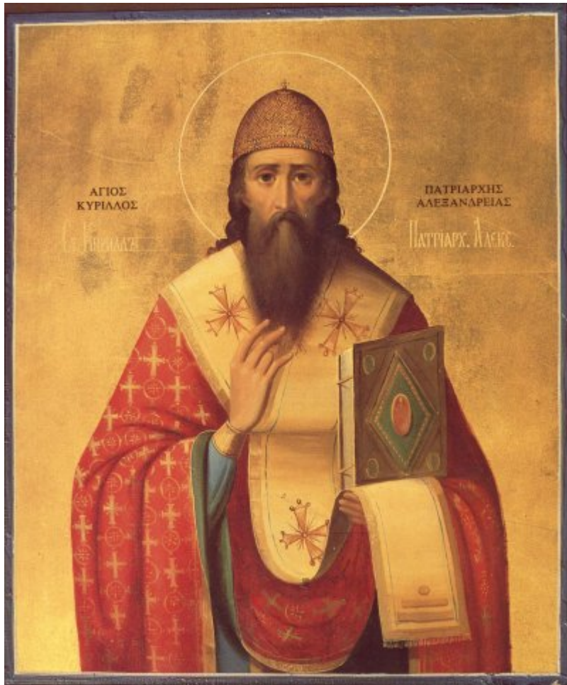
Άγιος Κύριλλος Πατριάρχης Αλεξανδρείας