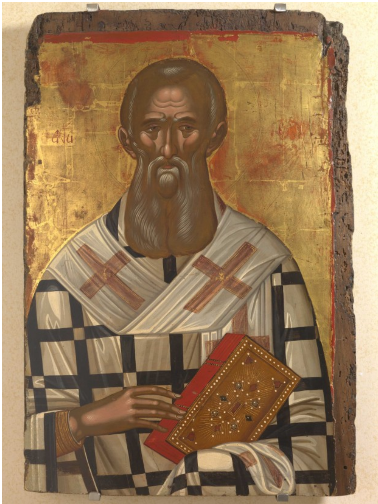
Άγιος Αθανάσιος ο Μέγας - Μιχαήλ Δαμασκηνός, τέλη 16ου αιώνα μ.Χ.