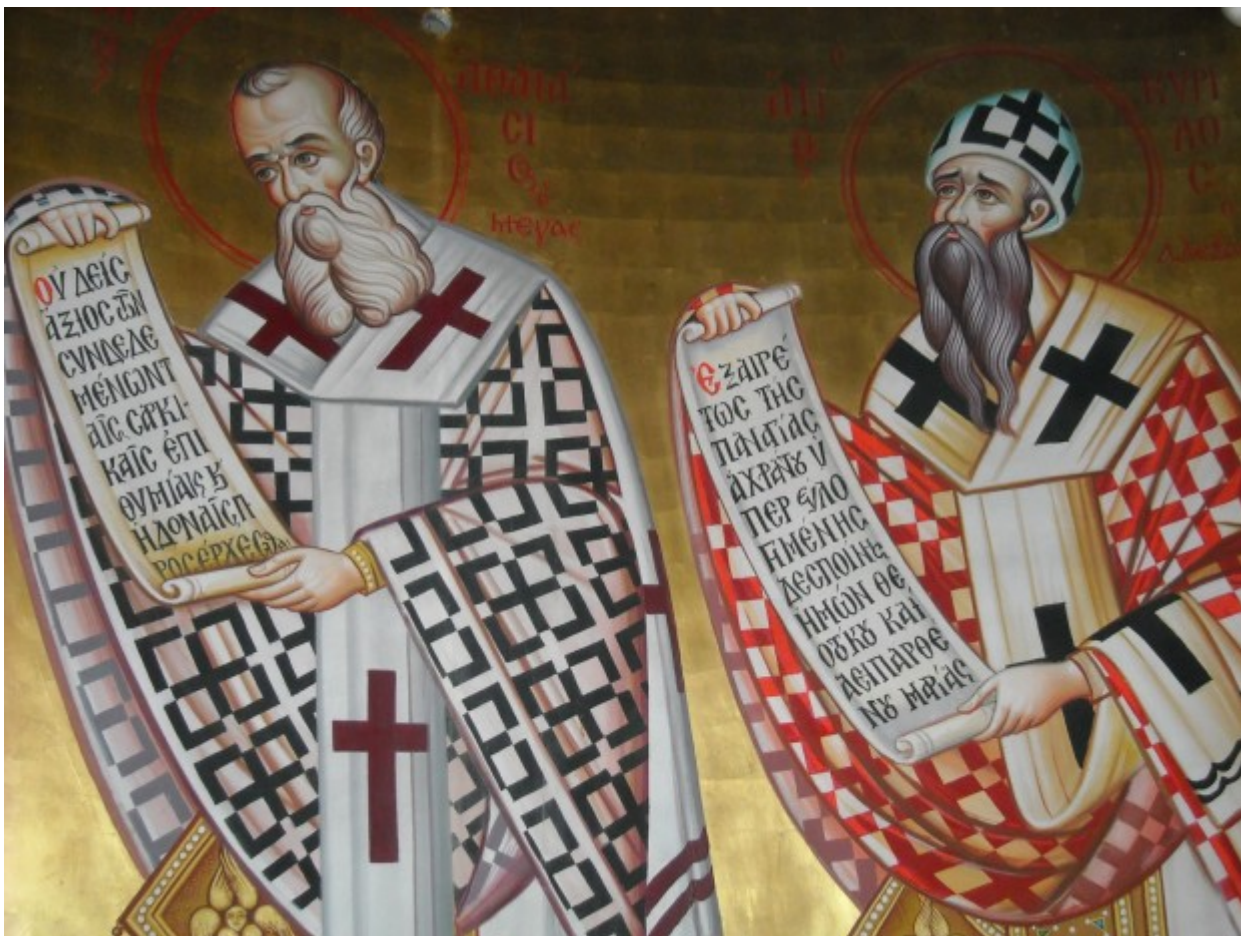
Άγιοι Αθανάσιος ο Μέγας και Κύριλλος Πατριάρχες Αλεξανδρείας