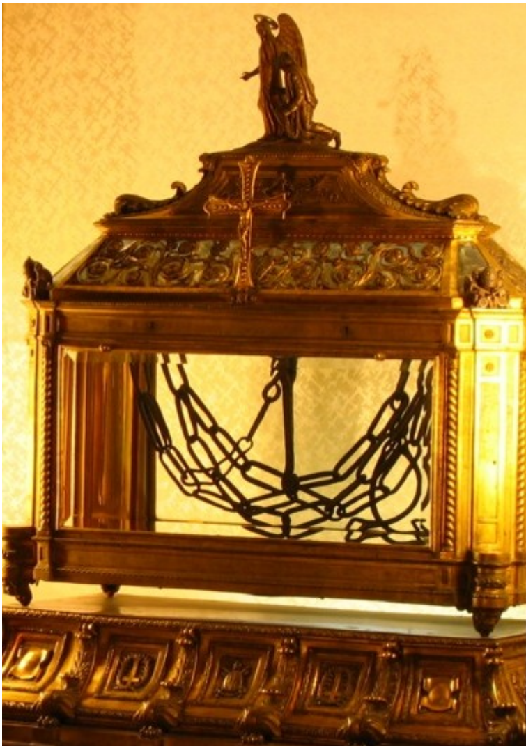
Οι αλυσίδες σήμερα σε ναό της Ρώμης

Η αλυσίδα του αποστόλου Πέτρου φυλασσόταν στα Ιεροσόλυμα έως το έτος 439 μ. Χ.. Τότε ο πατριάρχης των Ιεροσολύμων Ιουβενάλιος τη δώρισε στην αυτοκράτειρα Ευδοκία, την ευσεβέστατη σύζυγο του Θεοδοσίου του Μικρού, που ήταν εκεί εξόριστη. Η Ευδοκία μετέφερε την αλυσίδα στην Κωνσταντινούπολη, και το μεν ένα τμήμα της το εναπόθεσε μέσα στον ναό της Αγίας Σοφίας, ενώ το άλλο το έστειλε ως πολύτιμο δώρο στη Ρώμη, όπου βρίσκεται και τιμάται έως σήμερα.