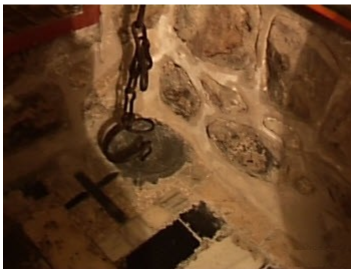
Η φυλακή του αποστόλου Πέτρου στα Ιεροσόλυμα.

«Ο Ηρώδης Αγρίπας, εγγονός του Ηρώδη του Μεγάλου και βασιλεύς των Ιουδαίων, καταληφθείς από μανία εναντίον της Εκκλησίας του Χριστού, κατέσφαξε στην Ιερουσαλήμ το έτος 43 μ. Χ. τον Ιάκωβο, τον αδελφό του Ευαγγελιστή Ιωάννη. Βλέποντας κατόπιν ότι αυτό το έγκλημά του ικανοποίησε πολύ τους Ιουδαίους, συνέλαβε με τον ίδιο τρόπο και τον απόστολο Πέτρο, τον έκλεισε στην φυλακή και τον κρατούσε εκεί αιχμάλωτο μέχρι να περάσει το νομικό Πάσχα, για να τον παραδώσει μετά κι αυτόν στον όχλο ως έτοιμο σφάγιο. Αλλ' όμως, ένας άγγελος Κυρίου ελευθέρωσε τον Απόστολο με θαυματουργικό τρόπο από την αλυσίδα που τον κρατούσε δεμένο και τον διέσωσε (Πράξ. ιβ', 1-19). Η αλυσίδα αυτή, με την οποία ήταν δεμένος ο απόστολος Πέτρος, είχε λάβει από το πανίερο σώμα του αγιαστική και ιαματική χάρη, η οποία μεταδιδόταν στους Χριστιανούς που την προσκυνούσαν με πίστη».