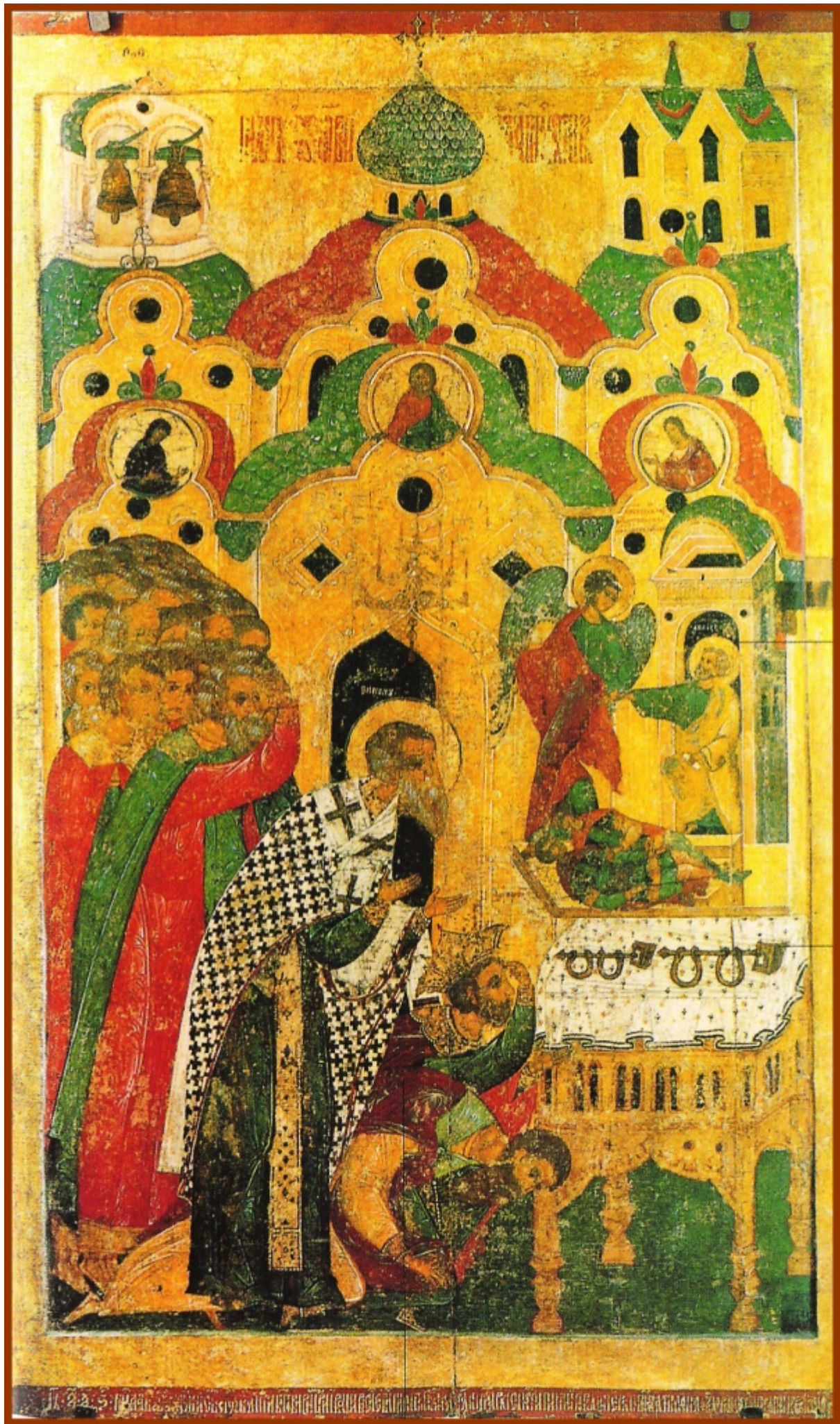
Η προσκύνηση των αλυσίδων.