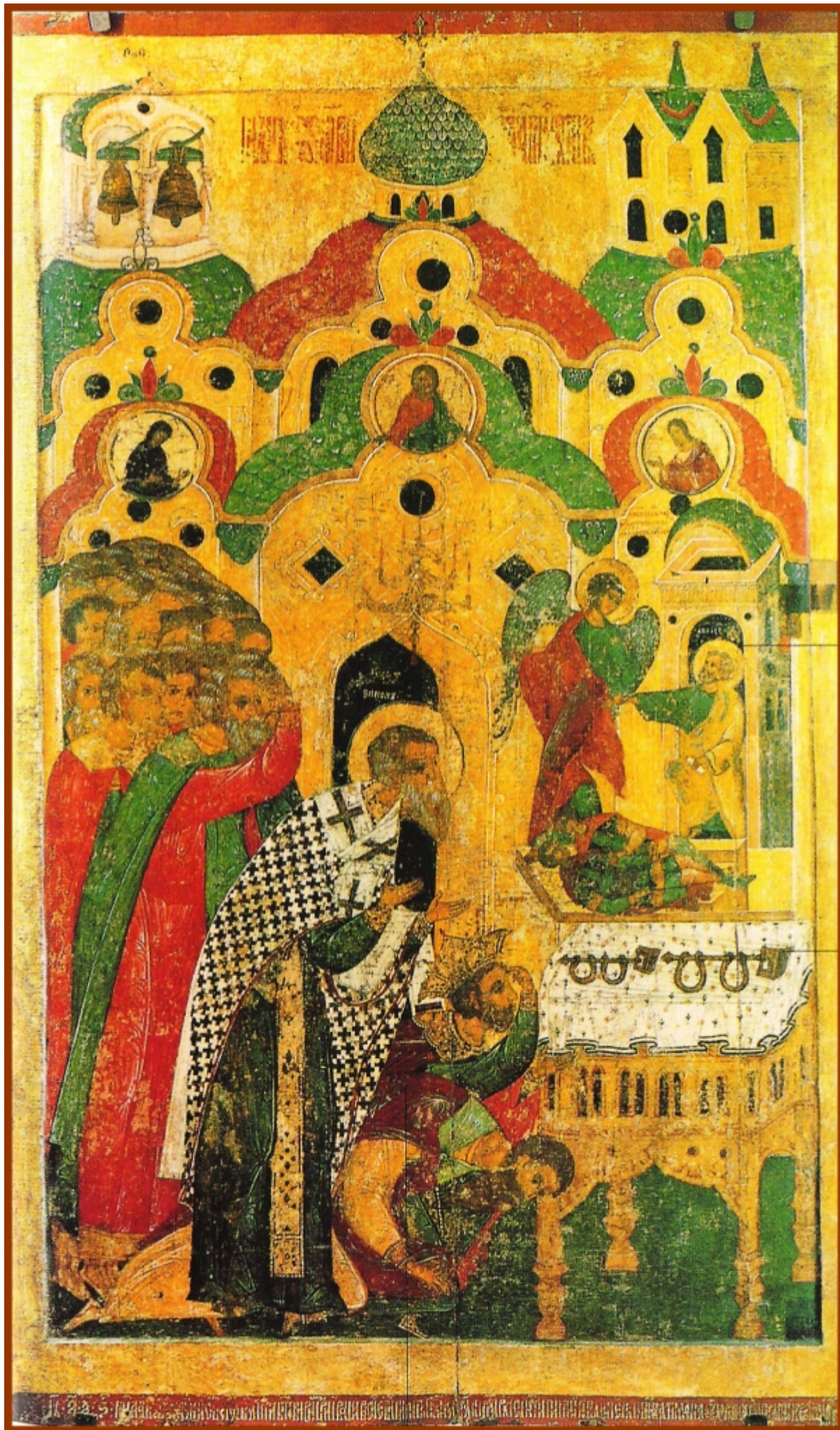
Η προσκύνηση των αλυσίδων.