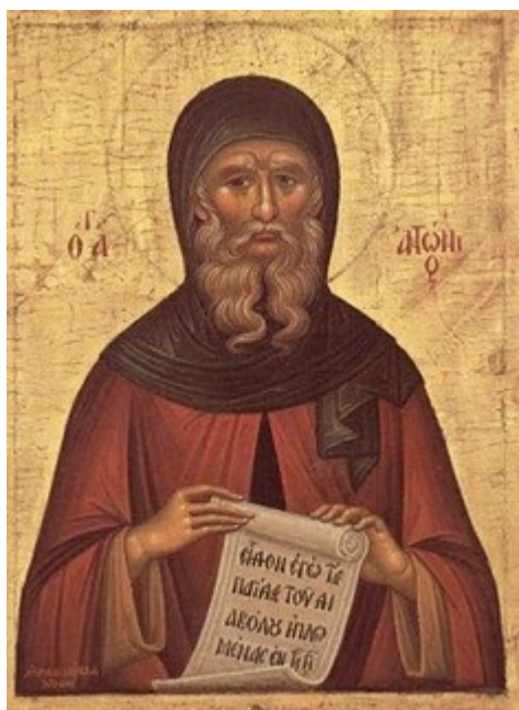
Ο Άγιος Αντώνιος ο Μέγας

εκείνη δεν ήτανε τίποτε άλλο, παρά ο βρωμερός και απαίσιος δαίμονας, που βασάνιζε τον νέο. Σ' έναν άλλο πάλι νέο ο διάβολος του έκανε φοβερά μαρτύρια. Τον καταντούσε έτσι, ώστε να τρώγει τις σάρκες του. Τον βασάνιζε πολύ σκληρά. Οι γονείς του απελπισμένοι τον έφεραν στον Μέγα Αντώνιο. Ο Άγιος λυπήθηκε τον νέο και είπε στους γονείς του ότι θα αγρυπνήσει και θα προσευχηθεί γι' αυτόν, αλλά μαζί του πρέπει ν' αγρυπνήσουν και να προσευχηθούν κι' εκείνοι. Πράγματι κάνανε μια προσευχή πολύ κατανυκτική. Κατά τα ξημερώματα όμως αγρίεψε ο άρρωστος. Όρμησε με οργή εναντίον του Άγιου και τον έριξε κάτω. Πικράθηκαν από την διαγωγή του παιδιού των οι δυστυχισμένοι γονείς. Ο πολύπαθος όμως, από τα τεχνάσματα του διαβόλου ασκητής, τους είπε: —Μην λέτε τίποτε εναντίον του παιδιού. Δεν φταίει αυτό, αλλά ο δαίμονας, που οργίστηκε διότι πήρε εντολή από τον Θεό να βγει από μέσα του και να τον αφήσει ελεύθερο. Αυτό είναι το σημάδι, ότι βγήκε το δαιμόνιο. Δοξάστε τον Θεό... Και πράγματι το παιδί ημερωμένο έπειτα, σηκώθηκε και φιλούσε ευτυχισμένο τα χέρια του Μεγάλου Αντωνίου. Το δαιμόνιο έφυγε.