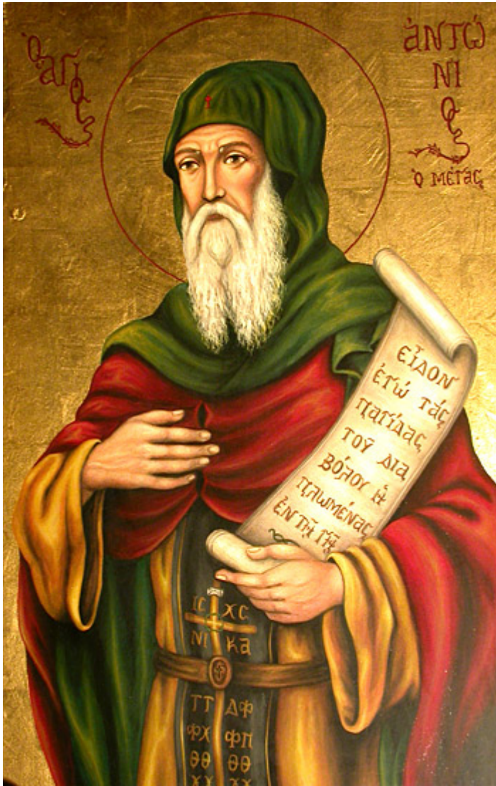
Ο Άγιος Αντώνιος ο Μέγας

Ορθοδοξία και Ορθοπραξία / Συναξαριακές Μορφές