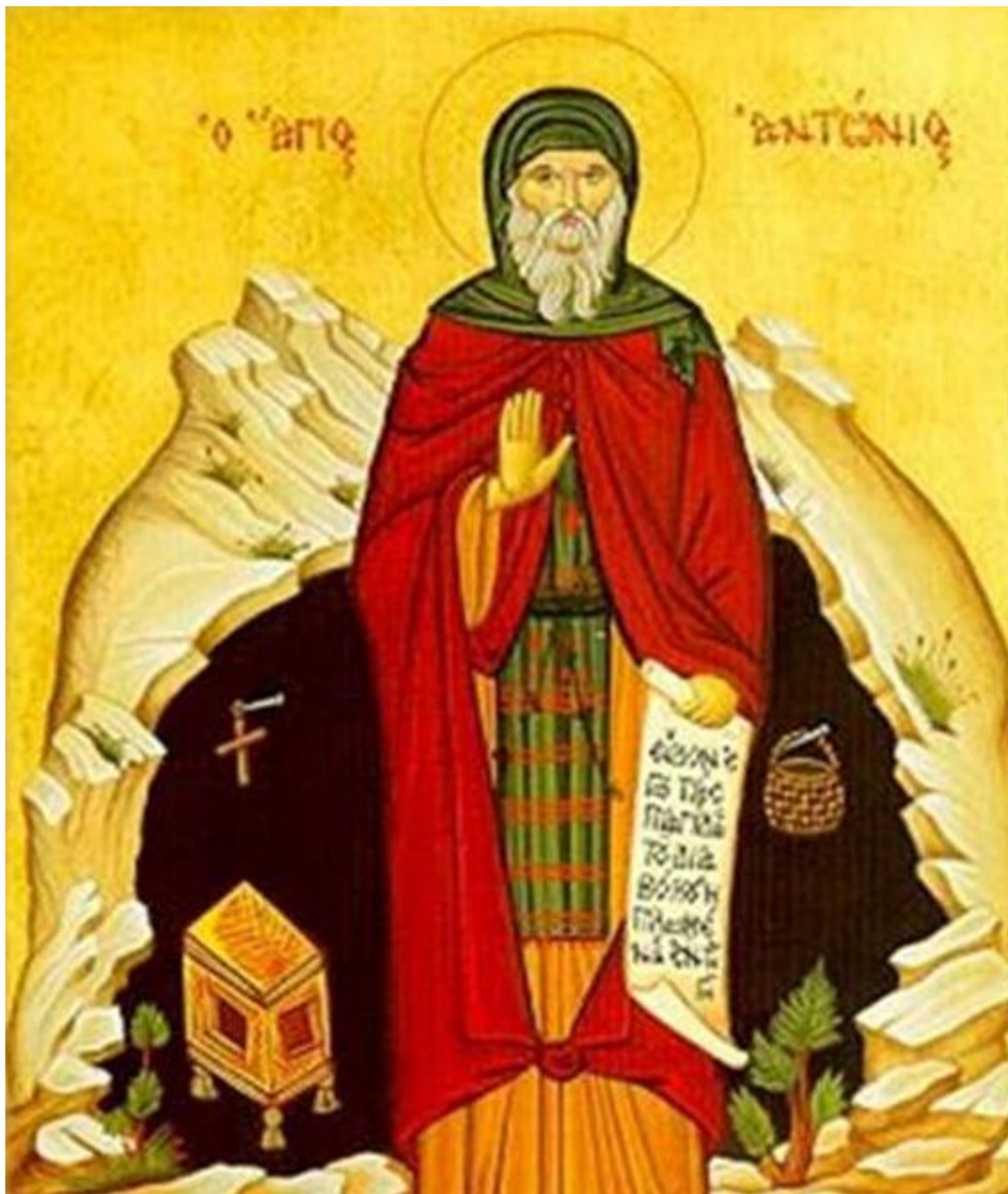
Ο Άγιος Αντώνιος ο Μέγας