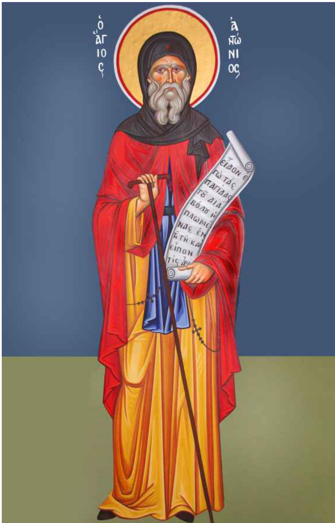
Ο Άγιος Αντώνιος ο Μέγας