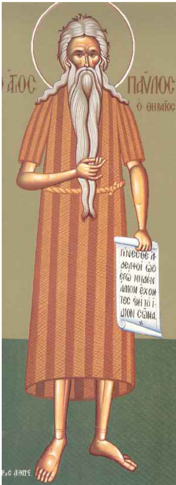
Όσιος Παύλος ο Θηβαίος