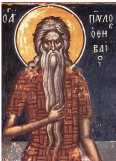
Όσιος Παύλος ο Θηβαίος