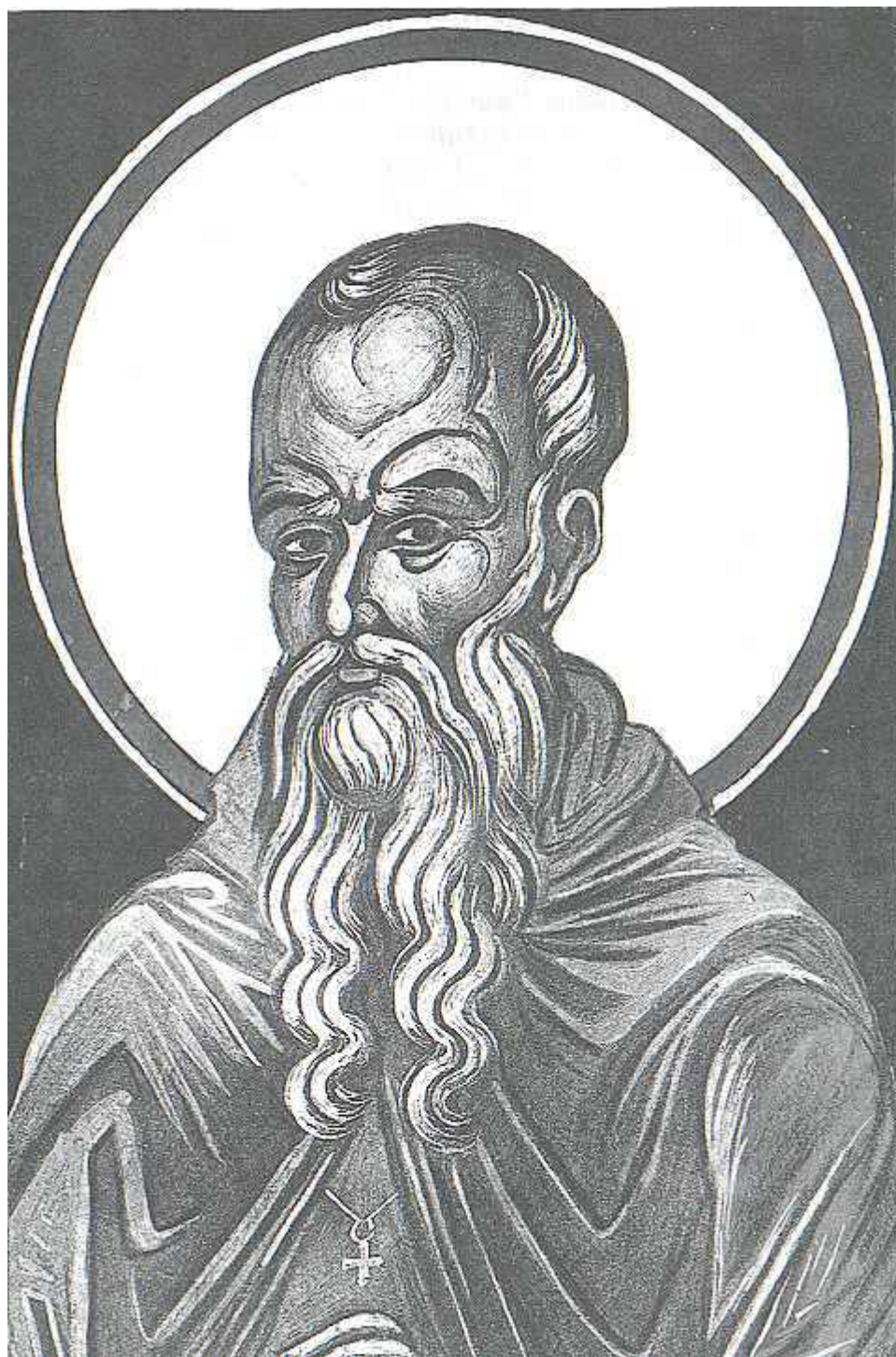
Όσιος Θεοδόσιος ο κοινοβιάρχης