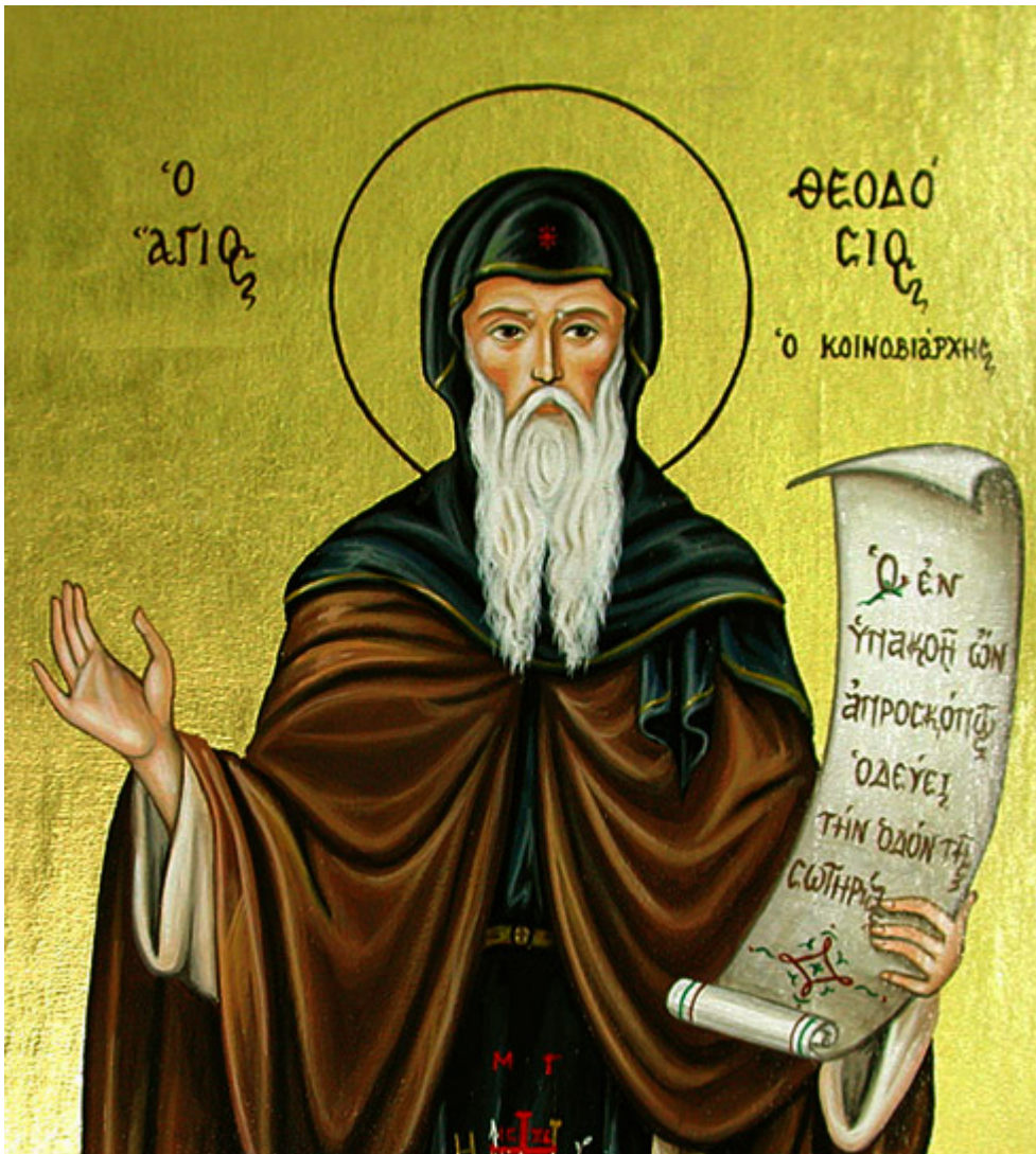
Όσιος Θεοδόσιος ο κοινοβιάρχης

Ορθοδοξία και Ορθοπραξία / Συναξαριακές Μορφές