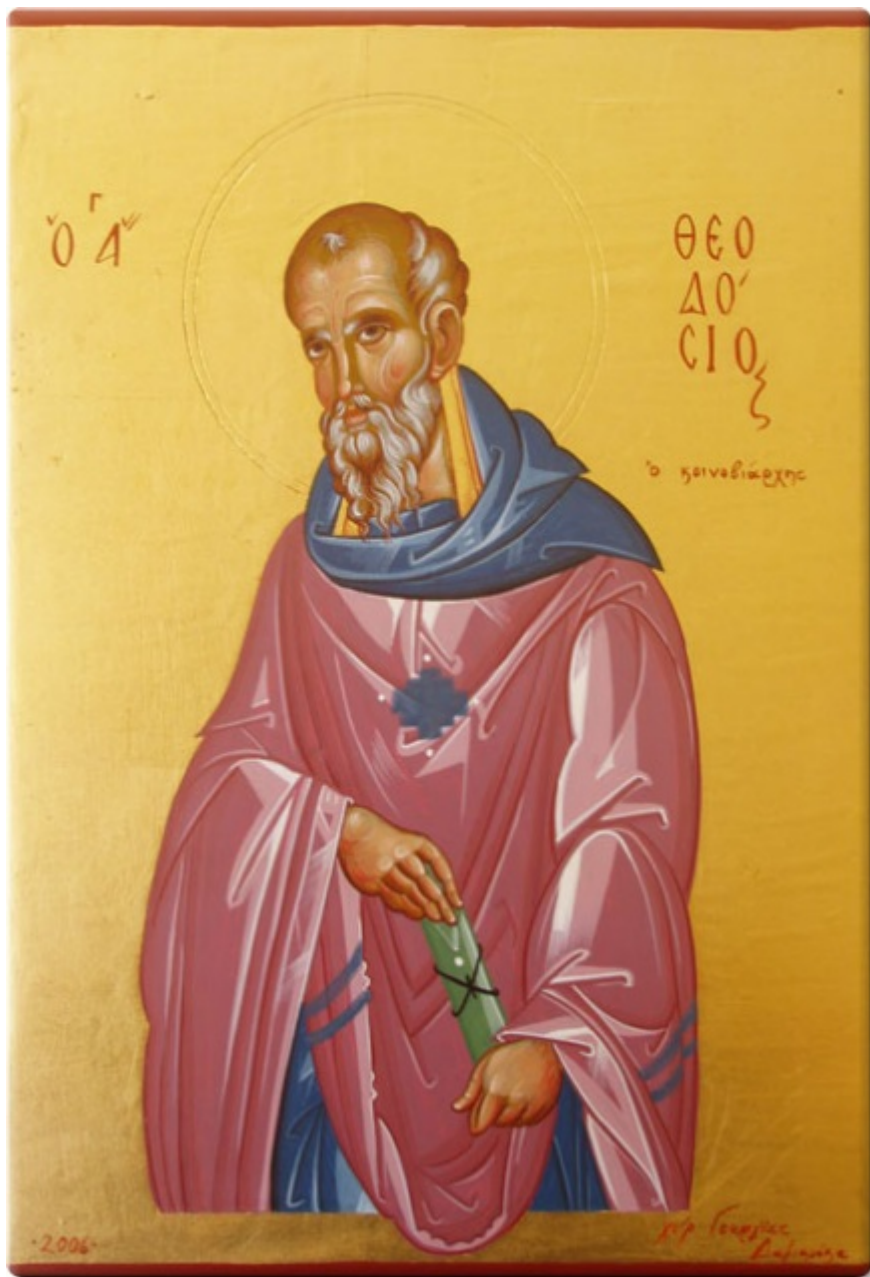
Όσιος Θεοδόσιος ο κοινοβιάρχης - Γεωργία Δαμικούκα© ( http://www.tempera.gr )