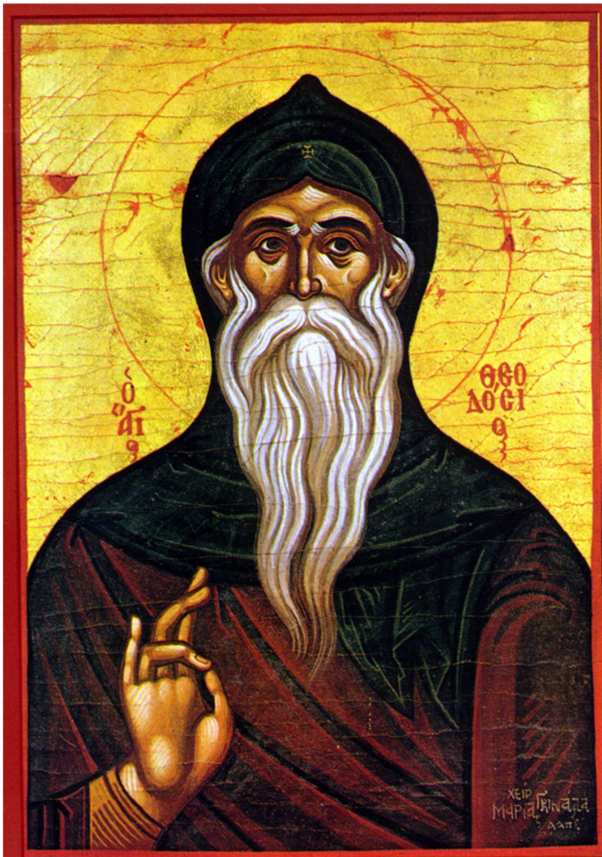
Όσιος Θεοδόσιος ο κοινοβιάρχης