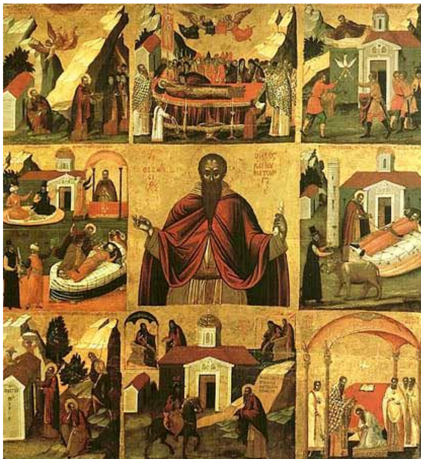
Όσιος Θεοδόσιος ο κοινοβιάρχης