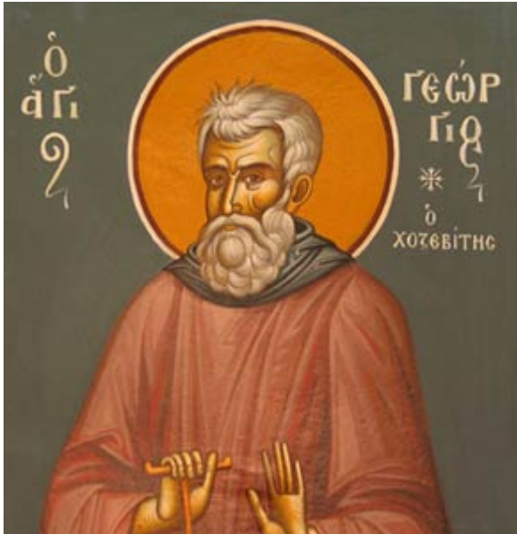
Όσιος Γεώργιος ο Χοζεβίτης

Ορθοδοξία και Ορθοπραξία / Συναξαριακές Μορφές