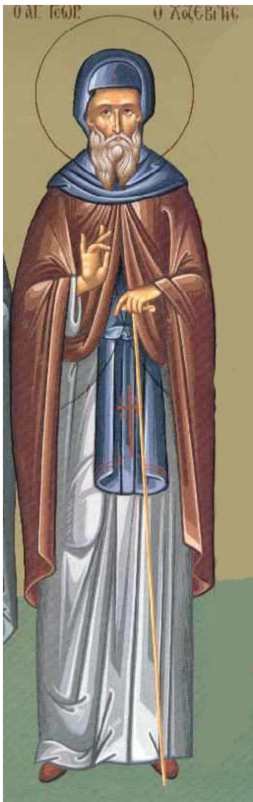
Όσιος Γεώργιος ο Χοζεβίτης