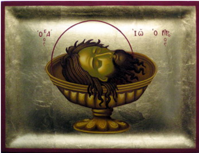
Άγιος Ιωάννης ο Πρόδρομος και Βαπτιστής