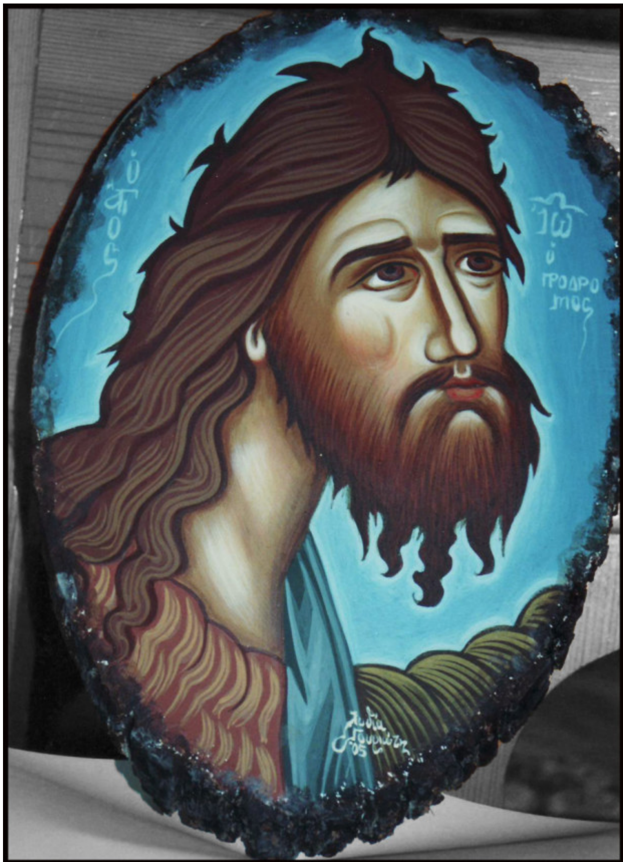
Άγιος Ιωάννης ο Πρόδρομος και Βαπτιστής