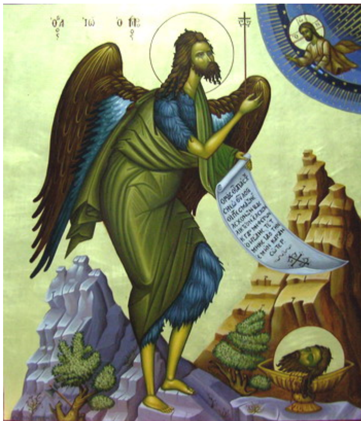
Άγιος Ιωάννης ο Πρόδρομος και Βαπτιστής