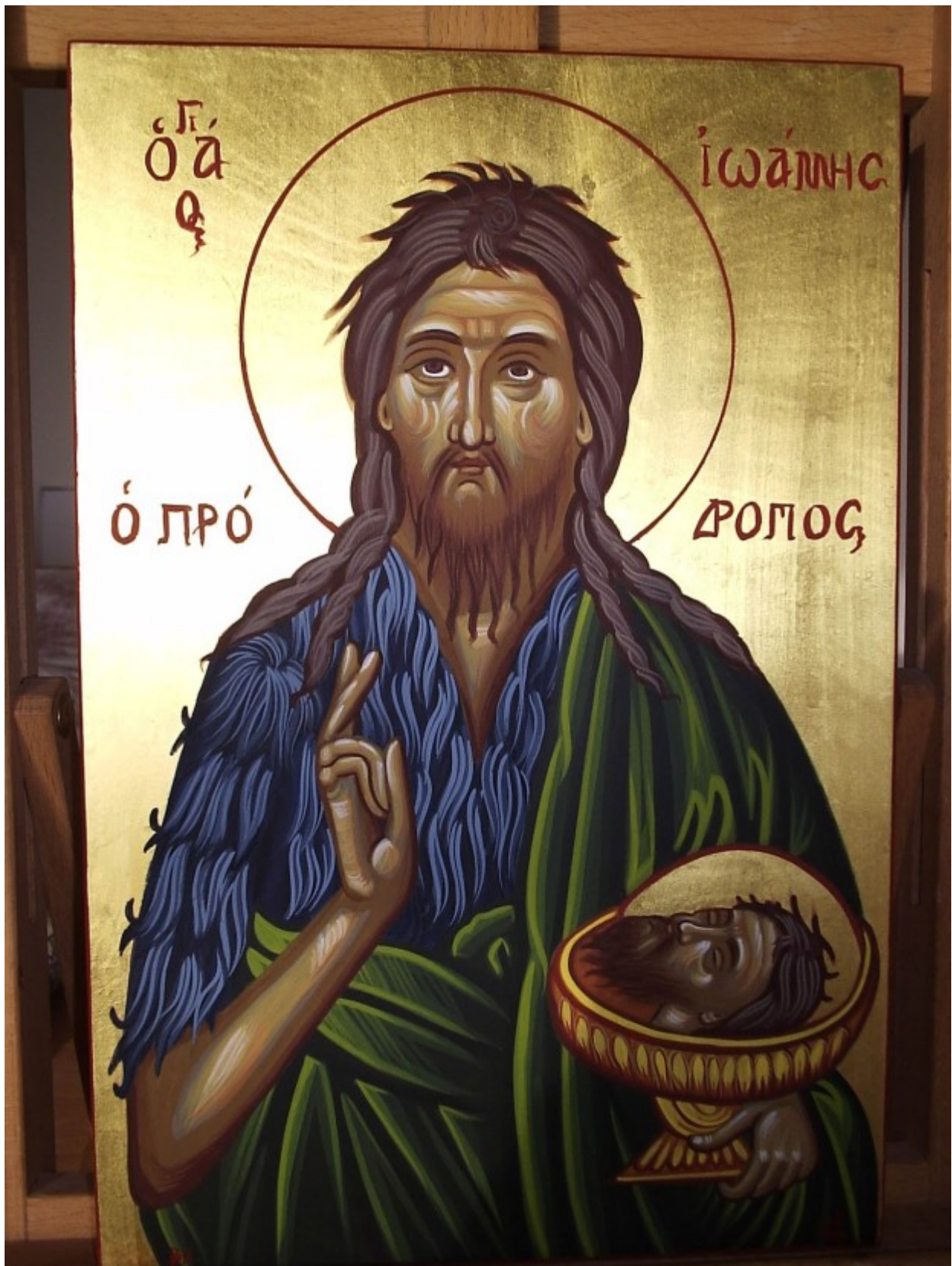
Άγιος Ιωάννης ο Πρόδρομος και Βαπτιστής - Χρωστήρας© (xrostiras.blogspot.com)