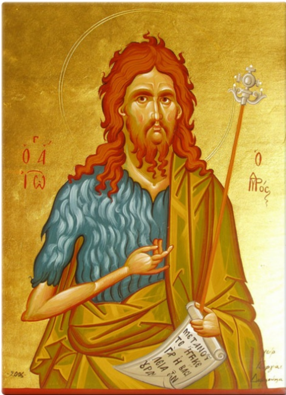
Άγιος Ιωάννης ο Πρόδρομος και Βαπτιστής - Γεωργία Δαμικούκα© ( www.tempera.gr )

Άγιος Ιωάννης ο Πρόδρομος και Βαπτιστής - Αντρέι Ρουμπλιόβ, 1408 μ.Χ.