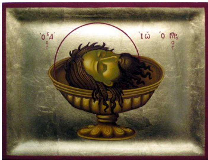
Άγιος Ιωάννης ο Πρόδρομος και Βαπτιστής