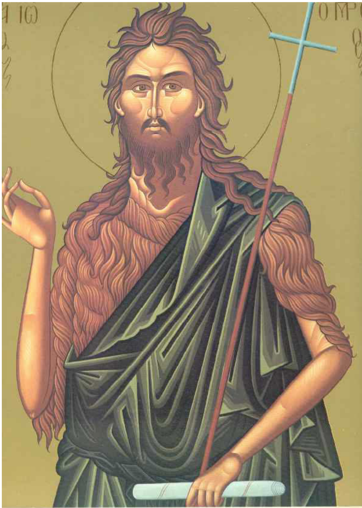
Άγιος Ιωάννης ο Πρόδρομος και Βαπτιστής