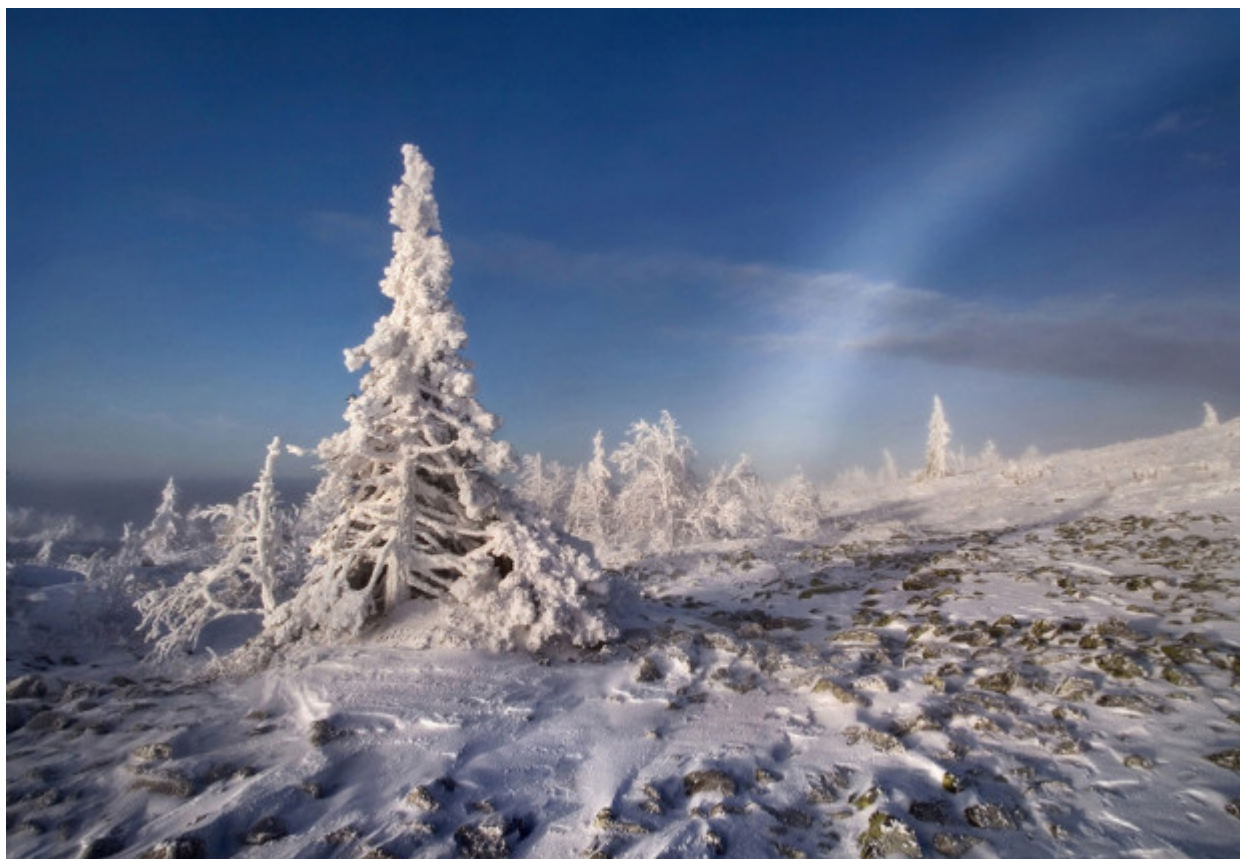
Η ομορφιά του τοπίου συμφιλιώνεται με το κρύο που το περιβάλλει, ενώ τα δυναμικά αθλήματα ζεσταίνουν το παγωμένο σώμα μέσα σε λίγα λεπτά.