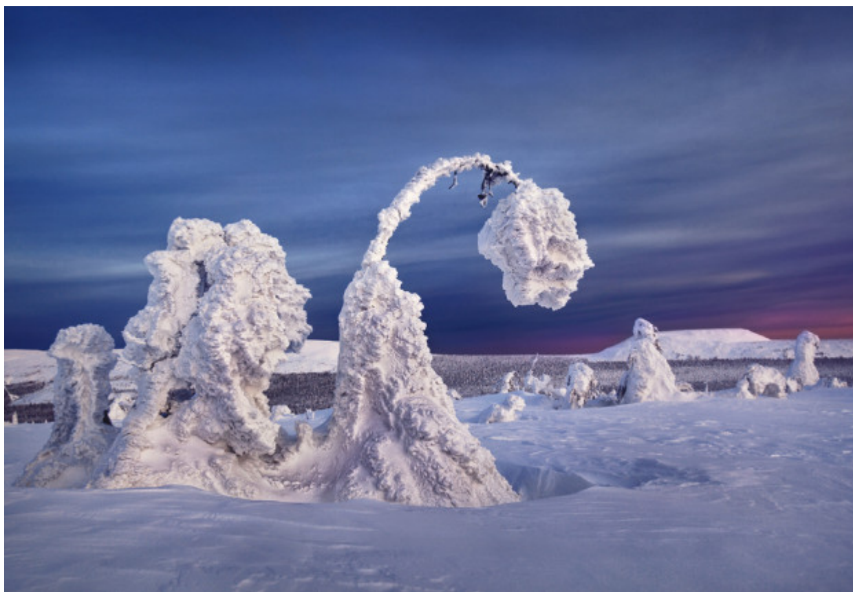
Υπάρχουν μέρη στη Ρωσία, με τόσο χαμηλές θερμοκρασίες που ακόμα και η βότκα παγώνει.