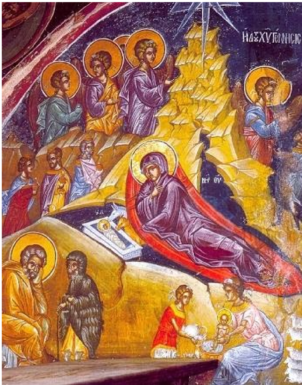
Εικόνα: Η Γέννησις του Χριστού. Παρεκκλήσιον Αγίου Ιωάννου Θεολόγου. Βατοπαιδινό Κελλί Αγίου Προκοπίου