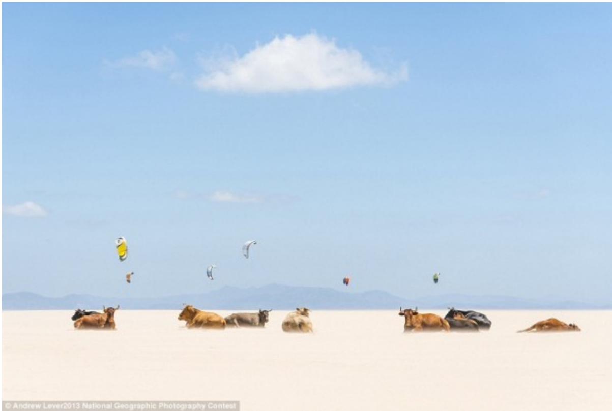
© Andrew Lever 2013 National Geographic Photography Contest