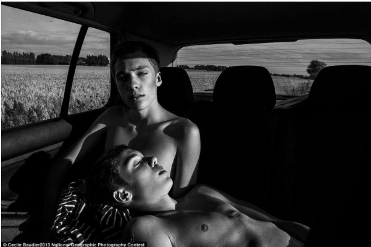
© Cecile Baudier 2013 National Geographic Photography Contest