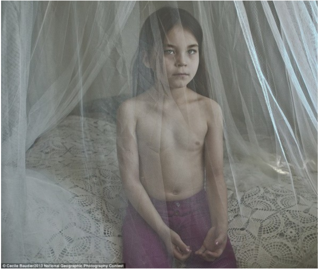
© Cecile Baudier 2013 National Geographic Photography Contest