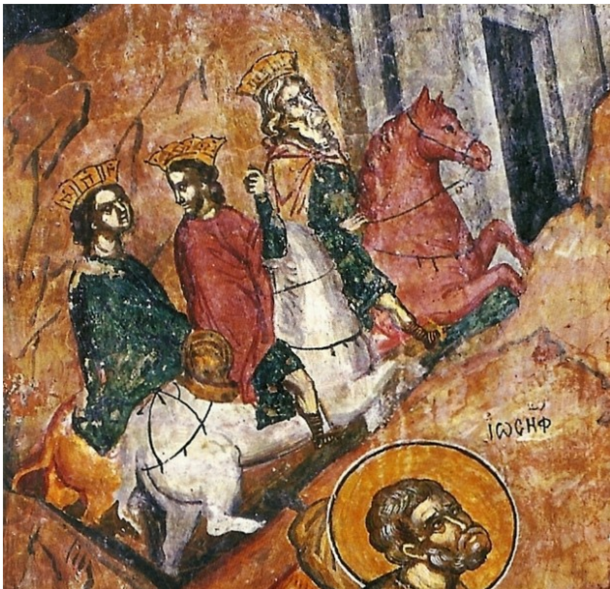
Η επιστροφή των Μάγων στη Βαβυλώνα. Μονή Αγίου Νεοφύτου Πάφου του Κωνσταντινουπόλιτη ζωγράφου Θεόδωρου Αψευδή στα 1183.