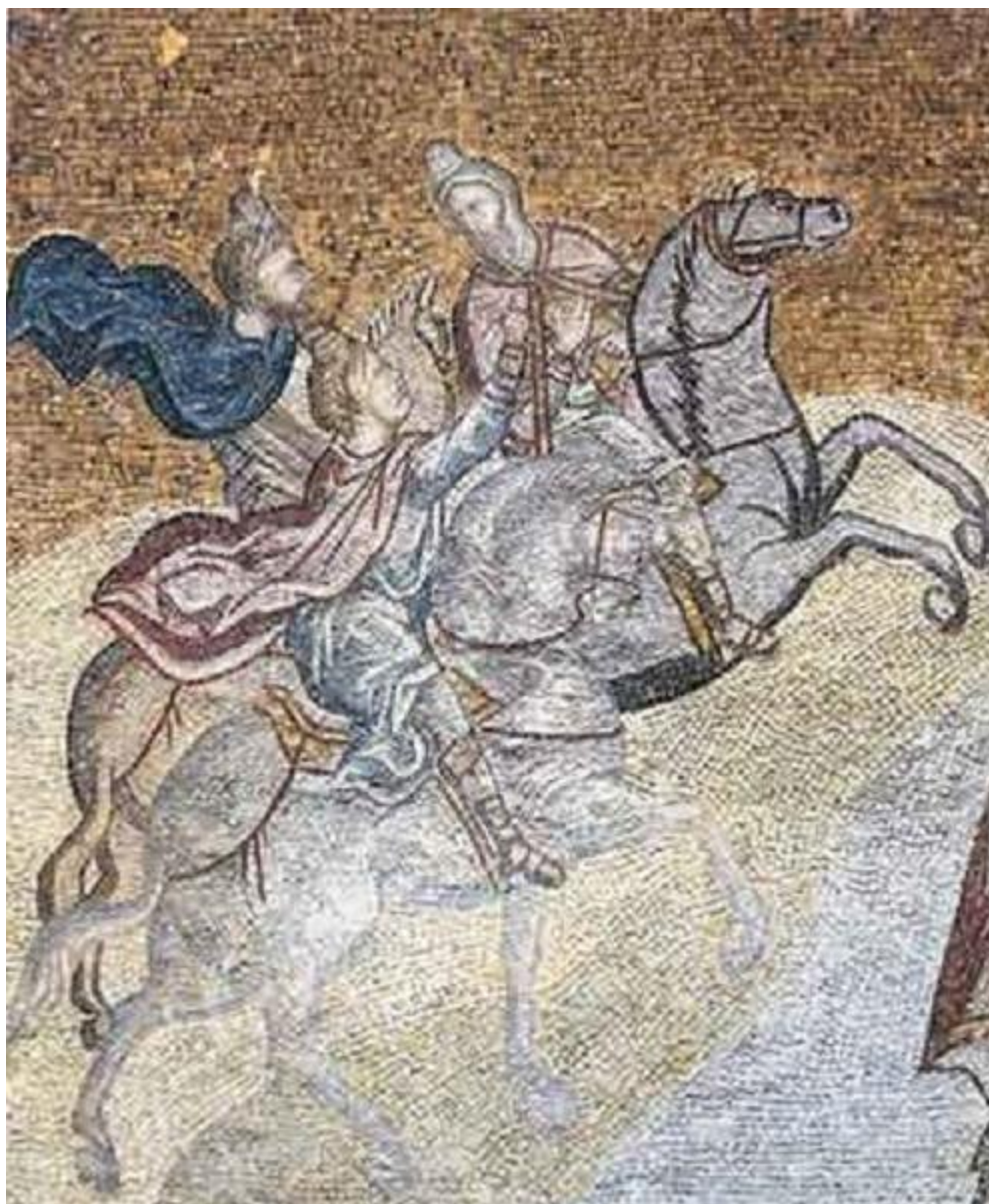
Το ταξίδι των τριών Μάγων 1315 - 1320, ψηφιδωτό στη Μονή της Χώρας, Κωνσταντινούπολης