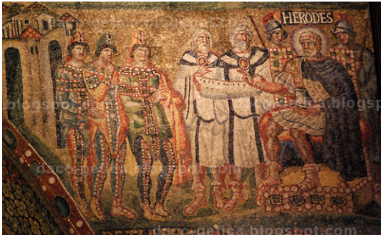
Η επιστροφή των Μάγων στη Βαβυλώνα. Μονή Αγίου Νεοφύτου Πάφου του Κωνσταντινουπόλιτη ζωγράφου Θεόδωρου Αψευδή στα 1183.