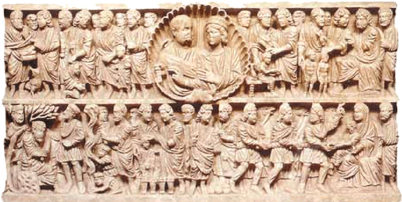
Σαρκοφάγος του 4ου αιώνα μ.Χ., στην οποία εικονίζονται κάτω δεξιά οι τρεις Μάγοι μπροστά στην Παρθένο με το βρέφος και τον Ιωσήφ πίσω της. Οι Μάγοι φέρουν περσικό ένδυμα, δηλ. φρυγικό πύλο, περικνημίδες και χιτώνα.