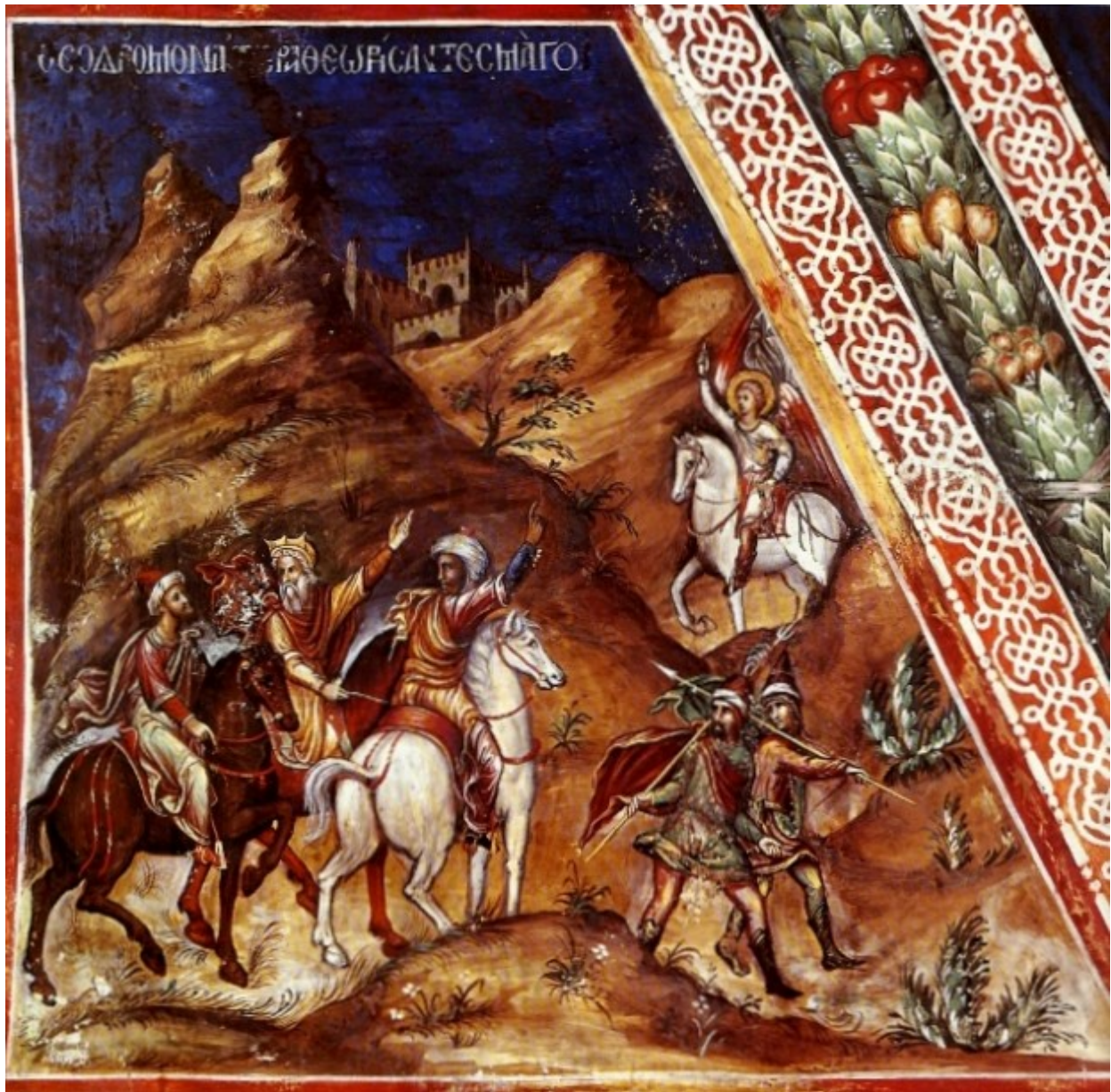
«Θεοδρόμον αστέρα Θεωρήσαντες Μάγοι», τοιχογραφία στο παρεκκλήσιο του Ακαθίστου Ύμνου της Μονής του Αγίου Ιωάννη Λαμπαδιστή, Καλοπαναγιώτης(1500)