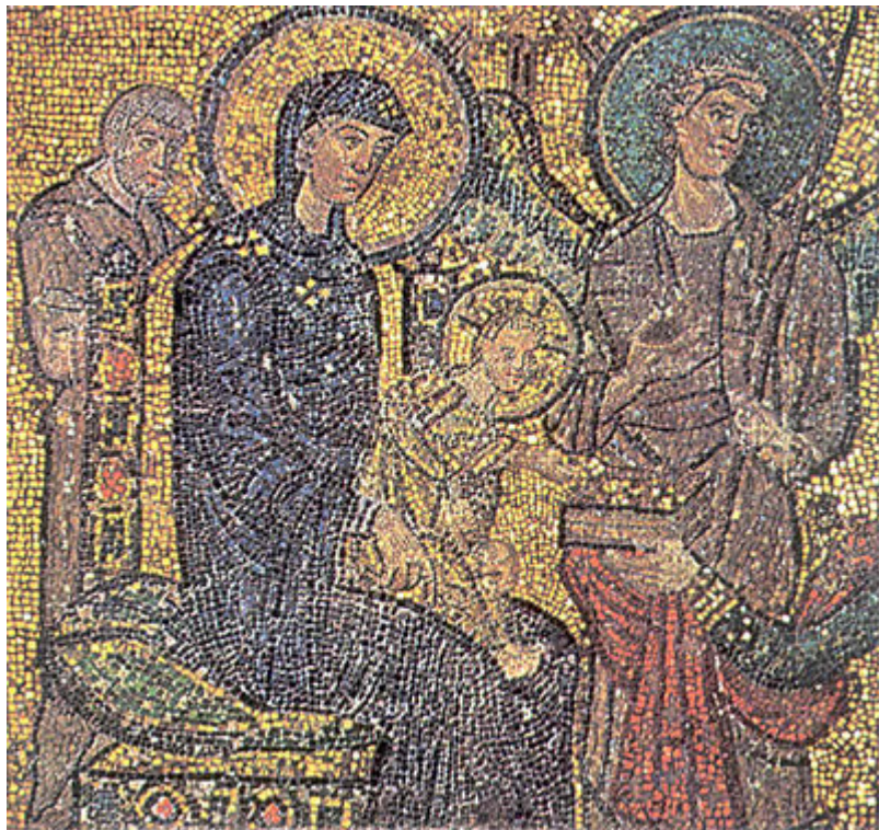
Ο άγγελος - αστέρας στην προσκύνηση των Μάγων. Λεπτομέρεια. Ψηφιδωτό του 8ου αιώνα, τώρα στην Santa Maria in Cosmedin Ρώμης