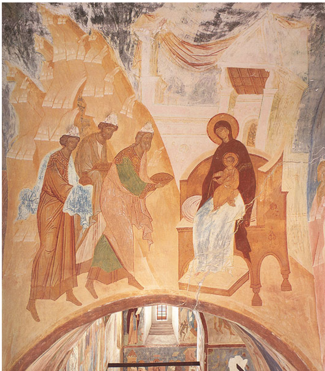
Η προσκύνηση των τριών μάγων-Τοιχογραφία Μονή Φεραπόντοβ,Ρωσία 1500