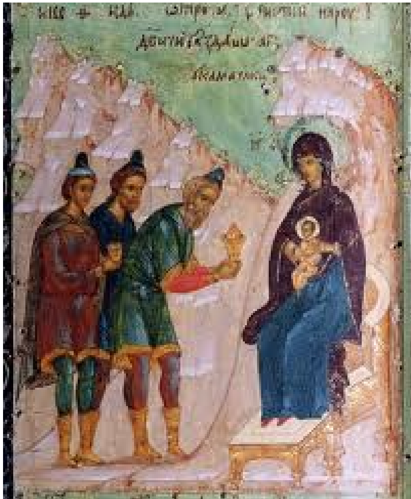
Η προσκύνηση των τριών μάγων-Τμήμα εικόνας-16ος αιώνας Ρωσία