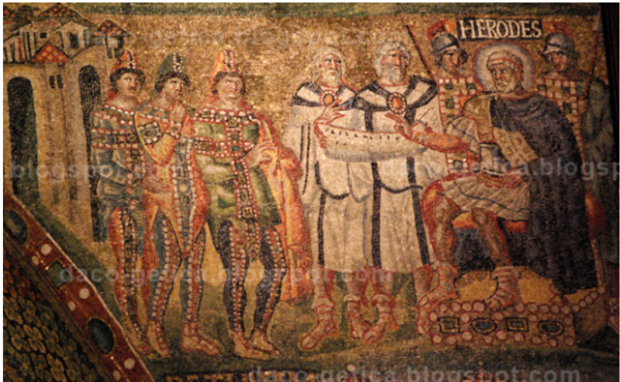
Οι τρεις μάγοι μπροστά στον Ηρώδη. Santa Maria Maggiore Ρώμη (5ος αιώνας)