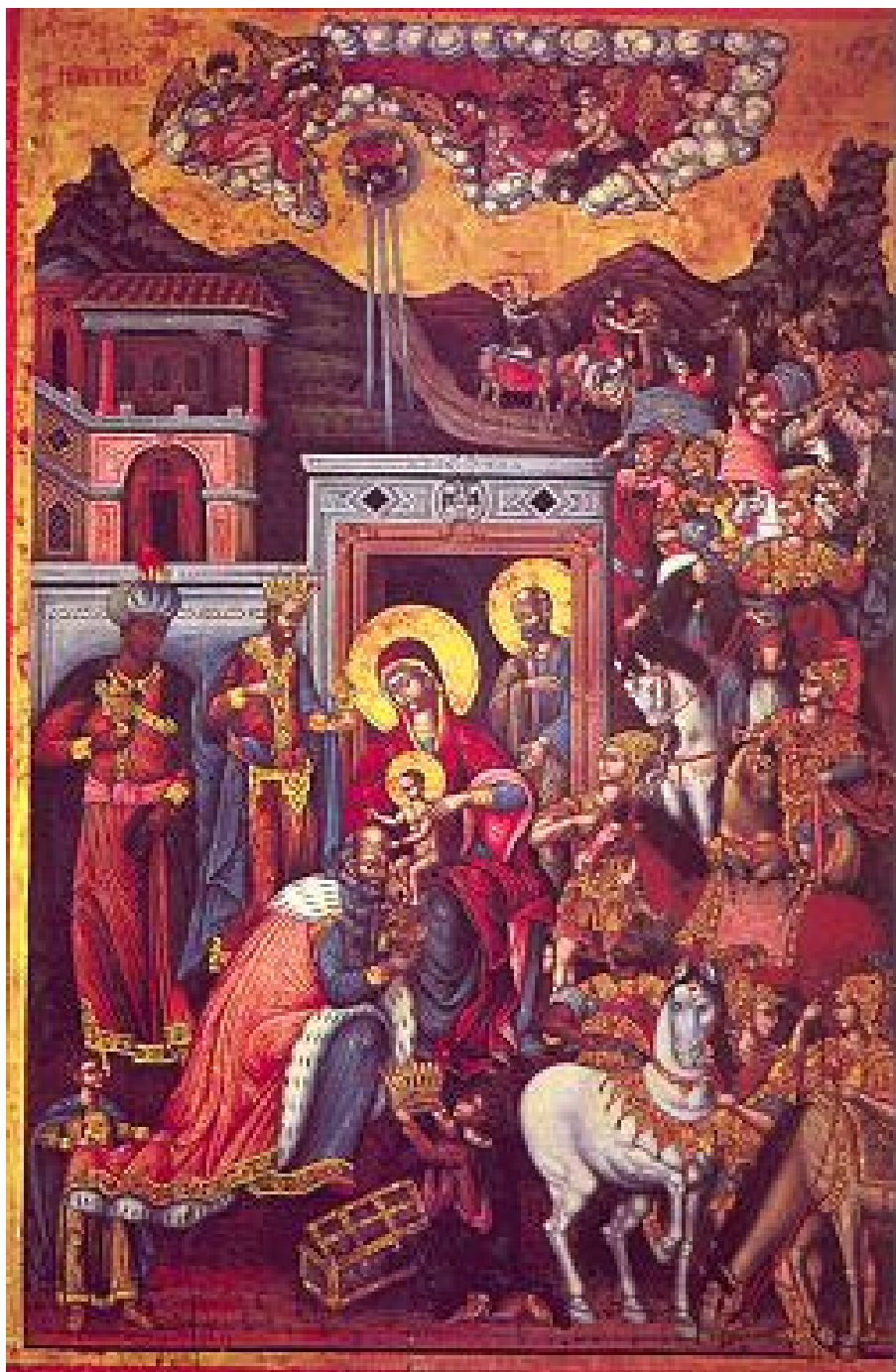
Η Προσκύνηση των Μάγων του Γεωργίου Καστροφύλακα (1746) ,παλαιός ναός Αγίου Μηνά Ηρακλείου