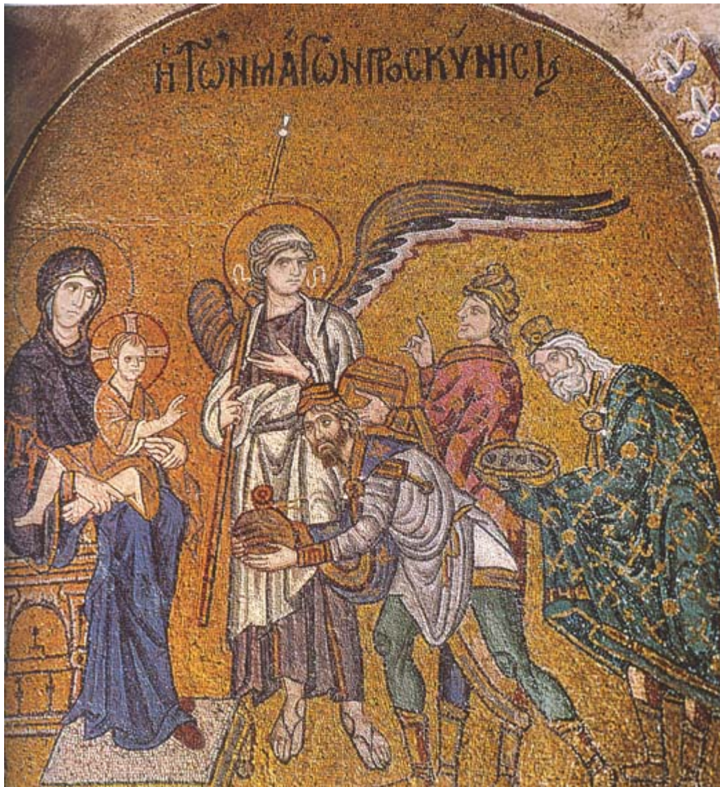
Η Προσκύνηση των Μάγων - Καθολικό Μονής Δαφνίου τέλη 11ου αι. μ.Χ.