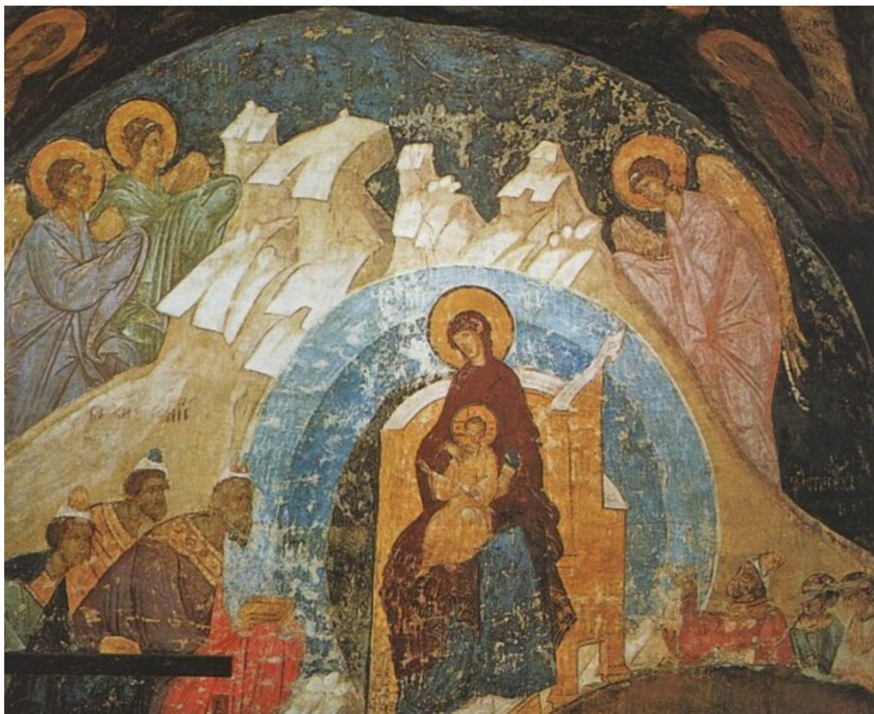
Η προσκύνηση των τριών μάγων-Τοιχογραφία Ι.Ν.Κοιμήσεως Θεοτόκου Κρεμλίνου 1481