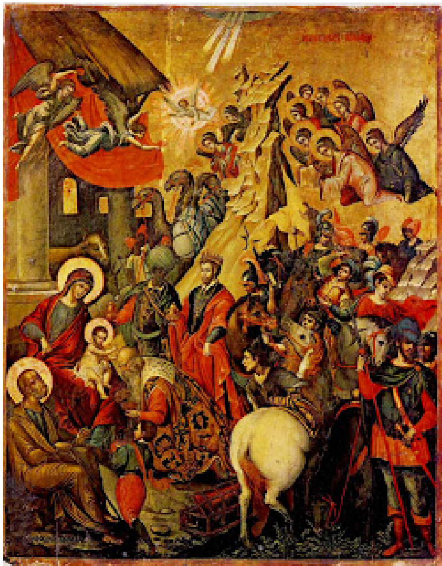
Μιχαήλ Δαμασκηνός, Η προσκύνησις των μάγων Συλλογή Αγ. Αικατερίνης Ηράκλειο, 16ος αι.