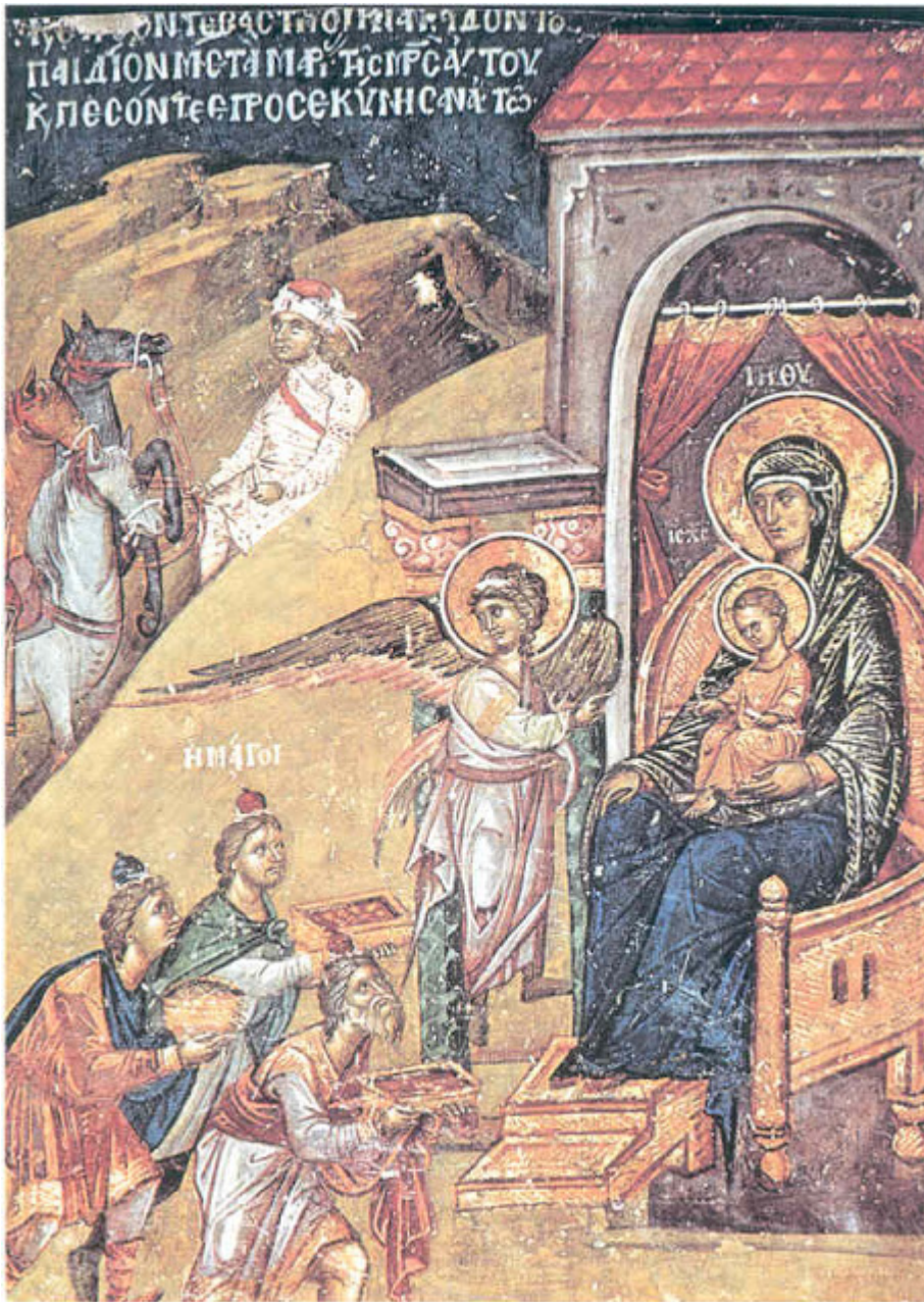
Η Προσκύνηση των Μάγων από τον Άγιο Νικόλαο Ορφανό, Θεσσαλονίκη 1310 - 1320