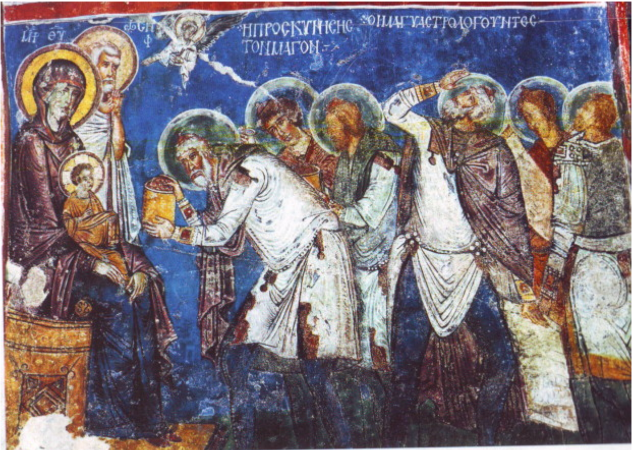
Η προσκύνηση των τριών μάγων-12ος αιώνας Καππαδοκία