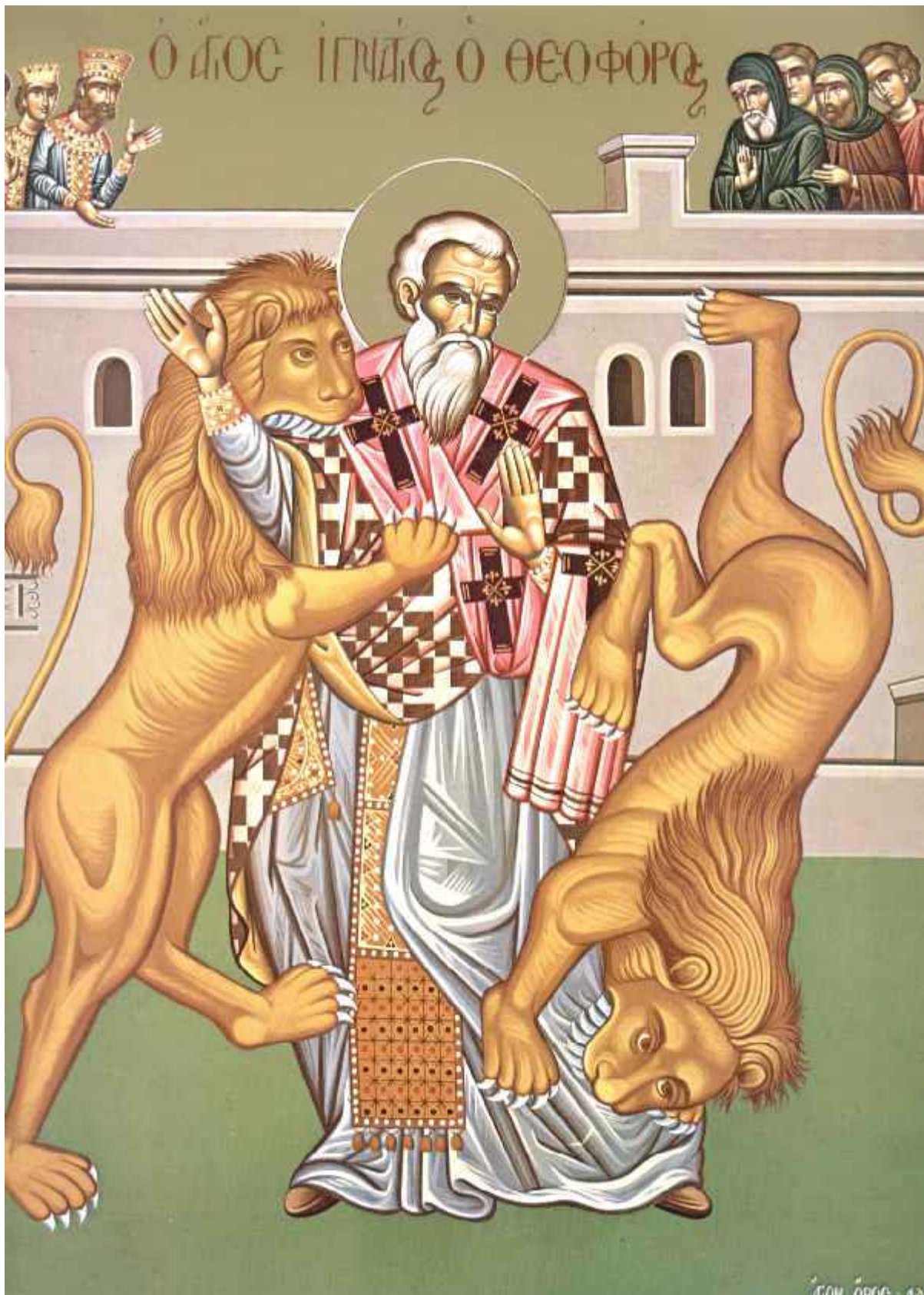
Άγιος Ιγνάτιος ο Θεοφόρος και Ιερομάρτυρας