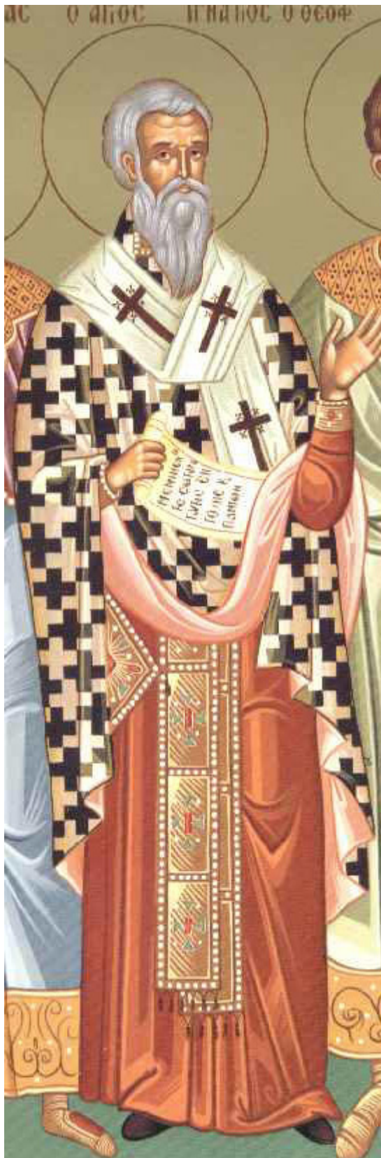
Άγιος Ιγνάτιος ο Θεοφόρος και Ιερομάρτυρας