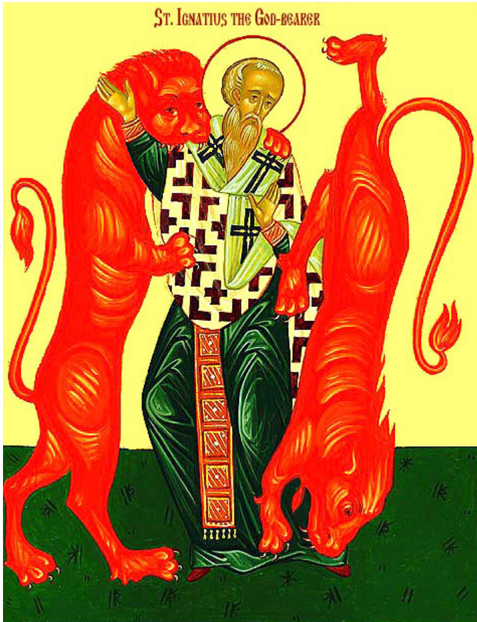
Άγιος Ιγνάτιος ο Θεοφόρος και Ιερομάρτυρας