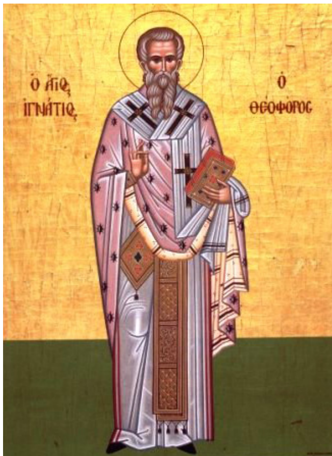
Άγιος Ιγνάτιος ο Θεοφόρος και Ιερομάρτυρας