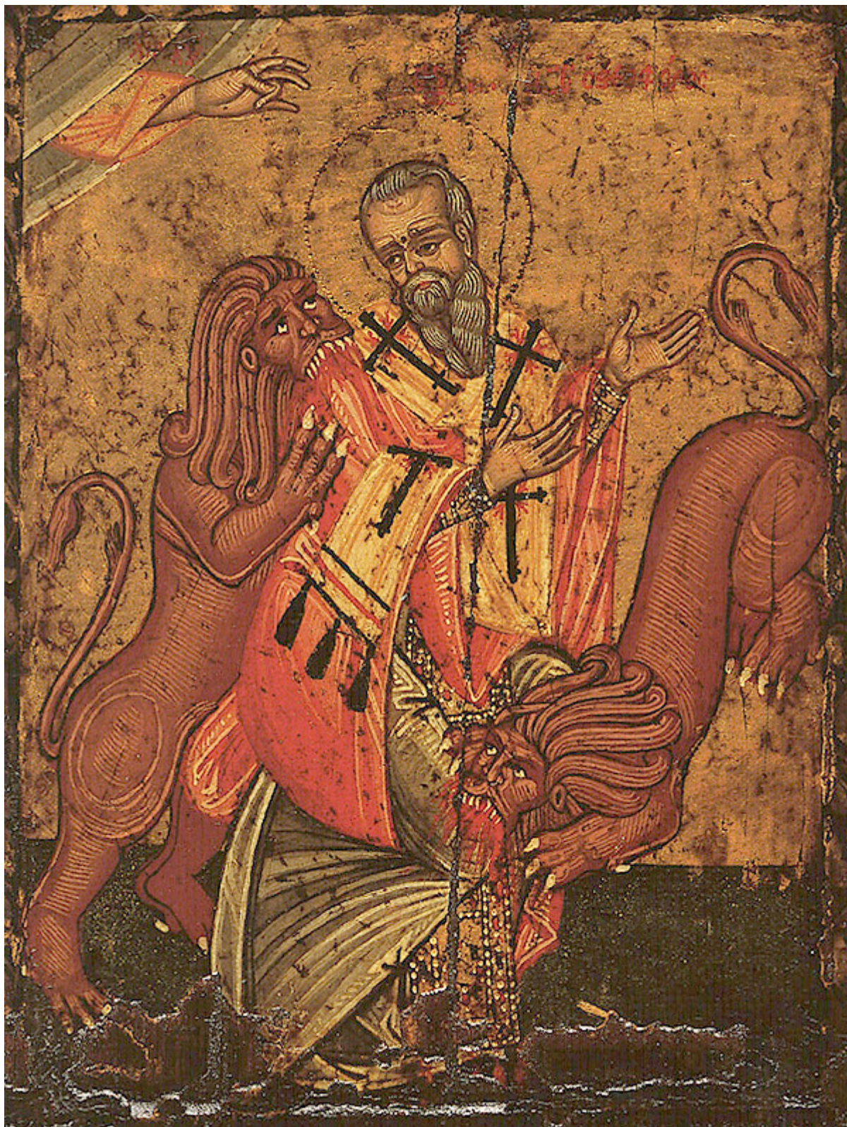
Άγιος Ιγνάτιος ο Θεοφόρος και Ιερομάρτυρας

Εορτάζει στις 20 Δεκεμβρίου εκάστου έτους.