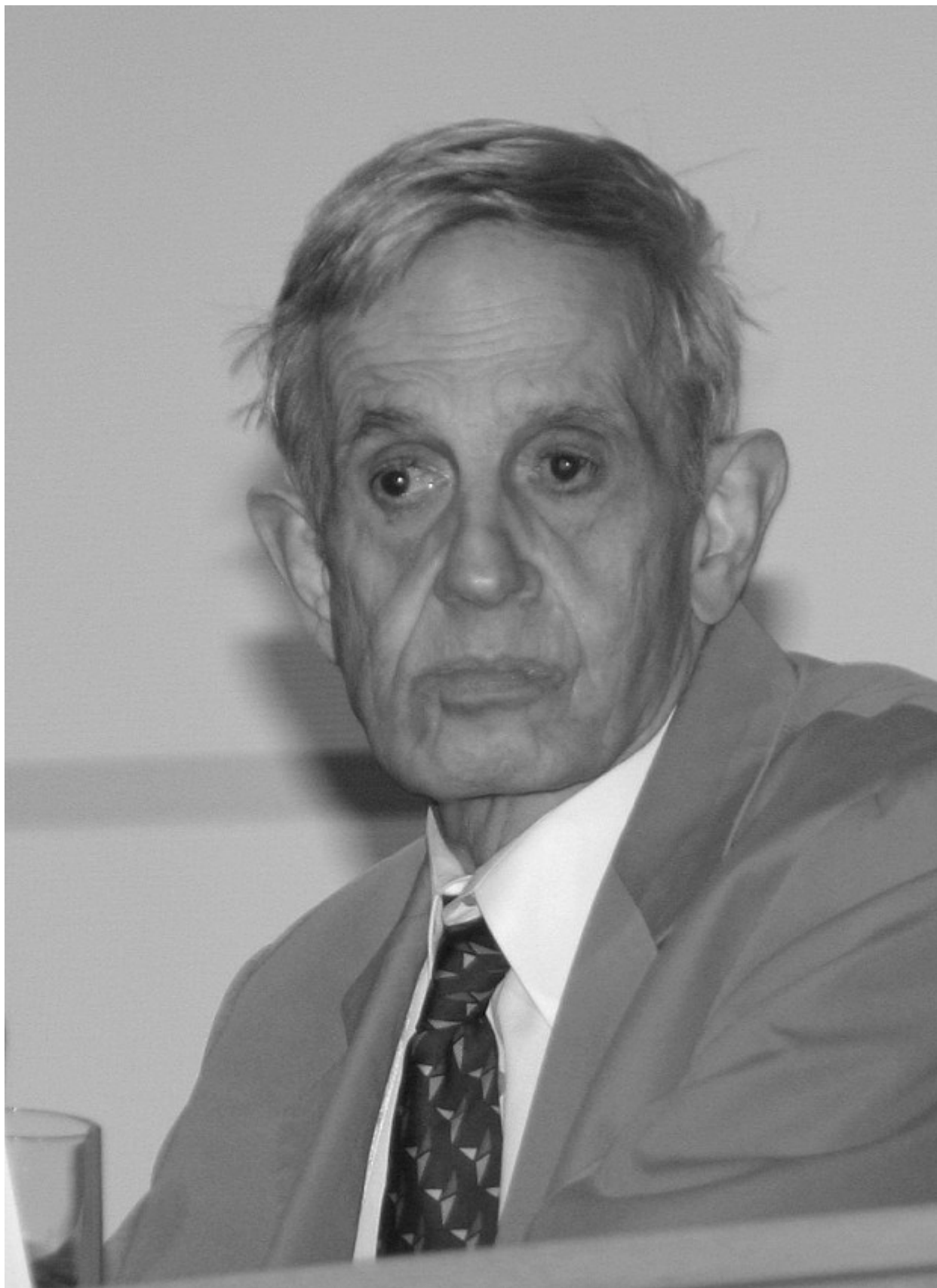
Τζον Νας