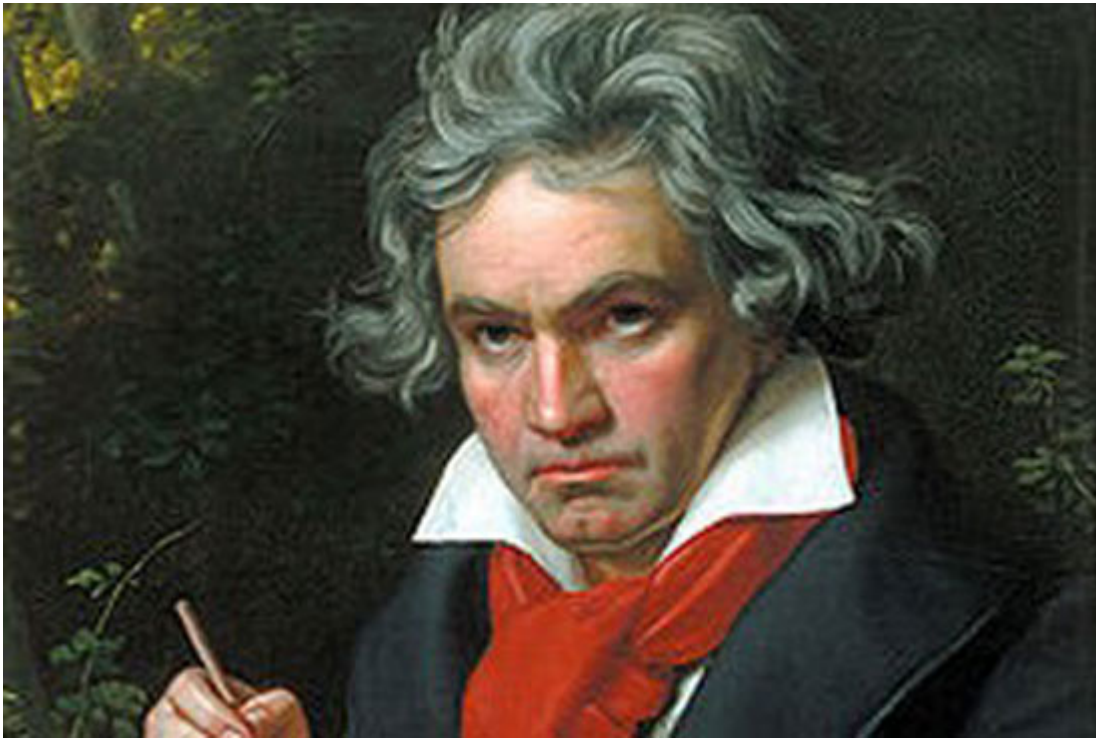
Λούντβιχ Βαν Μπετόβεν

από ανευόδωτο έρωτα. Με την τέχνη του κατάφερε να υπομείνει και να κάνει δικό του τον τόσο ξένο κόσμο που κινείτο. Η πολυώδυνη πορεία ζωής του σφραγίστηκε στις 29 Ιουλίου του 1890 με μερικές λέξεις. «Η λύπη θα κρατήσει για πάντα!»»