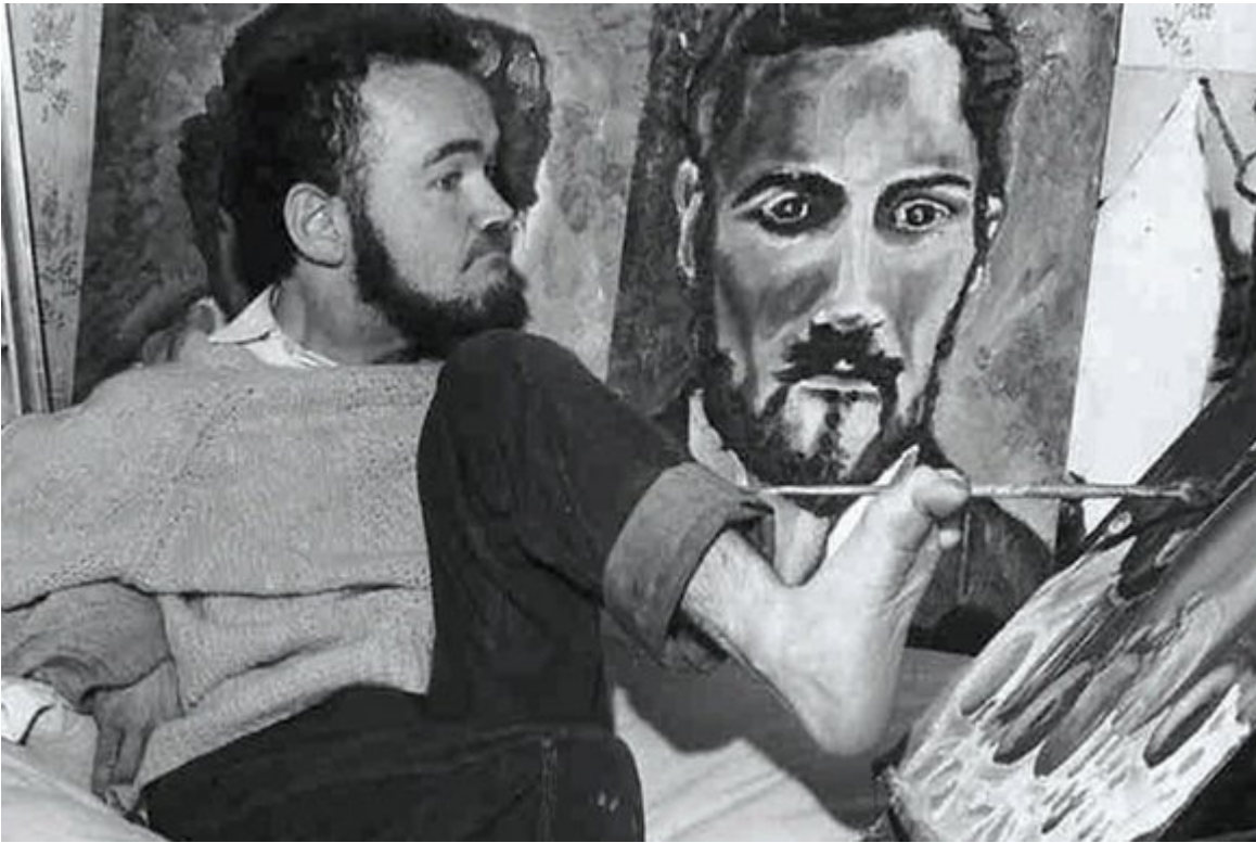
Κρίστι Μπράουν

βλέπεις» όπως επεσήμανε ο μέντορας της, Ντιέγκο Ριβέρα. Ο πίνακας «Self Portrait - The Frame» αγοράστηκε από το Λούβρο και ήταν ο πρώτος λατινοαμερικανού ζωγράφου που τοποθετήθηκε στους τοίχους του μουσείου. Η Κάλο συνήθιζε να λέει: «Τι χρειάζομαι τα πόδια εφόσον έχω φτερά για να πετάξω;»