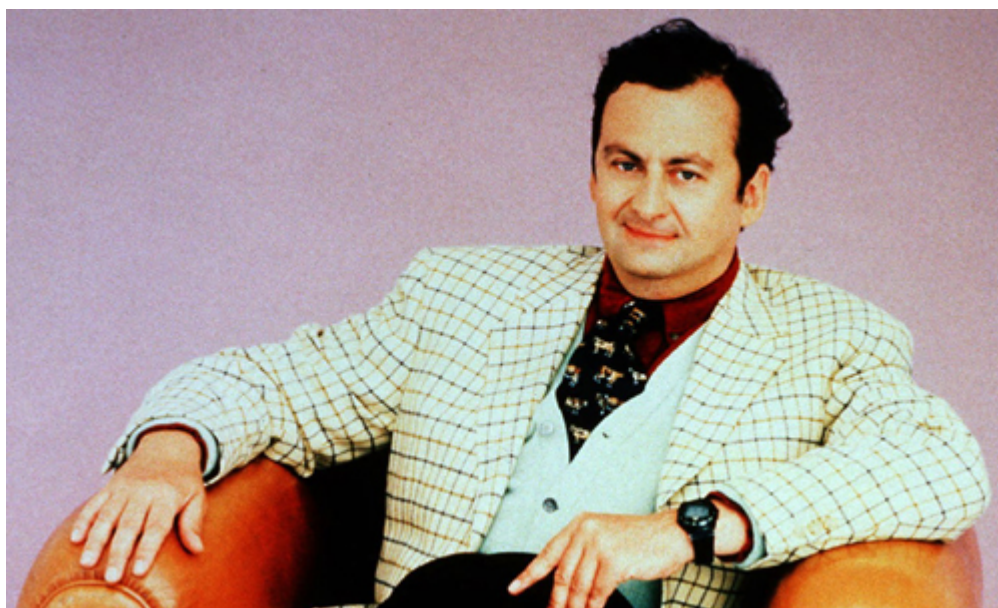
Ζαν Ντομινίκ Μπομπί

Οι πράκτορες τον κυνηγούσαν σαν επίμονες σκιές. Εισχωρούσαν στο μυαλό του και δημιουργούσαν καταστάσεις φόβου και παράνοιας. Όταν ο Τζον Νας δραπέτευε από τον σαγηνευτικό κόσμο των αριθμών εγκλειόταν στις θεωρίες συνωμοσίας που τον κατάτρυχαν. Ο Αμερικανός μαθηματικός, που κέρδισε το βραβείο Νόμπελ στα οικονομικά το 1994 για τα μεγαλοφυή θεωρήματα που απέδειξε στη «Θεωρία των Παιγνίων», αντιμετώπιστηκε ως διάνοια από μικρή ηλικία όταν παρουσίαζε λύσεις σε θεωρήματα των μαθηματικών που θεωρούνται πολύπλοκα. Το 1959 και ενώ βρισκόταν στο αποκορύφωμα της δημιουργικότητας του άρχισαν να τον τυλίγουν οι ακουστικές ψευδαισθήσεις. Απόκοσμοι θόρυβοι, φθονερές σκιές Ρώσων και Αμερικανών πρακτόρων δυνάστευαν την ύπαρξη του και τον οδήγησαν σε εγκλεισμό σε ψυχιατρικά ιδρύματα για τα επόμενα 40 χρόνια. Υποβλήθηκε σε θεραπείες ηλεκτροσόκ και παρά τα αλλεπάλληλα επεισόδια ψύχωσης εξακολούθησε να εργάζεται ως μαθηματικός. Τα τελευταία χρόνια δίδασκε στο πανεπιστήμιο Πρίνστον, όπου απολαμβάνει του σεβασμού και της εκτίμησης της κοινότητας, ιδίως έπειτα από την προβολή της ταινίας «Ένα όμορφο μυαλό» με τον Ράσελ Κρόου να τον υποδύεται στον πρωταγωνιστικό ρόλο.