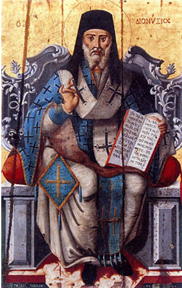
Άγιος Διονύσιος ο Νέος, ο Ζακυνθινός Αρχιεπίσκοπος Αιγίνης. Φορητή εικόνα στο Ναό Αγίου Νικολάου στην Εξωχώρα Ζακύνθου, έργο ιερέως Πέτρου Βόσσου, 1786 μ.Χ. Ο Ναός του Αγίου Διονυσίου στη Ζάκυνθο

Ορθοδοξία και Ορθοπραξία / Συναξαριακές Μορφές