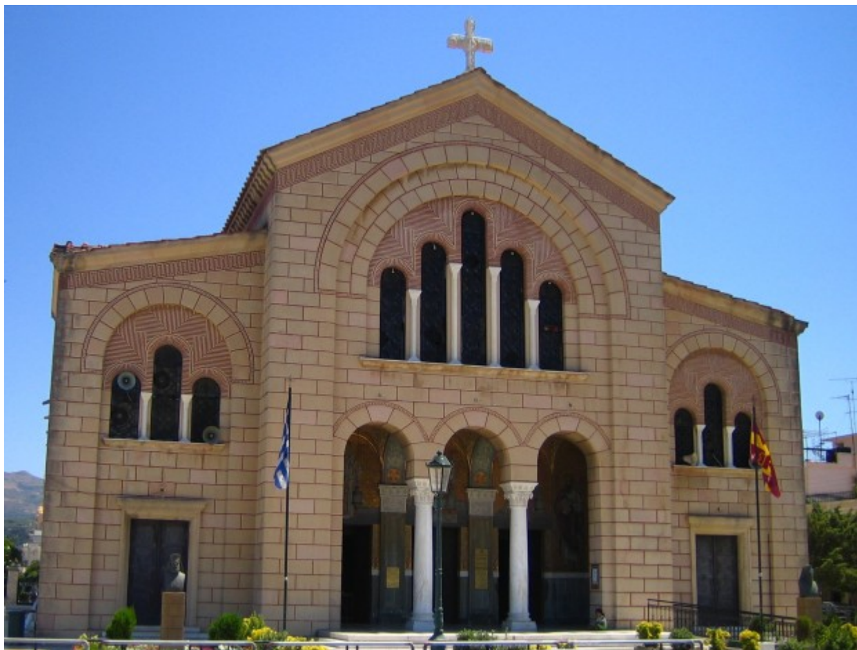
Ο Ναός του Αγίου Διονυσίου στη Ζάκυνθο