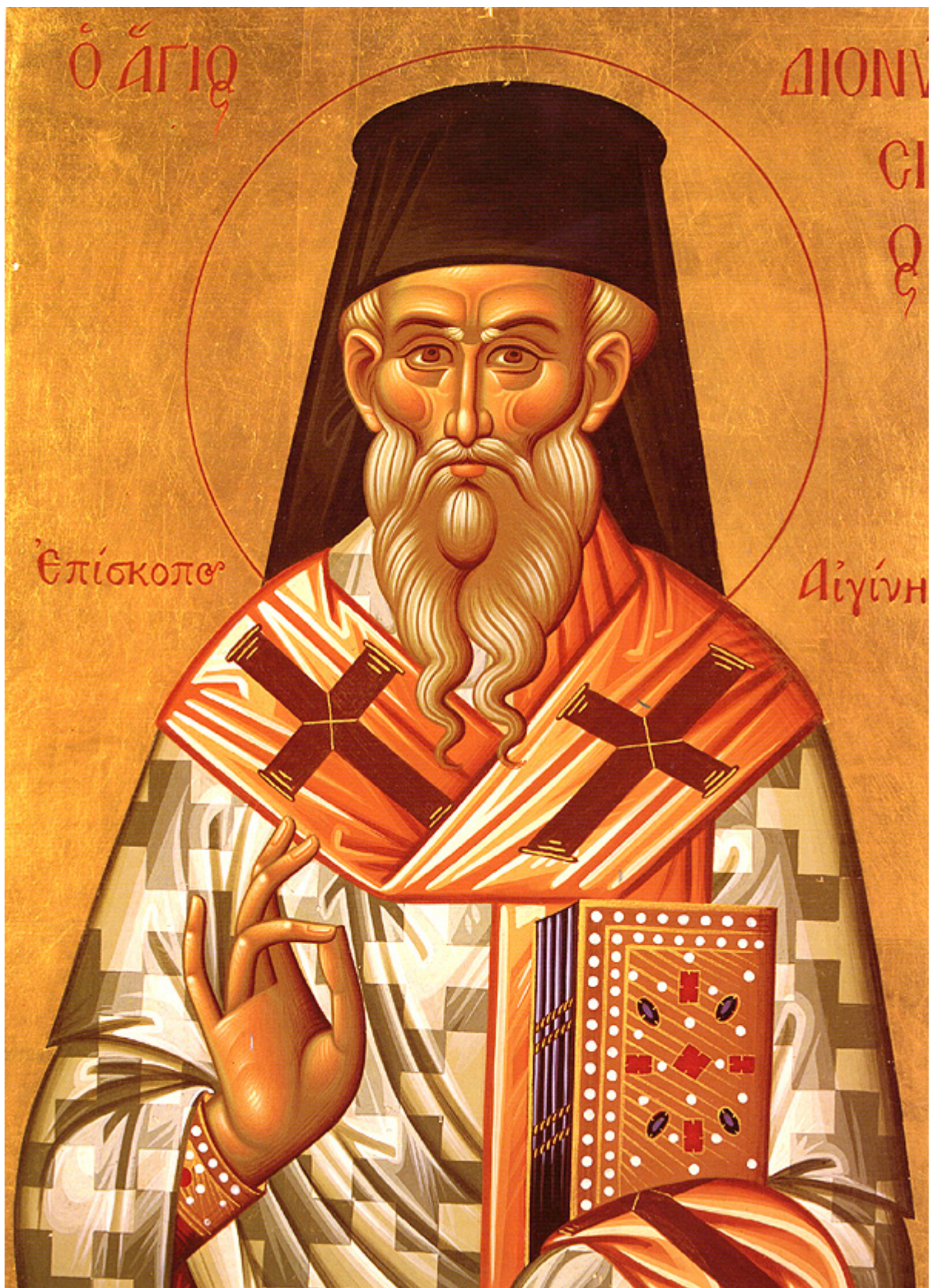
Ἅγιος Διονύσιος ὁ Νεός, ὁ Ζακυνθινός Ἀρχιεπίσκοπος Αἰγίνης