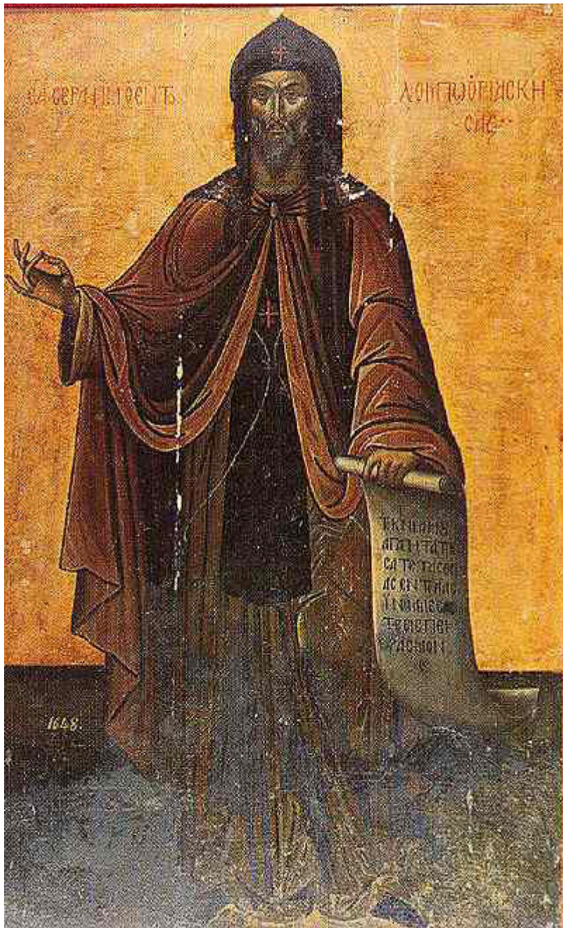
Όσιος Σεραφεΐμ που ασκήτευσε στο όρος Δομπού Λεβαδείας