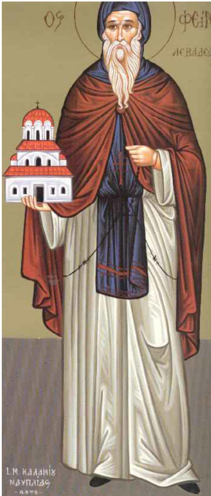
Όσιος Σεραφεΐμ που ασκήτευσε στο όρος Δομπού Λεβαδείας