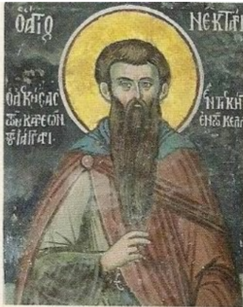
Όσιος Νεκτάριος ό Καρεώτης. Λεπτομέρεια τοιχογραφίας νάρθηκος Ι. Μ. Ξηροποτάμου (1783).