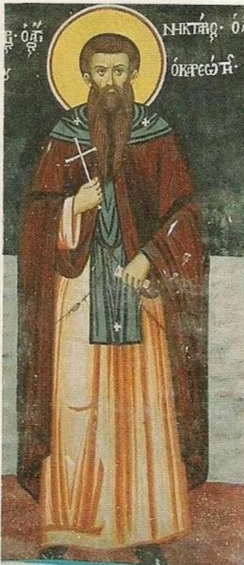
Όσιος Νεκτάριος ό Καρεώτης. Τοιχογραφία Τραπεζης Ι. Μ. Βατοπεδίου (1786).