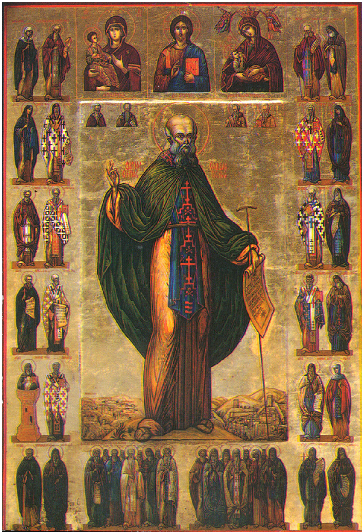
Άγιος Σάββας ο Ηγιασμένος