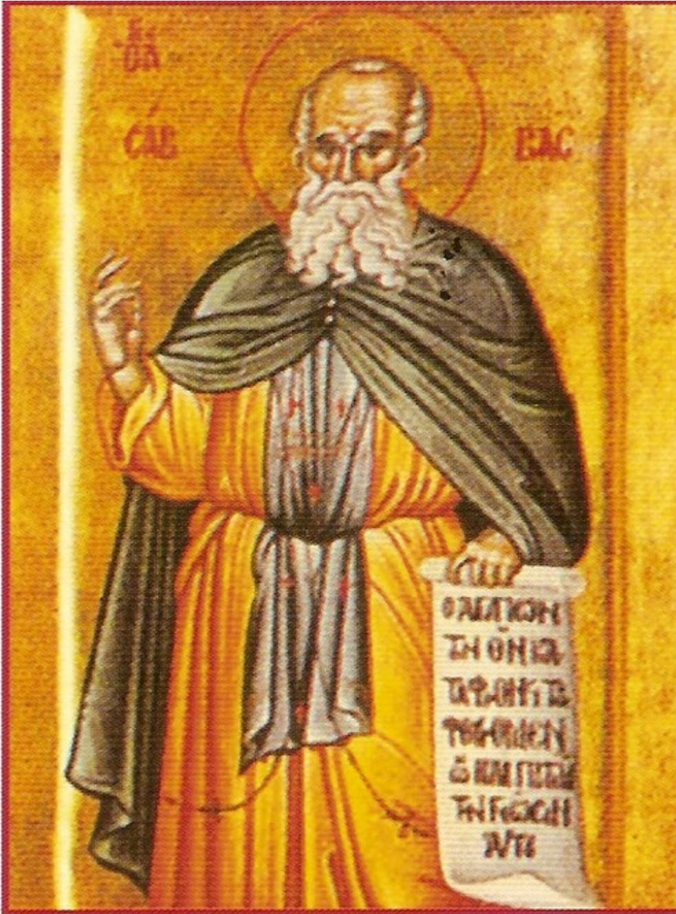
Άγιος Σάββας ο Ηγιασμένος

Ωφθης υποτύπωσις και κανών, θεοφόρε Σάββα, ως του Πνεύματος θησαυρός, Οσίων Πατέρων, ρυθμίζων και ιθύνων, προς κλήρον αφθαρσίας τους πειθομένους σοι.