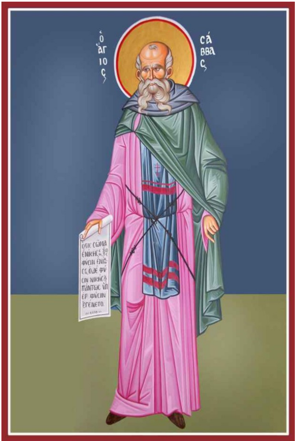
Άγιος Σάββας ο Ηγιασμένος – Καζακίδου Μαρία© (byzantineartkazakidou.blogspot.com)