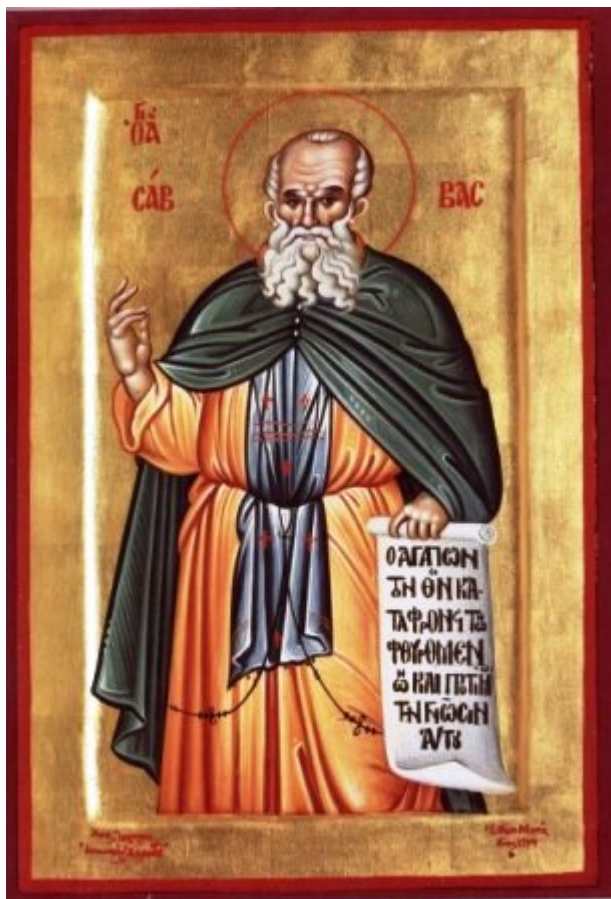
Άγιος Σάββας ο Ηγιασμένος