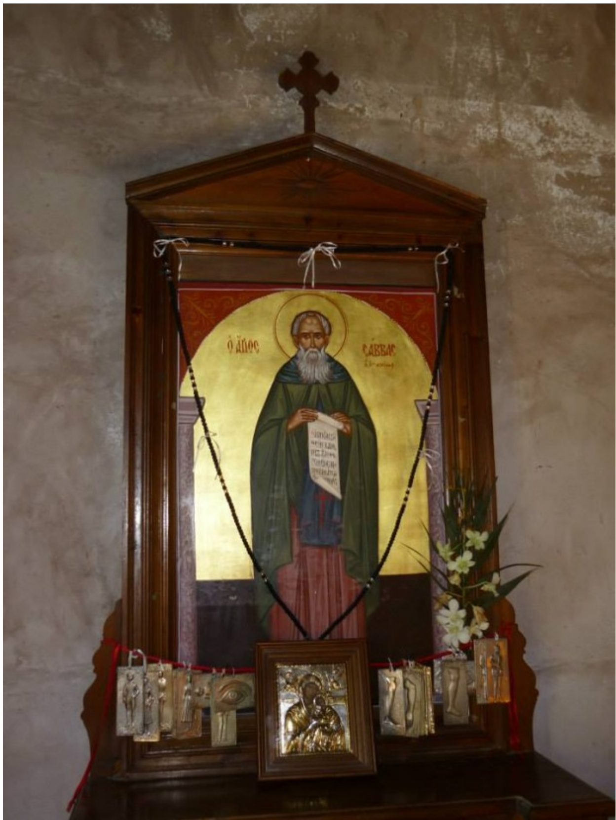
Άγιος Σάββας ο Ηγιασμένος - Ι.Ν. Αγίου Σάββα Ροδιάς