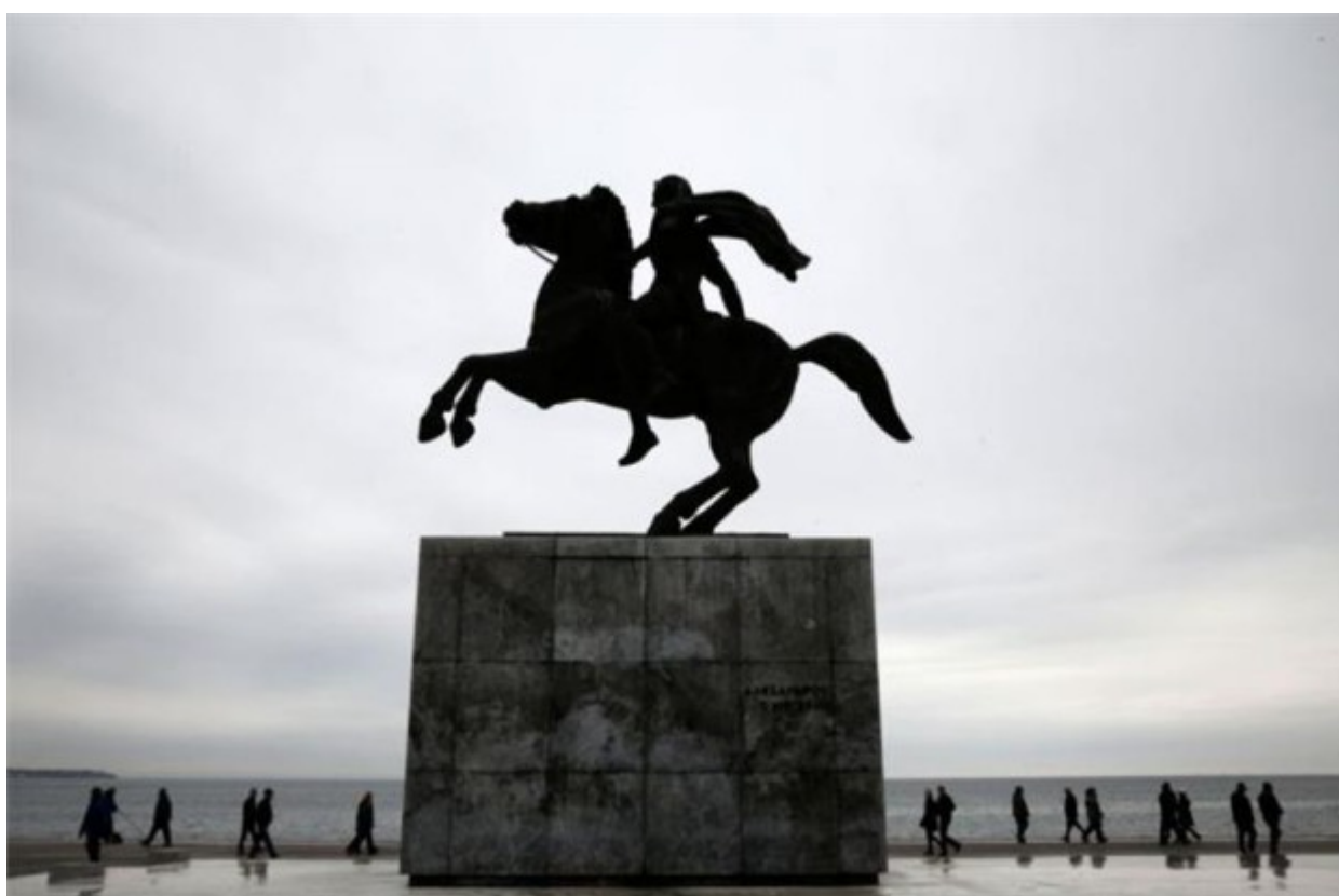
Το άγαλμα του Μεγάλου Αλεξάνδρου δεσπόζει και αναδεικνύεται στο ανακαινισμένο παραλιακό μέτωπο της Θεσσαλονίκης.