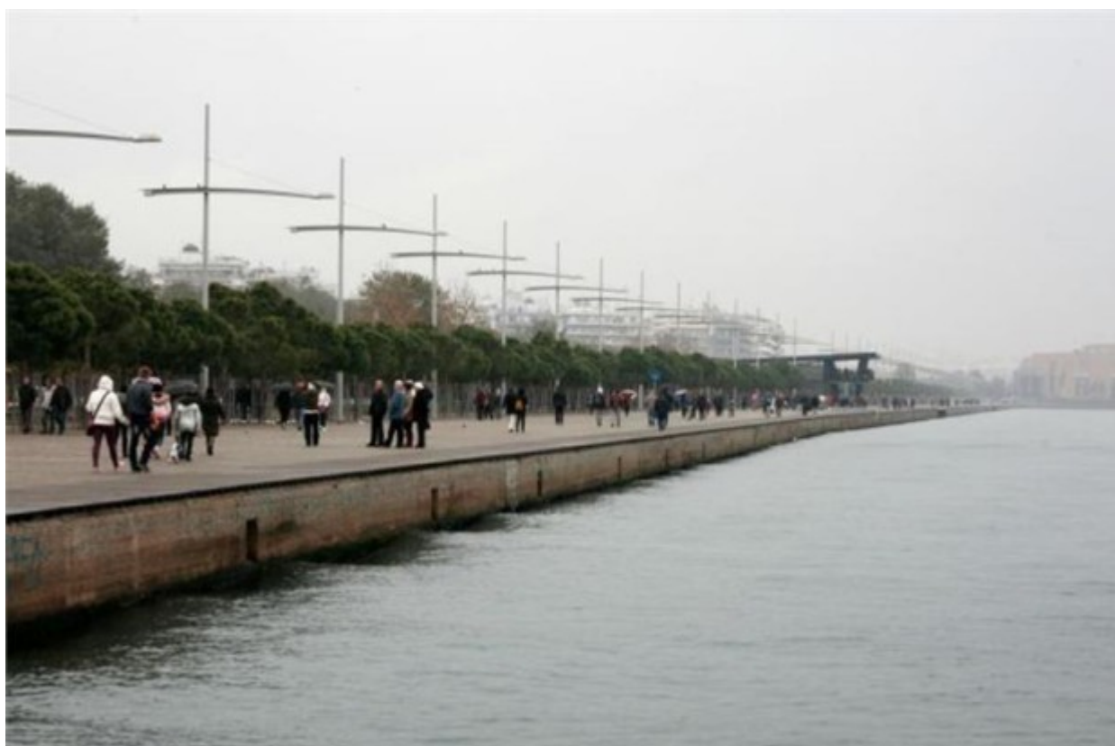
Υστερα από δύο χρόνια οι πολίτες και οι επισκέπτες της Θεσσαλονίκης μπόρεσαν την Κυριακή να βαδίσουν ανεμπόδιστα στα πέντε χλμ. της παραλίας