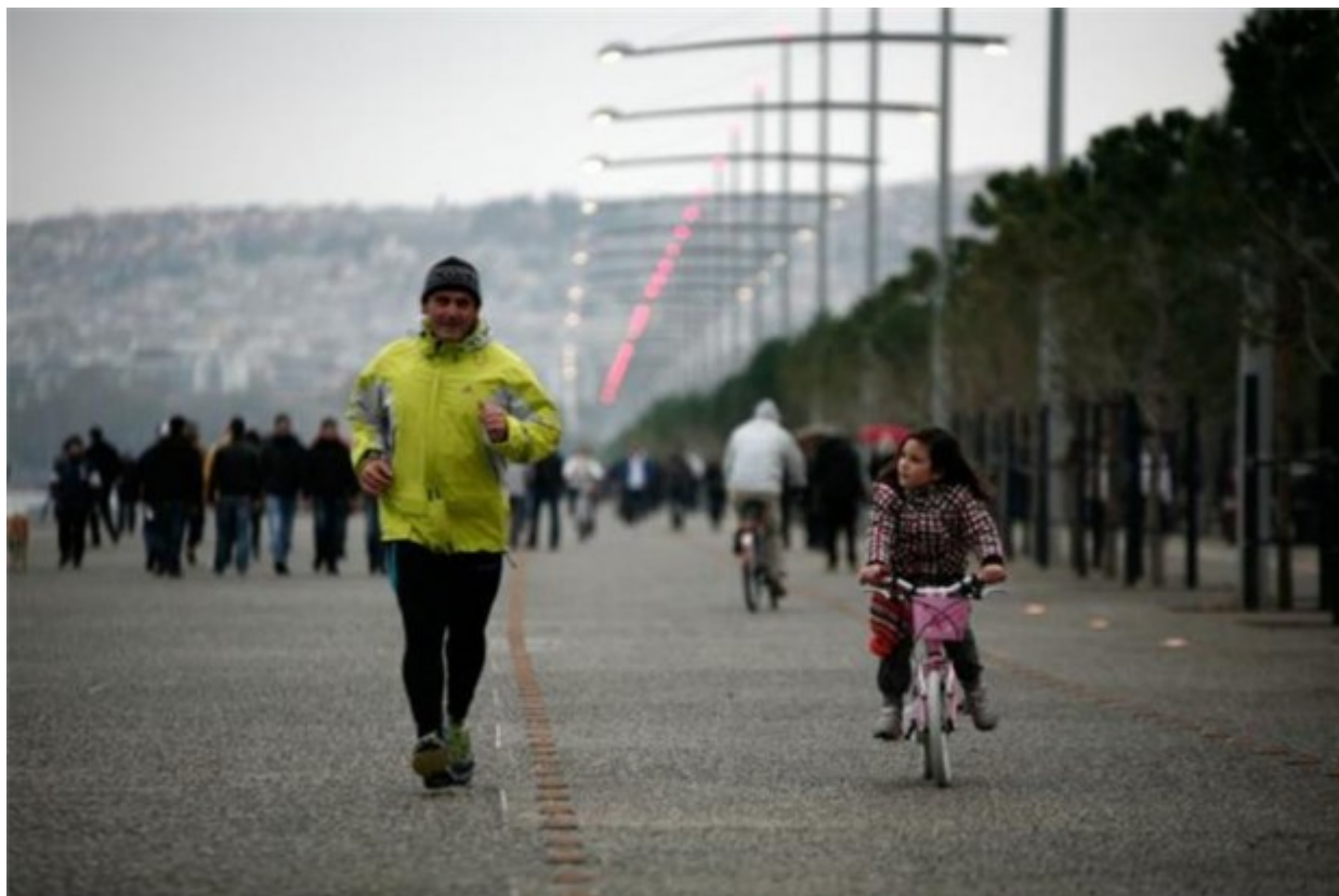
Ποδήλατο, τρέξιμο και άλλες αθλητικές δραστηριότητες βρίσκουν τον χώρο τους στη νέα παραλία της Θεσσαλονίκης.