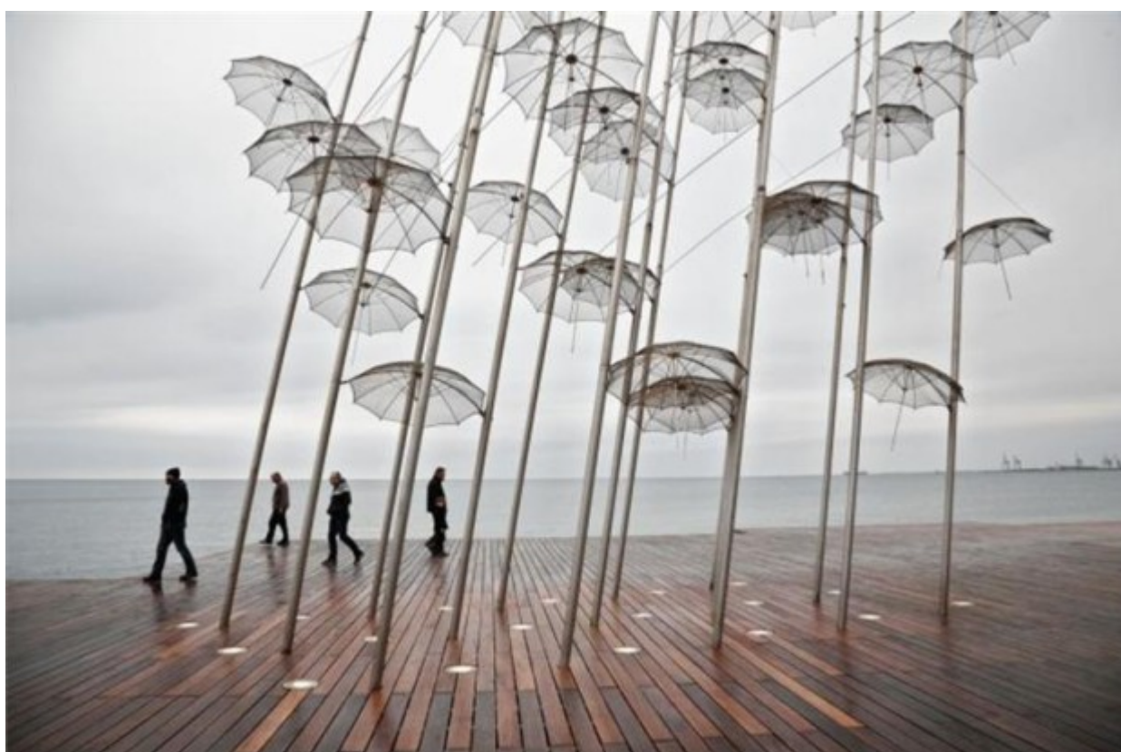
Η βροχή δημιούργησε ένα «αγγελοπουλικό» σκηνικό κατά την παράδοση την Κυριακή στο κοινό της νέας παραλίας της Θεσσαλονίκης