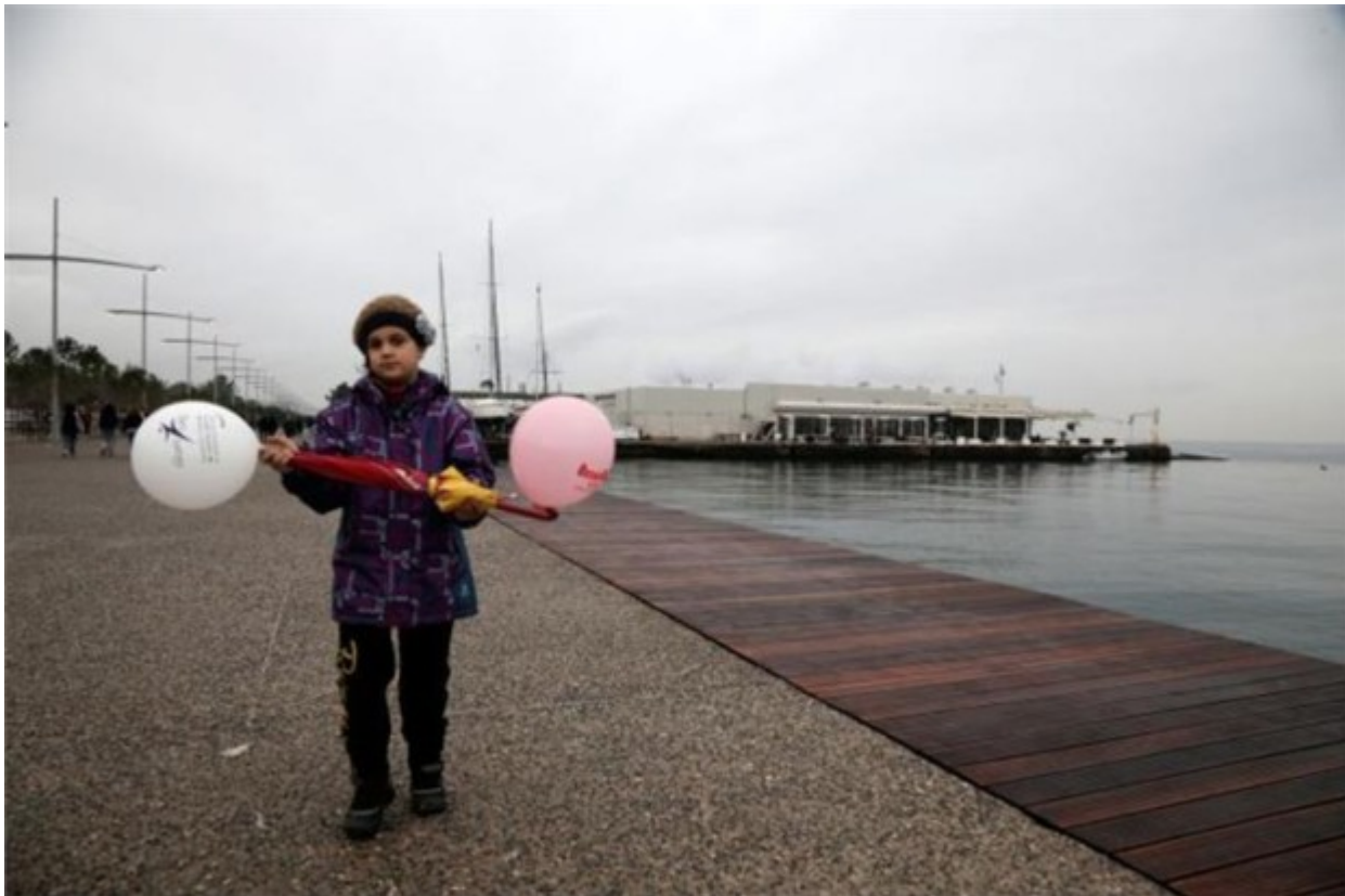
Υπό βροχή καλωσόρισαν οι Θεσσαλονικείς τη νέα παραλία της πόλης (Fosphotos) Πηγή: FOS Photos- Φωτό:tanea.gr

Δεκάδες πολίτες αφήφισαν τη βροχή και καλωσόρισαν τη νέα παραλία της Θεσσαλονίκης (Fosphotos).