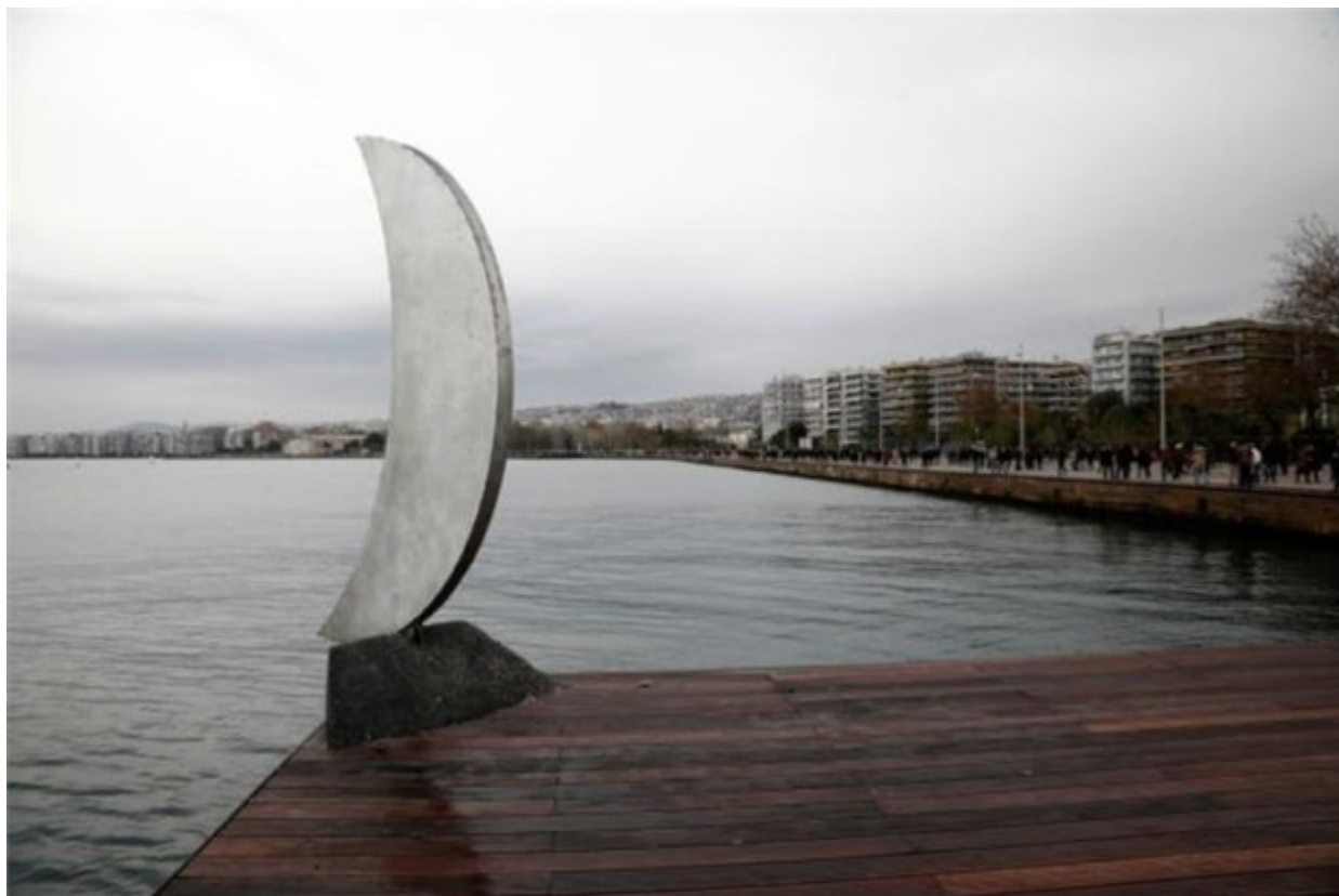
Πινελιές ντιζάιν στην ανακαινισμένη παραλία της Θεσσαλονίκης.