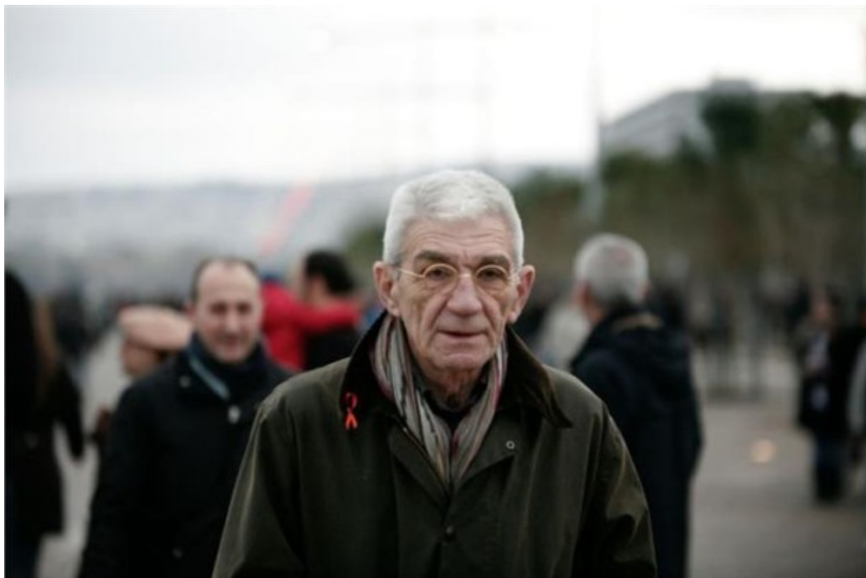
Ο δήμαρχος Θεσσαλονίκης Γιάννης Μπουτάρης εγκαινίασε τα πάρκα της νέας παραλίας της πόλης.