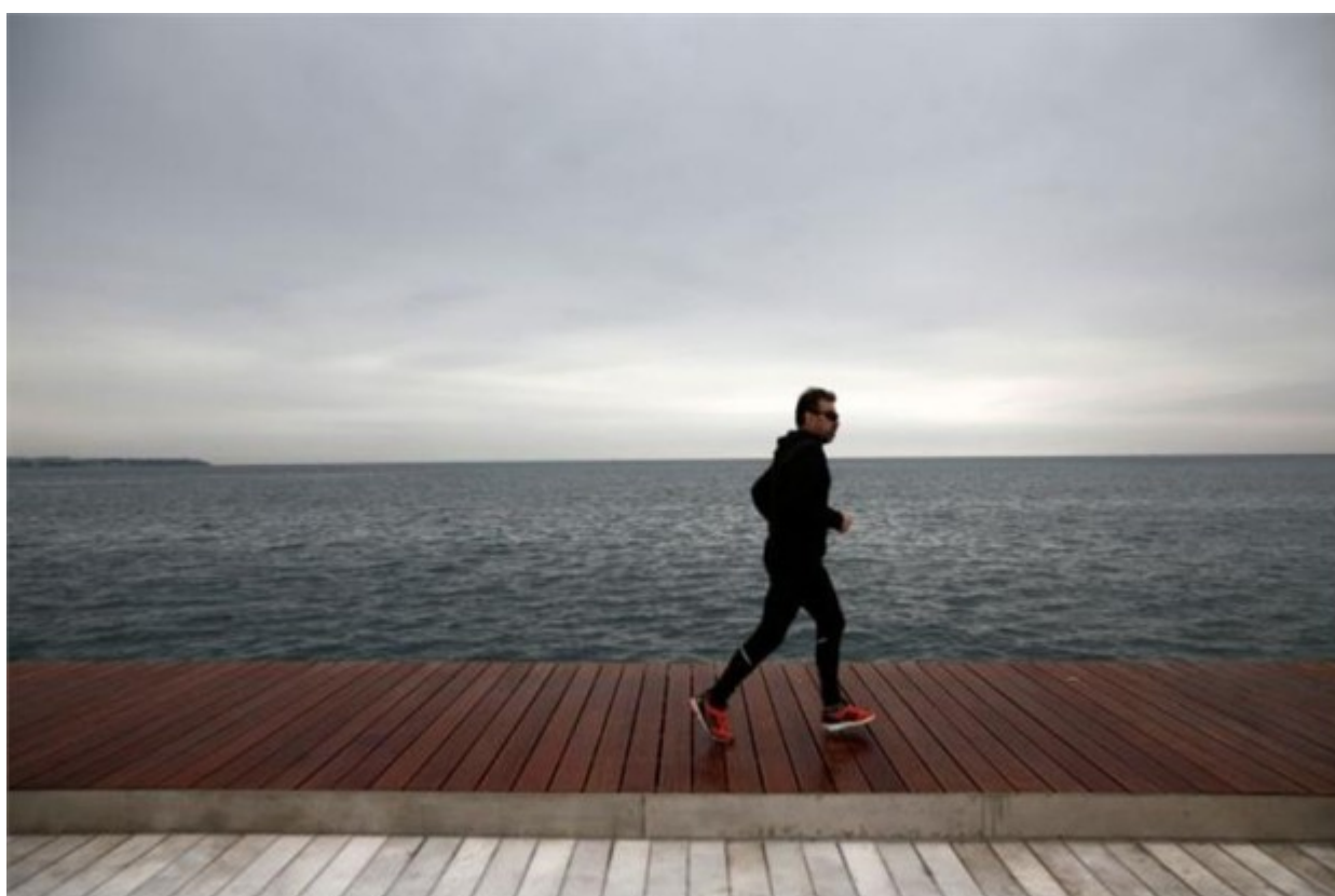
Η βροχή δεν εμπόδισε τους Θεσσαλονικείς να γυμναστούν τρέχοντας στην ανακαινισμένη παραλία της πόλης