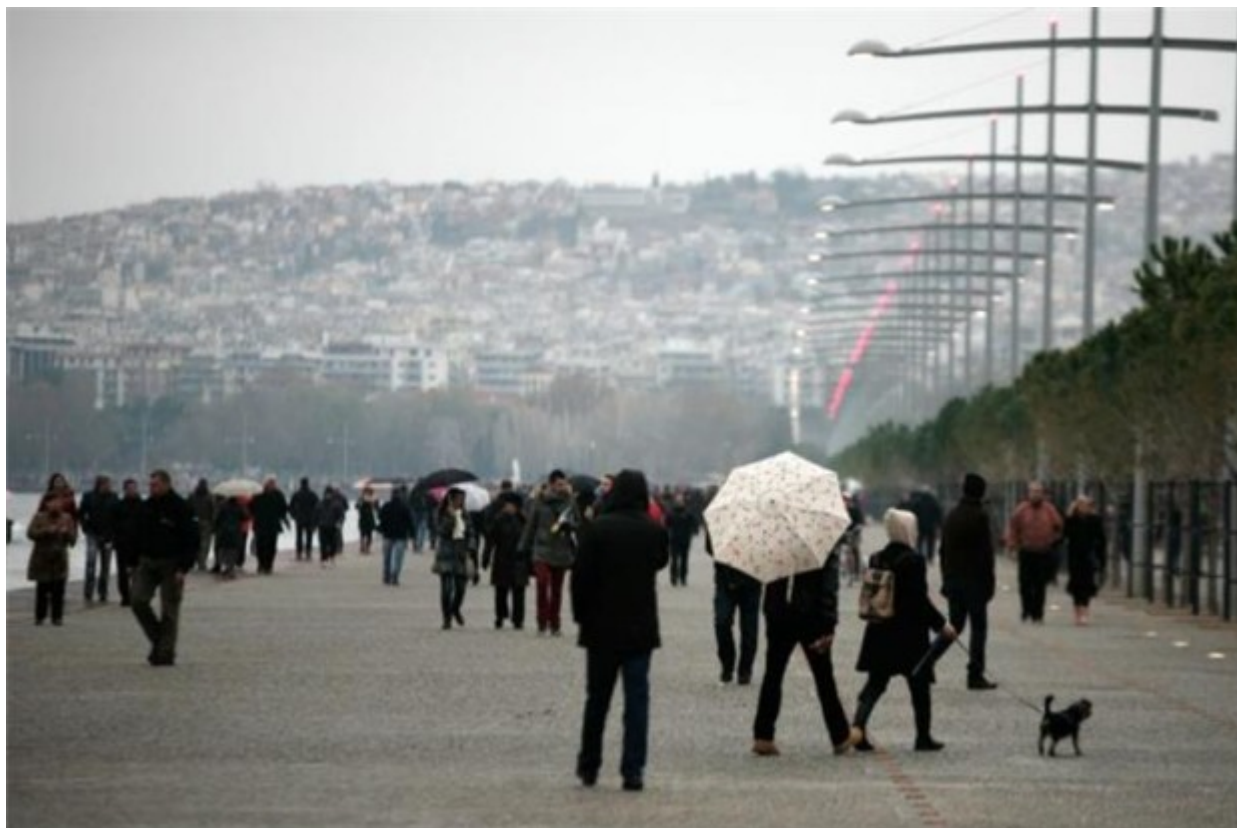
Δεκάδες πολίτες αφήφισαν τη βροχή και καλωσόρισαν τη νέα παραλία της Θεσσαλονίκης.