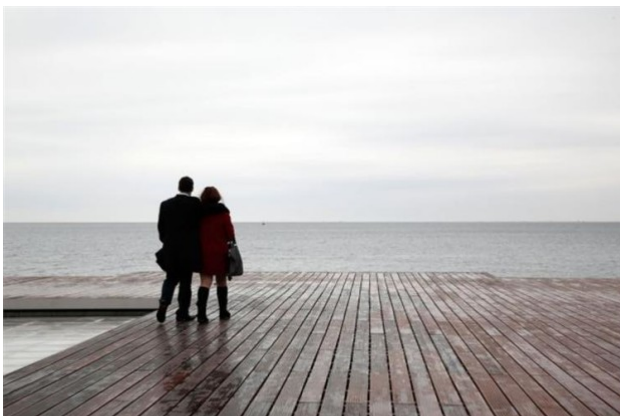
Υπό βροχή που δημιούργησε ένα «αγγελοπουλικό» σκηνικό παραδόθηκε την Κυριακή στο κοινό η νέα παραλία της Θεσσαλονίκης