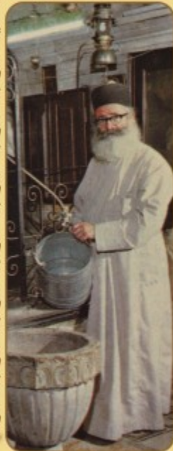
Ο Ιερομάρτυς Φιλομένης έν ζωή στο Φρέαρ του Ιακώβ.