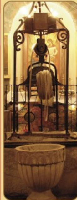
Το Φρέαρ του Ιακώβ της Σαμαρείτιδος.