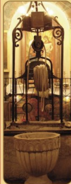
Το Φρέαρ του Ίακώβ ἢ τῆς Σαμαρείτιδος.

Ο Άγιος Φιλομένης (κατά κόσμον Σοφοκλής) γεννήθηκε στη Λευκασία, στις 15 Οκτωβρίου 1913. Παιδιά του ήταν οι αδελφές Ευαγγελία και Μαρθολογή. Ήταν δίδυμος αδελφός με τον π. Ελισάιο (κατά κόσμον Αλιζάνδρος) και από μικρή ηλικία γράφει την αγάπη που είχαν προς τον Θεό και γι' αυτό από πολύ νωρίς άναψε μέσα τους η έπιθυμία για τη μοναχική ζωή. Το 1927, σε ηλικία μόλις 14 ετών άναρχησαν και οι δύο για την Ἁγία Μονή Σαμαρειτίσσης, αφού πήραν την πηγή του νεκρωμένου τους, αλλά και τὴν εὐλαβὴν γυναικὸν τους. Εκεί έμειναν 6 περίπου χρόνια, όταν ὁ Ἐπίσκοπος τοῦ Παναγιώτου Ἰωάννου τους πήρε γὰρ νὰ προσέχουν στὸ Πανάγιον τὸ Πατριαρχεῖον στὴ Ἱεροσόλεια, ὅπου βρέθηκαν τὸ 1934, μαθητὴς στὴν Σχολὴ τῆς Ἁγίας Σαῦν.