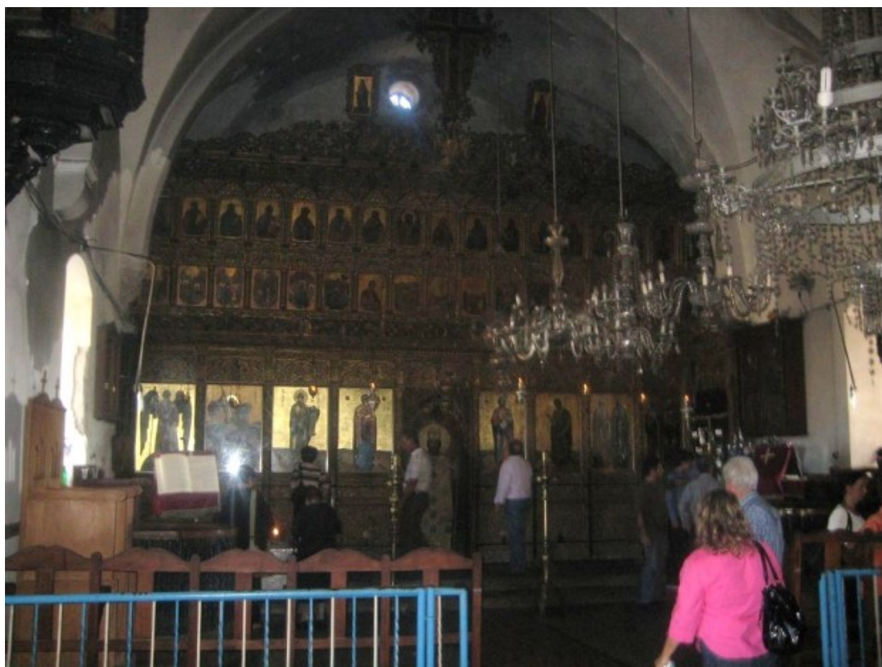
ΜΟΝΑΣΤΗΡΙ ΑΠΟΣΤΟΛΟΥ ΑΝΔΡΕΑ