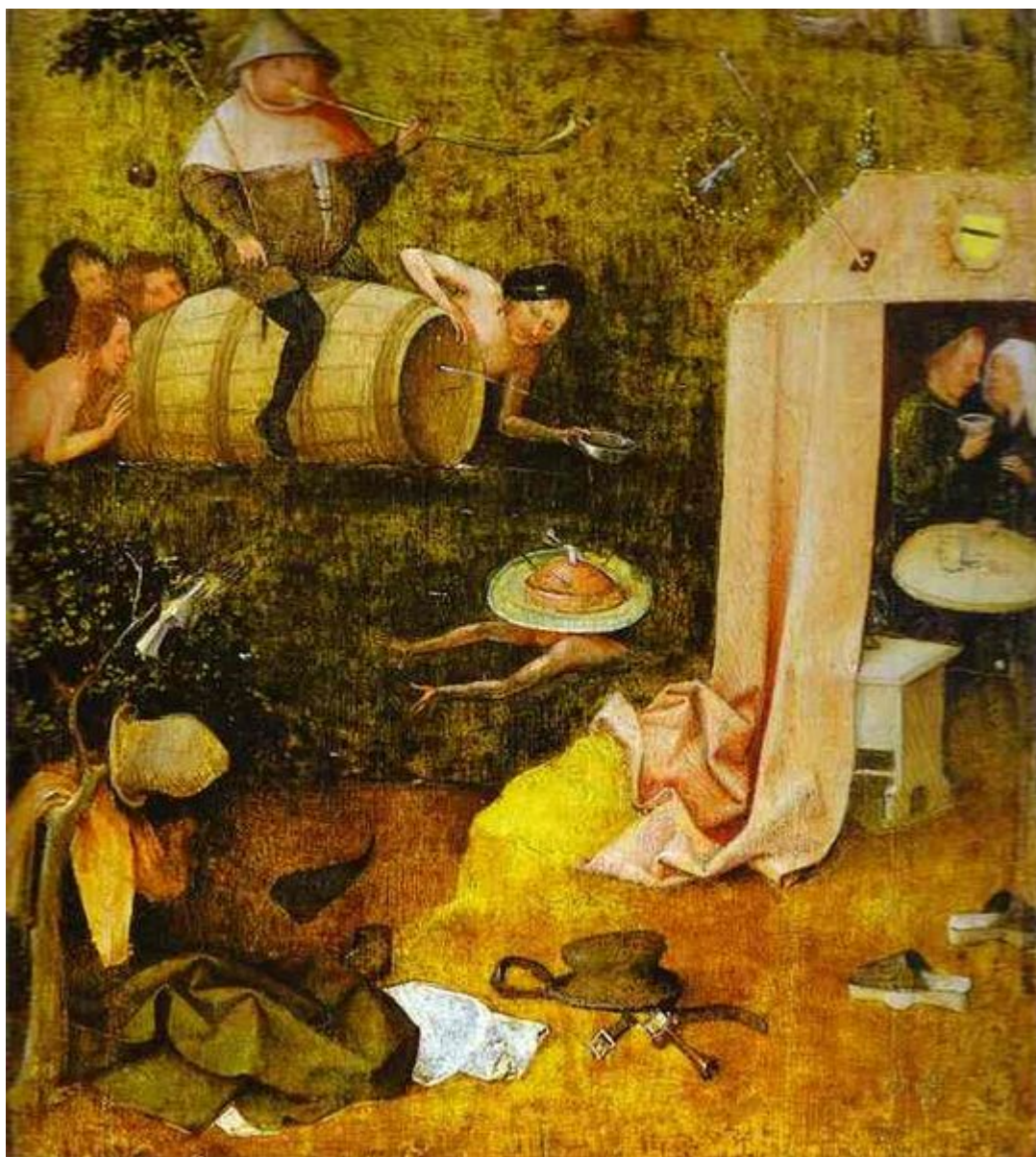
Allegory of Gluttony and Lust. Έργο του Ιερώνυμου Μπός (1490-1500)

Ο λόγος για το πάθος της γαστριμαργίας δεν θα παύσει να είναι επίκαιρος, για όσο χρόνο ο άνθρωπος θα εξακολουθεί να... τρώγει. Διότι η γαστριμαργία, επειδή ακριβώς είναι ένα ευχάριστο πάθος, είναι αμφίβολο εάν προ του θανάτου εγκαταλείπει τον άνθρωπο. «Θαυμάζω, ει μη τις, τάφον οικήσας, εγένετο ταύτης ελεύθερος» μας βεβαιώνει ο Αγ. Ιωάννης της Κλίμακας (Κλίμαξ έκδ. Παρακλήτου σελ. 185). Αλλά και η εποχή μας, ως εποχή αφθονίας και καλοζωίας, έχει δημιουργήσει το πλέον κατάλληλο κλίμα, για να καλλιεργείται και να γιγαντώνεται το πάθος αυτό στη ζωή του συγχρόνου ανθρώπου. (περισσότερα...)