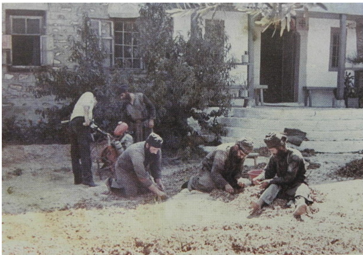
Μοναχοί τῆς Συνοδείας τοῦ Γέροντος Ἐφραίμ καθαρίζουν φουντούκια ἀπό τό κτῆμα τοῦ Κελλίου.

Οι φωτογραφίες είναι από το έντυπο που συνοδεύει το CD: