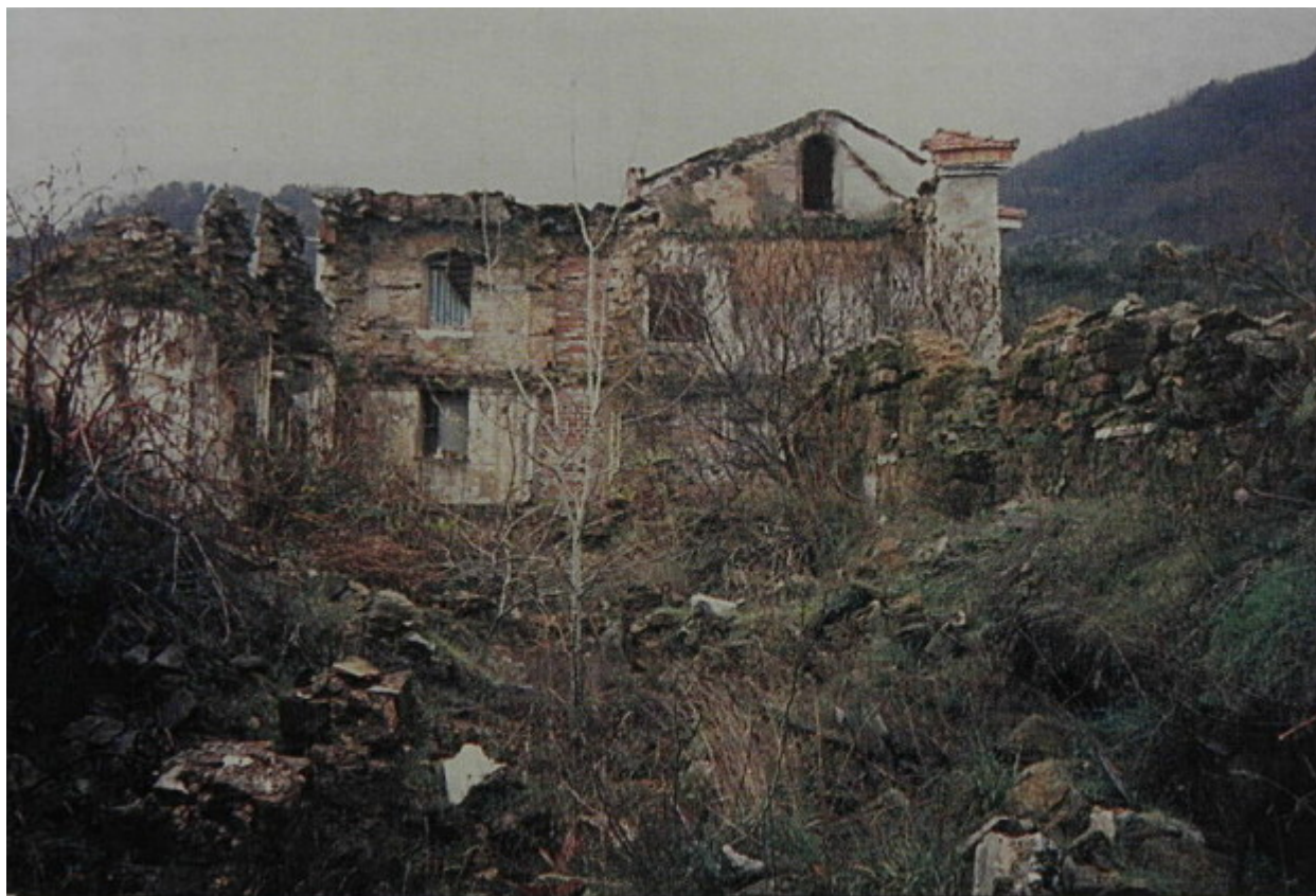
Τό έσωτερικό τῶν κελλίων μετά τήν καταστροφική πυρκαγιά τοῦ 1976.