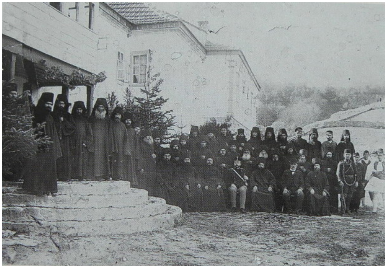
Ἡ πολυπληθὴς συνοδεία Ῥώσων μοναχῶν στὴν κεντρικὴ ἐσωτερικὴ εἴσοδο τοῦ Κελλίου.

Το 1863 παραχωρήθηκε ἀπὸ τὴν κυρίαρχο Μονὴ τῆς Μεγίστης Λαύρας, στὴν ὁποία πάντα ἀνήκε, σε Ῥώσους μοναχοὺς. Ὁ Γέροντας, Ἱερομόναχος Ἰγνατίος, στὸν ὁποῖο παραχωρήθηκε, ἦταν ὁ ἐκπρόσωπος τοῦ Πατριάρχῃ τῆς Μόσχας στὴν Κωνσταντινούπολη. Αὐτὸς ἀνακατασκεύασε τὸ Ναό, προσθέτοντας στὸν πρῶτο ὄροφο παρεκκλήσι ἀφιερωμένο στὴ Σκέπη τῆς Ὑπεραγίας Θεοτόκου, δίπλα στα ερείπια τοῦ ἀρχαίου Ναοῦ τῶν Ἀρχαγγέλων.