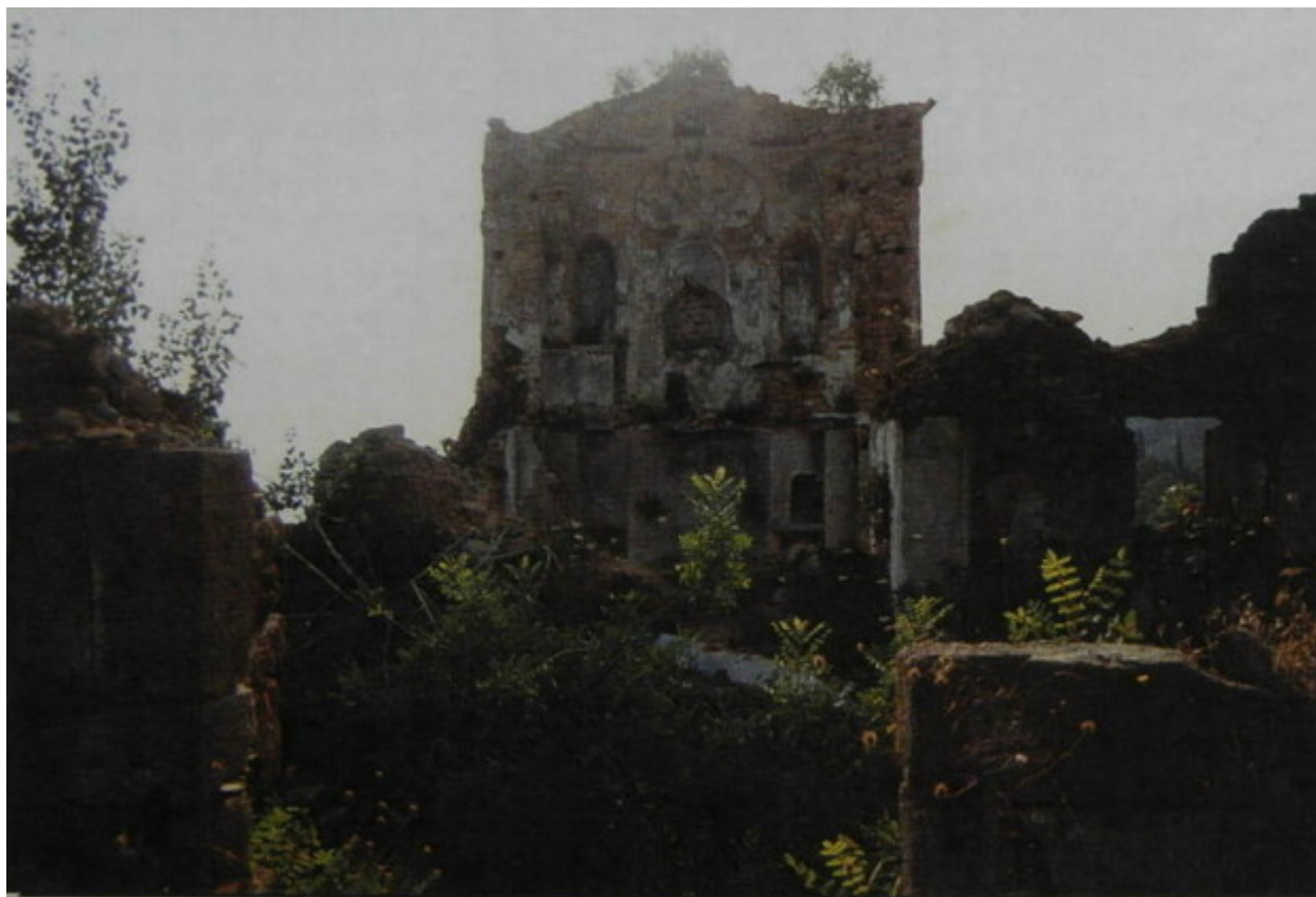
Ὁ δυόροφος Ναός τοῦ Κελλίου μετὰ τὴν πυρκαγιά.