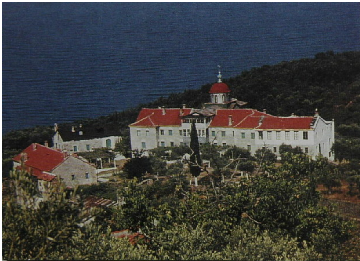
Τό Κελλί τοῦ ἁγίου Ἀρτεμίου πρό τῆς καταστροφῆς του ἀπό τήν πυρκαγιά τοῦ 1976.

Ἀς δούμε τι ἀναφέρει γιά τό Κελλί ὁ Γεράσιμος Σμυρνάκης (1902):