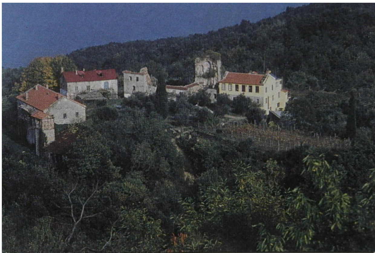
Τό Κελλί τοῦ ἁγίου Ἀρτεμίου ὅπως τό παρέλαβε, τό 1987, ὁ μοναχός Εὐθύμιος.

Μετά την πυρκαγιά του 1976, το Κελλί παρεδόθη στην Κυρίαρχο Μονή από την οποία μετά από έντεκα χρόνια, το 1987, το παραλαμβάνει, σε πολύ κακή κατάσταση, ο εκ της Ιεράς Μονής Φιλοθέου παλαιός Αγιοαρτεμίτης μοναχός Ευθύμιος, ο οποίος έκτοτε αγωνίζεται μαζί με φίλους και ευλαβείς πιστούς και σεβόμενους τον Μεγαλομάρτυρα προσκυνητές να το αναστυλώσει και να το κάνει πάλι λειτουργικό όπως πριν. Οι φωτογραφίες που ακολουθούν είναι από αυτή την προσπάθεια: