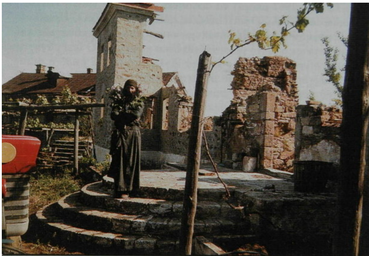
Ὁ μοναχὸς Εὐθύμιος στὴν εἴσοδο τοῦ κατεστραμμένου Κελλιοῦ.