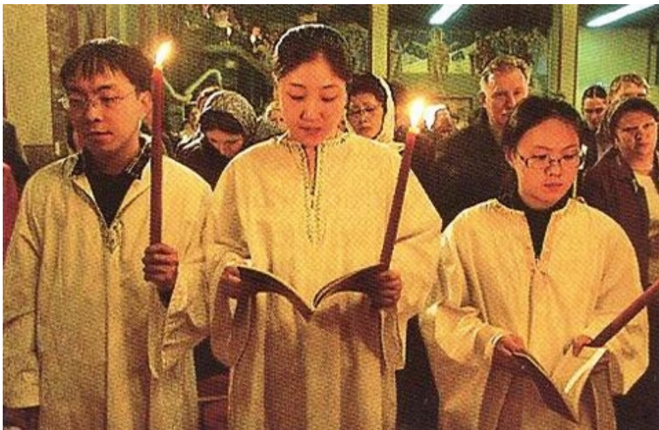
Ομαδική Βάπτιση νέων Κορεατών

Μισάνοιξε δειλά την πόρτα του Γραφείου του Ιεραποστολικού Κέντρου και στάθηκε αμήχανα Ξαφνιαστήκαμε. Αύτη ή τόσο αυθόρμητη φοιτήτρια και Κατηγήτριά μας, που τόσο άνετα φερόταν πάντα, τι έπαθε σήμερα;