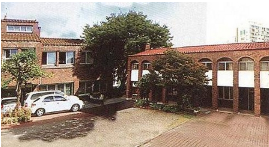
Το Ορθόδοξο Ιεραποστολικό Κέντρο στην Σεούλ

- Σωστό θαύμα! απάντησε χαρούμενα. Στην Εκκλησία σας ερχόταν κρυφά από τον πατέρα της. Εγώ το ήξερα. Κι ένιωθα τέτοια χαρά! Σαν να'ρχόμουν κι η ίδια. Μερικές φορές μάλιστα, την έβαζα και μου ιστορούσε αυτά που της μαθαίνατε στην κατήχηση. Σαν μου είπε, όμως, πως χρειαζόταν η έγκριση του πατέρα για να βαπτισθεί, σκοτείνιασε η ψυχή μου. Και το παιδί φοβόταν. Αποφασίσαμε να του το πει πρώτα αυτή. Τί ήταν αυτό! Θηρίο έγινε. Όχι συγκατάθεση για Βάπτισμα δεν της έδωσε, μα και της απαγόρευσε να ξαναπατήσει στην Εκκλησία.