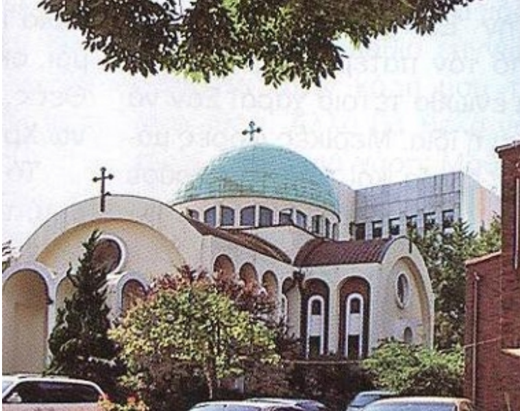
Ο Ιερός Ναός Αγίου Νικολάου στην Σεούλ, πρωτεύουσα της Νοτίου Κορέας

- Ω, μεγάλη μας χαρά! Που είναι; Προχώρησα προς την πόρτα. Μιά ευγενική κυρία έσπευσε να χαιρετήσει με την βαθιά πατροπαράδοτη κορεάτικη υπόκλιση. Μίλησα πρώτη;