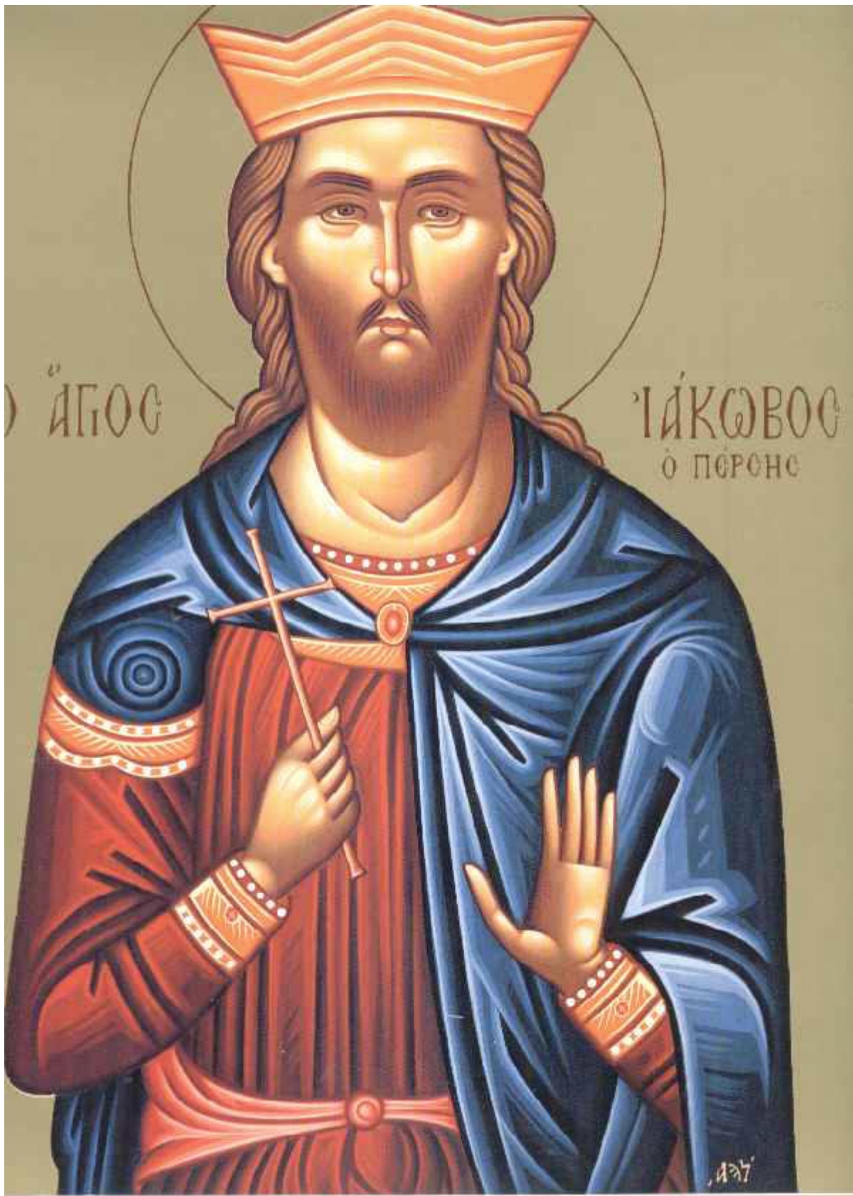
Άγιος Ιάκωβος ο Πέρσης ο Μεγαλομάρτυρας