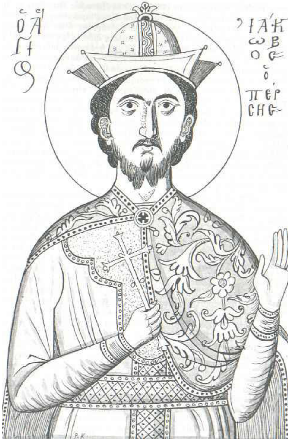
Άγιος Ιάκωβος ο Πέρσης ο Μεγαλομάρτυρας