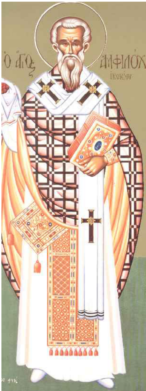
Άγιος Αμφιλόχιος Επίσκοπος Ικονίου