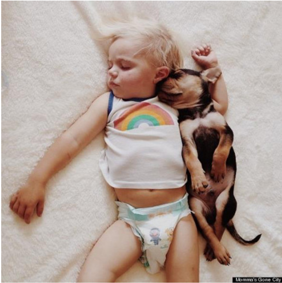
Momina's Gone City