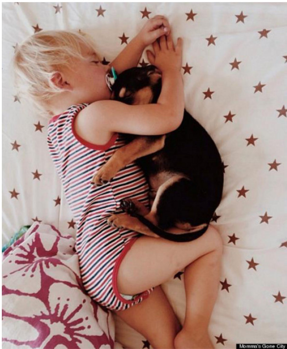
Momma's Gone City