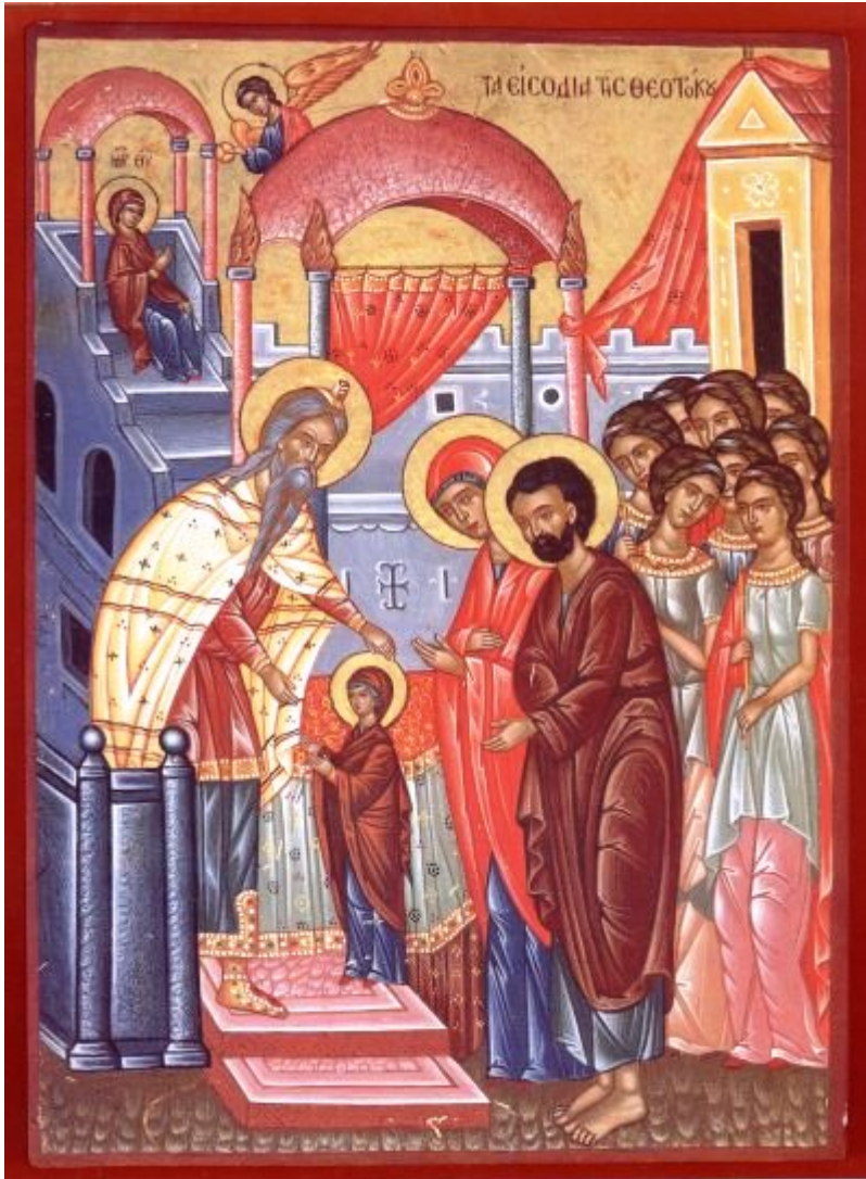
Εισόδια της Θεοτόκου