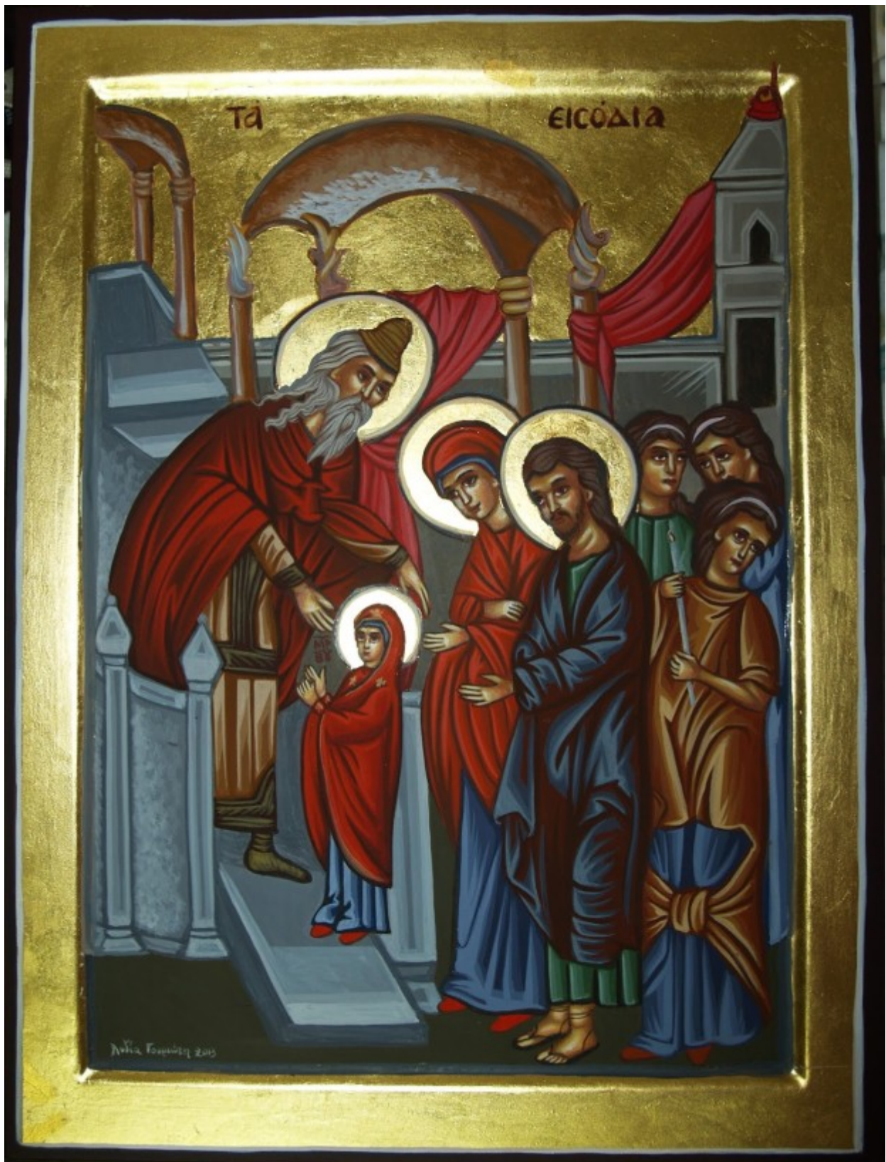
Εισόδια της Θεοτόκου - Λυδία Γουριώτη©