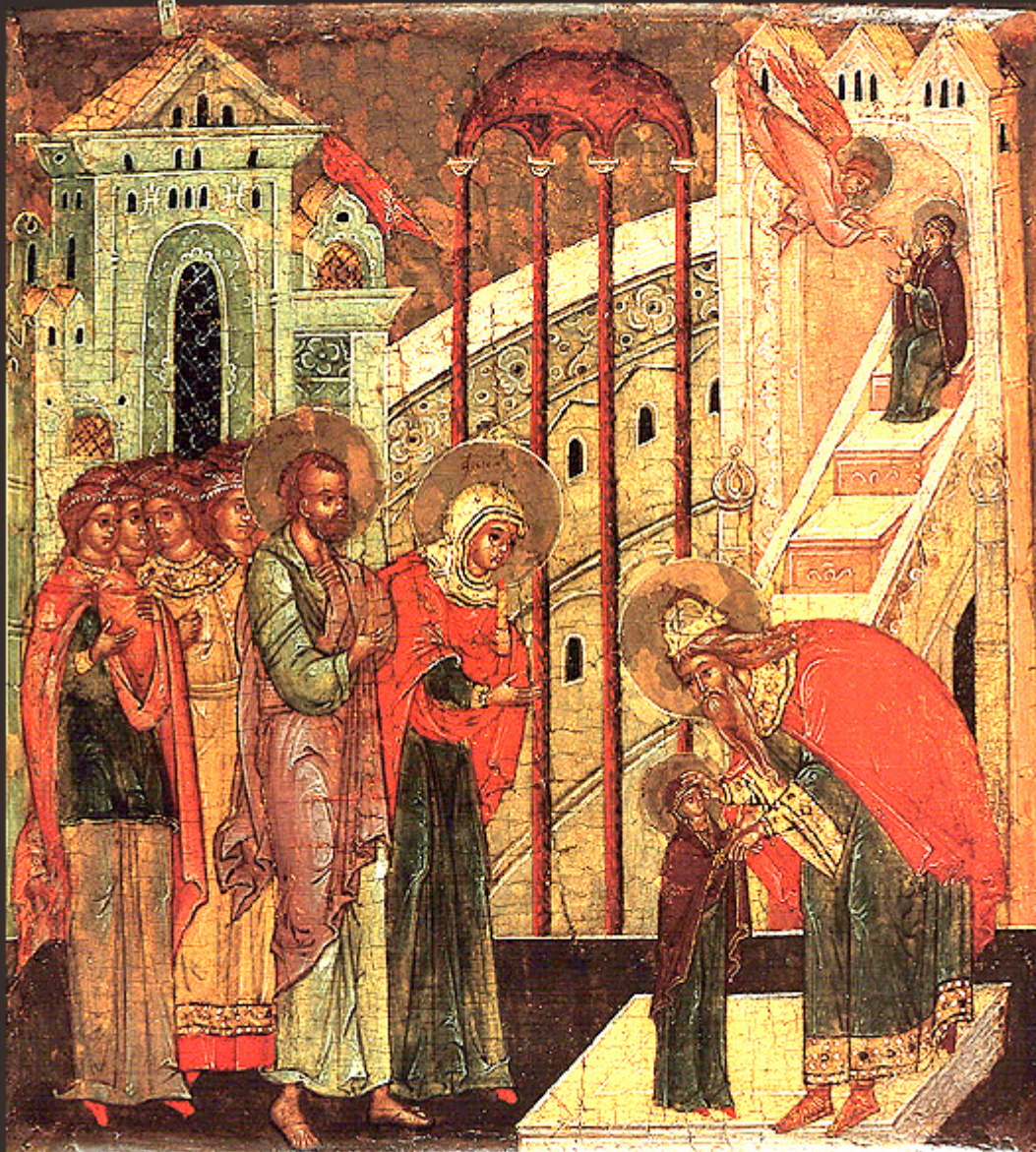
Εισόδια της Θεοτόκου