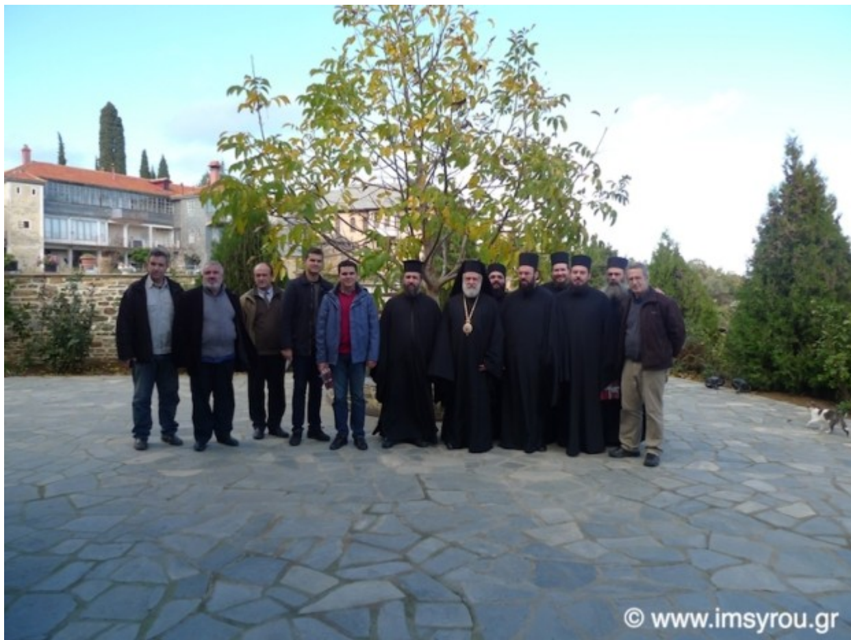
ΙΕΡΑ ΜΟΝΗ ΞΕΝΟΦΩΝΤΟΣ ΑΓΙΟΥ ΟΡΟΥΣ - ΙΕΡΑ ΑΓΡΥΠΝΙΑ