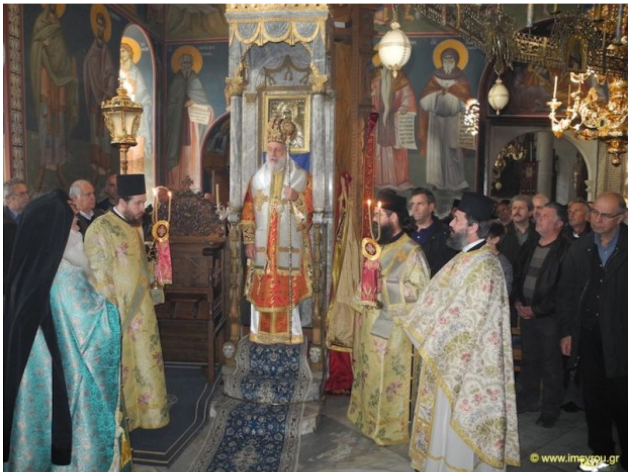
ΕΠΙΣΚΕΨΗ ΤΟΥ ΣΕΒΑΣΜΙΩΤΑΤΟΥ κ. ΔΩΡΟΘΕΟΥ Β΄ ΣΤΗΝ ΙΕΡΑ ΕΠΙΣΤΑΣΙΑ ΚΑΙ ΠΡΟΣΚΥΝΗΜΑ ΣΤΟ ΠΡΩΤΑΤΟ ΚΑΙ ΤΙΣ ΙΕΡΕΣ ΜΟΝΕΣ ΕΣΦΙΓΜΕΝΟΥ, ΙΒΗΡΩΝ ΚΑΙ ΠΑΝΤΟΚΡΑΤΟΡΟΣ