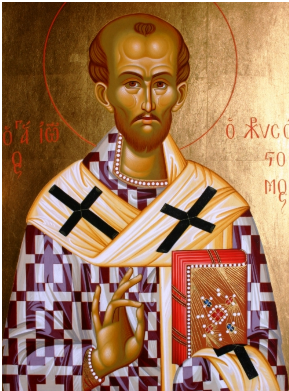
Άγιος Ματθαίος Απόστολος και Ευαγγελιστής