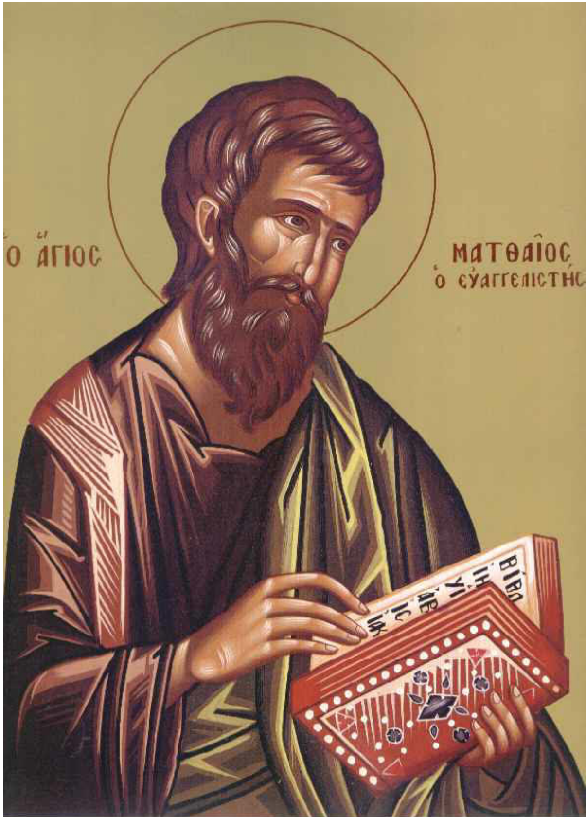
Άγιος Ματθαίος Απόστολος και Ευαγγελιστής