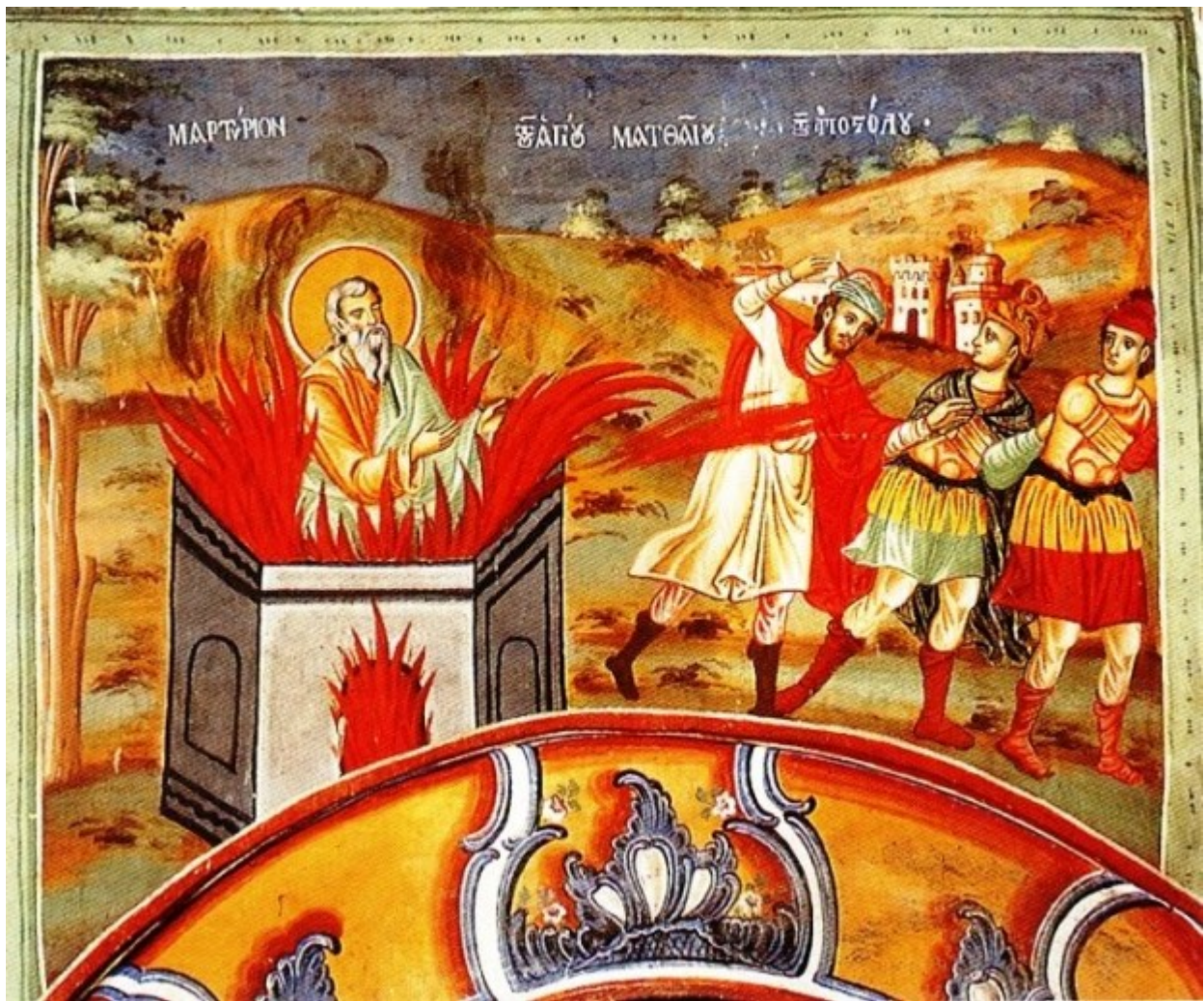
Το μαρτύριο του Αγίου Ματθαίου του Αποστόλου