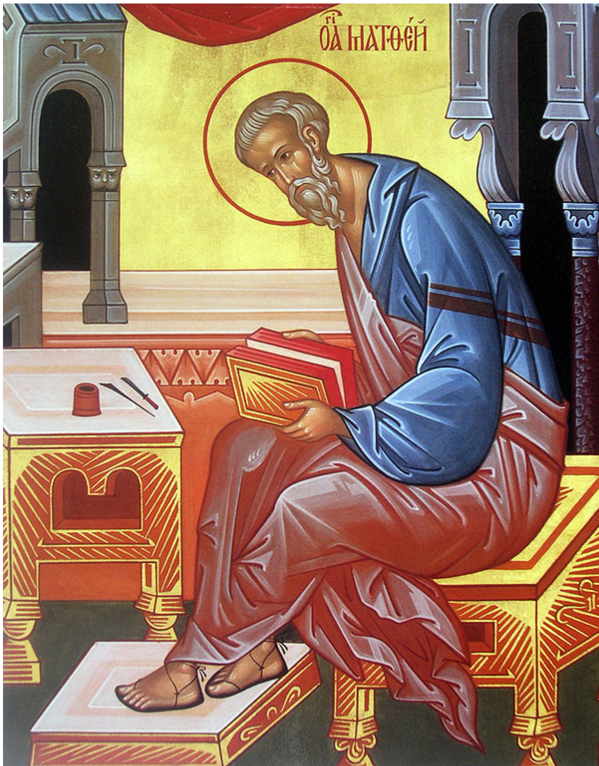
Άγιος Ματθαίος Απόστολος και Ευαγγελιστής