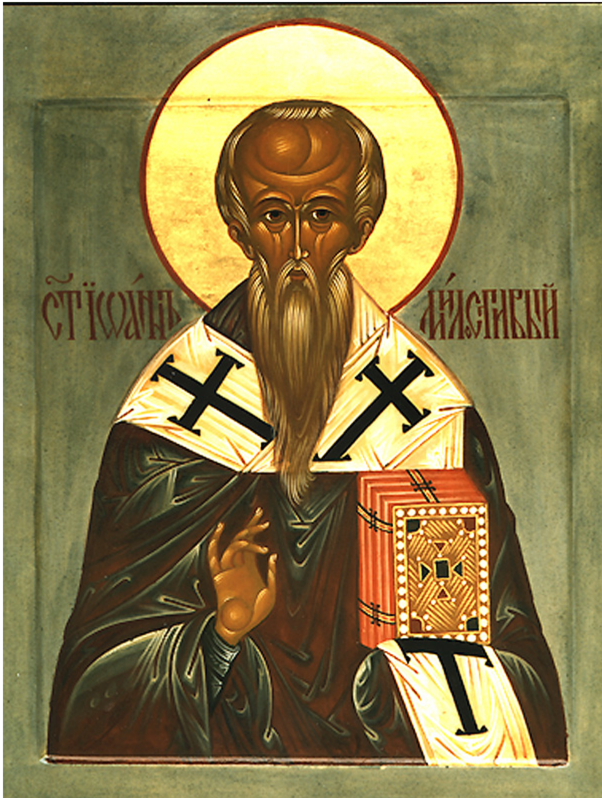
Άγιος Ιωάννης ο Ελεήμονας Αρχιεπίσκοπος Αλεξανδρείας