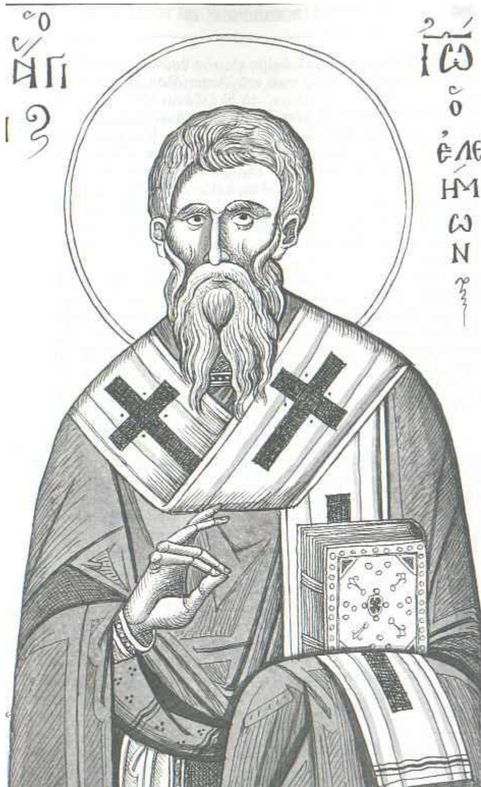
Άγιος Ιωάννης ο Ελεήμονας Αρχιεπίσκοπος Αλεξανδρείας