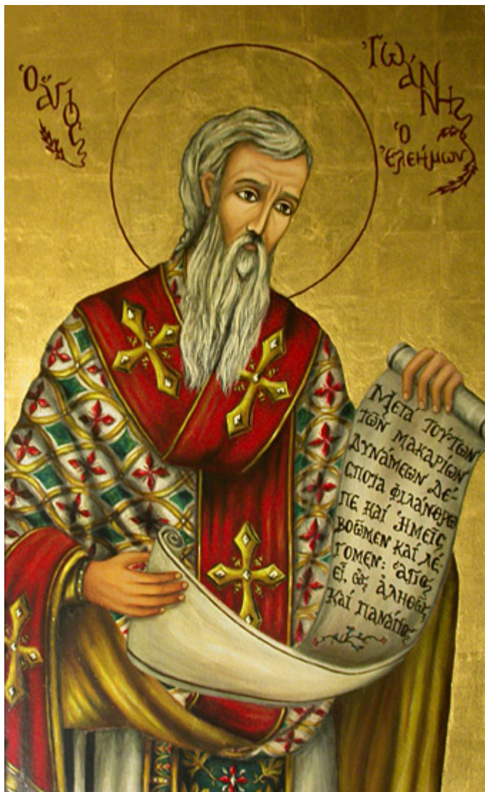
Άγιος Ιωάννης ο Ελεήμονας Αρχιεπίσκοπος Αλεξανδρείας

Εορτάζει στις 12 Νοεμβρίου εκάστου έτους.