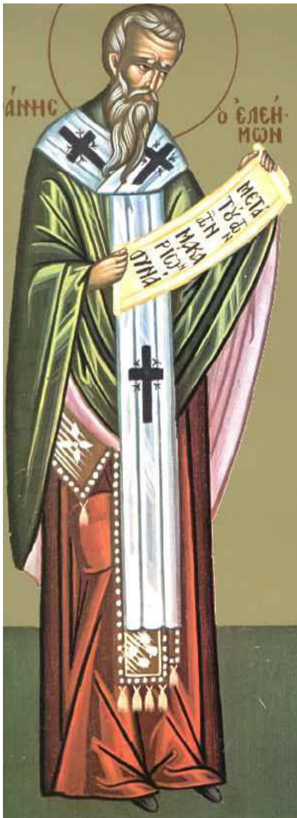
Άγιος Ιωάννης ο Ελεήμονας Αρχιεπίσκοπος Αλεξανδρείας