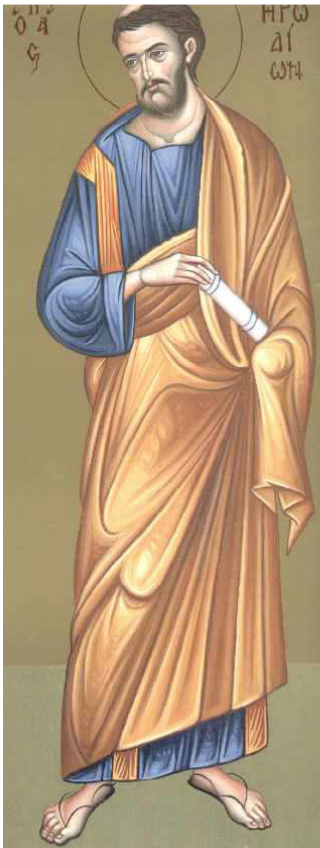
Άγιος Ηρωδίων ο Απόστολος από τους Εβδομήκοντα