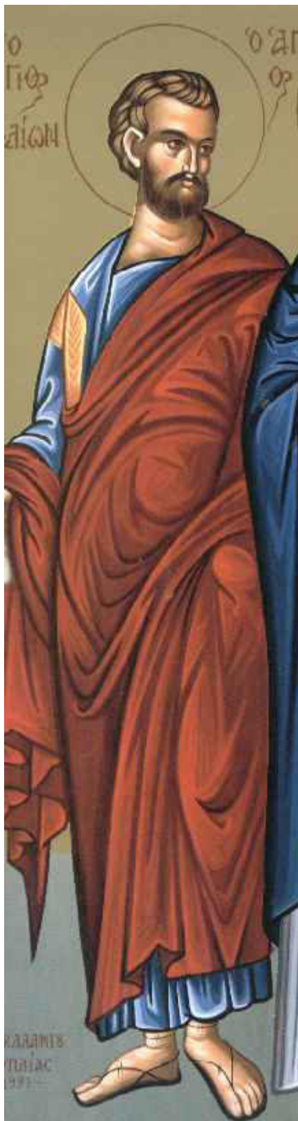
Άγιος Ηρωδίων ο Απόστολος από τους Εβδομήκοντα