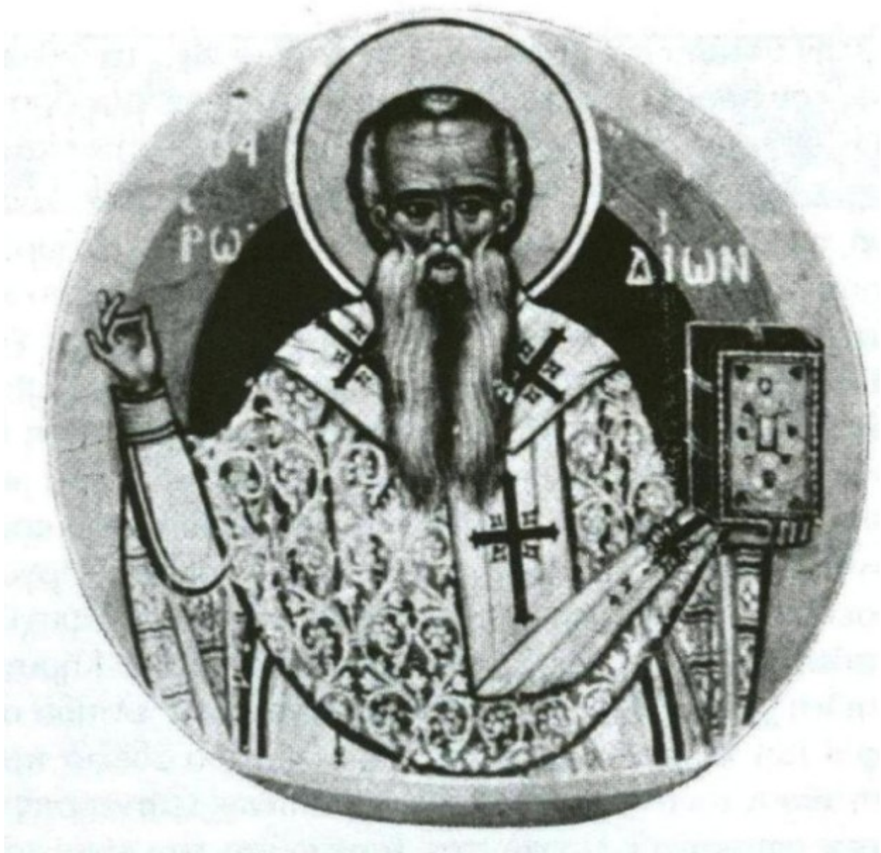
Άγιος Ηρωδίων ο Απόστολος από τους Εβδομήκοντα