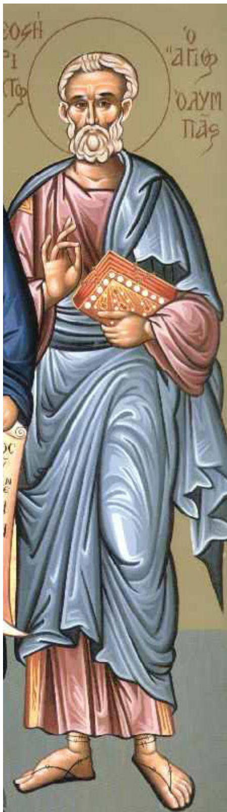
Ἅγιος Ολυμπάς ο Ἀπόστολος ἀπό τους Εβδομήκοντα