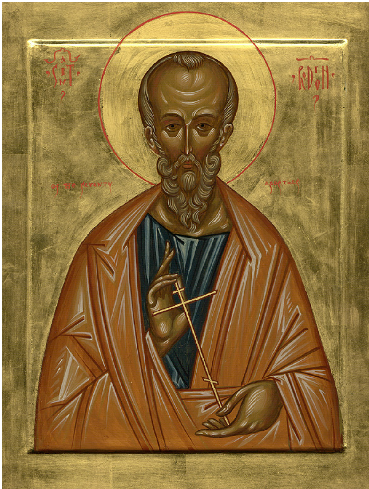
Άγιος Ηρωδίων ο Απόστολος από τους Εβδομήκοντα