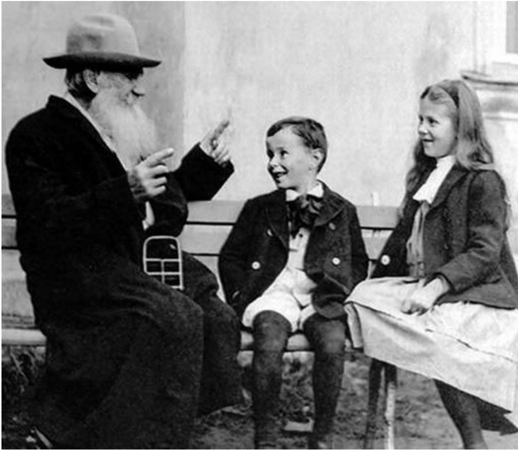
Ο Λέων Τολστόι με τα εγγόνια του

Ο Λέων Τολστόι (Лев Николаевич Толстой), Ρώσος συγγραφέας, έγραψε την μικρή διήγηση «Τα τρία ερωτήματα» το 1885.