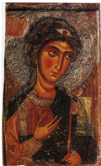
Αρχάγγελος Μιχαήλ (12 αιώνας μ.Χ.) - Ιερά Μονή Ιωάννη Χρυσοστόμου (Κύπρος) στον κατεχόμενο Κουτσοβέντη. Η εικόνα κλάπηκε από τους Τούρκους και αγνοείται η τύχη της.