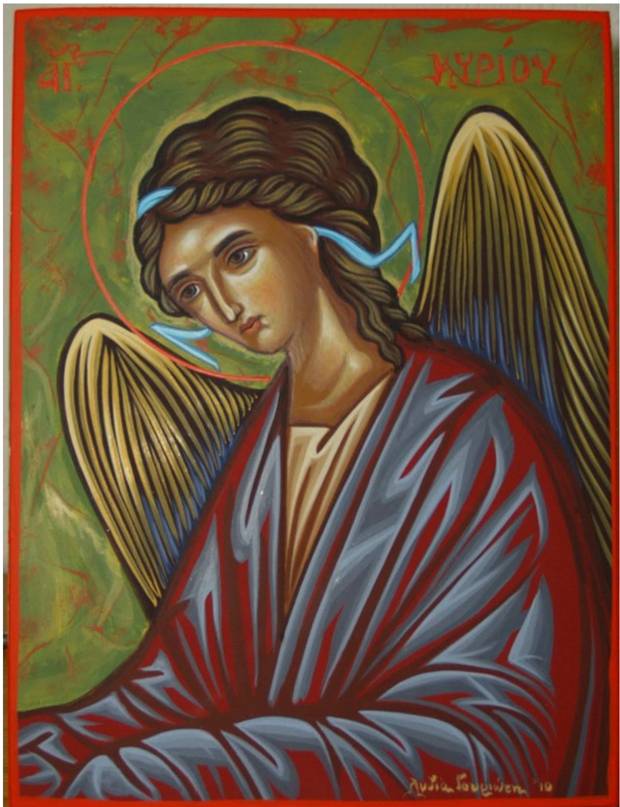
Άγγελος Κυρίου - Λυδία Γουριώτη© ( lydiagourioti-iconography.blogspot.com )