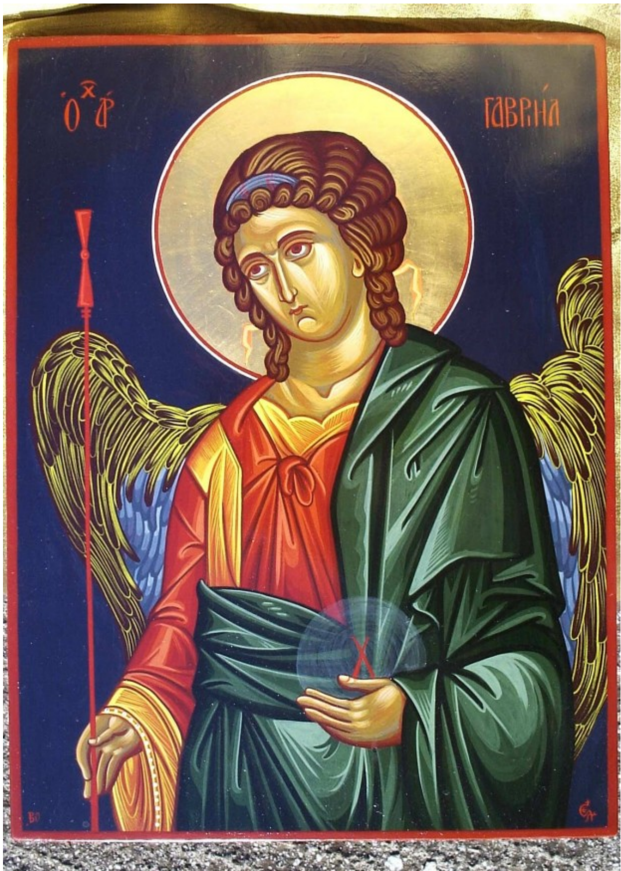
Αρχάγγελος Γαβριήλ - Χρωστήρας© (xrostiras.blogspot.com)