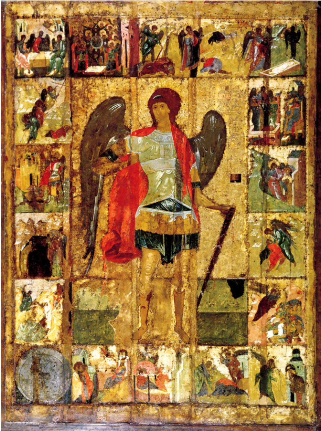
Αρχάγγελος Μιχαήλ - Ρωσική εικόνα του 1400 μ.Χ.