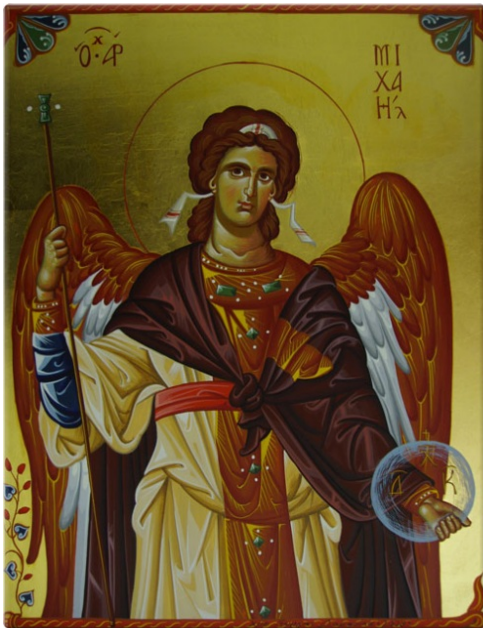
Αρχάγγελος Μιχαήλ - Η φιγούρα του Αρχαγγέλου είναι πλαισιομένη με στοιχεία από βυζαντινό χειρόγραφο του 10ου αιώνα μ.Χ. - Γεωργία Δαμικούκα© ( http://www.tempera.gr )

Αρχάγγελος Μιχαήλ - Βασίλειος & Περικλής Συρίμης© ( sirimis.gr )