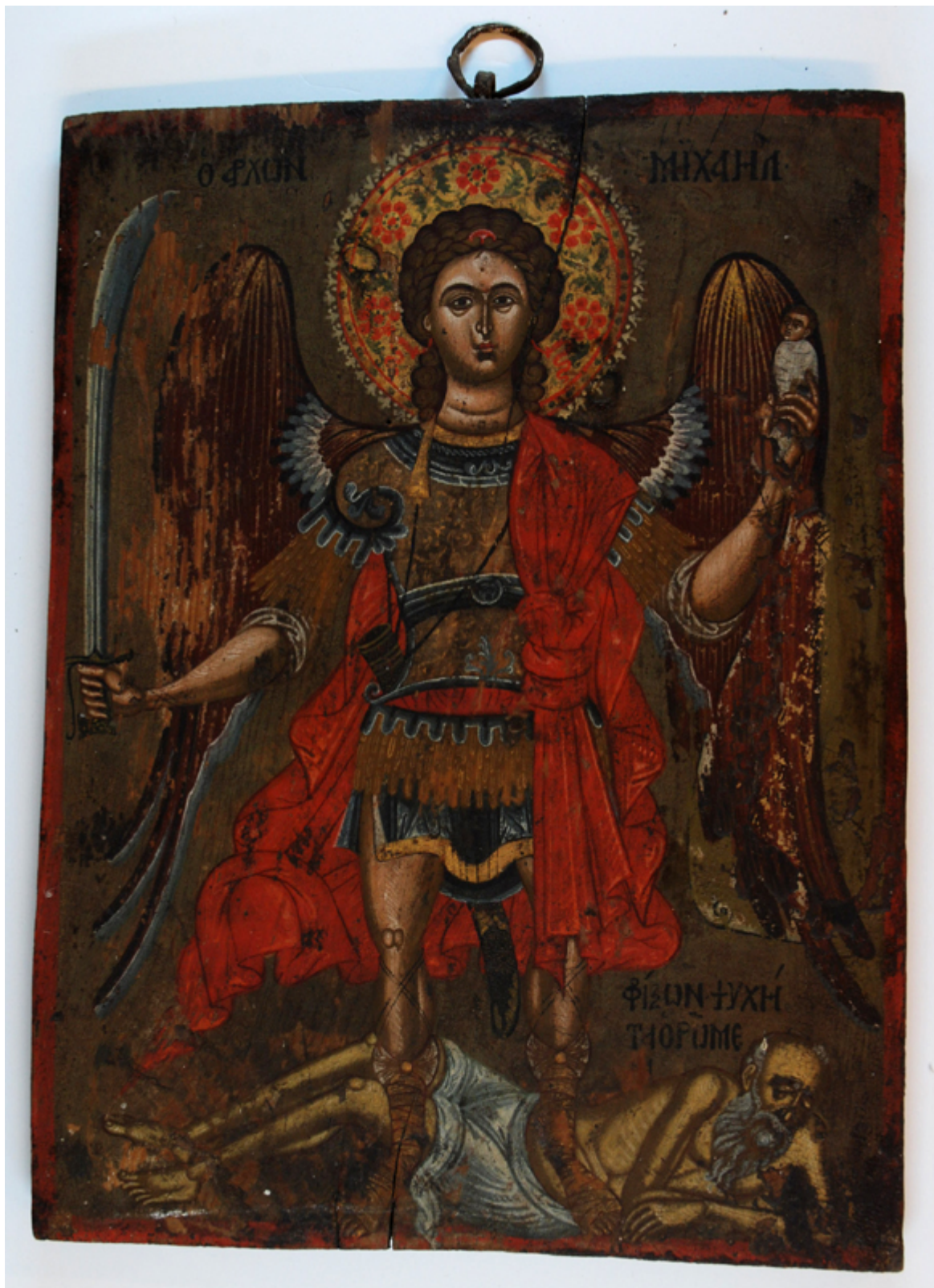
Αρχάγγελος Μιχαήλ - Φορητή εικόνα του 17ου, αρχές του 18ου αιώνα μ.Χ. από το τέμπλο της εκκλησίας του μετοχίου Μονής «Κλοπεδή»