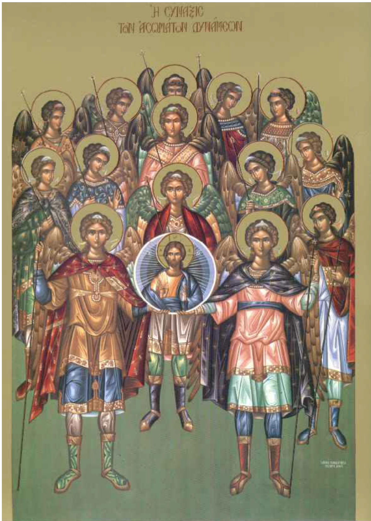
Σύναξις Αρχαγγέλων Σύναξις Αρχαγγέλων