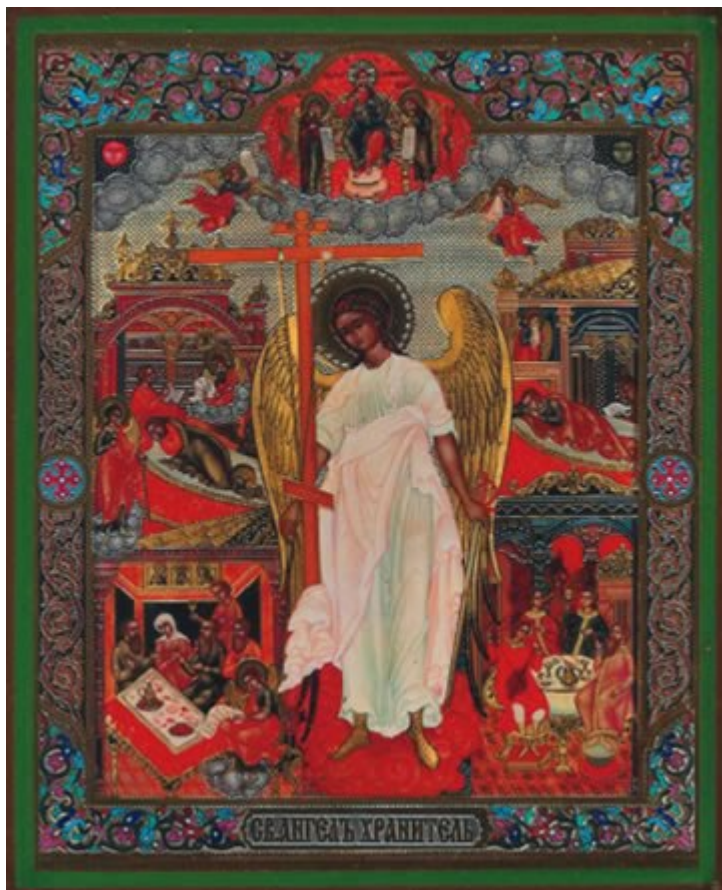
Φύλακας άγγελος με σκηνές από την παραβολή του ασώτου υιού