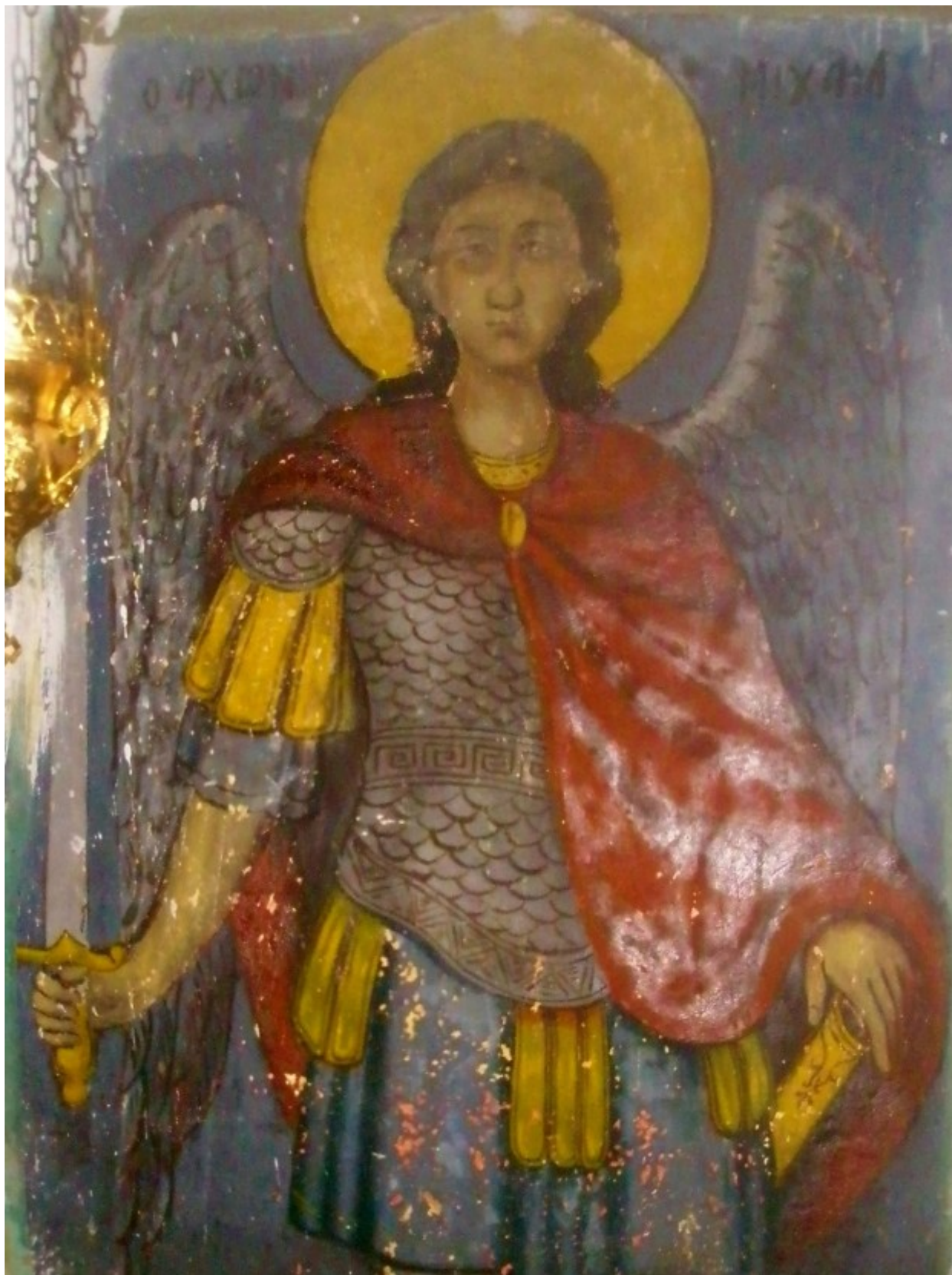
Αρχάγγελος Μιχαήλ (Ιερός Ναός Αγίου Χαραλάμπους Παλαιοχώρας Αίγινας)