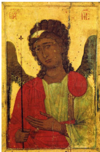
Αρχάγγελος Μιχαήλ (τέλη 14ου μ.Χ. αιώνα, Κύπρος)