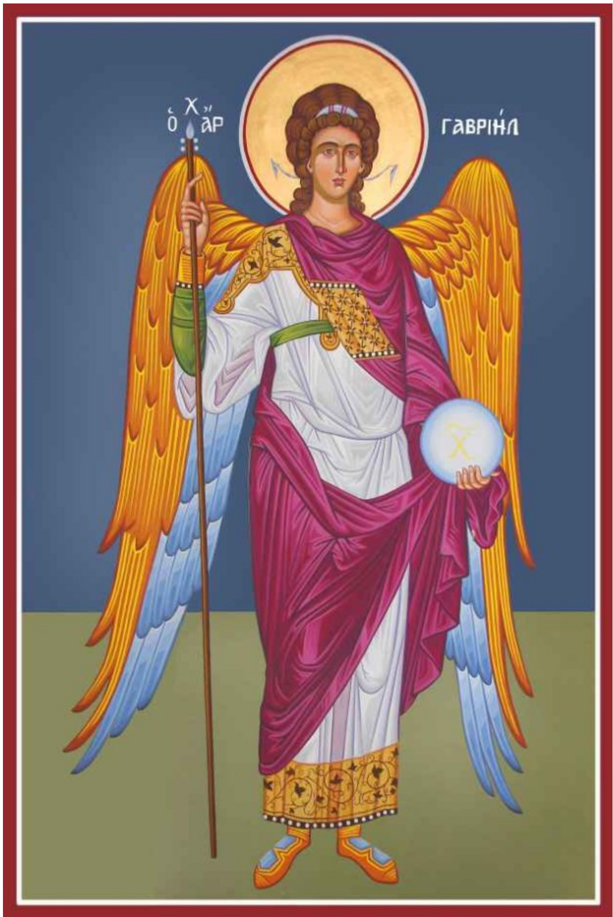
Αρχάγγελος Γαβριήλ - Καζακίδου Μαρία© (byzantineartkazakidou. blogspot.com)