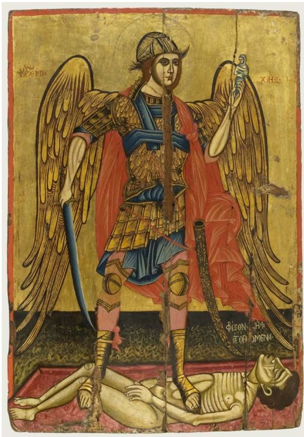
Ο αρχάγγελος Μιχαήλ ψυχοπομπός. Τέλη 18ου - αρχές 19ου αιώνα. Πρόσφατα αποκαλύφθηκε και παλαιότερο στρώμα ζωγραφικής, ορατό σε λίγα σημεία της εικόνας. Από τη Messina. - Αθήνα, Βυζαντινό και Χριστιανικό Μουσείο