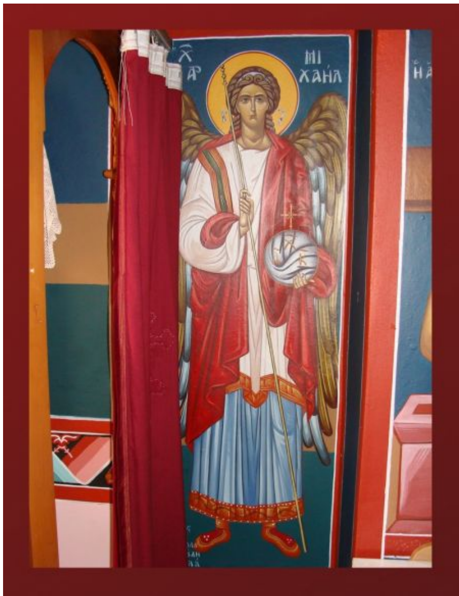
Αρχάγγελος Μιχαήλ - Βασίλειος & Περικλής Συρίμης© (sirimis.gr)