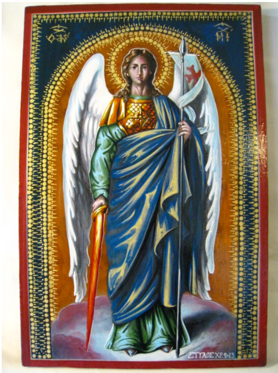
Αρχάγγελος Μιχαήλ - Χρήστος Στύλος©