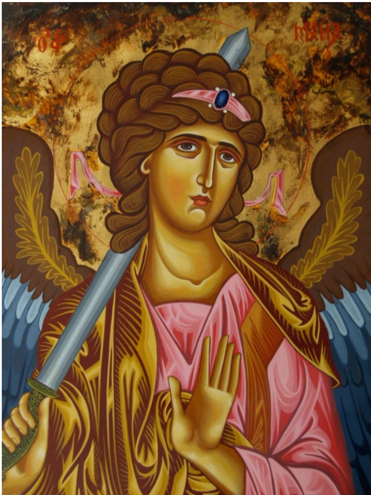
Αρχάγγελος Μιχαήλ - Λυδία Γουριώτη© ( lydiagourioti-iconography.blogspot.com )