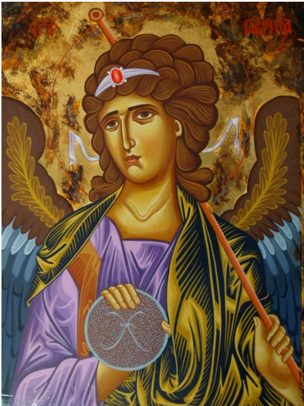
Αρχάγγελος Γαβριήλ – Λυδία Γουριώτη© ( lydiagourioti-iconography.blogspot.com )