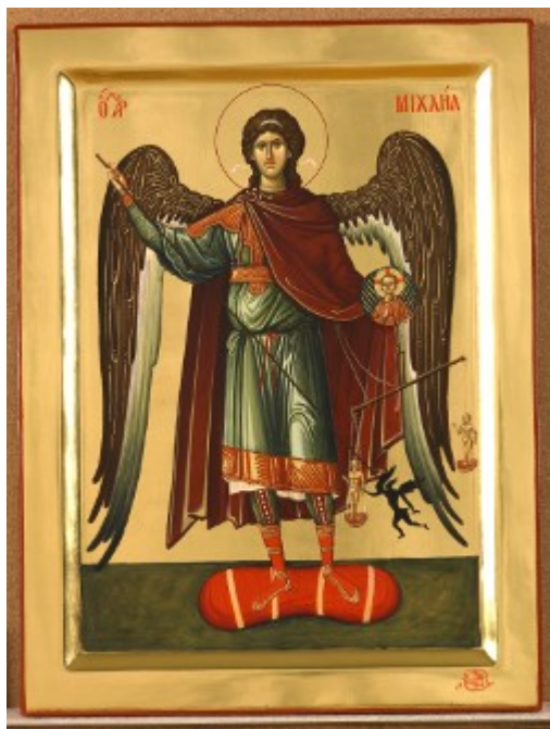
Αρχάγγελος Μιχαήλ - Εικόνα από το Αγιογραφείο της Μονής Βατοπαιδίου