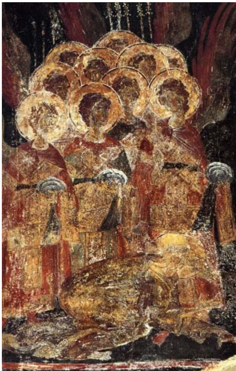
Χορός αγγέλων - Λεπτομέρεια από βυζαντινή τοιχογραφία σε εκκλησία του Μυστρά