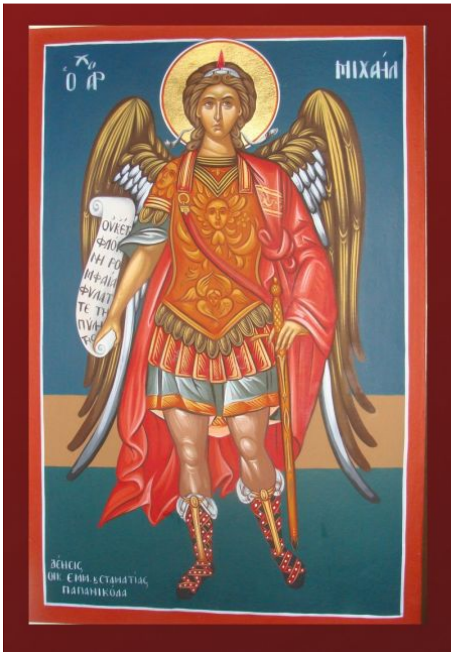
Αρχάγγελος Μιχαήλ - Βασίλειος & Περικλής Συρίμης© (sirimis.gr)