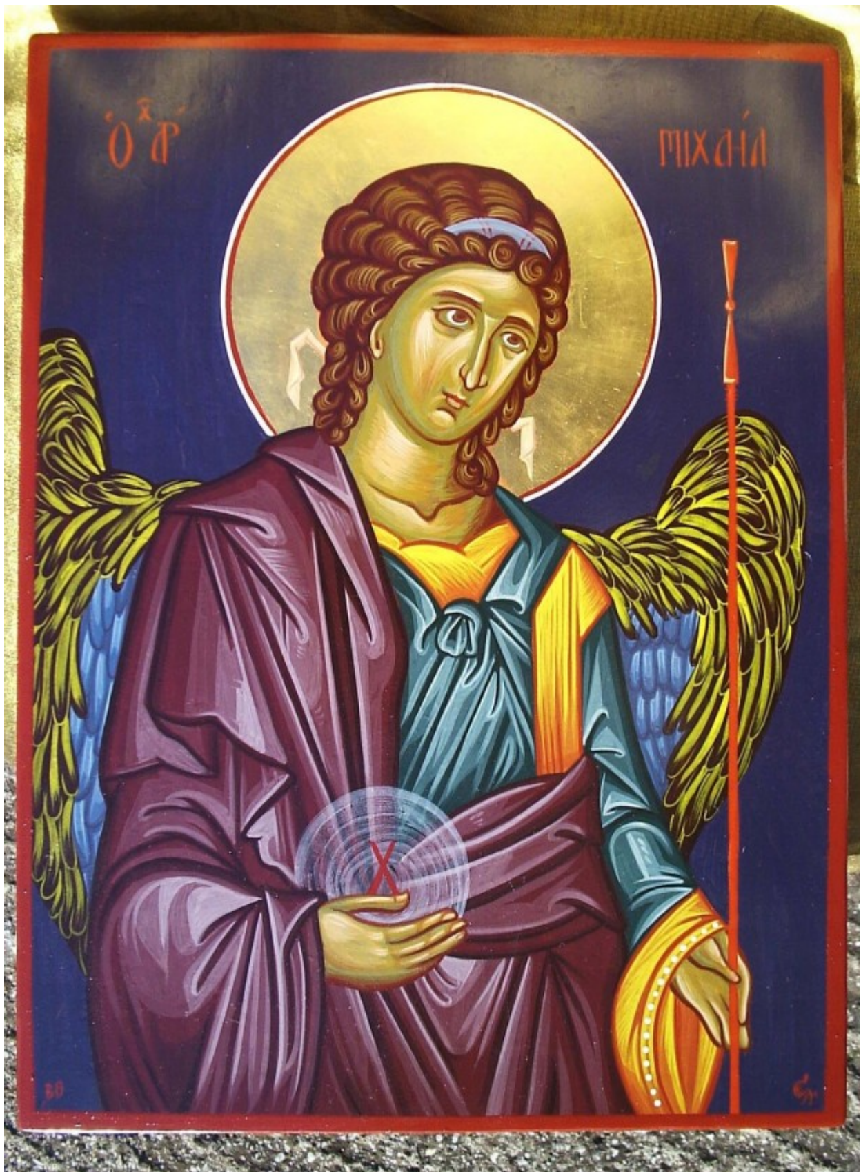
Αρχάγγελος Μιχαήλ - Χρωστήρας © (xrostiras.blogspot.com)