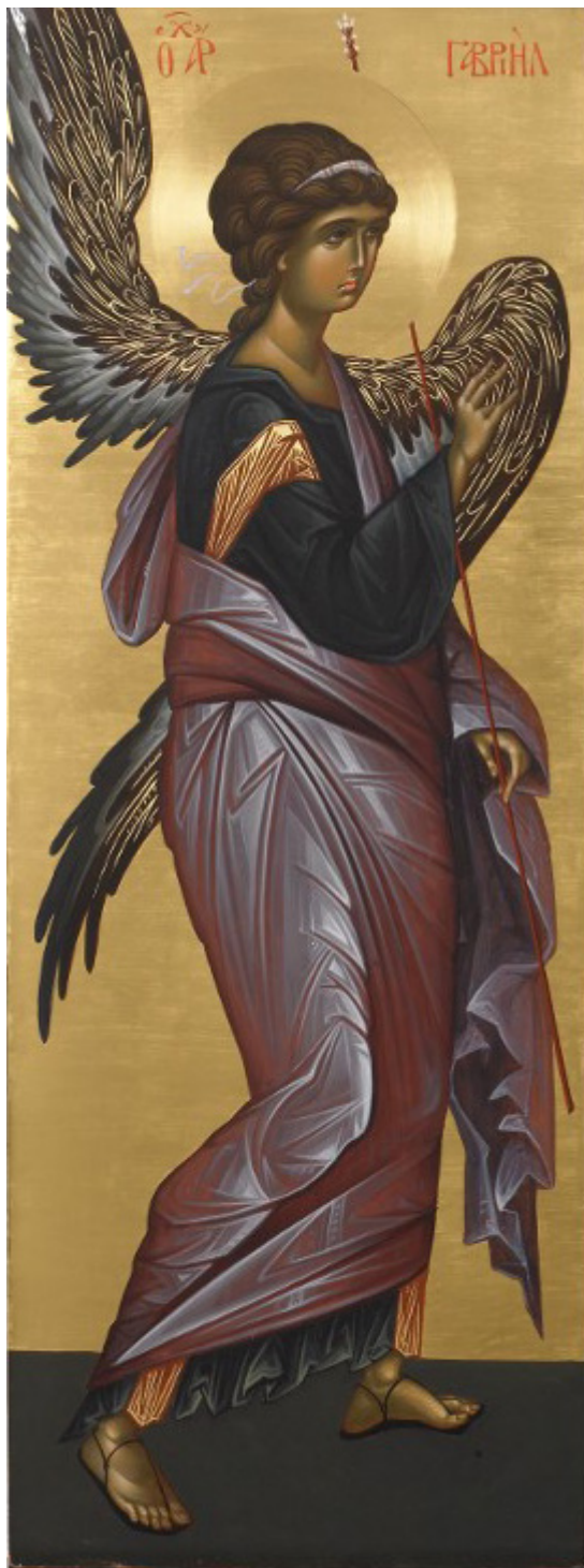
Αρχάγγελος Γαβριήλ - Εικόνα από το Αγιογραφείο της Μονής Βατοπαιδίου