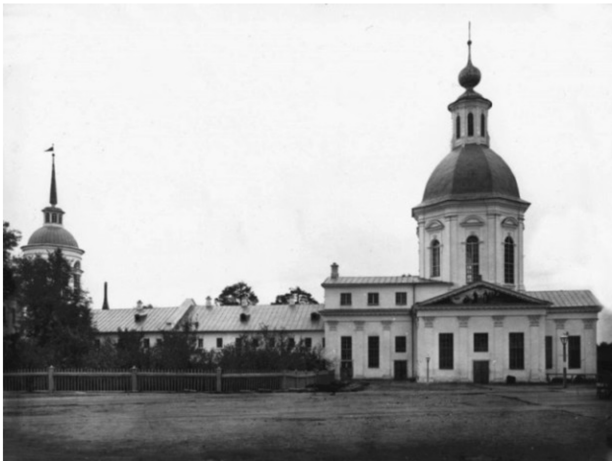
Ο Ιερός Ναός των Οσίων Ζωσιμά και Σαββάτιου από τα Σολόβκι, η αγία τράπεζα της οποίας κατασκευάστηκε από τον Όσιο Σεραφείμ του Σαρώφ.