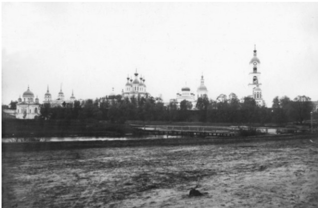
Η Ιερά Μονή της Αγίας Τριάδος στο Ντιβέγιεβο (στα ρωσικά: Свято-Троицкий Серафимо-Дивеевский Монастырь) από τη πλευρά του ποταμού Σαρώφκα.