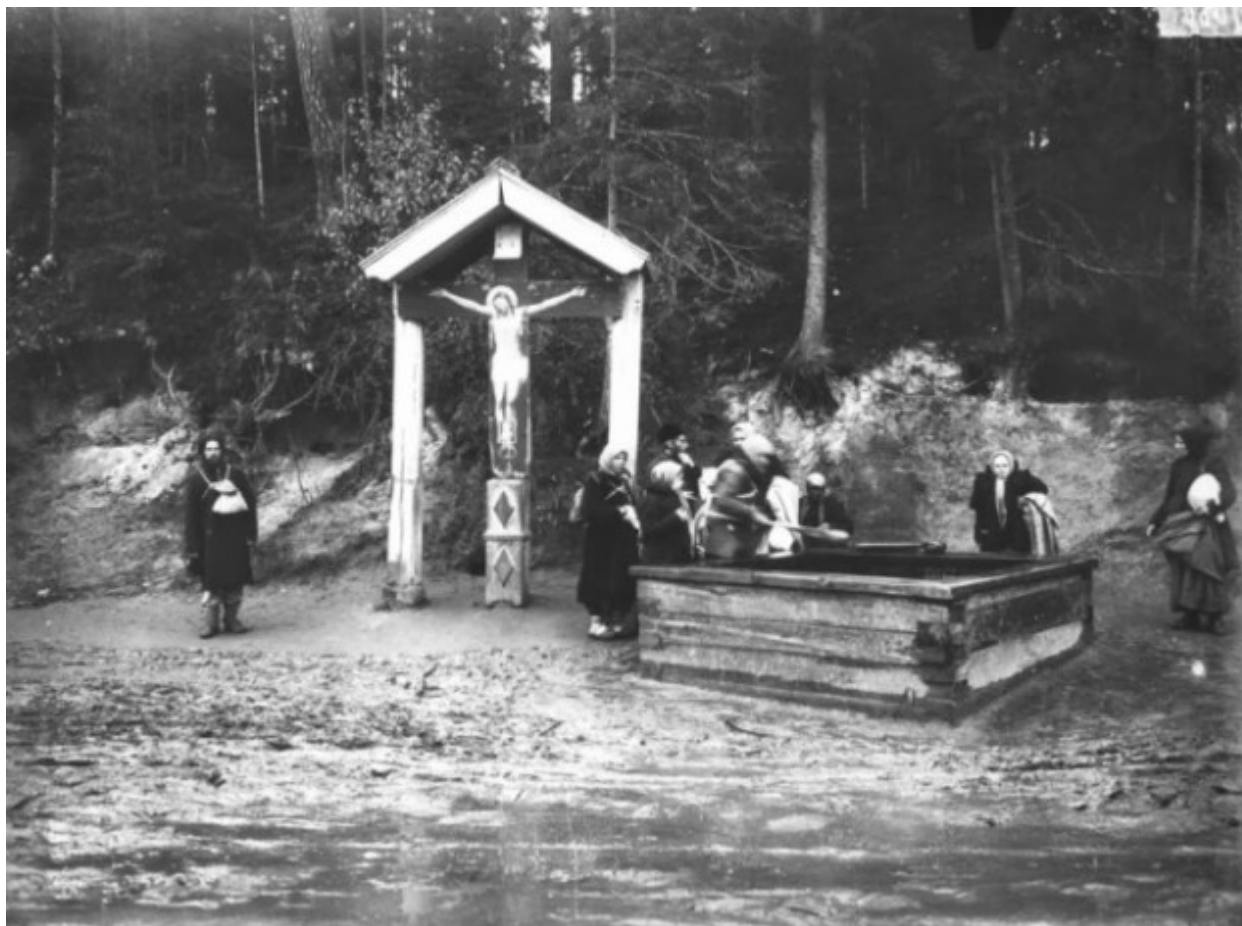
Στο πηγάδι του Οσίου Σεραφείμ του Σαρώφ.