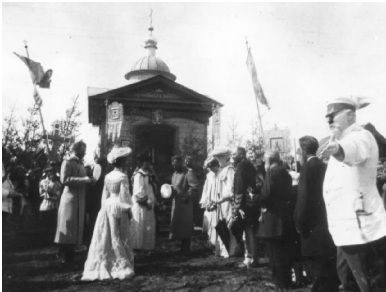
Σε υπαίθριο εξωκκλήσι.