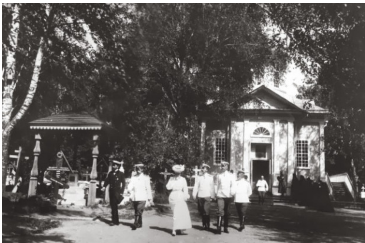
Στον Κοιμητηριακό Ναό "Η Μεταμόρφωση του Σωτήρος", του οποίου την αγία τράπεζα έφτιαξε ο Όσιος Σεραφείμ του Σαρώφ.