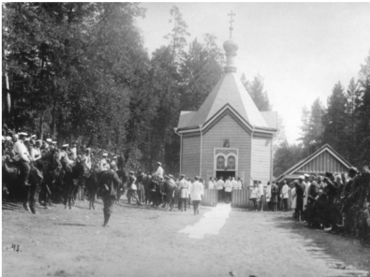
Κατά τη διάρκεια της παράκλησης στο αγίασμα του Οσίου Σεραφείμ του Σαρώφ.