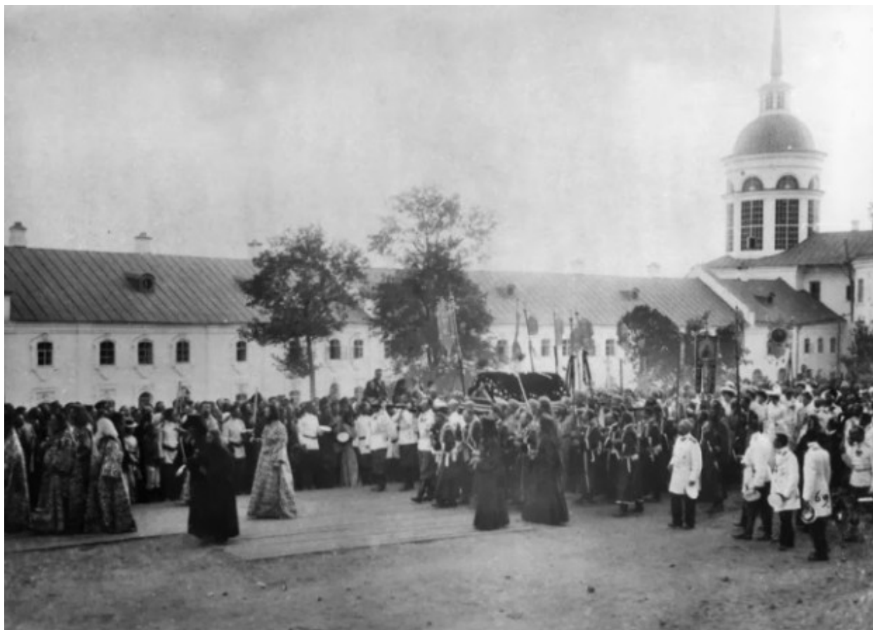
Από τη λιτάνευση των λειψάνων του Οσίου Σεραφείμ του Σαρώφ.