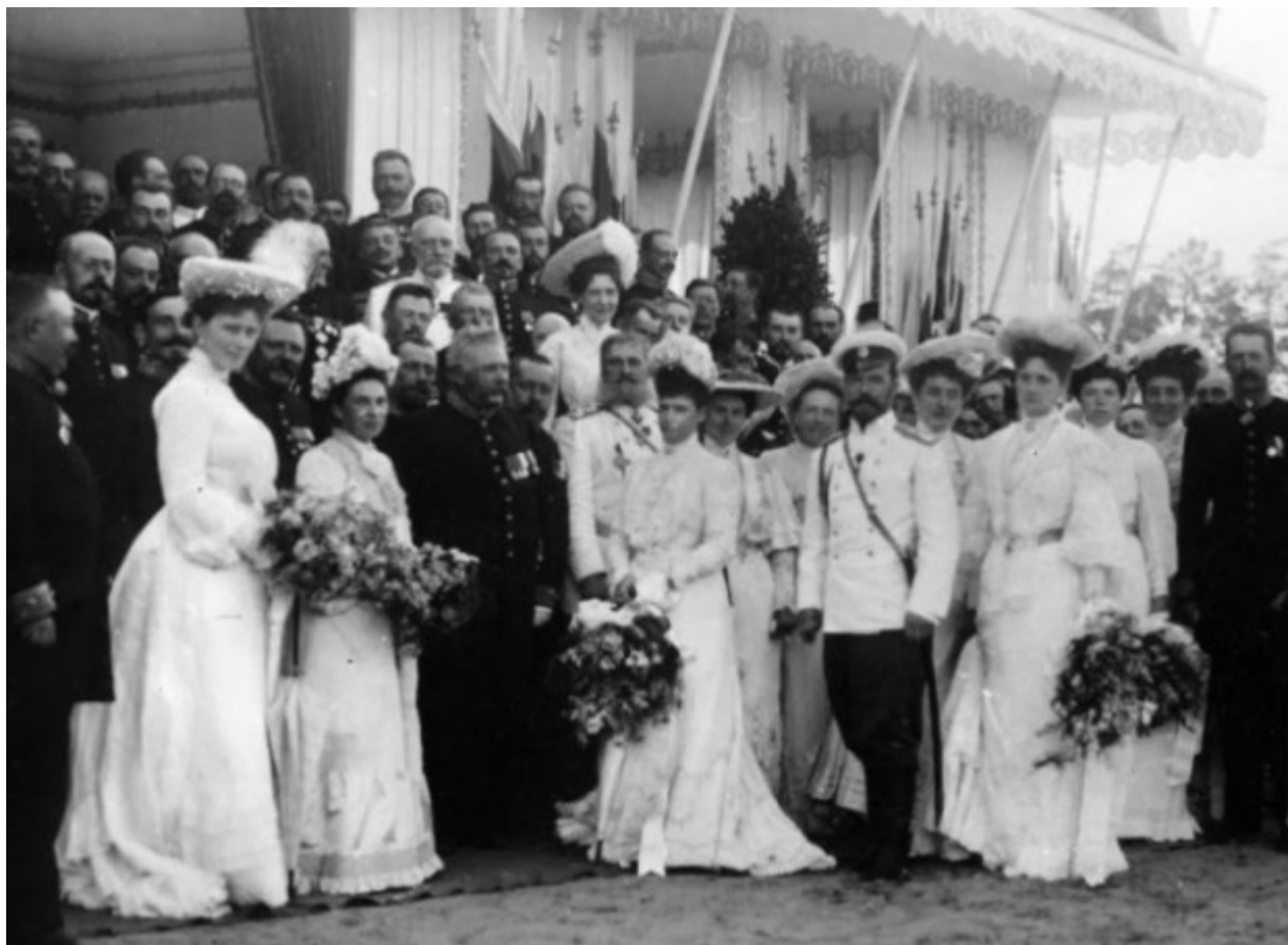
Με τους ευγενείς του Γκουβέρνου Νίζεγκόραντ.