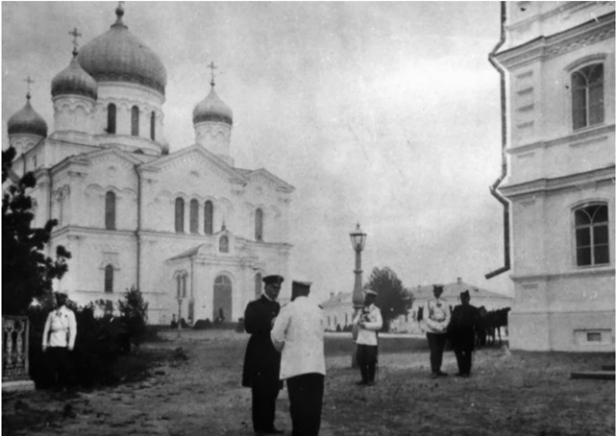
Ο Καθολικός Ναός "Η Κοίμηση της Θεοτόκου" κατά τη διάρκεια των θρησκευτικών τελετών.