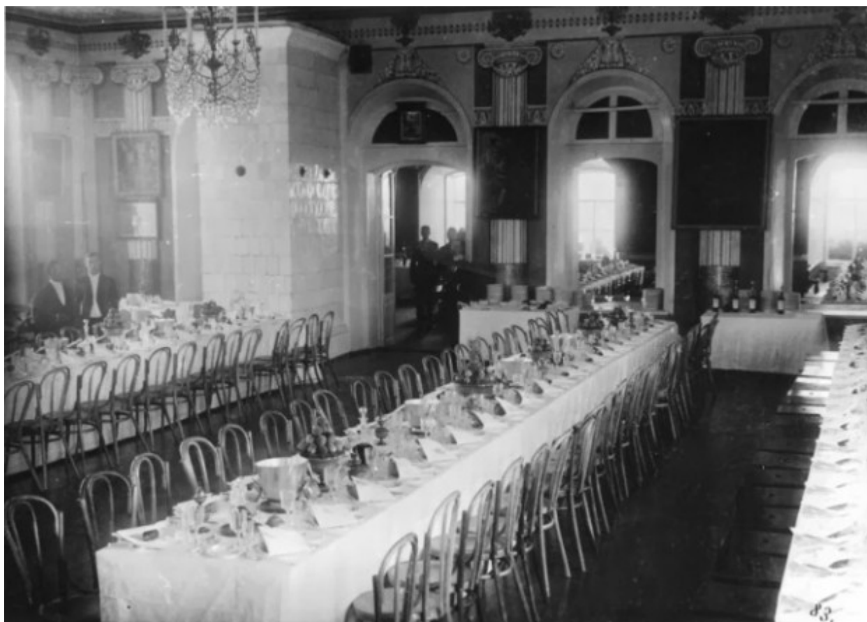
Προετοιμασία της εορταστικής τράπεζας για τους προσκεκλημένους.