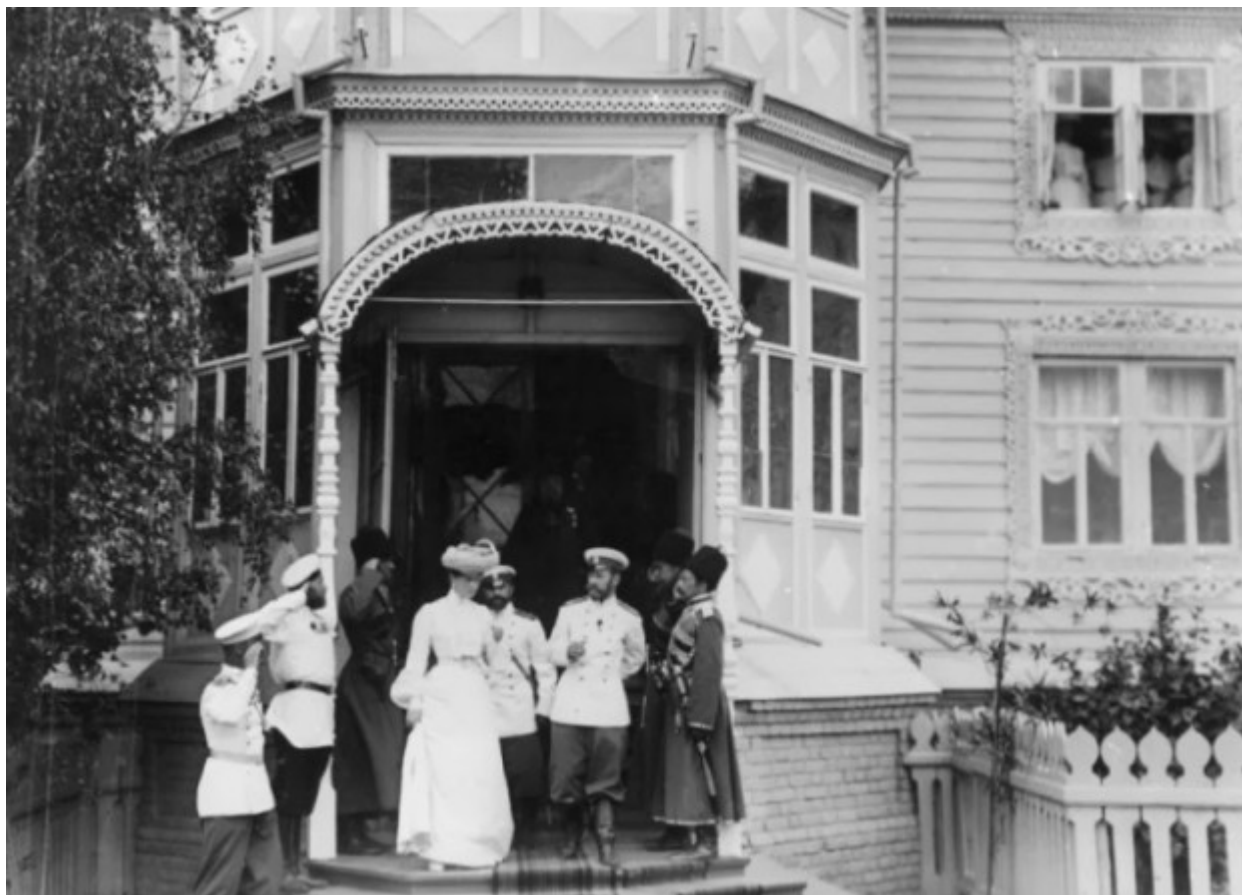
Το βασιλικό ζευγάρι στο Ηγουμενείο της Ιεράς Μονής.