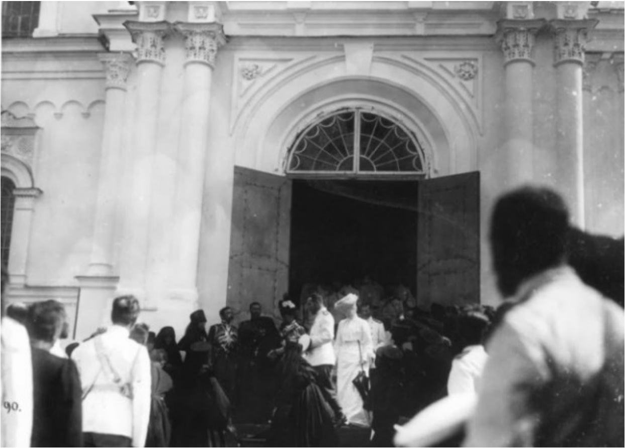
Το βασιλικό ζευγάρι και η βασιλομήτωρ καθώς αποχωρούν από τον Ιερό Ναό "Η Κοίμηση της Θεοτόκου".