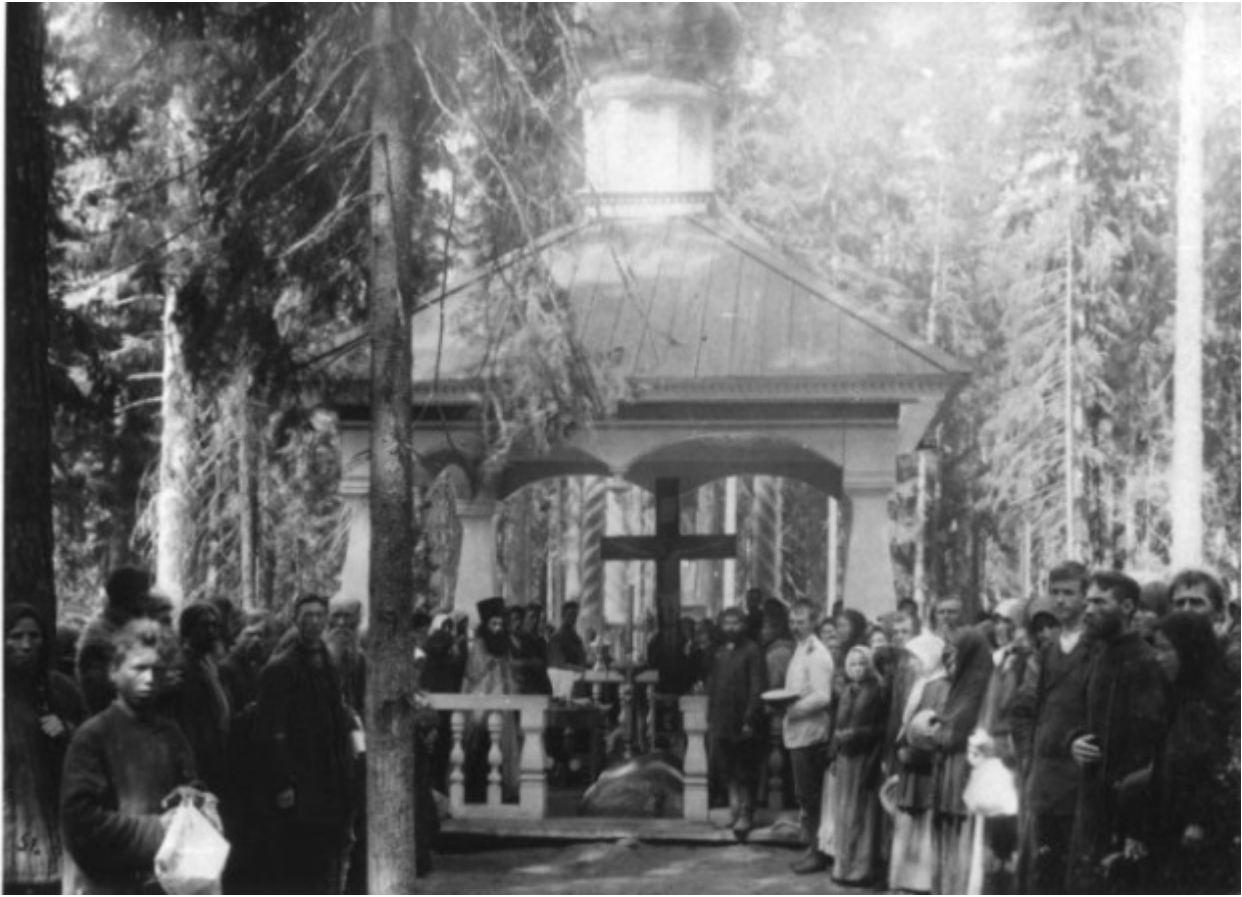
Το παρεκκλήσι πάνω από το βράχο, όπου ο Όσιος Σεραφείμ του Σαρώφ προσευχήθηκε για χίλιες ημέρες και νύχτες.