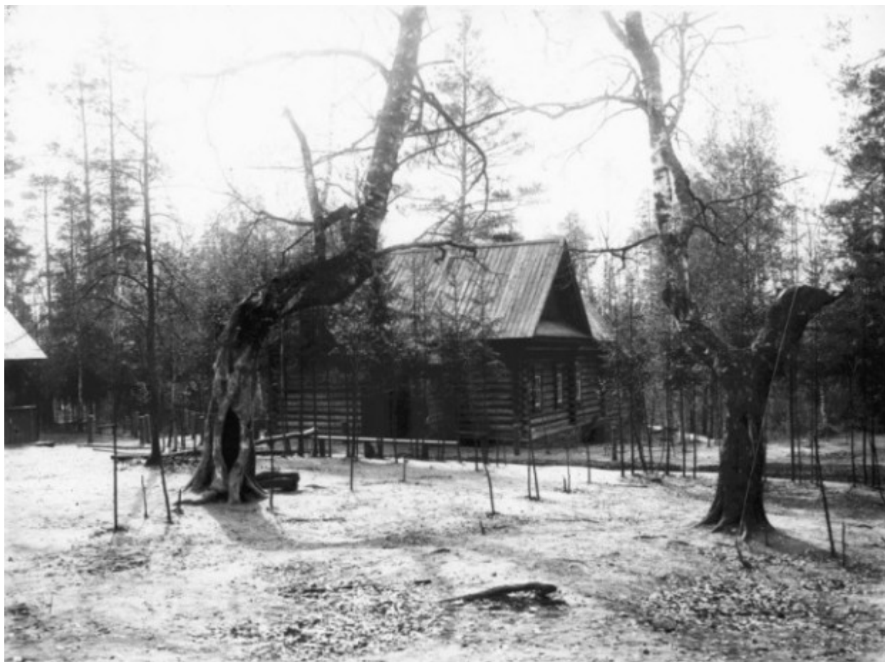
Το ερημητήριο του Οσίου Σεραφείμ του Σαρώφ.