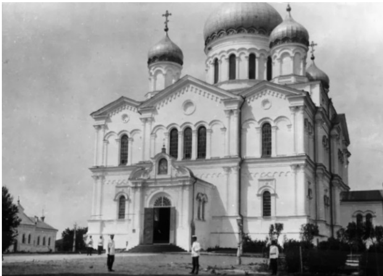
Ο Καθολικός Ναός "Η Κοίμηση της Θεοτόκου" της Ιεράς Μονής της Αγίας Τριάδος στο Ντιβέγιεβο.