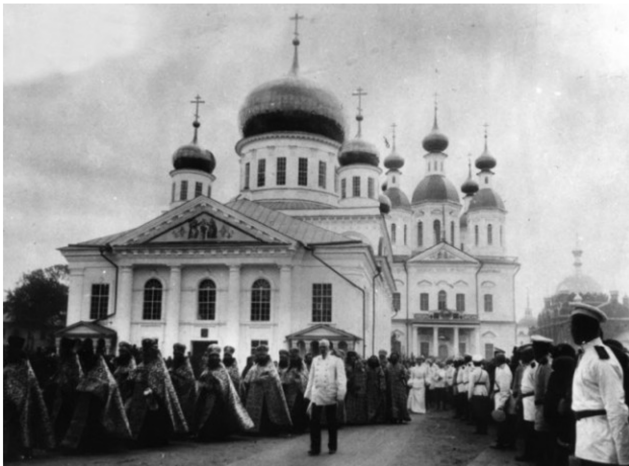
Από τη λιτάνευση των λειψάνων του Οσίου Σεραφείμ του Σαρώφ.