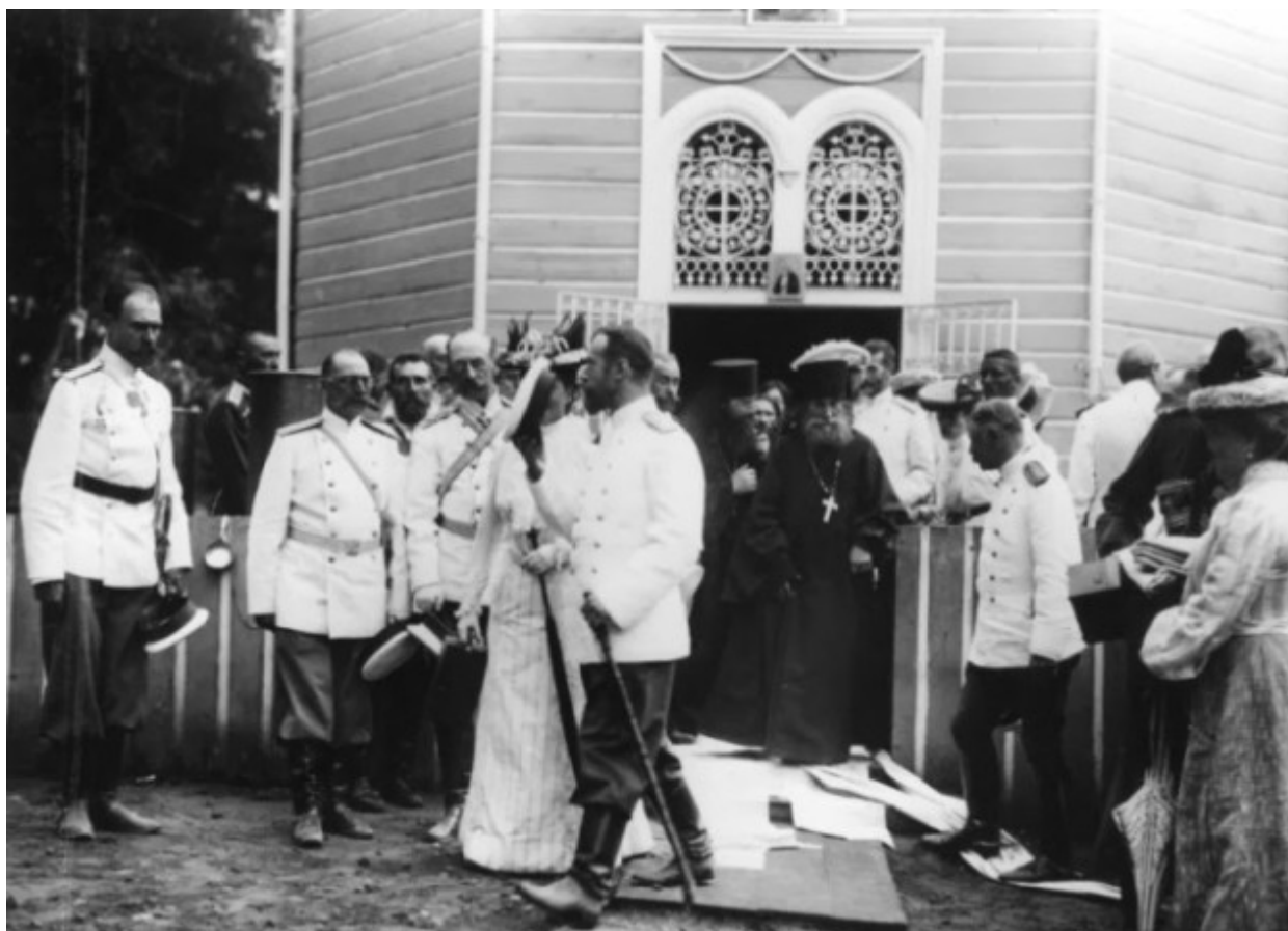
Ο Τσάρος Νικόλαος Β' με μέλη της οικογένειάς του αποχωρούν από το αγίασμα του Οσίου Σεραφείμ