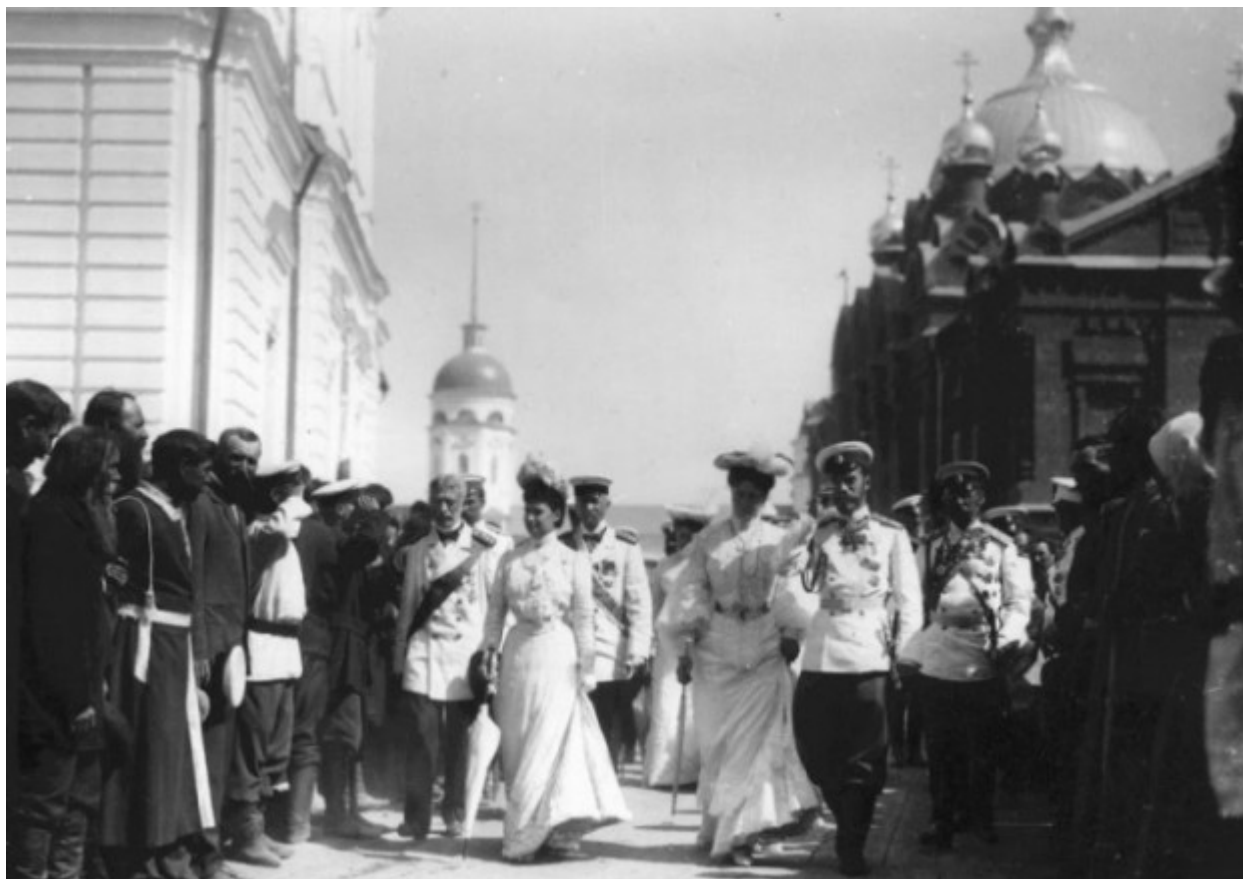
Η υποδοχή της τσαρικής οικογένειας από τον λαό.