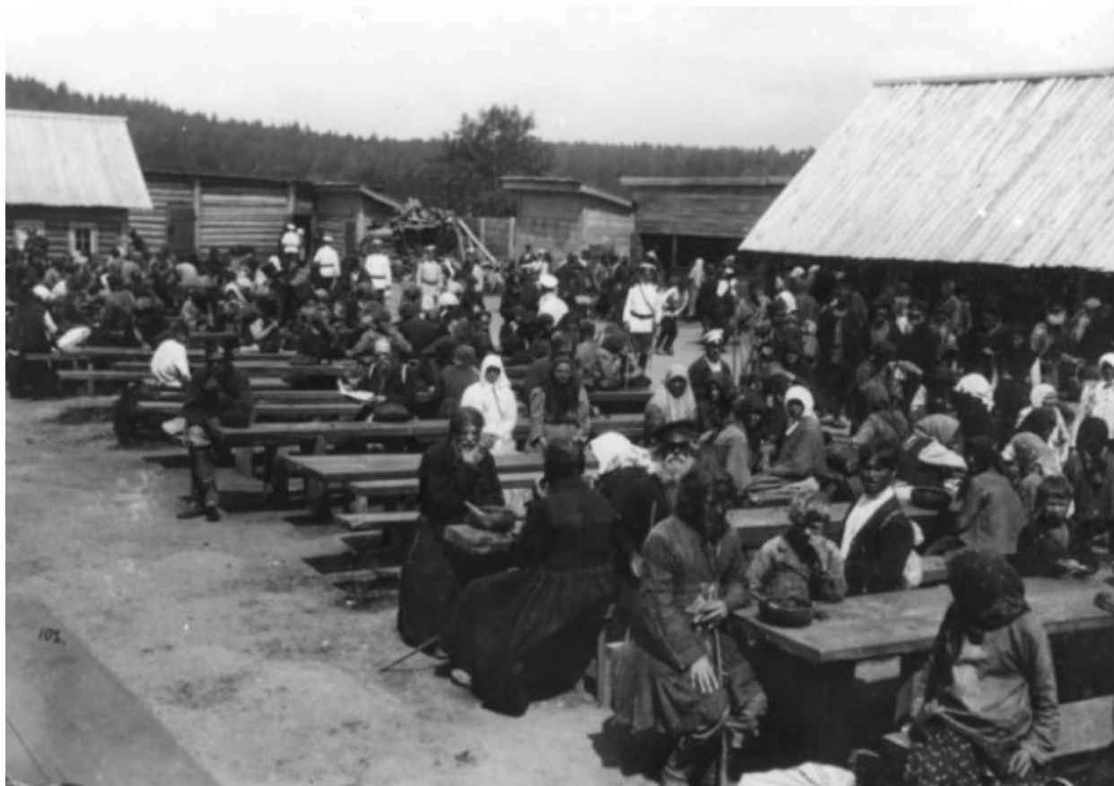
Υπαίθριος τράπεζα για τους προσκυνητές.