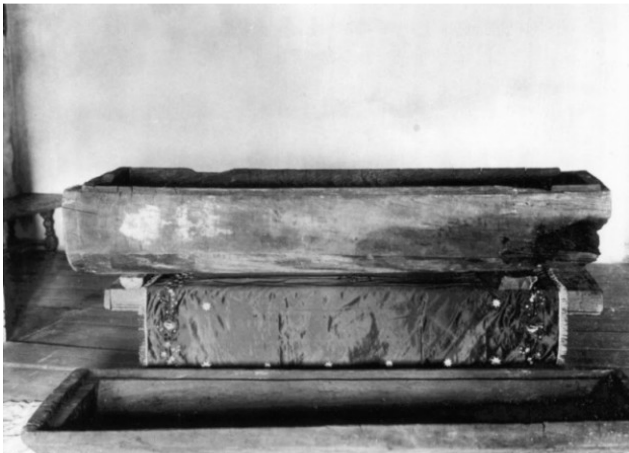
Το ξύλινο φέρετρο στο οποίο εναποτέθηκε ο Όσιος Σεραφείμ του Σαρώφ. Το φέρετρο λαξεύτηκε από τον ίδιο τον Όσιο.