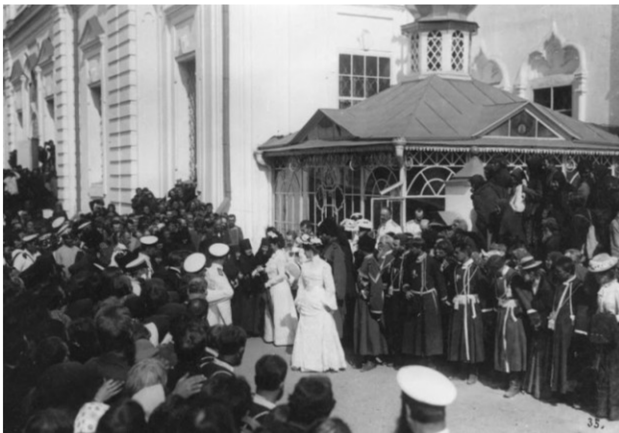
Οι μοναχές της Ιεράς Μονής της Αγίας Τριάδος στο Ντιβέγιεβο χαιρετούν την βασιλομήτωρα Μαρία