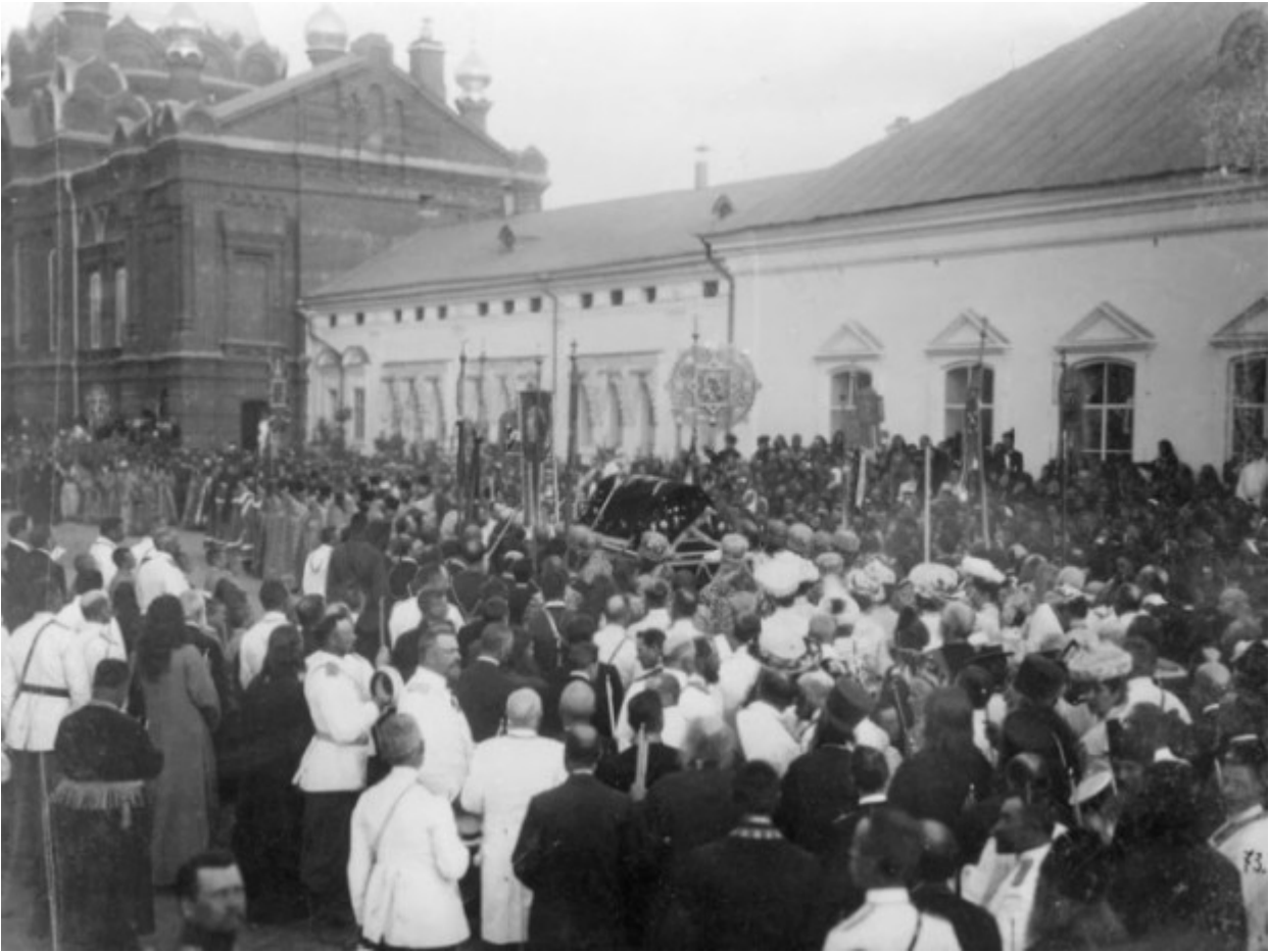
Από τη λιτάνευση των λειψάνων του Οσίου Σεραφείμ του Σαρώφ.