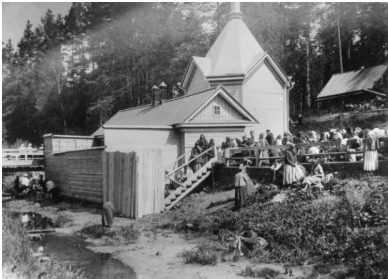
Το παρεκκλήσι πάνω από το αγίασμα του Οσίου Σεραφείμ του Σαρώφ.