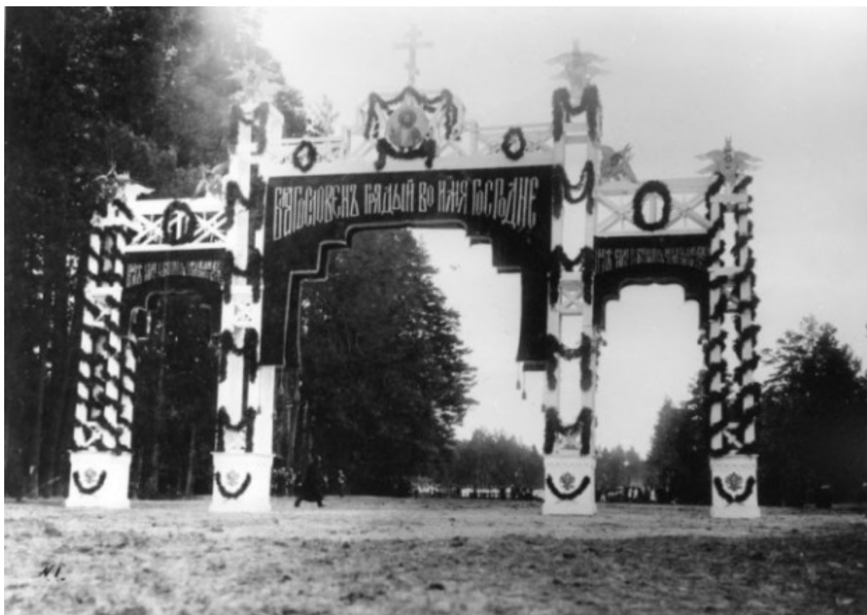
Τιμητική αψίδα υποδοχής για τον Τσάρο στα όρια της Περιφέρειας Ταμπώφ.