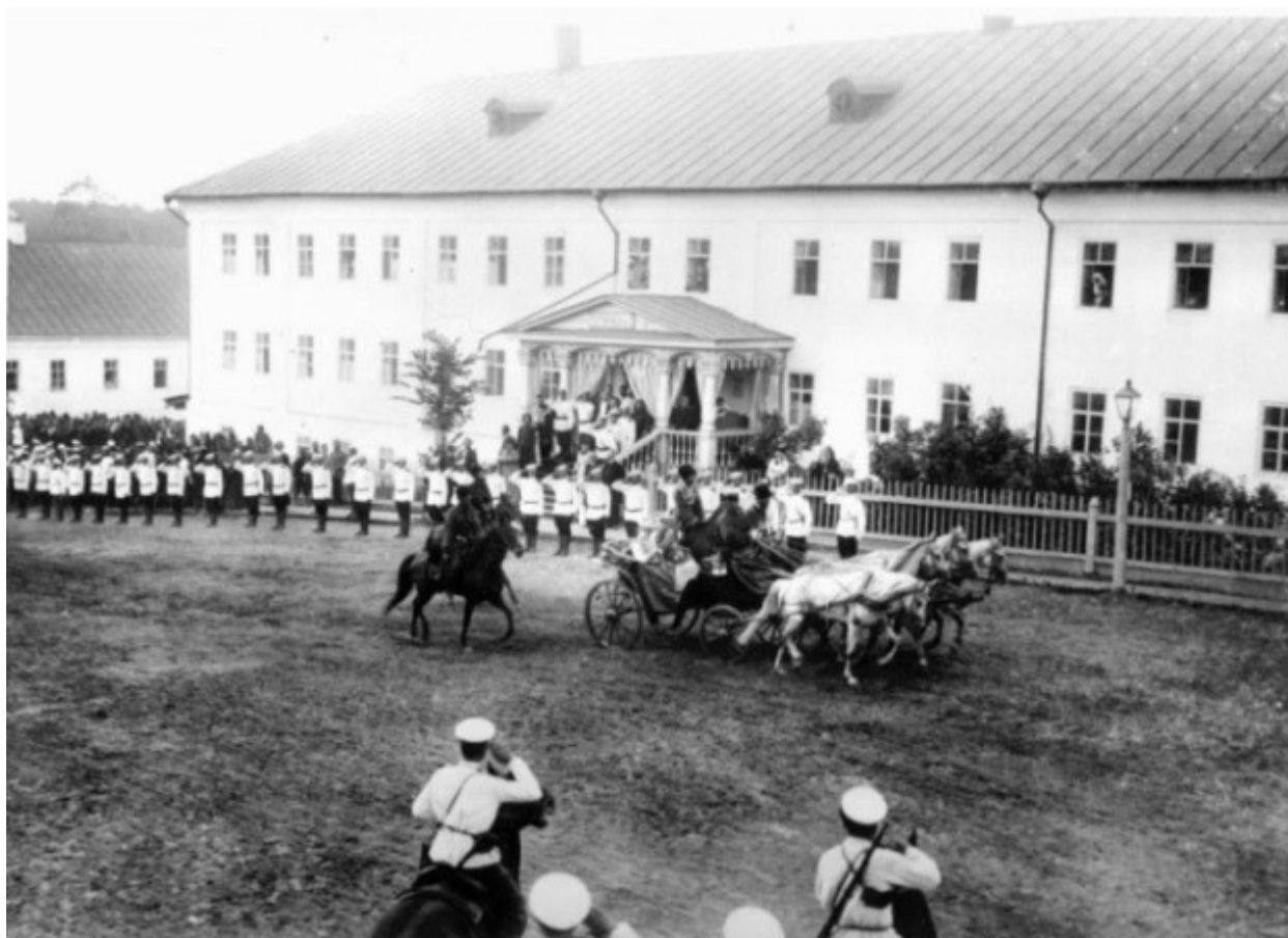
Η τσαρική οικογένεια φθάνει στην Ιερά Μονή της Αγίας Τριάδος στο Ντιβέγιεβο.