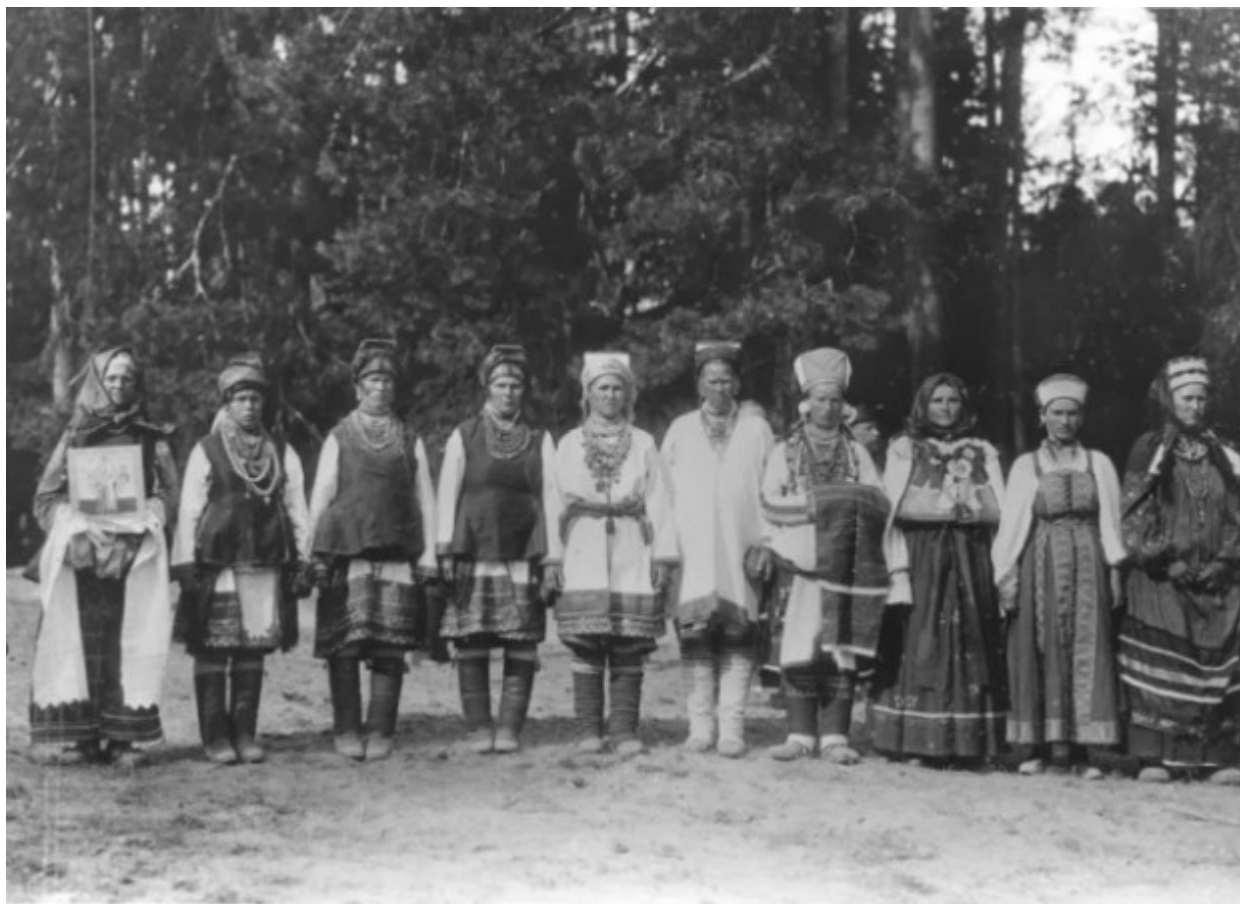
Η υποδοχή του Τσάρου από τους χωρικούς της Μορδοβίας.