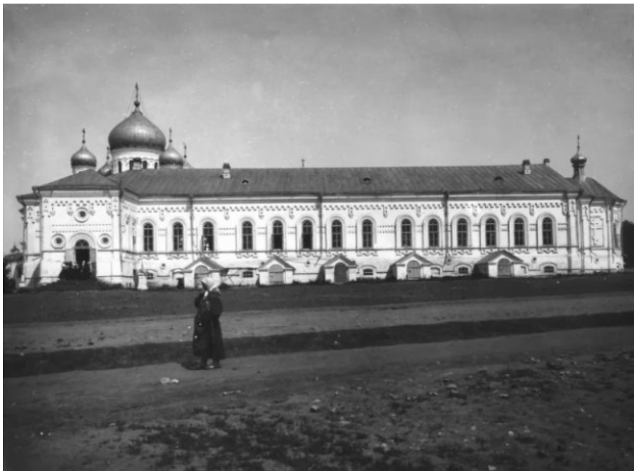
Το κτίριο της μοναστηριακής Τράπεζας.