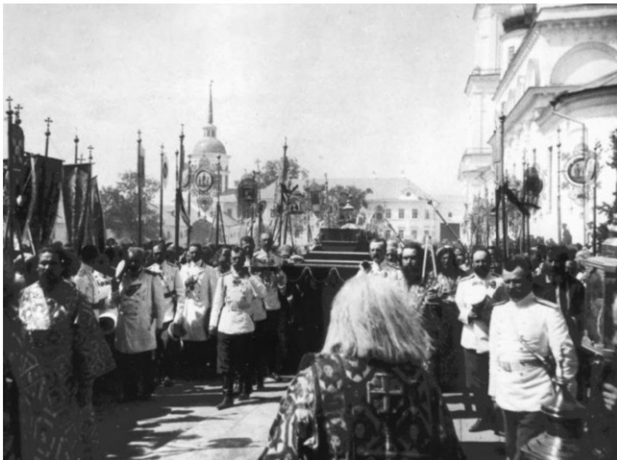
Ο Τσάρος Νικόλαος ο Β΄ με μέλη της οικογένειάς του μεταφέρουν τη λάρνακα με τα λείψανα του Οσίου Σεραφείμ του Σαρώφ.