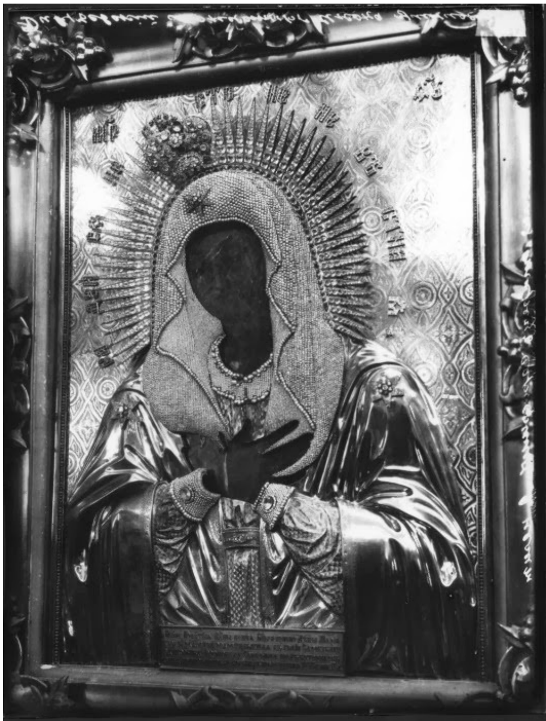
Η θαυματουργός εικόνα της Θεοτόκου Ουμιλένιε ή εικόνα "Ιδού η δούλη Κυρίου· γένοιτο κατά το ρήμα σου".