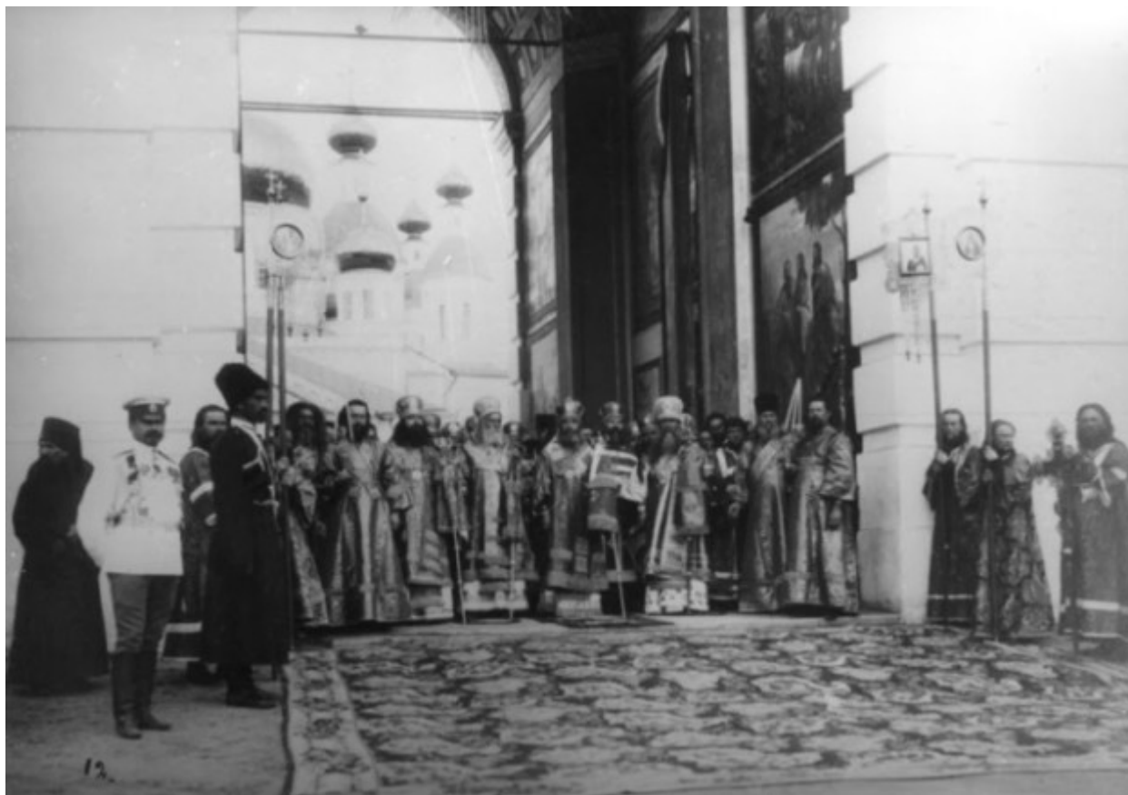
Η υποδοχή του Τσάρου από τον κλήρο της Ιεράς Μονής της Αγίας Τριάδος στο Ντιβέγιεβο.