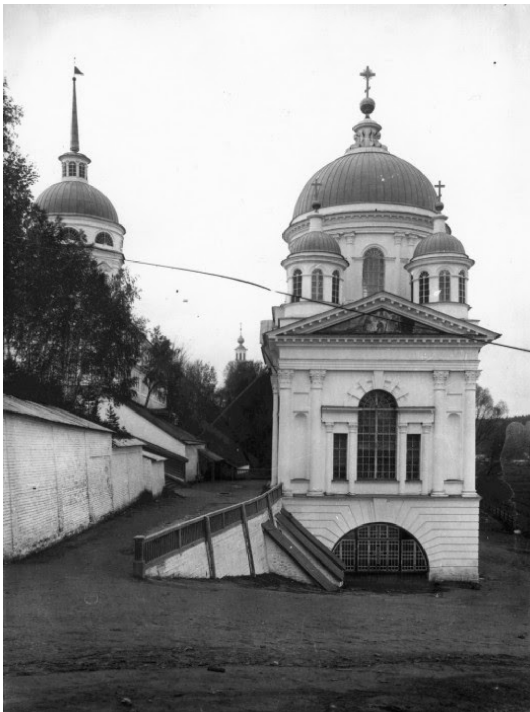
Ο Ιερός Ναός του Ιωάννου του Βαπτιστή πλησίον των πυλών της Ιεράς Μονής της Αγίας Τριάδος στο Ντιβέγιεβο.