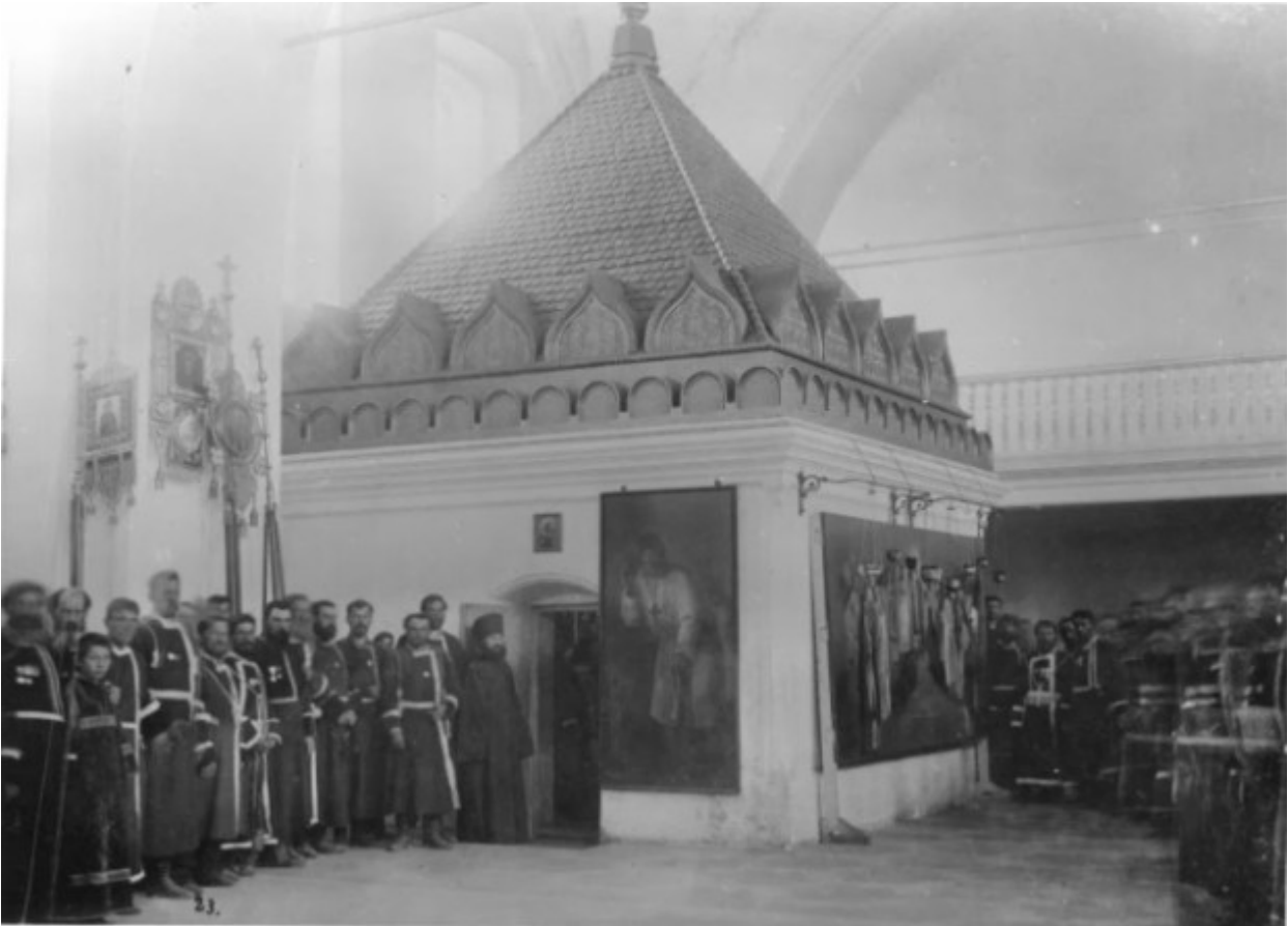
Το παρεκκλήσι που έχει χτιστεί στη θέση του κελλιού του Οσίου Σεραφείμ του Σαρώφ μέσα στον Ιερό Ναό της Αγίας Τριάδος.