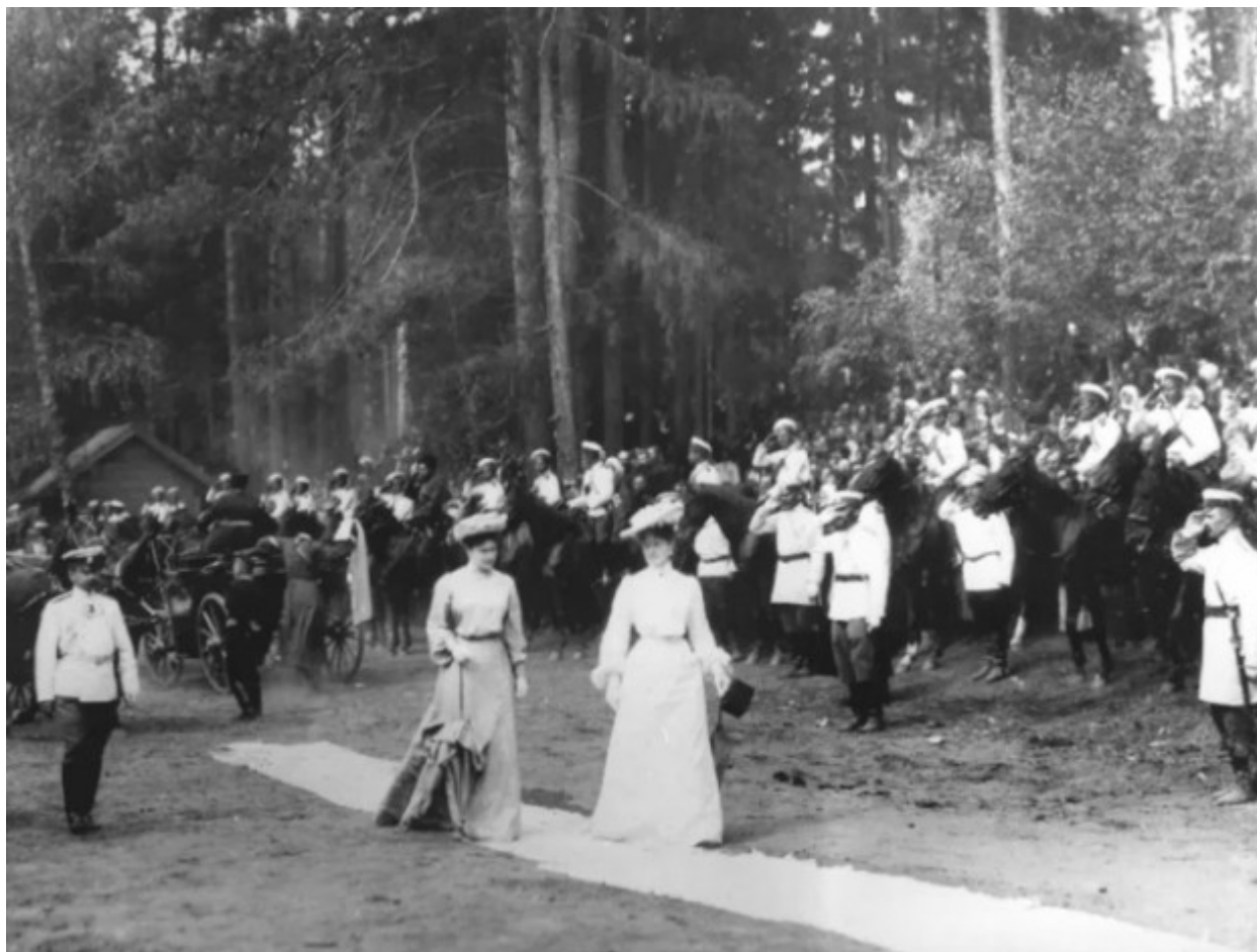
Η Τσαρίνα Αλεξάνδρα Φεοντόροβνα με την αδελφή της Μεγάλη Δούκισσα Φεοντόροβνα Ελισάβετ.