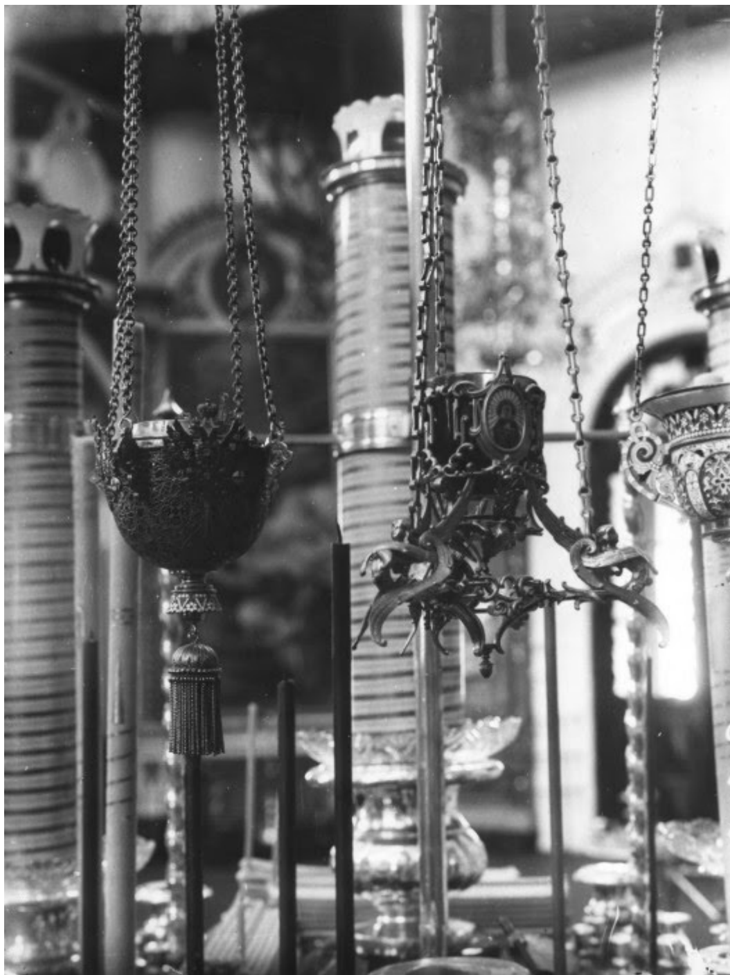
Λαμπάδες του τσάρου Νικόλαου Β΄ μπροστά στην εικόνα Θεοτόκος Ουμιλένιε.