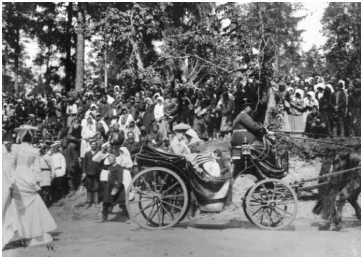
Η Τσαρίνα Αλεξάνδρα Φεοντόροβνα με την αδελφή της Μεγάλη Δούκισσα Φεοντόροβνα Ελισάβετ πηγαίνουν προς το αγίασμα του Οσίου Σεραφείμ του Σαρώφ.