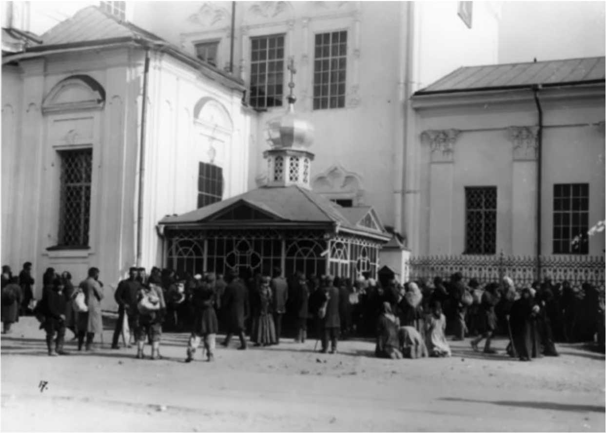
Στο παρεκκλήσι που έγινε πάνω από τον τάφο του Οσίου Σεραφείμ του Σαρώφ.