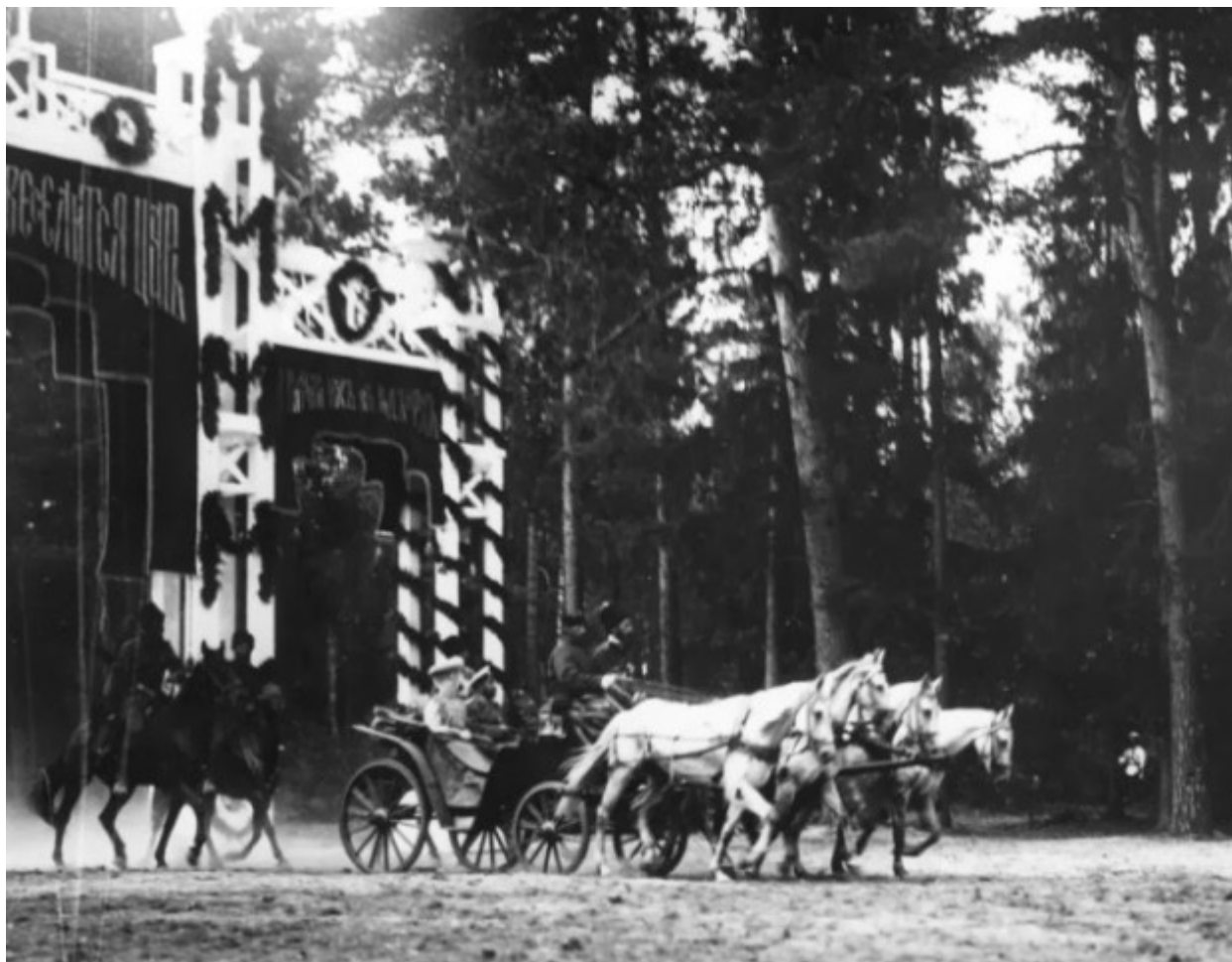
Η είσοδος της τσαρικής άμαξας στην Περιφέρεια Ταμπώφ.