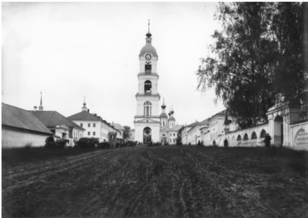
Το καμπαναριό της Ιεράς Μονής της Αγίας Τριάδος στο Ντιβέγιεβο.