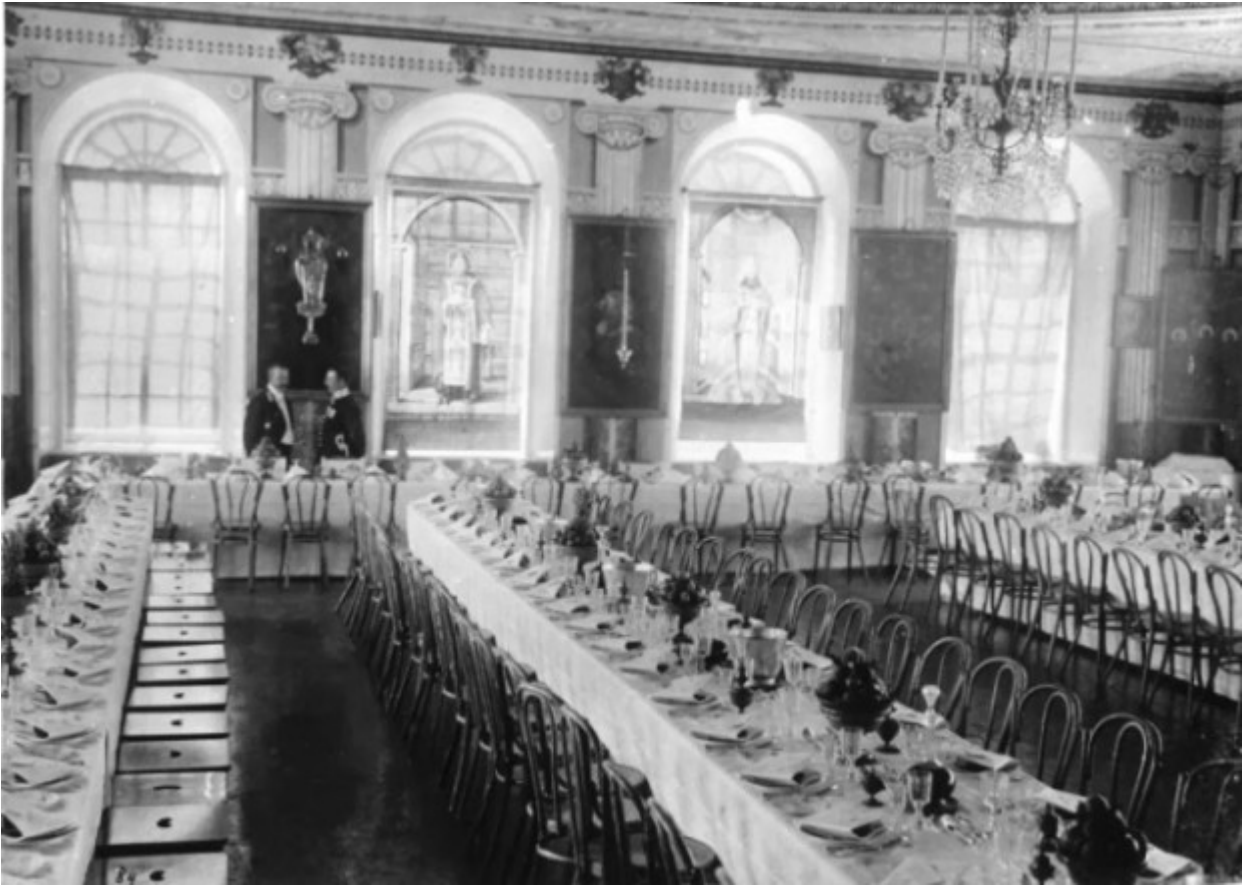
Εορταστική τράπεζα για τους προσκεκλημένους.