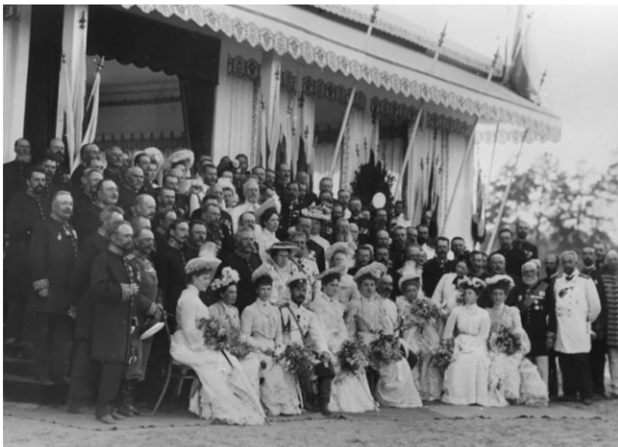
Με τους ευγενείς του Γκουβέρνου (: διοικητική διαίρεση της Τσαρικής Ρωσίας) Νίζεγκόραντ.