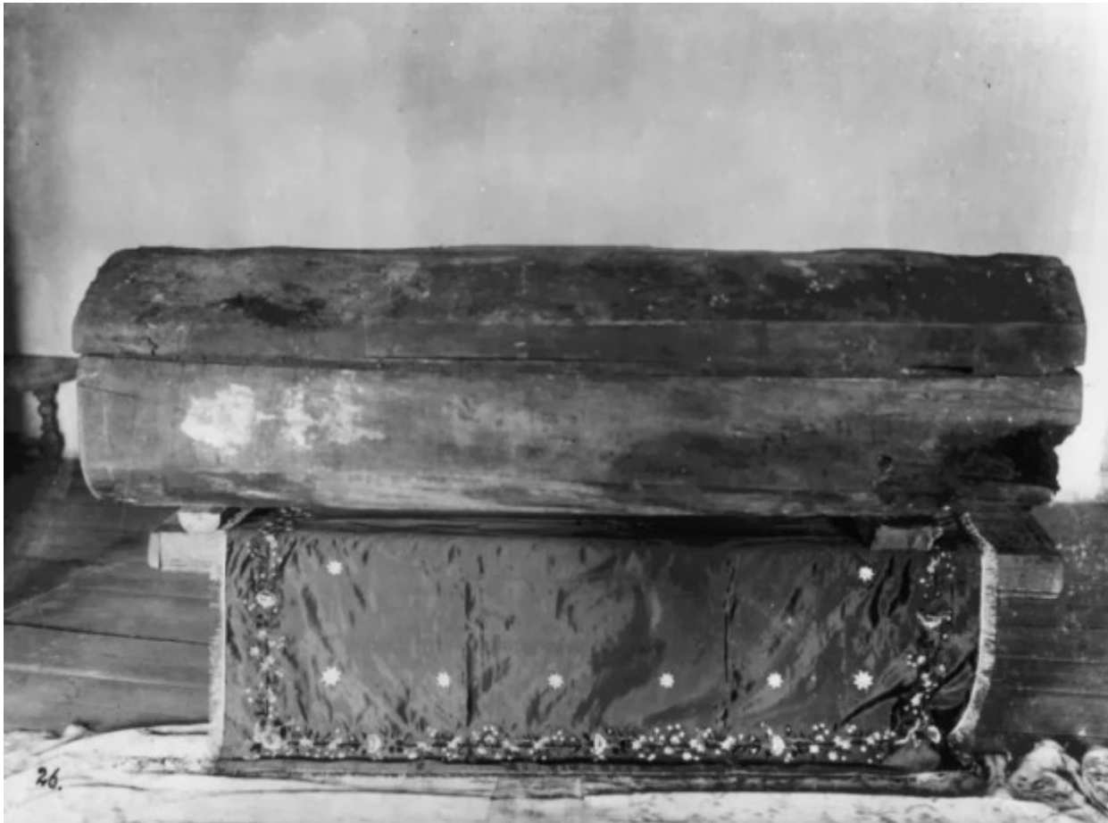
Το ξύλινο φέρετρο στο οποίο εναποτέθηκε ο Όσιος Σεραφείμ του Σαρώφ. Το φέρετρο λαξεύτηκε από τον ίδιο τον Όσιο.

Ορθοδοξία και Ορθοπραξία / Άγιοι - Πατέρες - Γέροντες / Ορθόδοξη πίστη