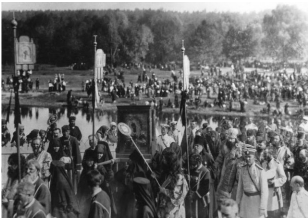
Λιτανεία με τη θαυματουργή εικόνα της Θεοτόκου Ουμιλένιε.