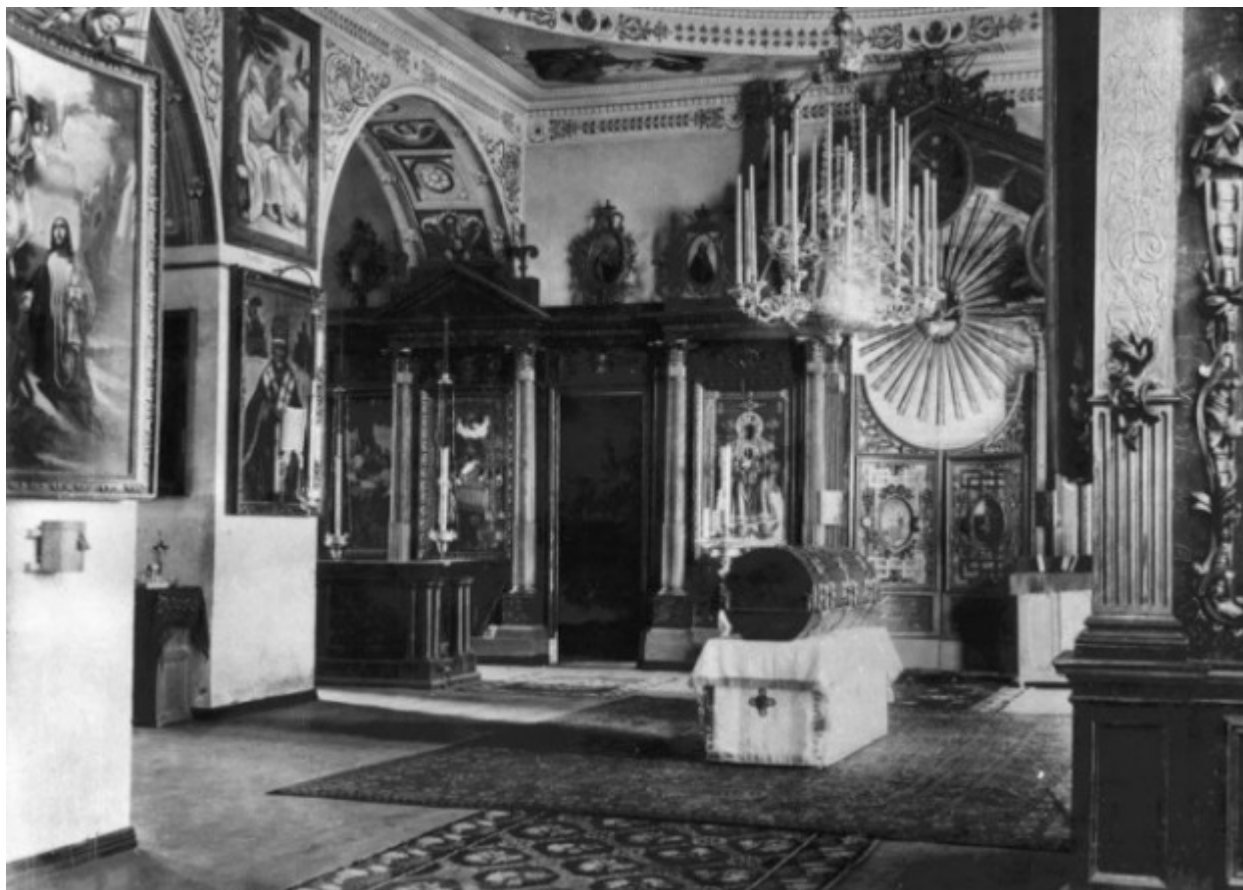
Η λάρνακα λειψανοθήκη με τα λείψανα του Οσίου Σεραφείμ του Σαρώφ.