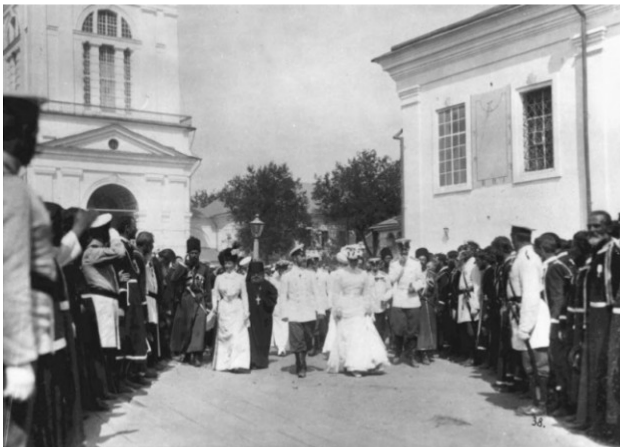
Η υποδοχή της τσαρικής οικογένειας από τον λαό.