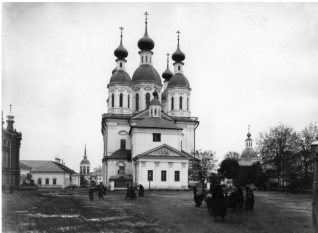
Ο Καθολικός Ναός της Ιεράς Μονής της Αγίας Τριάδος στο Ντιβέγιεβο. Είναι αφιερωμένος στην "Κοίμηση της Θεοτόκου". Φαίνεται μπροστά το παρεκκλήσι που έχει χτιστεί πάνω από τον τάφο του Οσίου Σεραφείμ του Σαρώφ.