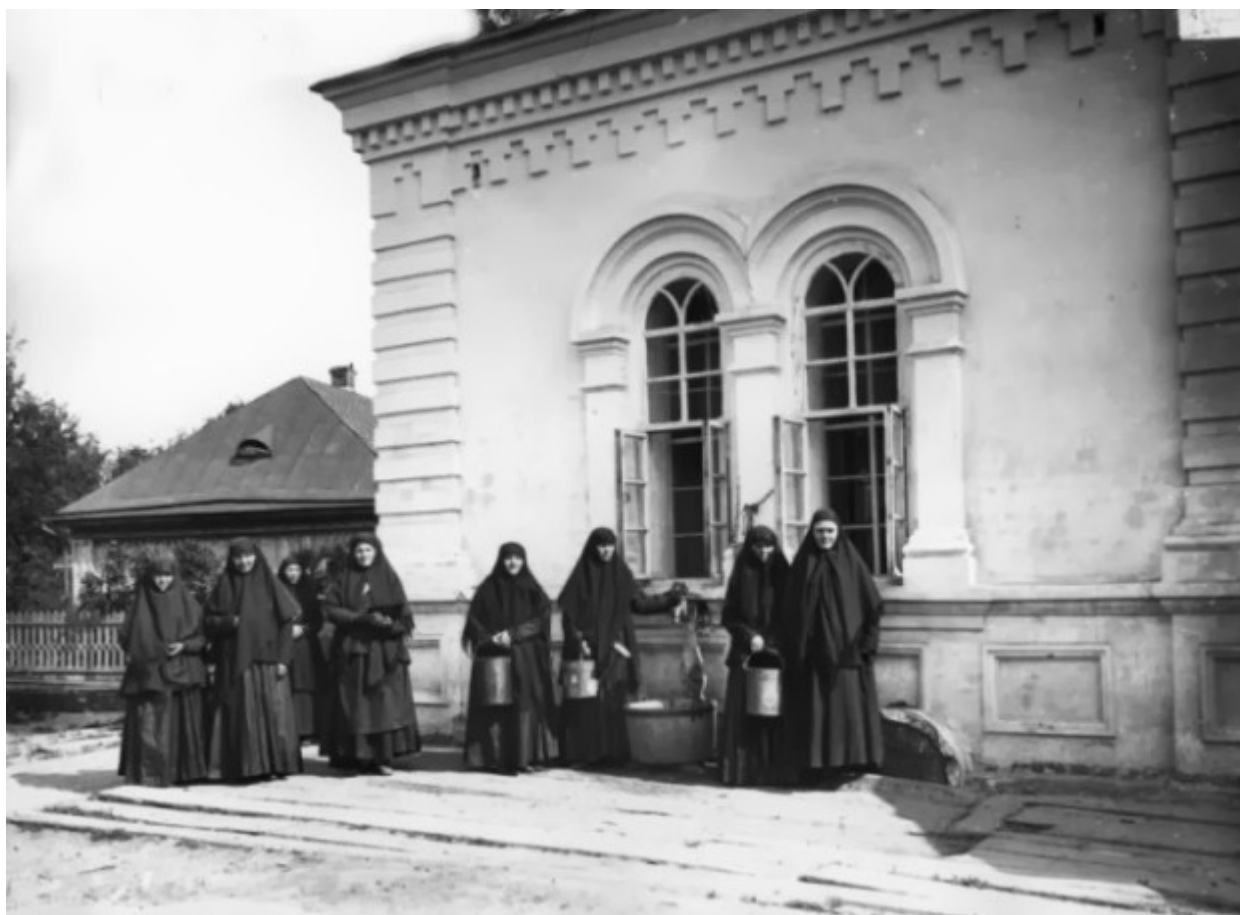
Αδελφές μοναχές στην υδραντλία της Ιεράς Μονής της Αγίας Τριάδος στο Ντιβέγιεβο.