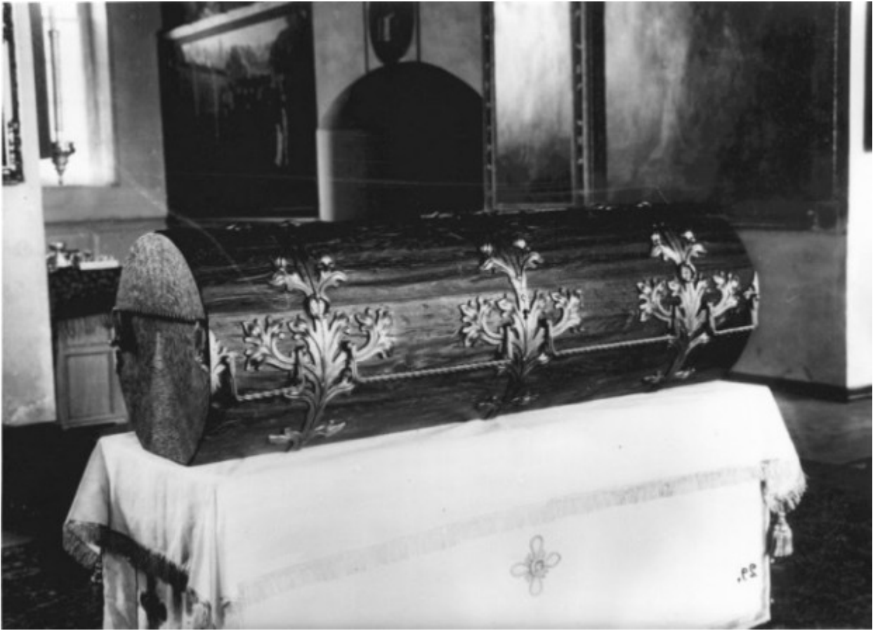
Η λάρνακα λειψανοθήκη με τα λείψανα του Οσίου Σεραφείμ του Σαρώφ.