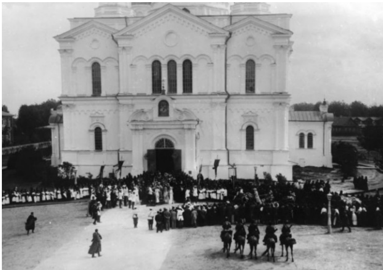
Η τσαρική οικογένεια στον Ιερό Ναό “Η Κοίμηση της Θεοτόκου”.