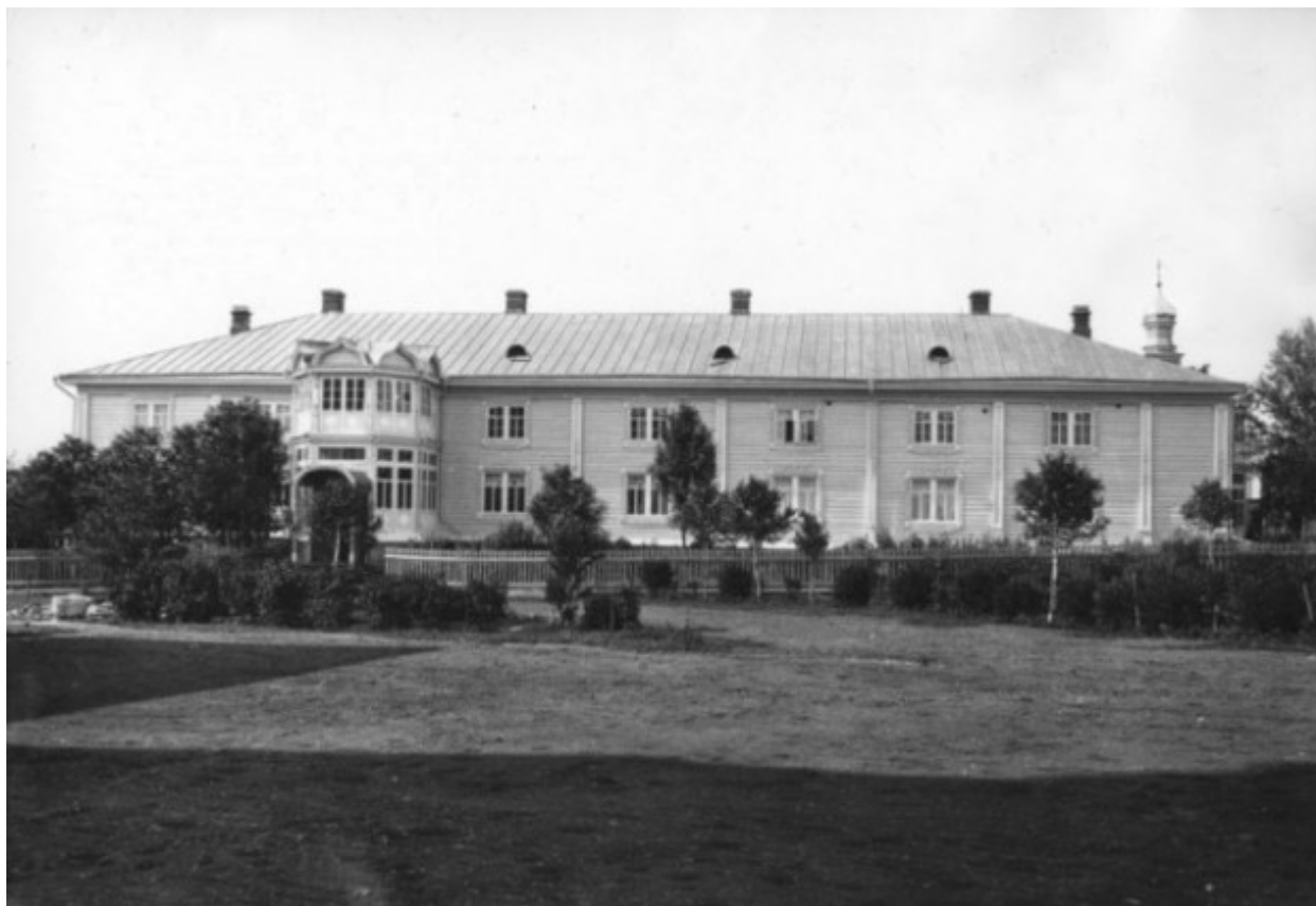
Το Ηγουμενείο της Ιεράς Μονής της Αγίας Τριάδος στο Ντιβέγιεβο.