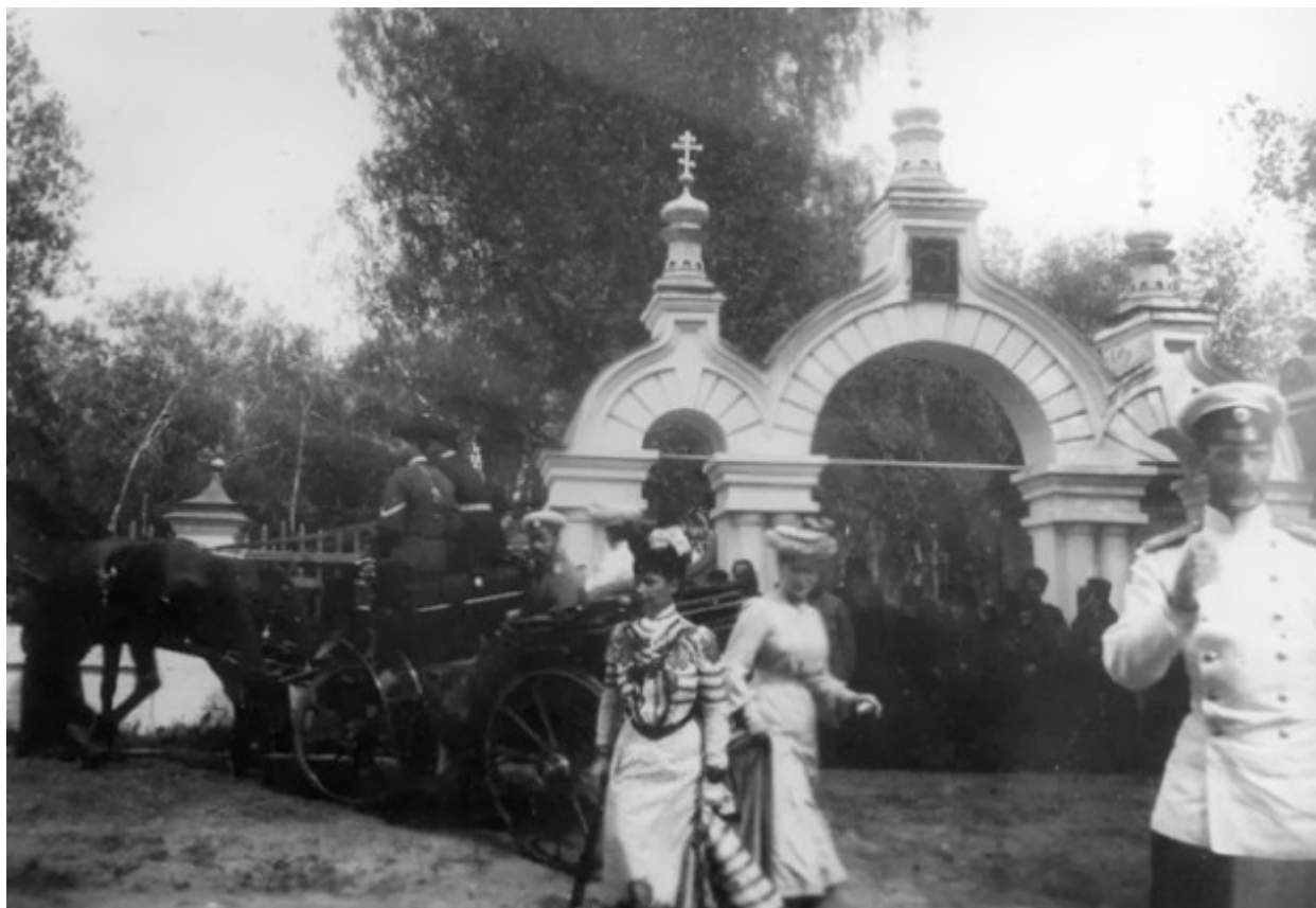
Στην πύλη του κοιμητηρίου της Ιεράς Μονής της Αγίας Τριάδος στο Ντιβέγιεβο.