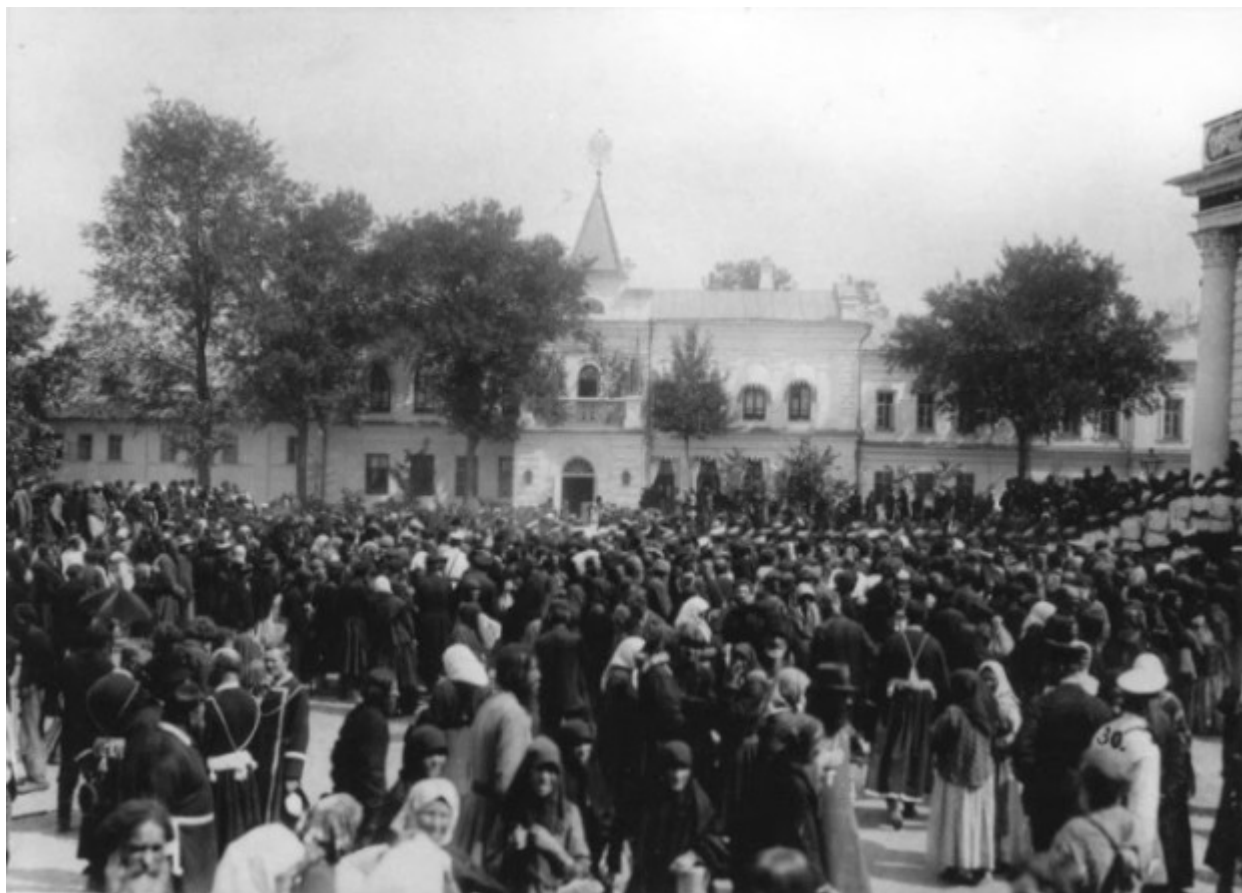
Προσκυνητές κατά τη διάρκεια της αγιοκατάταξης του Οσίου Σεραφείμ του Σαρώφ.