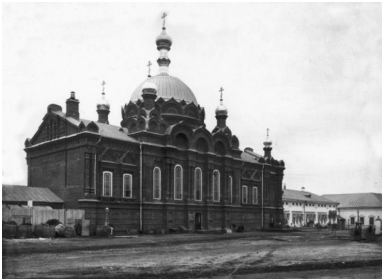
Ο Ιερός Ναός της Αγίας Τριάδος που έχει χτιστεί πάνω από το κελλί του Οσίου Σεραφείμ του Σαρώφ.