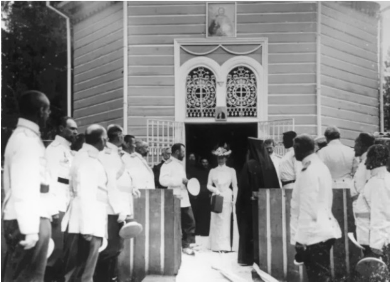
Η τσαρική οικογένεια αποχωρεί μετά την παράκληση στο αγίασμα του Οσίου Σεραφείμ του Σαρώφ.