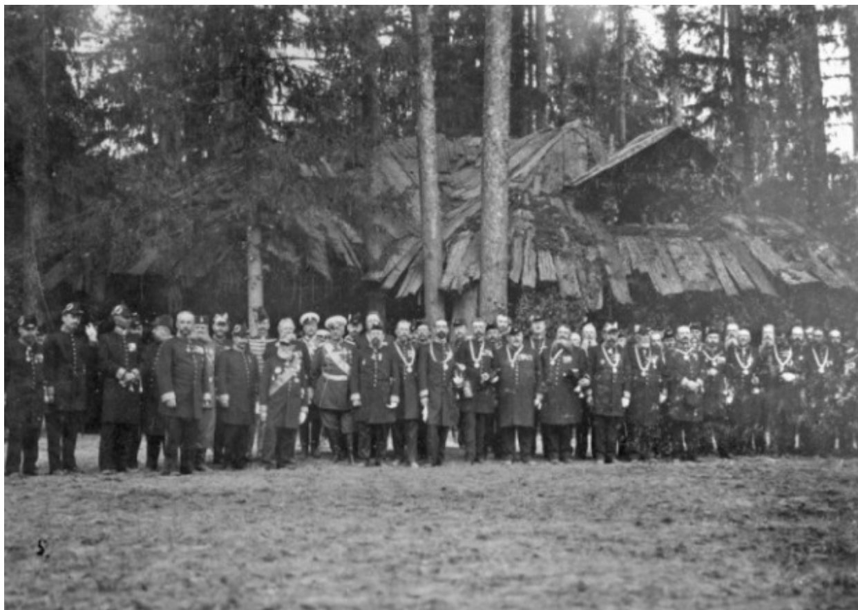
Η υποδοχή του Τσάρου από τους ευγενείς της Περιφέρειας Ταμπώφ.