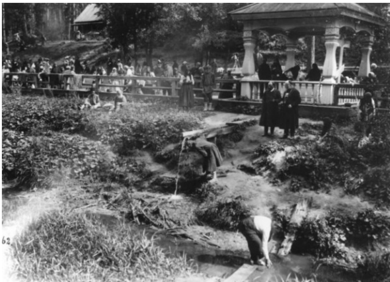
Στους υπαίθριους χώρους της Ιεράς Μονής της Αγίας Τριάδος στο Ντιβέγιεβο.