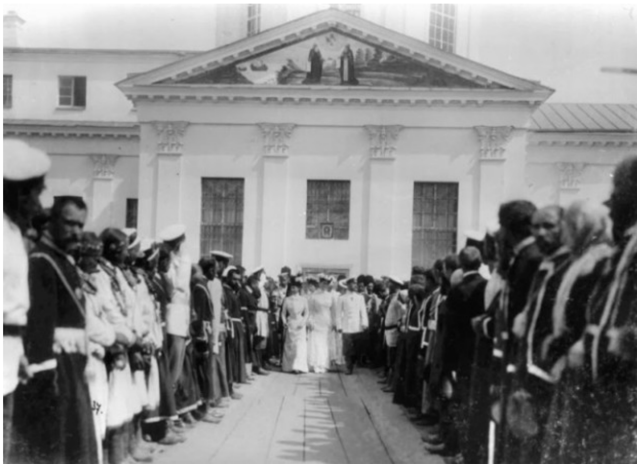
Η υποδοχή της τσαρικής οικογένειας από τον λαό.