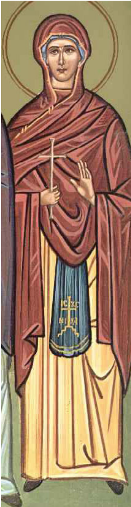
Αγία Αναστασία η Ρωμαία

ύψος δ' ανέδραμες, μαρτυρίου περίδοξον, εναθλήσασα, Αναστασία νομίμως, και τον δράκοντα, καταβαλούσα εις χάος, δυνάμει του Πνεύματος.