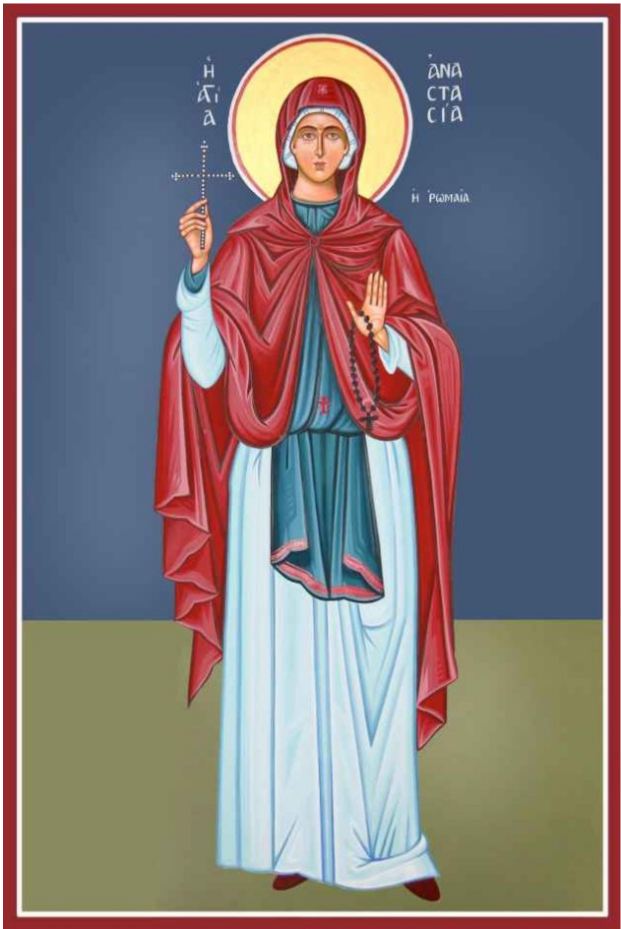
Αγία Αναστασία η Ρωμαία - Καζακίδου Μαρία© (byzantineartkazakidou. blogspot.com)