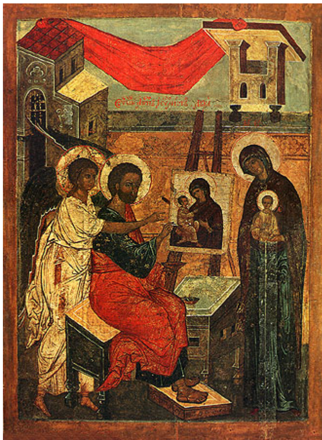
Άγιος Λουκάς ο Ευαγγελιστής