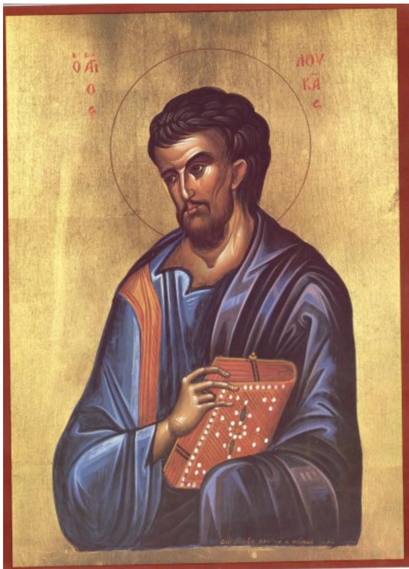
Άγιος Λουκάς ο Ευαγγελιστής