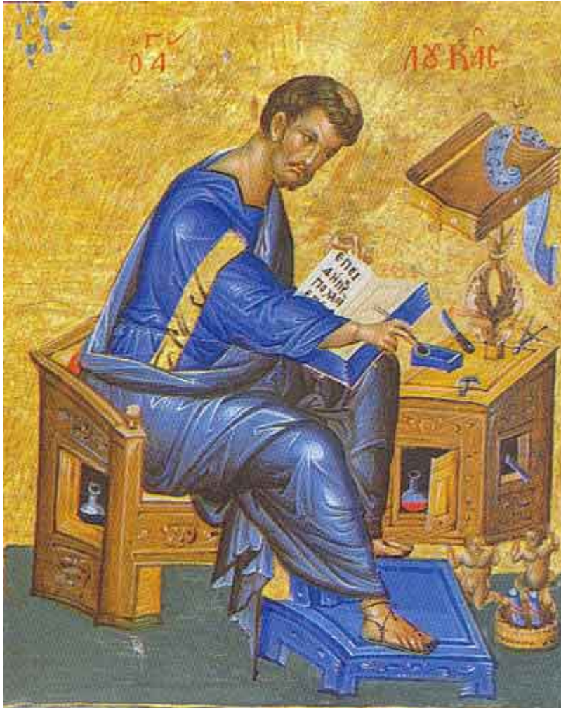
Άγιος Λουκάς ο Ευαγγελιστής

Ορθοδοξία και Ορθοπραξία / Συναξαριακές Μορφές