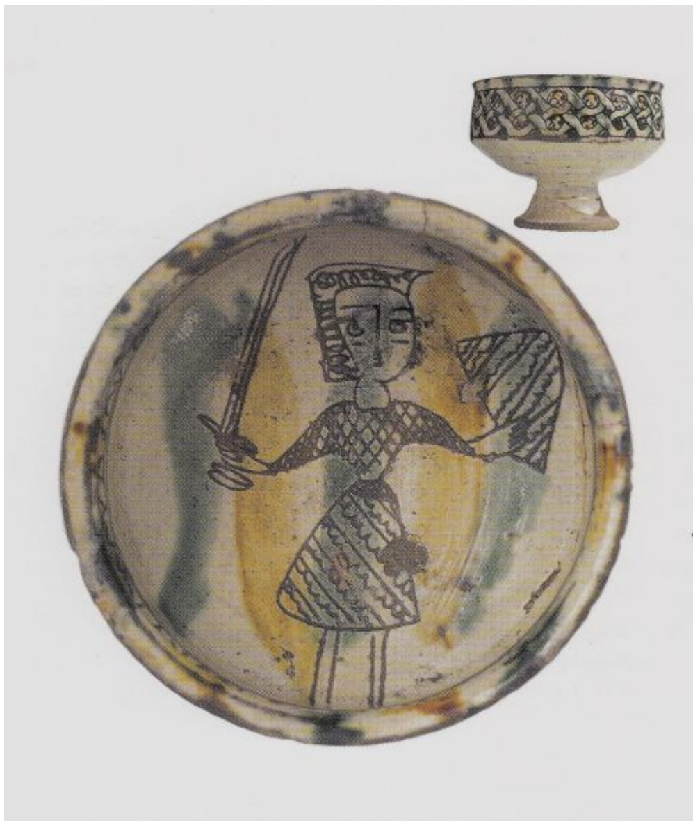
Φωτ: 3 Στο δεξί του χέρι κρατεί γεράκι, με το αριστερό χαιδεύει ένα άλλο όρνεο, ενώ ένα τρίτο βρίσκεται ανεβασμένο στο ώμο του. Στη εσωτερική επιφάνεια της κούπας η εφυάλωση είναι κίτρινη.

Στο δεξί του χέρι κρατεί γεράκι, με το αριστερό χαιδεύει ένα άλλο όρνεο, ενώ ένα τρίτο βρίσκεται ανεβασμένο στο ώμο του. Στη εσωτερική επιφάνεια της κούπας η εφυάλωση είναι κίτρινη.