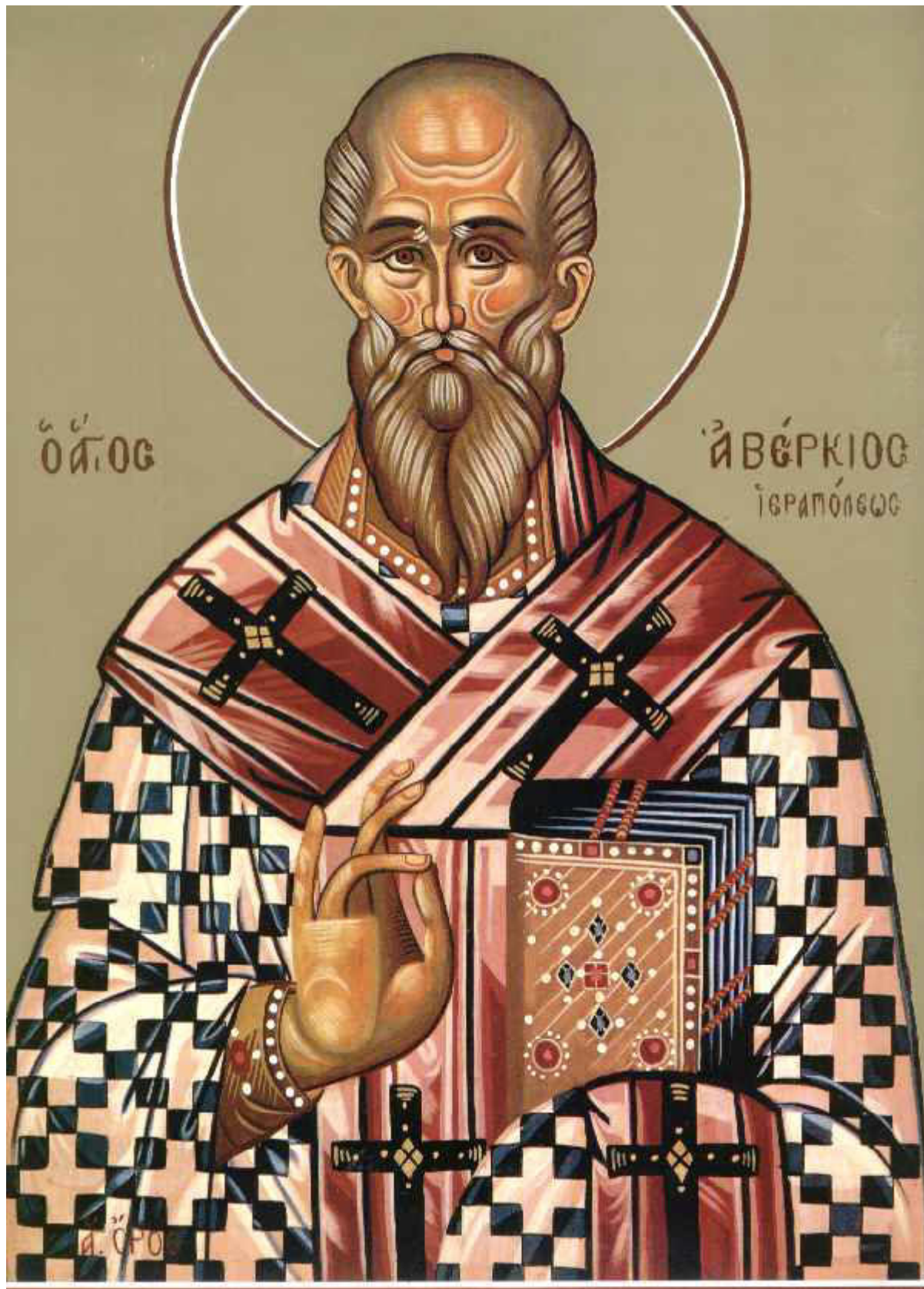
Όσιος Αβέρκιος ο Ισαπόστολος και θαυματουργός επίσκοπος Ιεράπολης