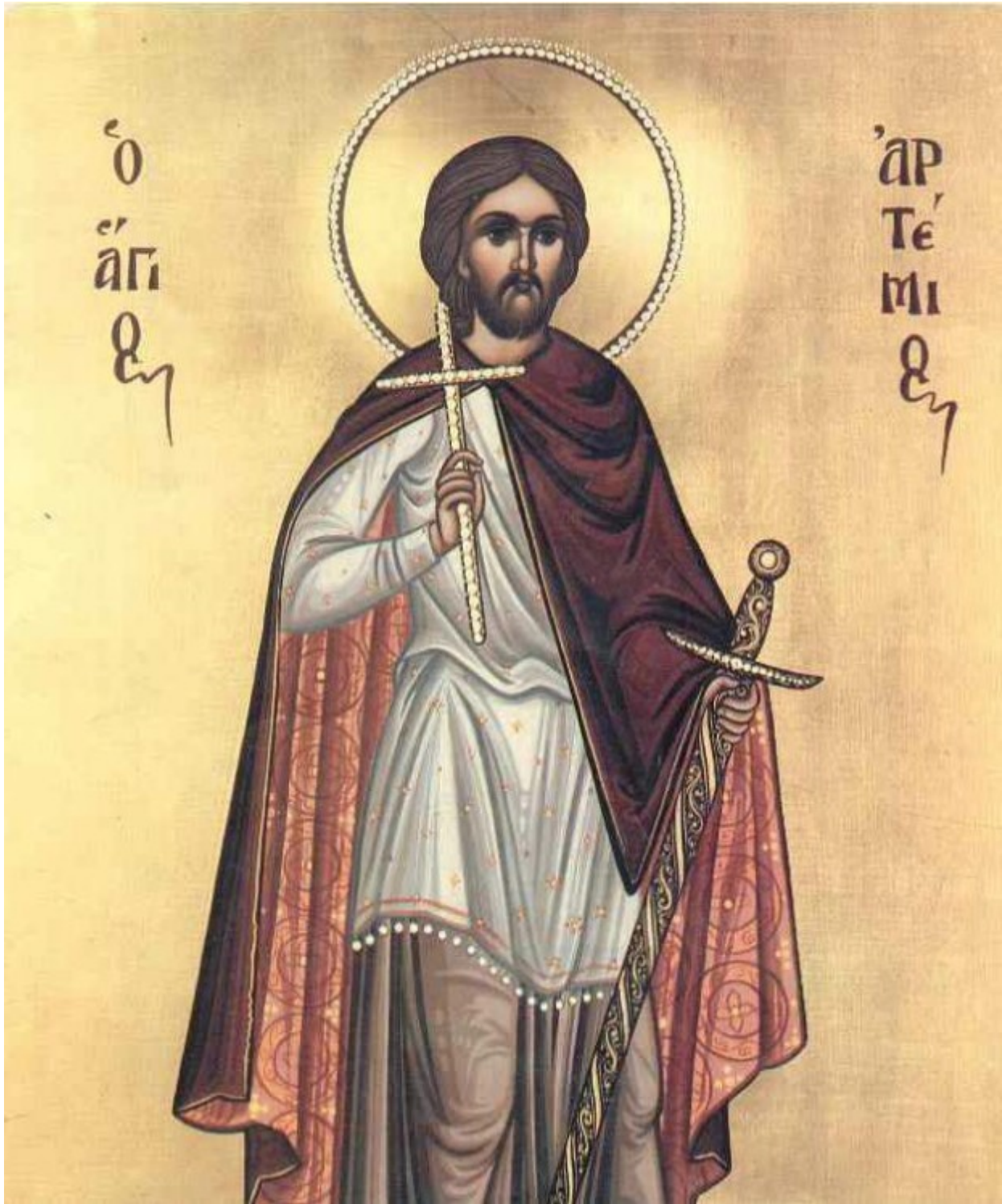
Ἅγιος Ἀρτεμῖος ὁ Μεγαλομάρτυρας