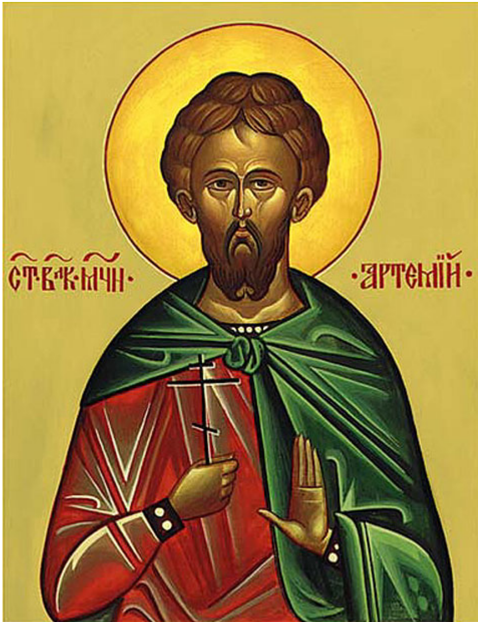
Άγιος Αρτεμίους ο Μεγαλομάρτυρας