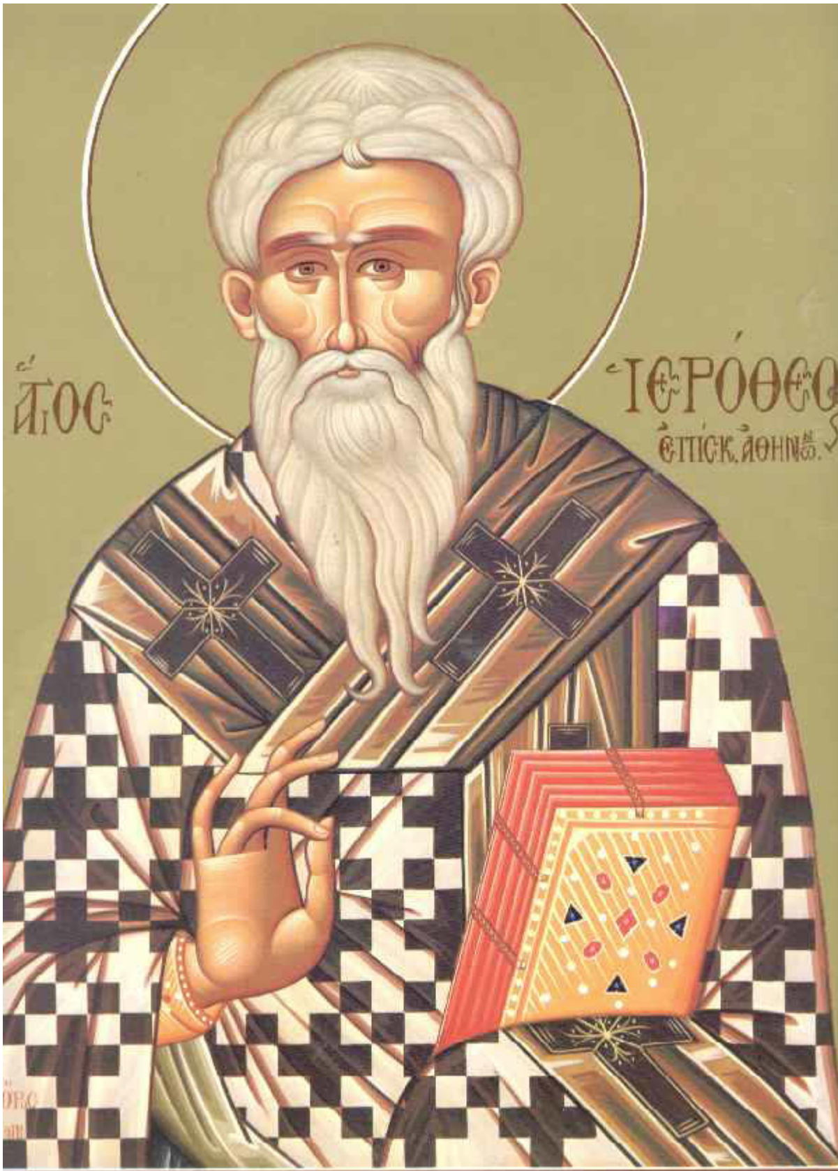
Άγιος Ιερόθεος Επίσκοπος Αθηνών