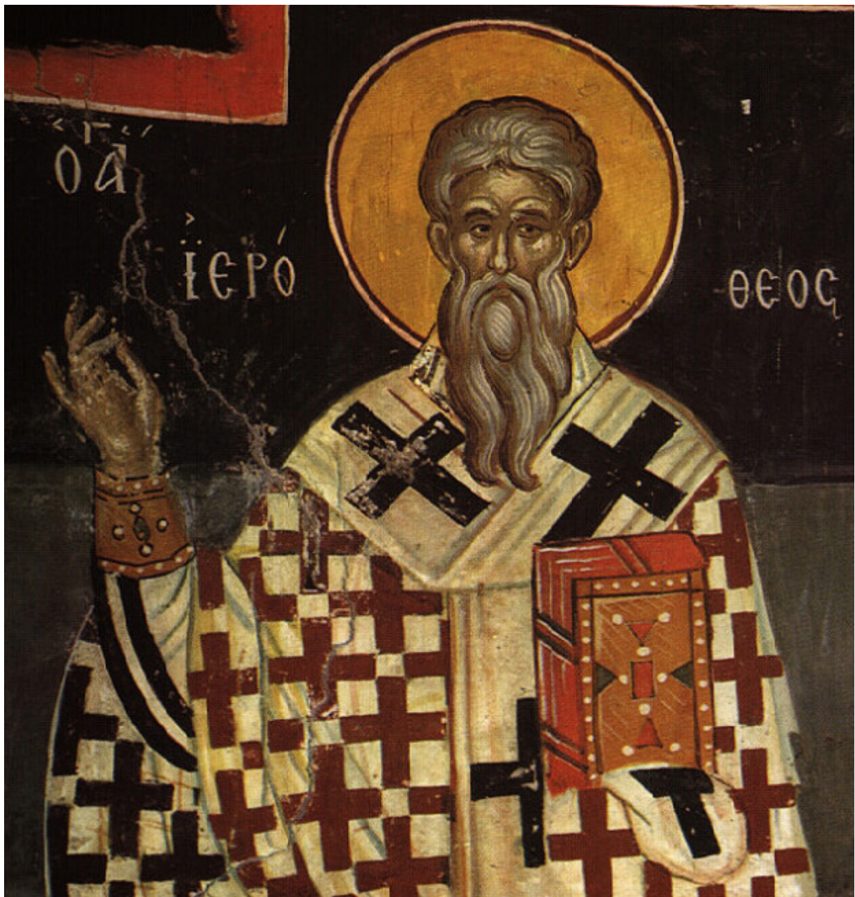
Άγιος Ιερόθεος Επίσκοπος Αθηνών