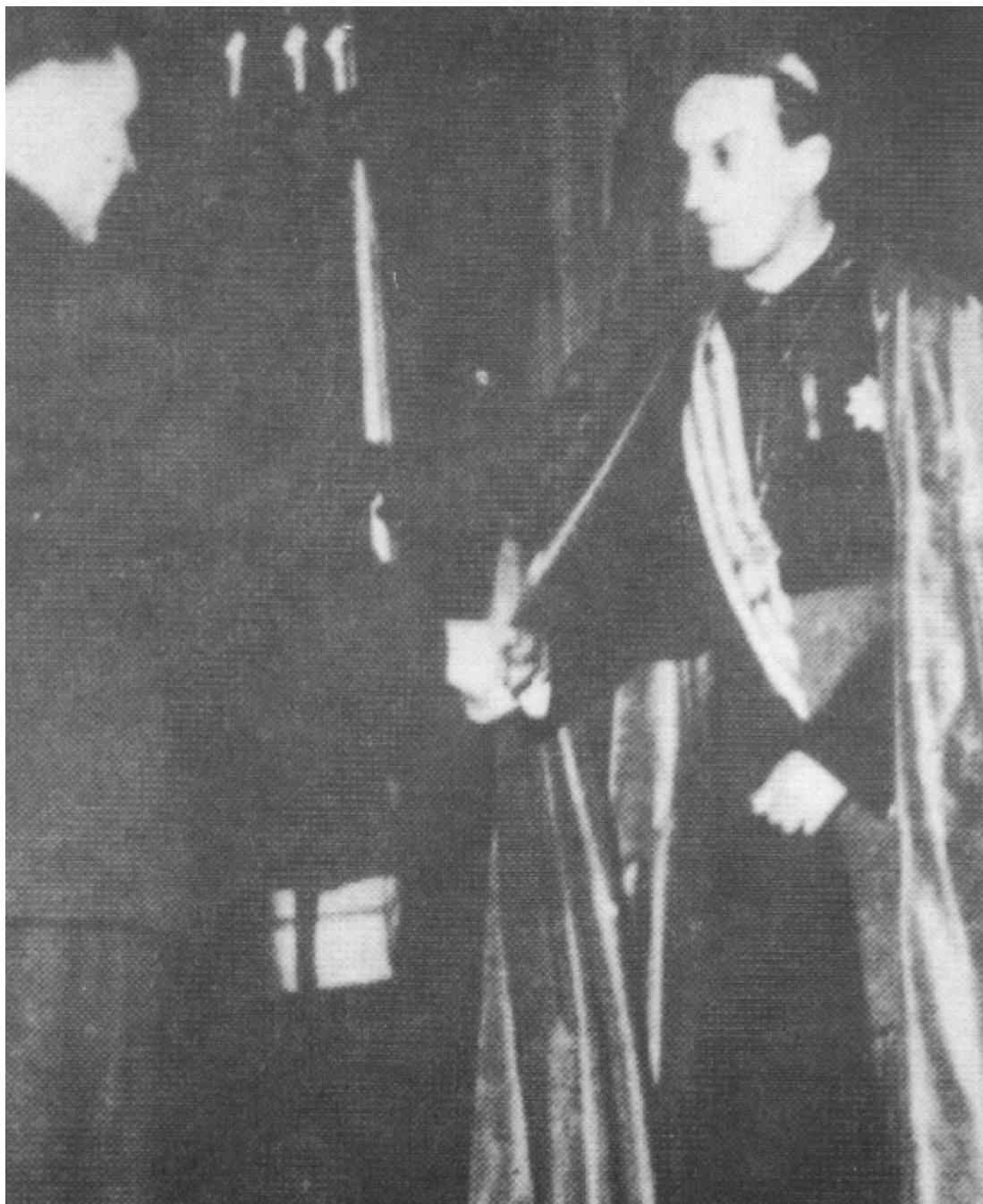
Ο καθολικός αρχιεπίσκοπος της Κροατίας παναγιότατος Στέπινατς χαιρετάει τον δικτάτορα των ούστασι Άντε Πάβελιτς εγγυούμενος την πλήρη συνεργασία και στήριξη της Καθολικής Εκκλησίας. Ζάγκρεμπ 16 Απριλίου 1941.

Στις 8 Φεβρουαρίου 1942 ο κροάτης πολιτικός Πρβόσλαβ Γκρίζογκονο, φανατικός καθολικός, πρώην υπουργός σε διάφορες κυβερνήσεις της Γιουγκοσλαβίας πριν από τον πόλεμο, στέλνει στον αρχιεπίσκοπο του Ζάγκρεμπ Αλόιζιγιε Στέπινατς την εξής επιστολή: