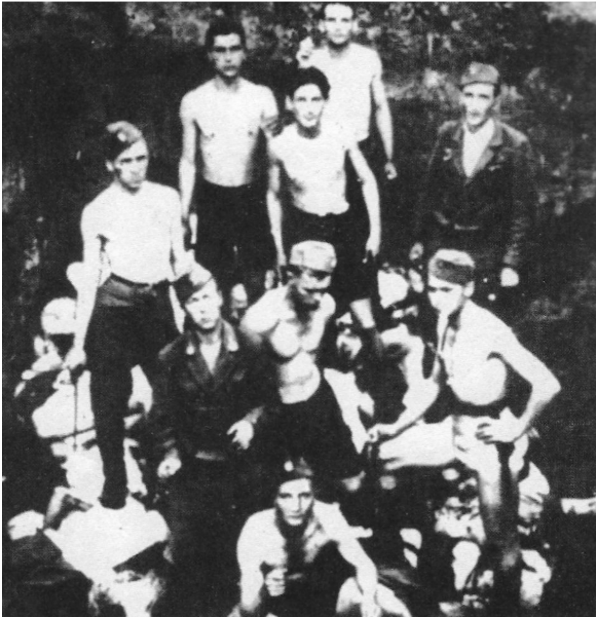
Αναμνηστική φωτογραφία των ούσταισι στο στρατόπεδο συγκέντρωσης του Γιασένοβατς στο εσωτερικό ενός ομαδικού τάφου και πάνω στον σωρό των πτωμάτων.

Σέρβοι δολοφονήθηκαν και εξοντώθηκαν στην Κροατία με τις πιο βίαιες μεθόδους. Οι ιδιοκτησίες τους, που εκτιμούνται σε πολλά δισεκατομμύρια δηνάρια, εκλάπησαν. Το κόκκινο χρώμα της ντροπής και της οργής καλύπτει το πρόσωπο όλων των έντιμων Κροατών.