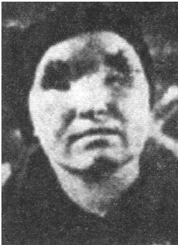
Σέρβα χωρική που της αφαίρεσαν τα μάτια για να στολίσουν τη συλλογή του δικτάτορα Άντε Πάβελιτς

Αυτά τα γεγονότα ντρόπιασαν το όνομα της Κροατίας για τους επόμενους αιώνες. Τίποτα δεν μπορεί να μας αθώσει από αυτά. Δεν θα είμαστε σε θέση να μιλήσουμε για το χιλιόχρονο πολιτισμό της Κροατίας ούτε στον τελευταίο κακομοίρη των Βαλκανίων, διότι ούτε οι Τσιγγάνοι δεν μπορούν να σχεδιάσουν τέτοιες ωμότητες.