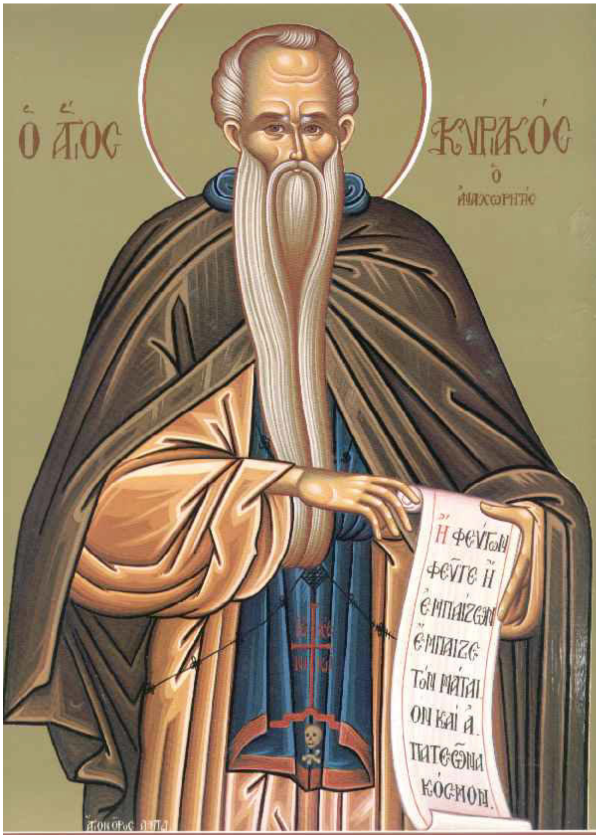
Όσιος Κυριακός ο Αναχωρητής