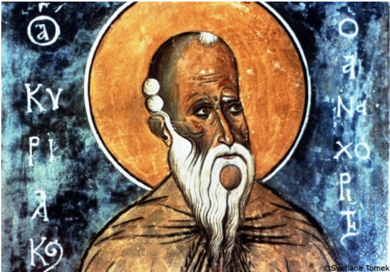
Όσιος Κυριακός ο Αναχωρητής