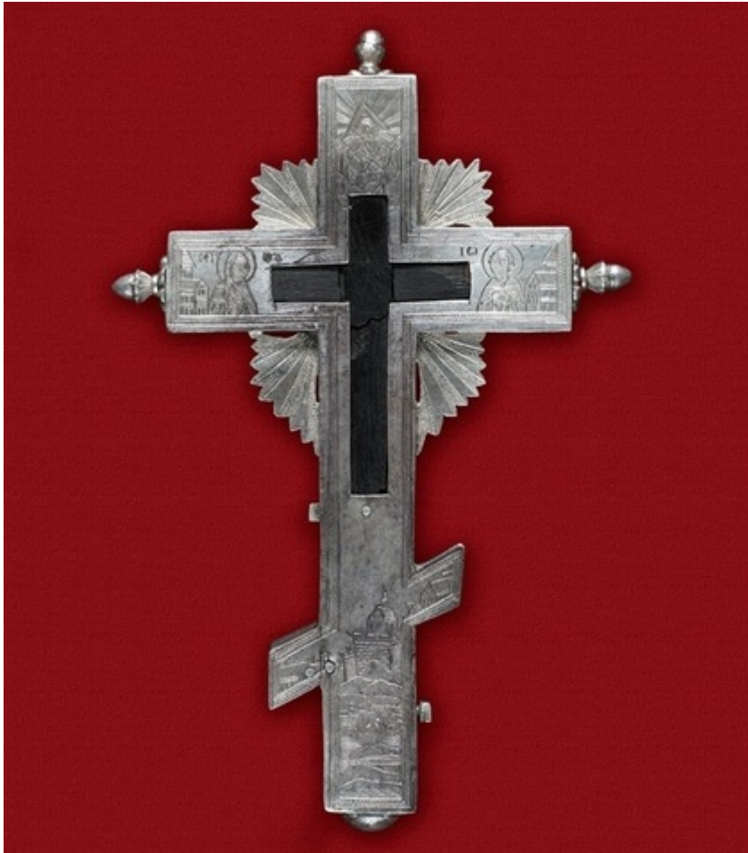
Τίμιο ξύλο από την Ιερά Μονή Σίμωνος Πέτρας Αγίου Όρους.