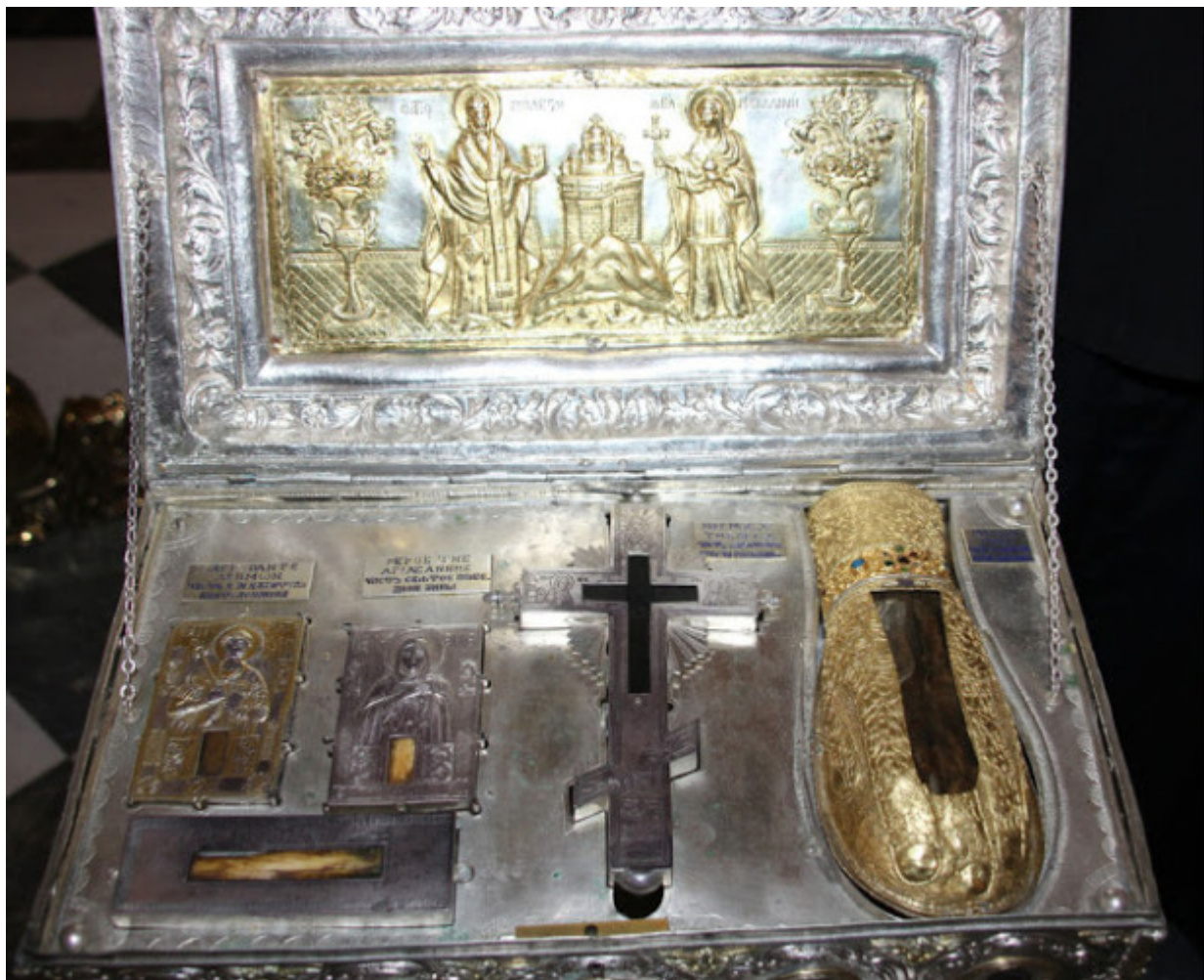
Λειψανοθήκη της Ιεράς Μονής Σίμωνος Πέτρας Αγίου Όρους που περιέχει τεμάχιο Τιμίου Ξύλου, το άφθαρτο χέρι της Αγίας Μυροφόρου και Ισαποστόλου Μαρίας της Μαγδαληνής, λείψανο της Αγίας Άννης, μητρός της Θεοτόκου και λείψανο του Αγίου Παντελεήμονος του Μεγαλομάρτυρος και Ιαματικού.