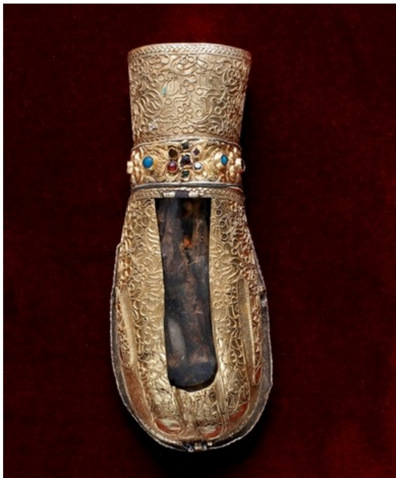
Το αριστερό χέρι της Αγίας Μυροφόρου και Ισαποστόλου Μαρίας της Μαγδαληνής.