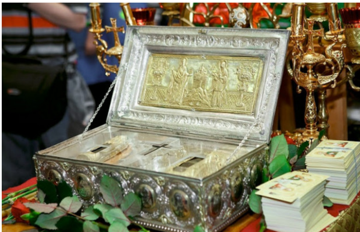
Λειψανοθήκη της Ιεράς Μονής Σίμωνος Πέτρας Αγίου Όρους που περιέχει τεμάχιο Τιμίου Ξύλου, το άφθαρτο χέρι της Αγίας Μυροφόρου και Ισαποστόλου Μαρίας της Μαγδαληνής και τη δεξιά χείρα της Αγίας Μεγαλομάρτυρος Βαρβάρας.