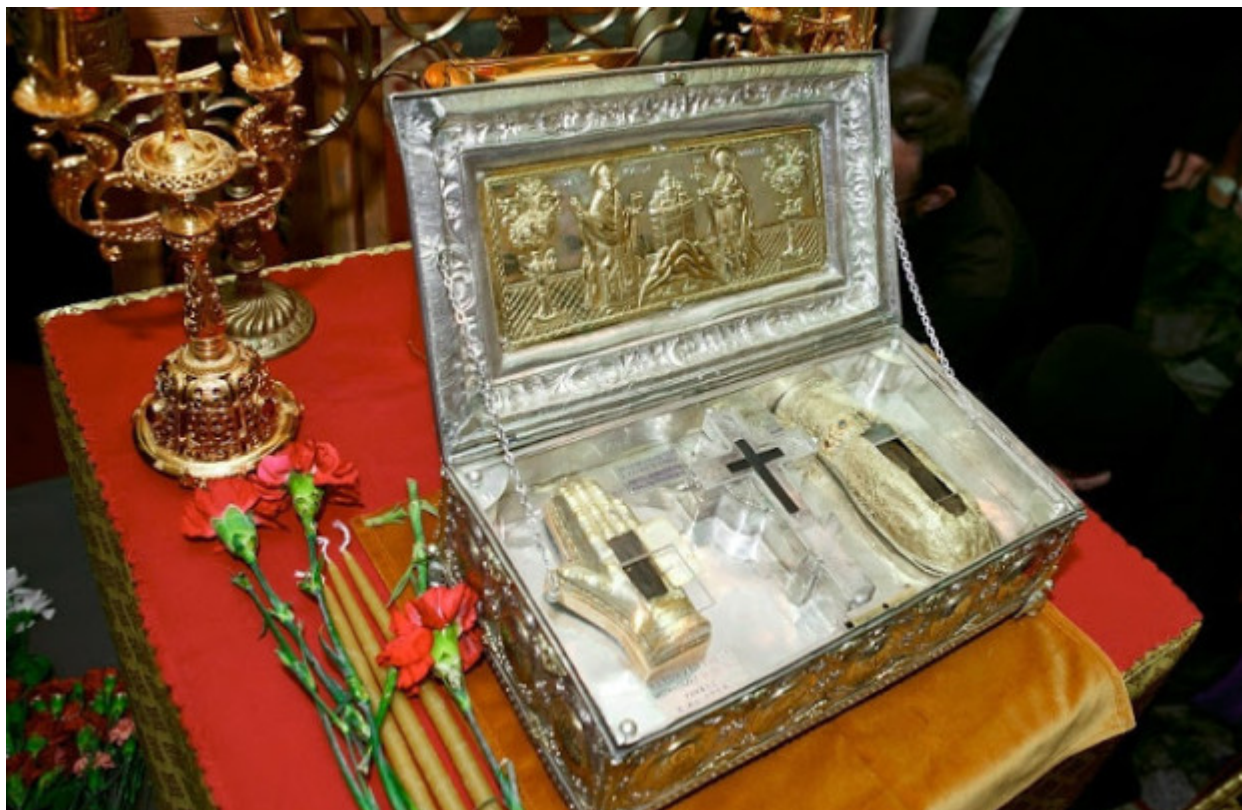
Λειψανοθήκη της Ιεράς Μονής Σίμωνος Πέτρας Αγίου Όρους που περιέχει τεμάχιο Τιμίου Ξύλου, το άφθαρτο χέρι της Αγίας Μυροφόρου και Ισαποστόλου Μαρίας της Μαγδαληνής και τη δεξιά χείρα της Αγίας Μεγαλομάρτυρος Βαρβάρας.