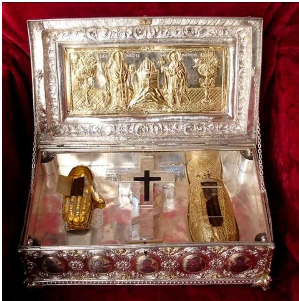
Λειψανοθήκη της Ιεράς Μονής Σίμωνος Πέτρας Αγίου Όρους που περιέχει τεμάχιο Τιμίου Ξύλου, το άφθαρτο χέρι της Αγίας Μυροφόρου και Ισαποστόλου Μαρίας της Μαγδαληνής και τη δεξιά χείρα της Αγίας Μεγαλομάρτυρος Βαρβάρας.