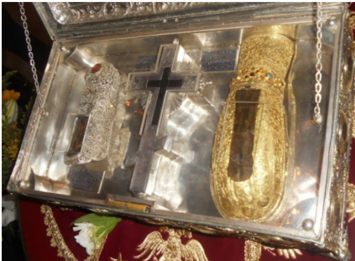
Λειψανοθήκη της Ιεράς Μονής Σίμωνος Πέτρας Αγίου Όρους που περιέχει τεμάχιο Τιμίου Ξύλου, το άφθαρτο χέρι της Αγίας Μυροφόρου και Ισαποστόλου Μαρίας της Μαγδαληνής και το ποδαράκι του τρίχρονου Αγίου Μάρτυρος Κηρύκου.