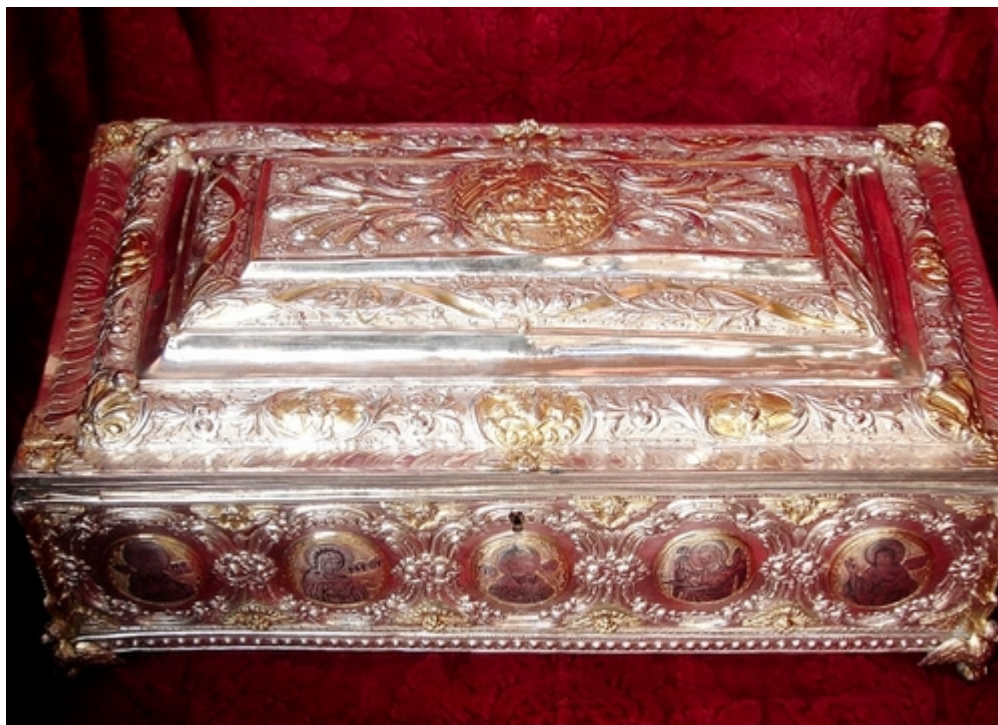
Μία από τις λειψανοθήκες της Ιεράς Μονής Σίμωνος Πέτρας Αγίου Όρους (δες την επόμενη φωτογραφία).