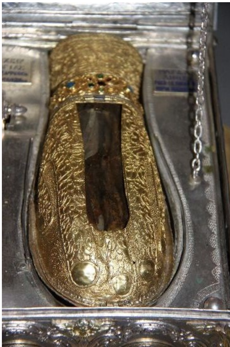
Το αριστερό χέρι της Αγίας Μυροφόρου και Ισαποστόλου Μαρίας της Μαγδαληνής.