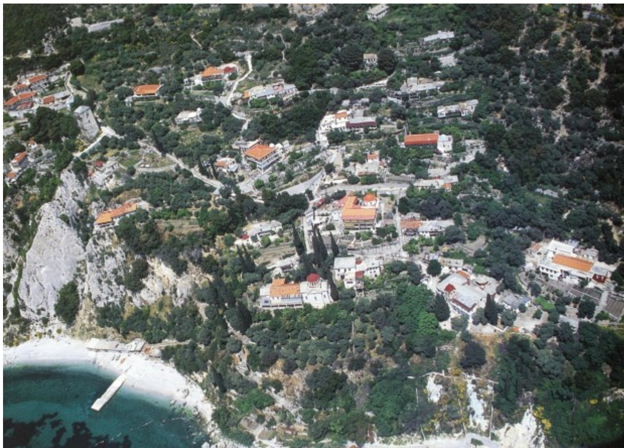
Πανοραμική άποψη της Νέας Σκήτης, η οποία διοικητικά υπάγεται στην Ιερά Μονή Αγίου Παύλου.

χάριτι με σαγήνεψαν ώστε έκτοτε να παραμείνω μαζί τους μέχρι της οσίας τελευτής τους.