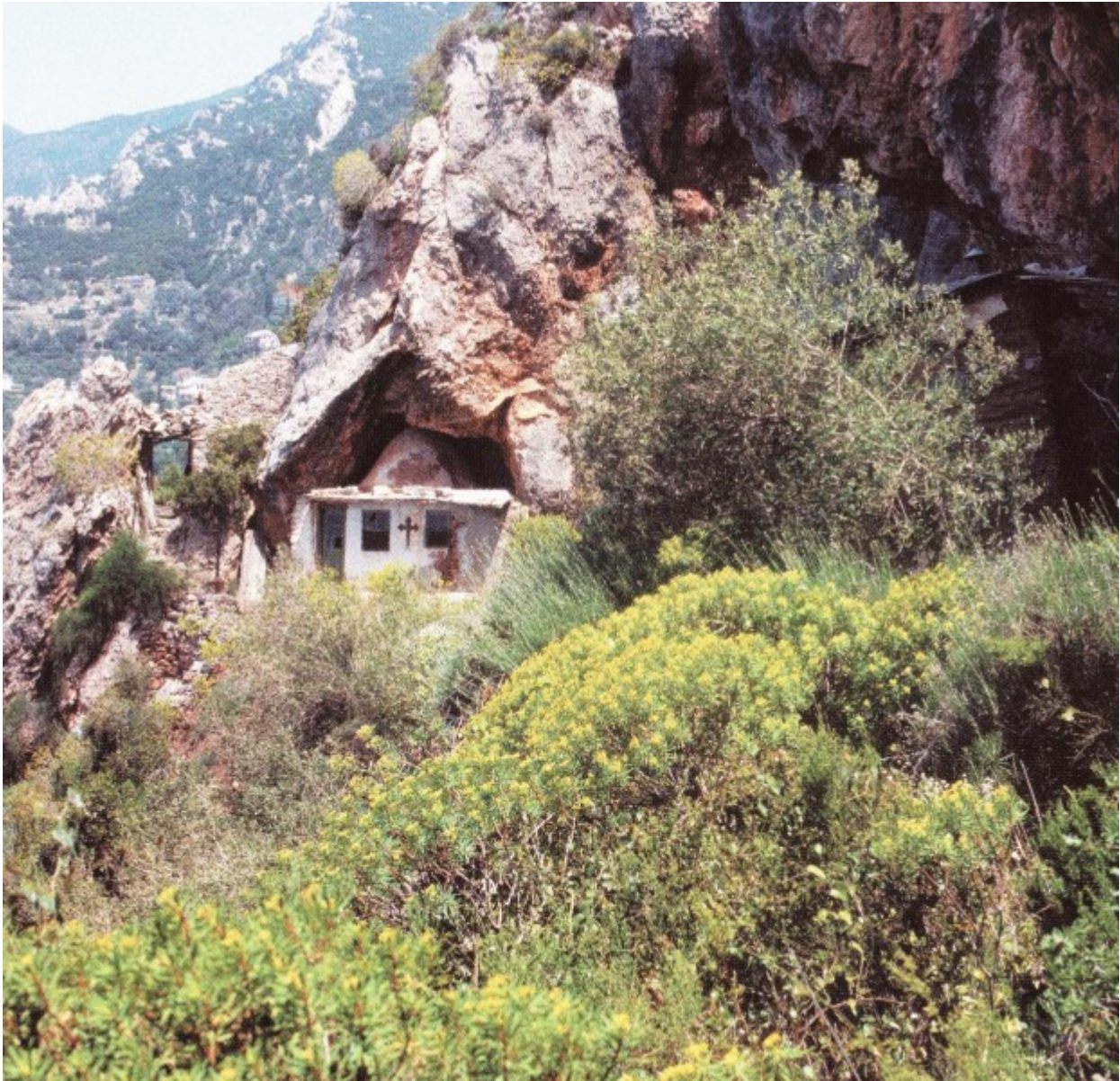
Ο Ιερός Ναός του Τιμίου Προδρόμου στην σπηλιές της Μικράς Αγίας Άννας.

δέρμασιν, υστερούμενοι, κακουχούμενοι, ὧν οὐκ ἦν ἄξιος ὁ κόσμος· ἐν ἐρημίαις πλανώμενοι καὶ ὄρεσι καὶ σπηλαίοις καὶ ταῖς ὀπαῖς τῆς γῆς (Εβρ. ια΄ 37-38).