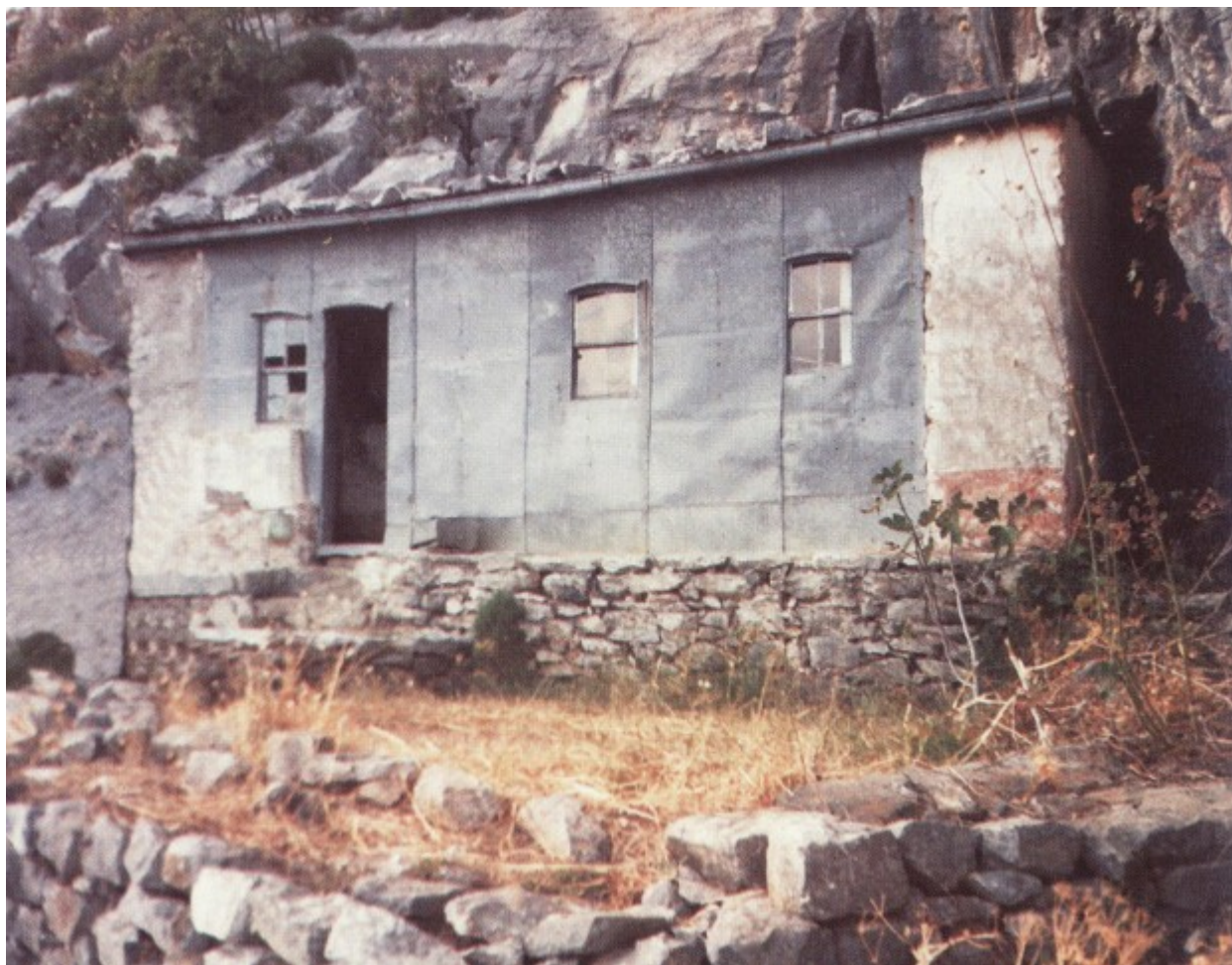
Ο Ιερός Ναός του Τιμίου Προδρόμου στην Σκήτη του Αγίου Βασιλείου.

Πέραν αυτών ο Γερο-Αρσένιος επεμελείτο και τις χειρονακτικές εργασίες. Ζώντας τα πρώτα χρόνια εκεί ψηλά στα βράχια του Αγίου Βασιλείου, ανεβοκατέβαινε 1-2 ώρες απότομο ανήφορο ανεβάζοντας προμήθειες όχι μόνο για τους εαυτούς τους αλλά και για όλους τους ασκητές. Κουβαλούσε στους ώμους πέτρες και διάφορα υλικά για την συντήρηση και επισκευή των λιθόκτιστων καλύβων και πεζουλιών.