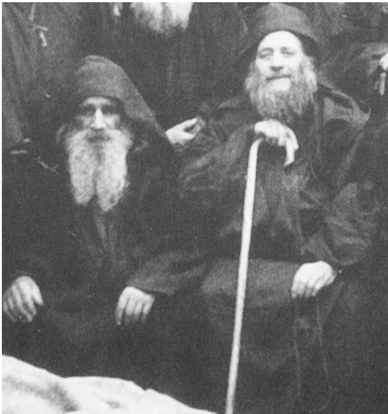
Ο μακάριοι Γέροντες Αρσένιος (αριστερά) και Ιωσήφ (δεξιά) οι Σπηλαιώτες και Ησυχαστές, οι για σαράντα χρόνια αχώριστοι συνασκητές. Λεπτομέρεια μεγαλύτερης φωτογραφίας.

Οι δύο αυτοί νέοι έκτοτε ωσάν μέλισσες μάζεψαν ότι το πιο εκλεκτό είχε τότε η έρημος του Αγίου Όρους προκειμένου να τρυγήσουν τους γλυκύτετους καρπούς του Αγίου Πνεύματος.