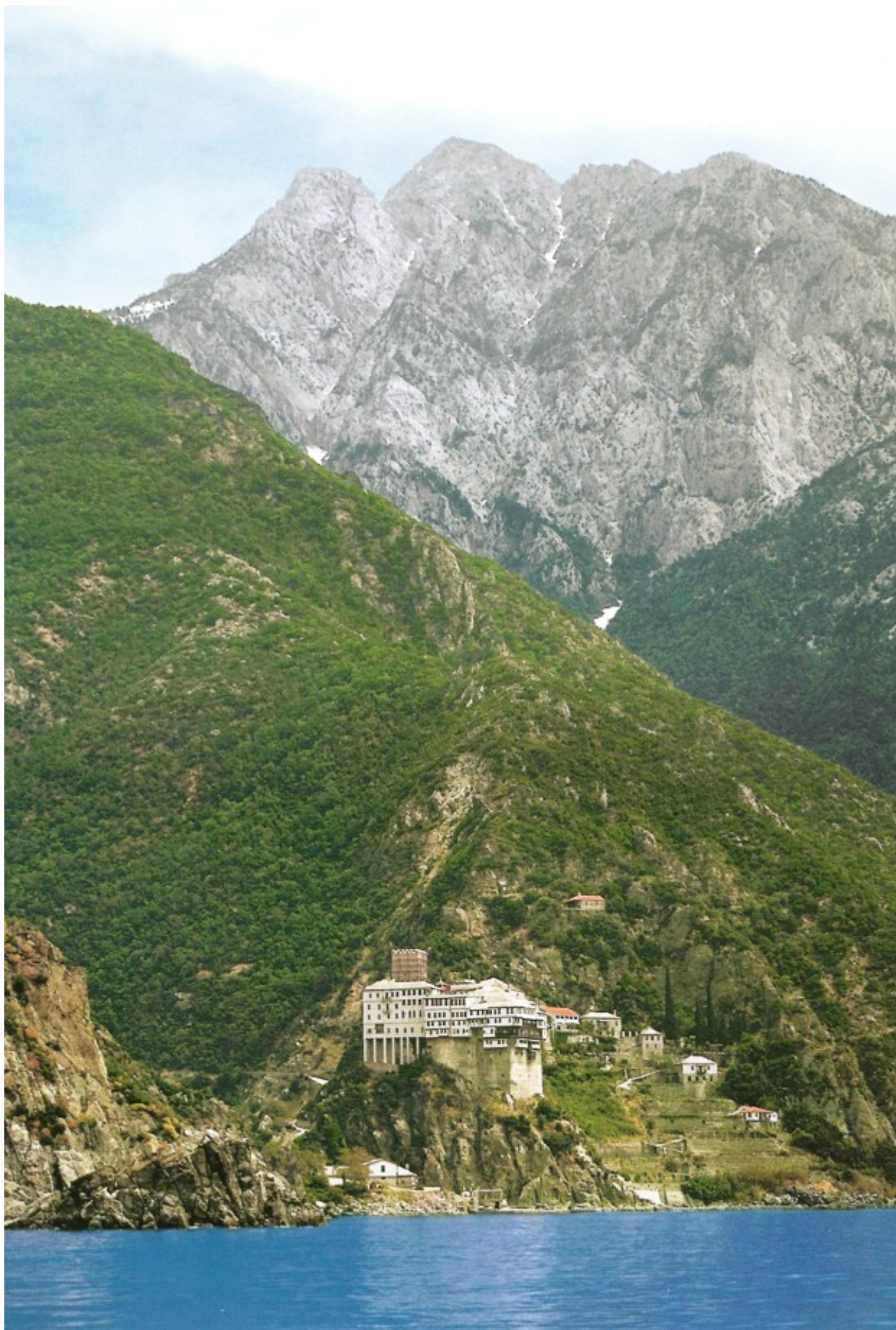
Η Ιερά Μονή Αγίου Διονυσίου, Αγίου Όρους.